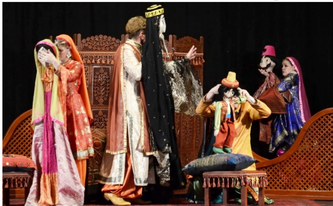
A Pegazus egyik sajátossága, hogy a bábok és az azokat mozgató színészek egyaránt a színpadon vannak