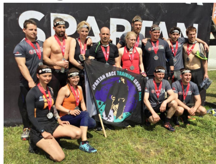
Az egyesített ajkai csapat a Spartan Race-en