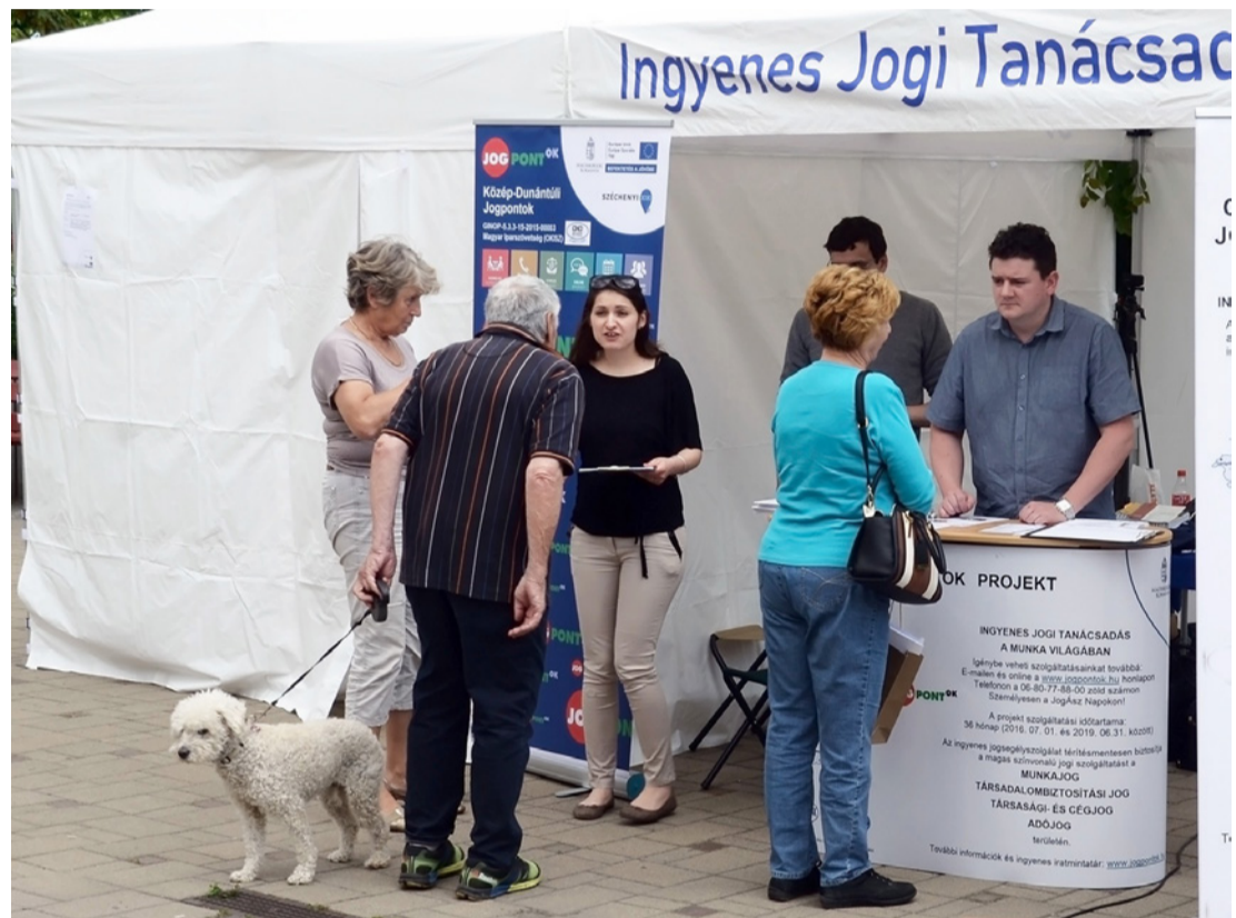
Több tucatnyian látogatták meg a sátrat és kértek tanácsot