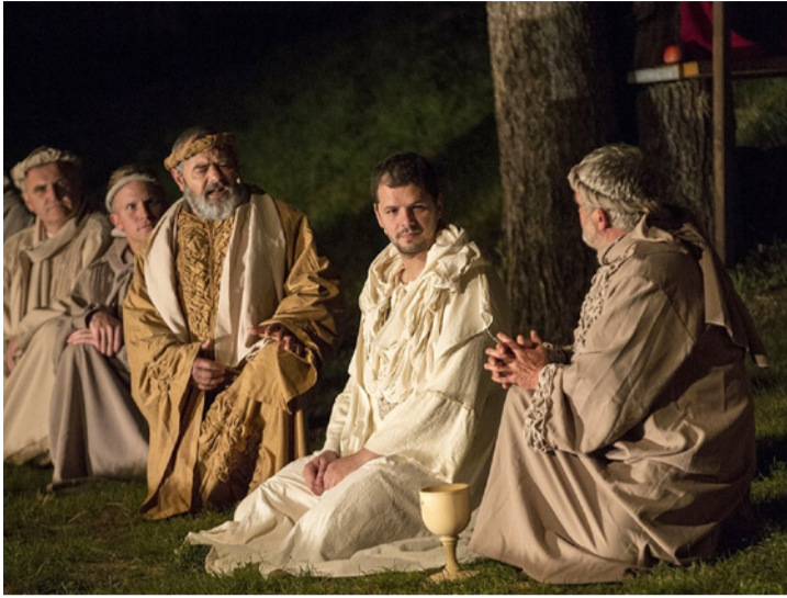
A falu apraja-nagyja színtársulattá alakul át