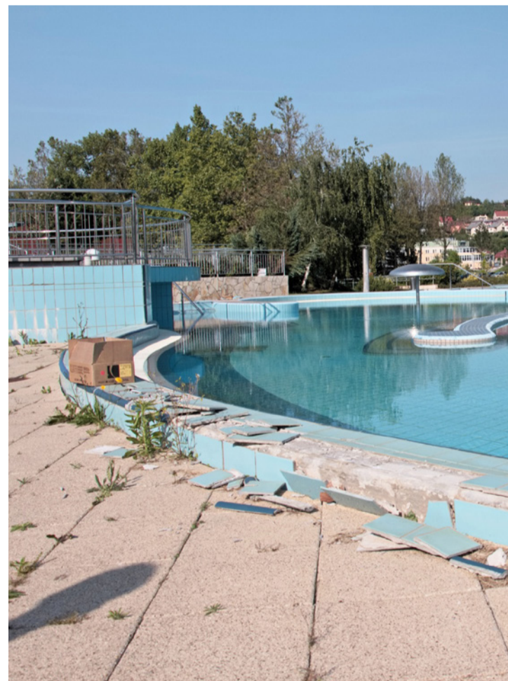
Víz már van a medencében, de a fagykárak helyreállítása még folyamatban