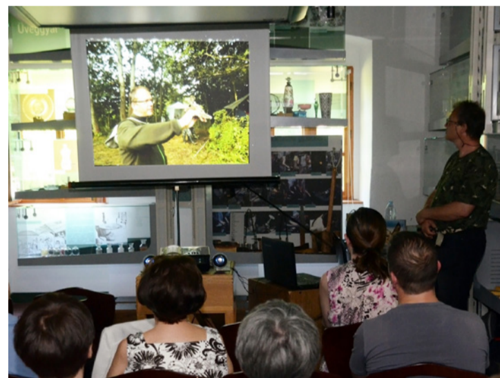
A táborban készült fotókból és filmfelvételekből az előadó fia készítette összeállítást.