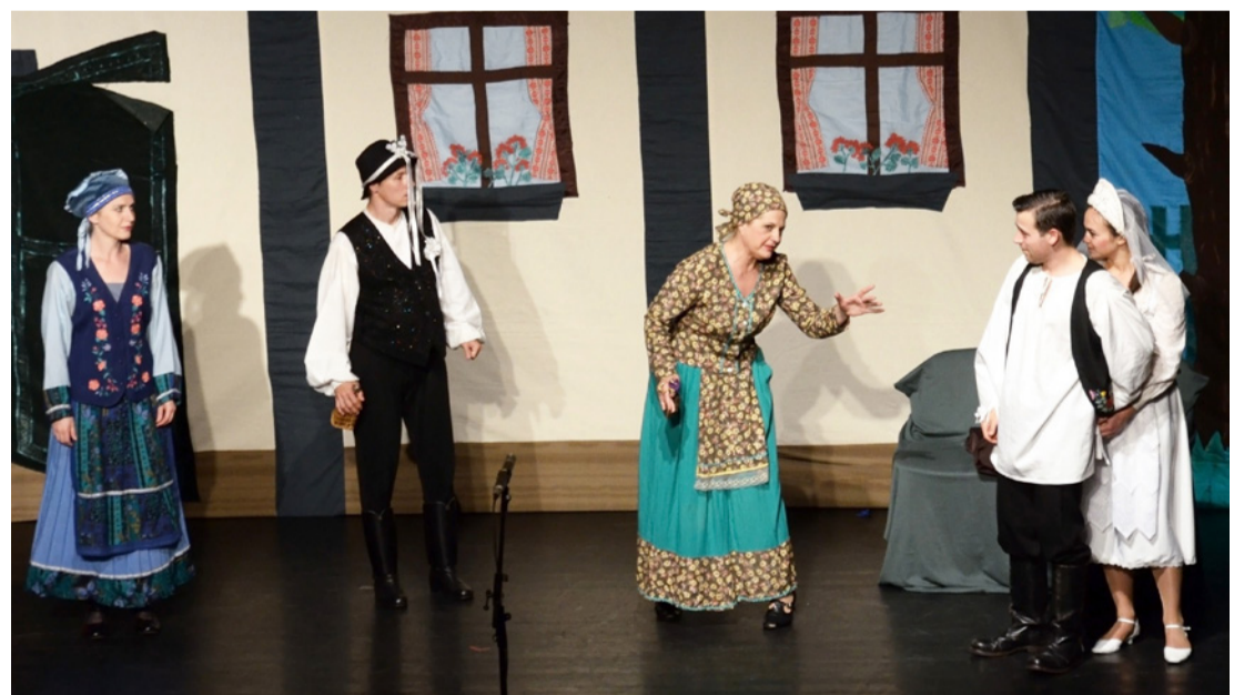
A díszletekre az egyszerűség volt jellemző, a jelmezek a történethez illőek voltak

Melyik gyermek és felnőtt ne ismerné az igazmondó juhászlegény történetét, amit többfajta feldolgozásban láthattunk, vagy olvashattunk már. Ezúttal a Tihanyi Vándorszínház mesétársulata írta, és adta elő a kíváncsi gyermekeknek.