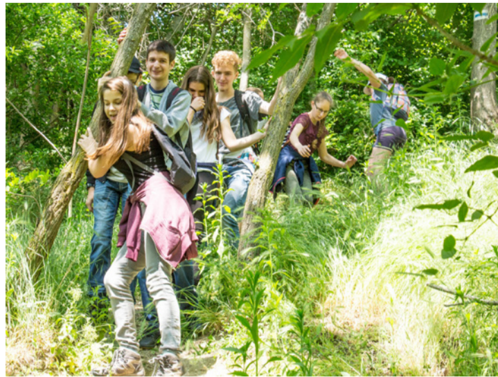
Nehéz terepen is mosolygósan