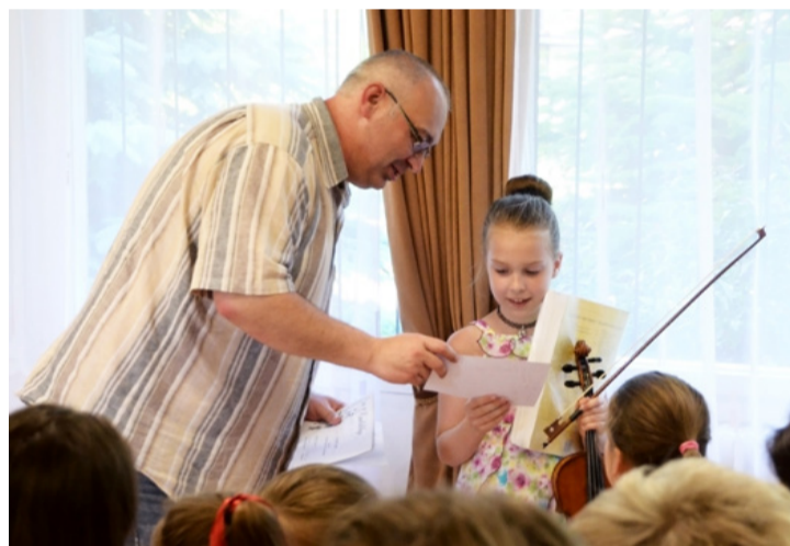
Tanáraik kedvesen, bátorítónan segítették az apró növendékeket

diákoktól hallott a közönség rövidebb-hosszabb darabokat.