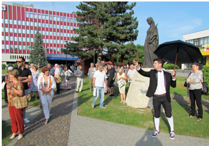
Műalkotásként is szemlélhetjük mindennapjaink színhelyeit, hívják fel a figyelmet a Teleszterion tagjai