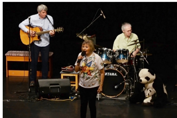
Halász Judit a színpadon

Hosszú idő elteltével ismét városunk vendége volt a népszerű művész, aki kiváló zenészek kíséretében csillogtatta meg tudását. Számtalan díj tulajdonosa, felsorolni és megjegyezni is lehetetlen vállalkozás, kiemelkedő elismerései közül példaként említhetjük Kossuth-díját. Magyar költők verseit éneklő a könnyűzene legjobbainak megzenésítésé-