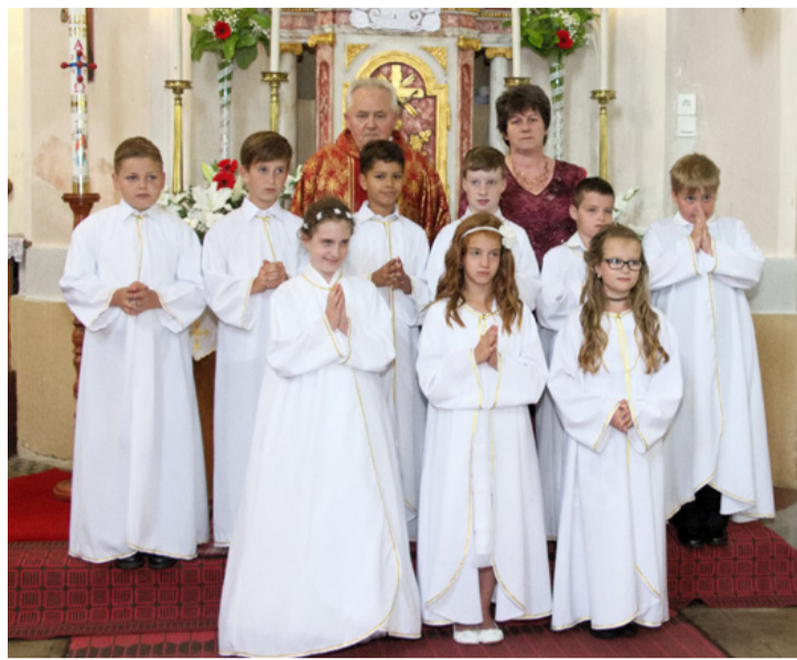
Az elsőáldozók hitoktatójukkal és lelkipásztorokkal