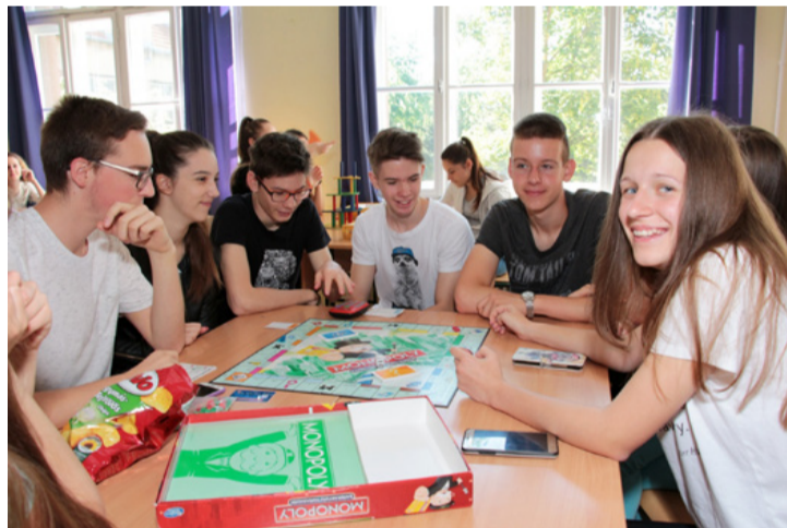
Voltak, akik társasjátékkal töltötték a délelőttöt

Mások Benkő Imre Prima Primissima-díjas, egykori bródys diák fotóművésszel töltötték el egy rendhagyó órát a Bródy nap keretében. A művész élménybeszámolót tartott az évek során készített fotóösszeállításokról, utazásairól és az általa megismert világ egy szeléről. A zsúfolásig telt terem-