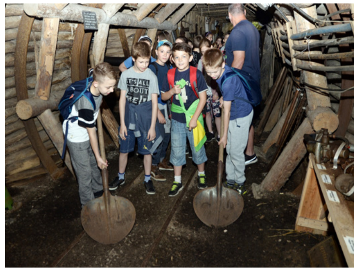
A szívlapát még üresen is tekintélyt parancsoló