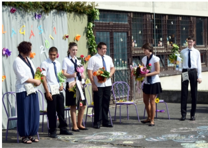
Az iskola végzős diákjai osztályfőnökükkel