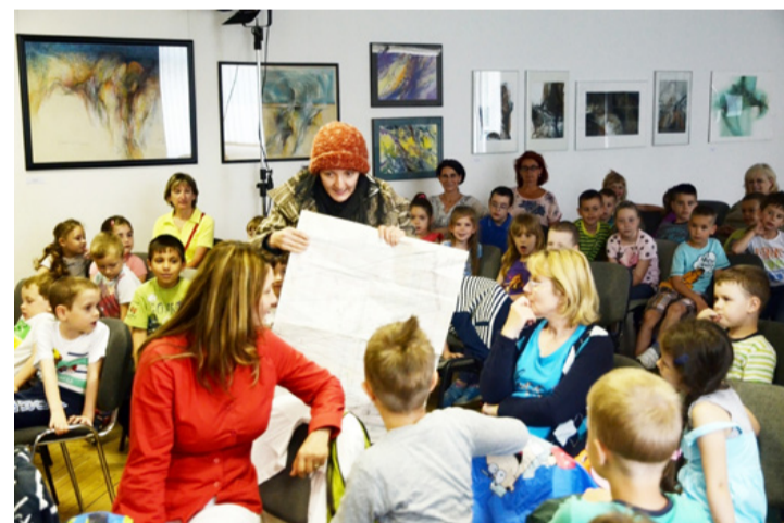
Az apróságok számára tele volt talánnyal az előadás

A Művelődési Központ kiállítótermében mutatták be a mesét, amelyet egy színésznő játszott el, no és jelen volt még egy édes kiskutya is, a gyerekek öröme. Az apróságok számára tele volt talánnyal az előadás. Nem érzékelték a kezdetét és a végét, az sem derült ki nekik igazán, miről is szólt a történet. Annyi bizonyos, hogy a figyelmüket nem sikerült tartósan lekötöni. Kevésnek bizonyult a bolondozás, a humoros és a zenés jelenet, prózai részekben viszont bővelkedett a történet, amit a kicsik nem tudtak követni. Mivel a gyerekek még na-