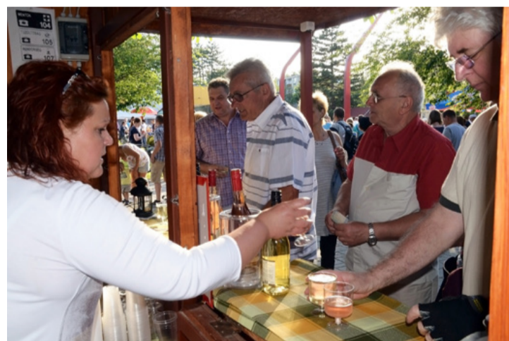
Az igazi főszereplő a jó somlói bor volt

a délutánon. Rendhagyó produkcióval készültek, ugyanis a folklór és más műfajok elemeit vegyítve erotikus töltetű, mégis mulatóba hajló koreográfiát mutattak be a lányok. Az izgalmas bemutató után a hangulat tovább fokozódott a színpadon, amit amolyan ki mit tudal és géppuskalábakkal tettek felejthetlenné a táncgyűttes fiútagjai. Természetesen közös táncokból sem volt hiány. Közben leszakadt az ég, így sokan