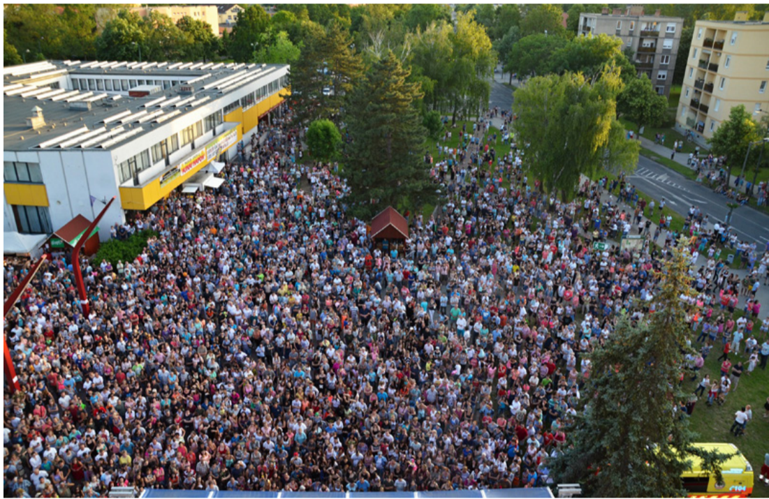
A gazdag program nagy tömegeket vonzott az Agóra