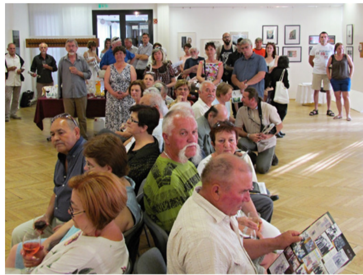
Barátok, pályatársak, művészetkedvelő ajkaiak a megnyitón