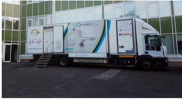
A mobil CT. Bár úgy nézki, mint egy vízszállító, de lift is van benne

Nem használhatják a betegek az ajkai kórház CT-berendezését. A hírt az RTL Klub Híradója tudta meg, amely megszerezte a leállításról szóló miniszteri határozatot is. Az ajkai és környékbeli betegeknek egy ideig Veszprémbe kellett menniük CT-vizsgálatra. A lépést a betegbiztonsággal indokolták.