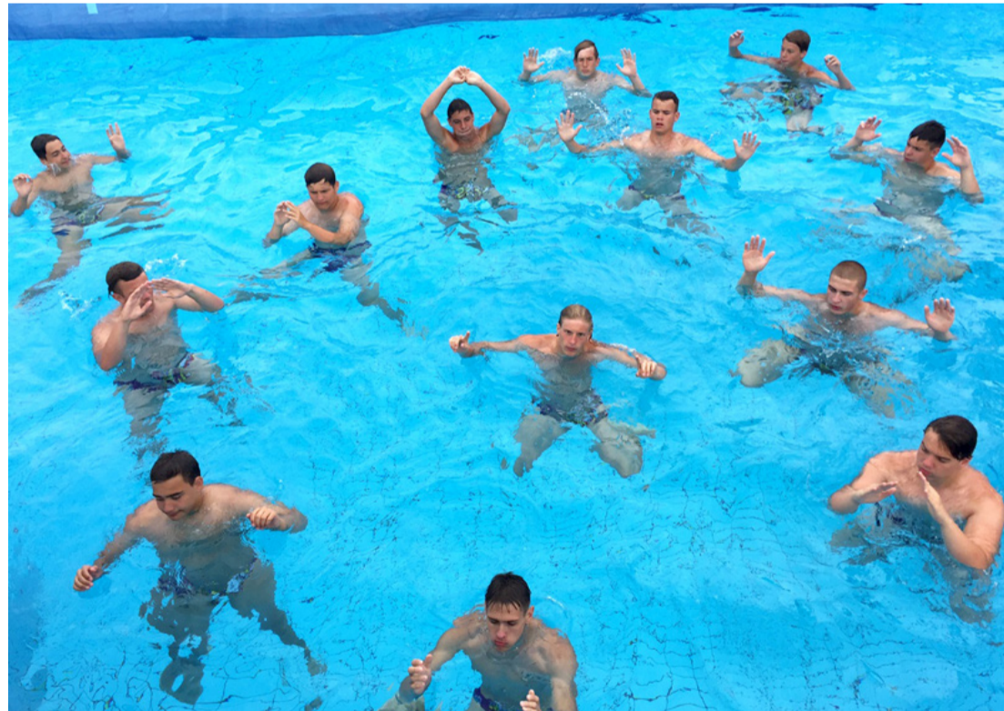
A Cápák természetes élőhelye a víz