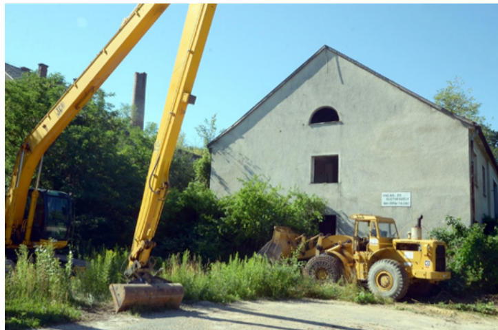
Az épület falán tábla figyelmeztetett az omlás- és életveszélyre

Elkezdődött az egykori csingeri bánya irodaépületének bontása a minap, a területet néhány hét alatt rendbe kívánja tenni Ajka Város Önkormányzata a kivitelezővel, hogy a városrész lakói és főként a gyermekek, ismét birtokukba vehessék a jelenleg még életveszélyes állapotú épület környékét.