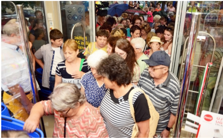
A vásárlók és az érdeklődők tömegesen vették célba a létesítményt

Már többször beszámoltunk róla, hogy a belváros új arcukat kap. A folyamat mostanra ténylegesen elkezdődött, aminek egyik első eleme a sétálóutcán az Euro Family új helyre költözése és megújulása volt. Az üzlet megnyitóját július 24-én tartották, amire a vártnál is többen érkeztek. Tömeg, gyerekpezsgő, lufik és eső. Röviden így lehetne leírni az ünnepélyes pillanatokat.