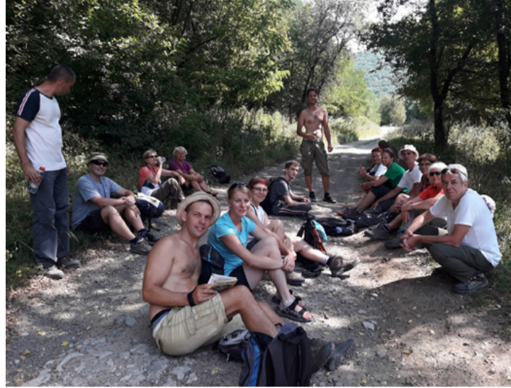
Pihenő egy erdei úton