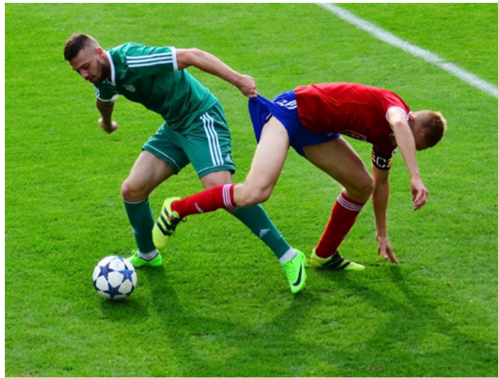
Vagy a labda, vagy a baba... vagy a gatyá?

Az FC Ajka és a Kristály is egyenlíteni tudott, de végül mindkettő pont nélkül maradt a legutóbbi játéknapon.