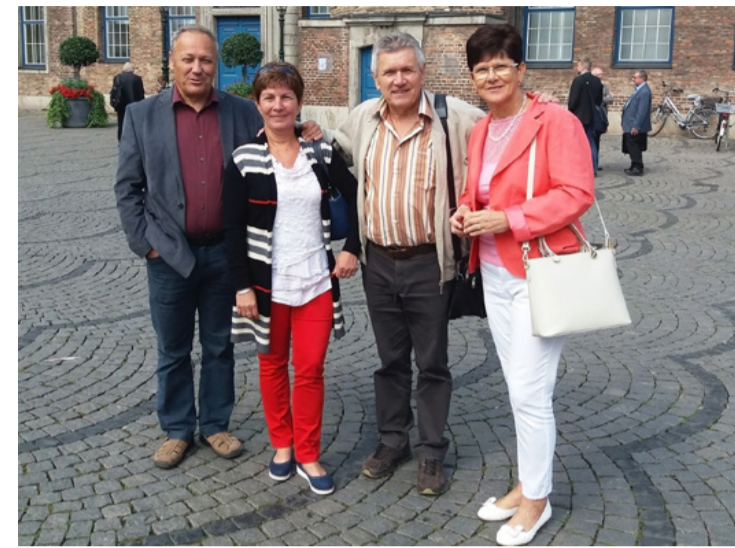
Az ajkai delegáció Unnában

Négytagú ajkai delegáció látogatott el szeptember elején Unnába, hogy erősítsék a testvérvárosi kapcsolatot a német településsel.