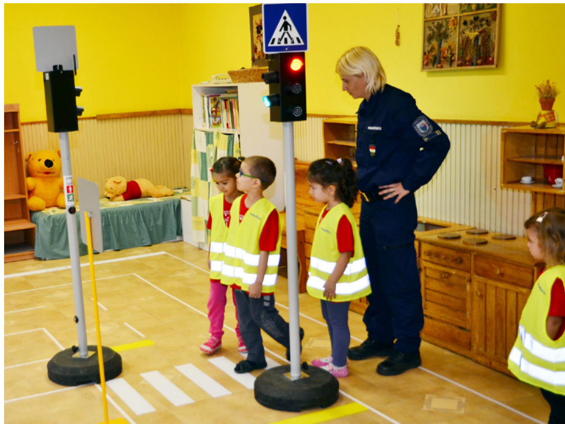
Ha zöld a lámpa, mehetünk