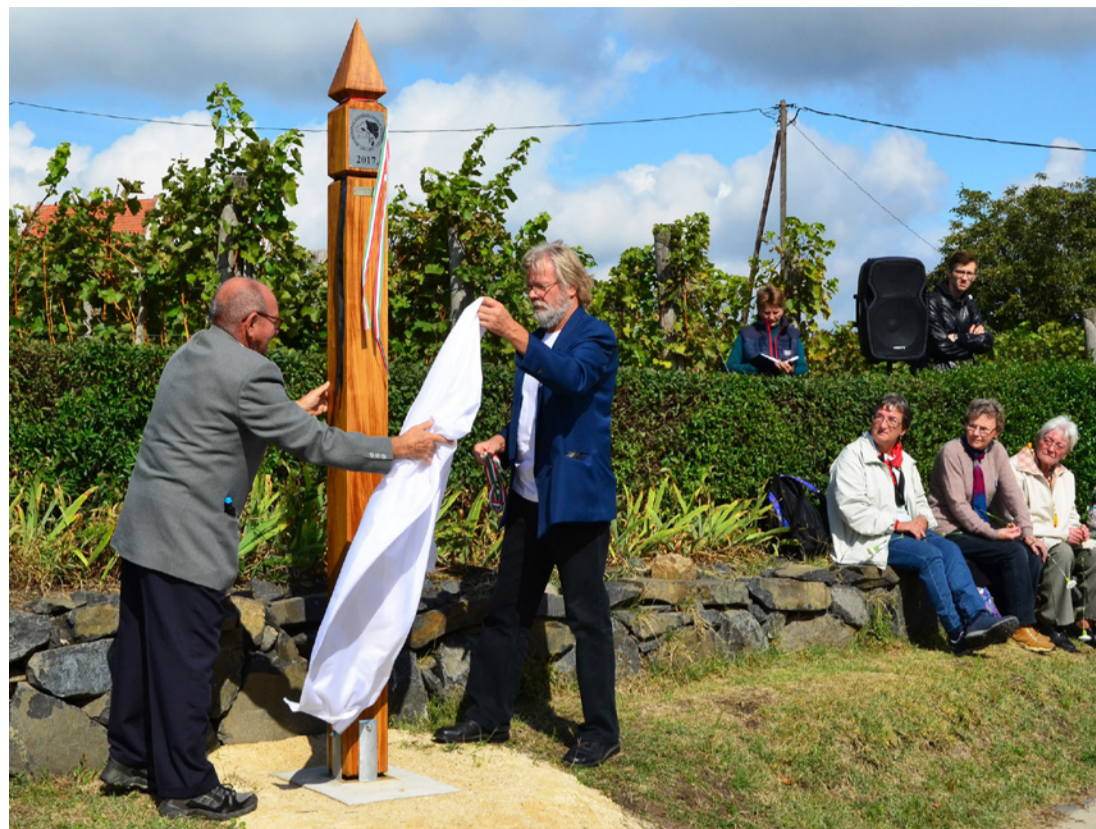
A kopjafa leleplezése