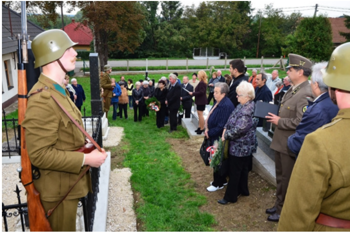
Hagyományörzők tisztelgése mellett emlékeztek a hősökre