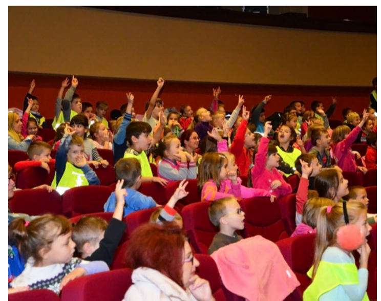
Zsúfolásig telt a terem csivitelő, duruzsoló apróságokkal

A gyerekek jó hangulatát tovább fokozta, hogy nem kellett egy helyben maradniuk, elindult ugyanis a vonat, amire egytől egyig mindenki felkapaszkodhatott. Hatalmas élmény volt számukra a sorok között kacskaringózni.