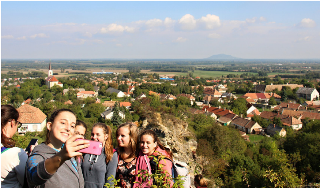
Készül a szelfi, háttérben még a Somló is felsejlik