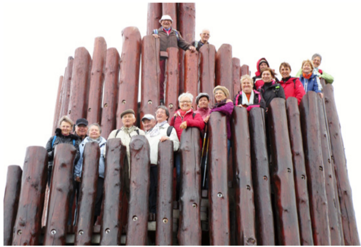
A bánkis nyugdíjasok „kemény magja” a Jutas Vitéz kilátóban