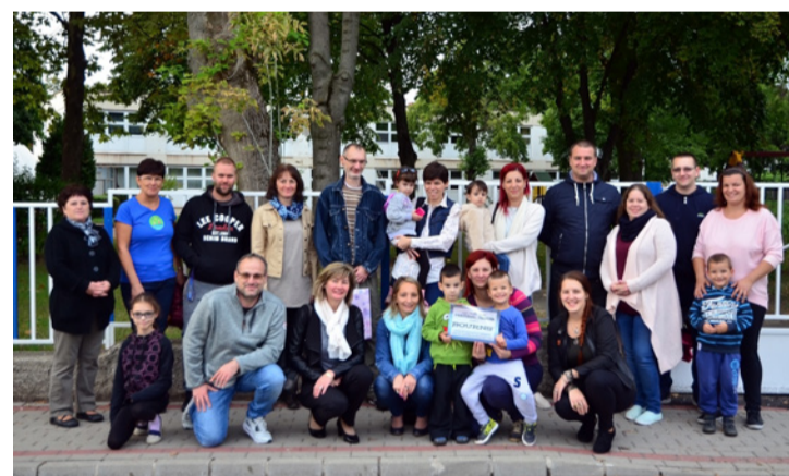
Csoportkép a kerítésfestő csapatról