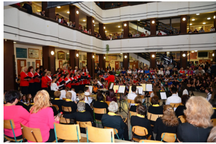
A zene világnapján csak öröme szól

A rendezvényen számos kórus szerepelt, jellemzően népdalokat adtak elő az énekesek. Női és vegyes karok léptek fel: az Ajkai Pedagógus Női Kar, a Cantabile Vegyeskar, a Forrás Női Kar, a Jubilate Női Kar. Gyerekek is szórakoztatták a vendégeket: a Borsos Miklós Általános Iskola kis- és nagykórusa, a Bródy Imre Gimnázium leánykara és Fekete István-Vörösmarty Mihály Általános Iskola Tündérkelepelök ének-