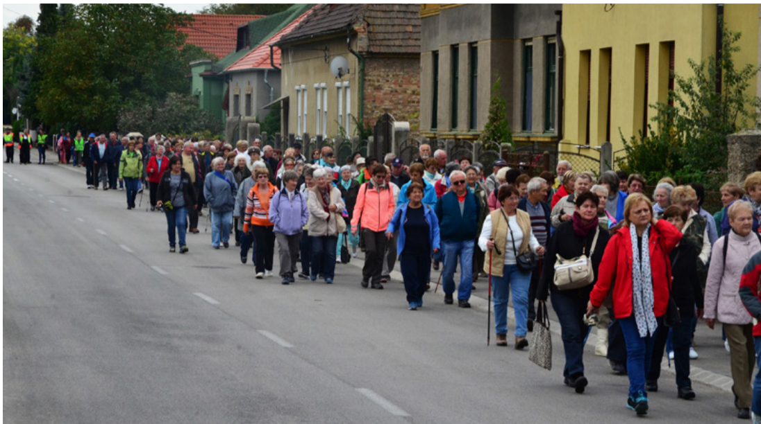
Ilyen sokan is ritkán mennek egy irányba