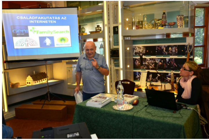
Első a szájhagyomány, azután az írásos emlékek jönnek

Az előadáson beszámolt róla, hogy milyen forrásokat lehet felhasználni a kutatásokhoz. Előszörként a szájhagyomány útján