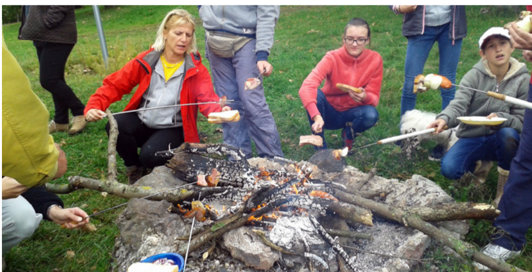
A kirándulás sava-borsa a szalonnasütés