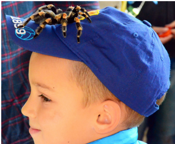
Nem csak a veréb, a pók is madár

Középen színes lepkéket mutattak be az érdeklődőknek, amelyek a gyűjtemény érdekes részét képezték, pedig nem éltek. Az egyik szervező egy madárpókot tett a vállalkozó kedvűek kezére. Először mindenki tartott a szokatlan állattól, majd miután az első bátor ember, egy nagymama, aki az