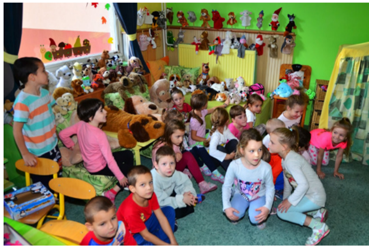
Plüsskutyák és valódi gyerekek