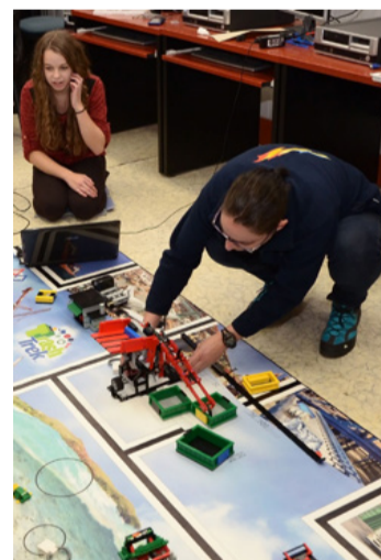
Embertek és robotok

A gimnazisták kilencedik osztálytól emelt szintű angol, német, kezdő angol, valamint általános tantervű gimnáziumi képzés közül választhatnak. Az utolsó két évfolyamon minden diák kötelezően két tantárgyat választ, amelyeket heti plusz két órában tanul-