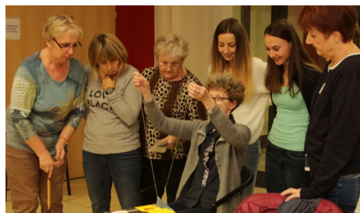
Kéttűs varrás és hét kreatív szempár

A kézi varrást megnehezítette, hogy nem egy, hanem két tűt használtak a jelenlé-