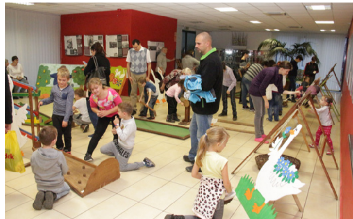
Igazi családi program volt