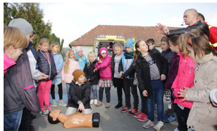
Fontos a helyes kéztartás

A mentők először az eszméletlen beteg ellátását ismertették meg a fiatalokkal, majd az újraélesztést mutatták be. Az esetkocsi később érkezett, mert útközben riasztást kapott. A