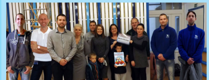
A lelkes csapat