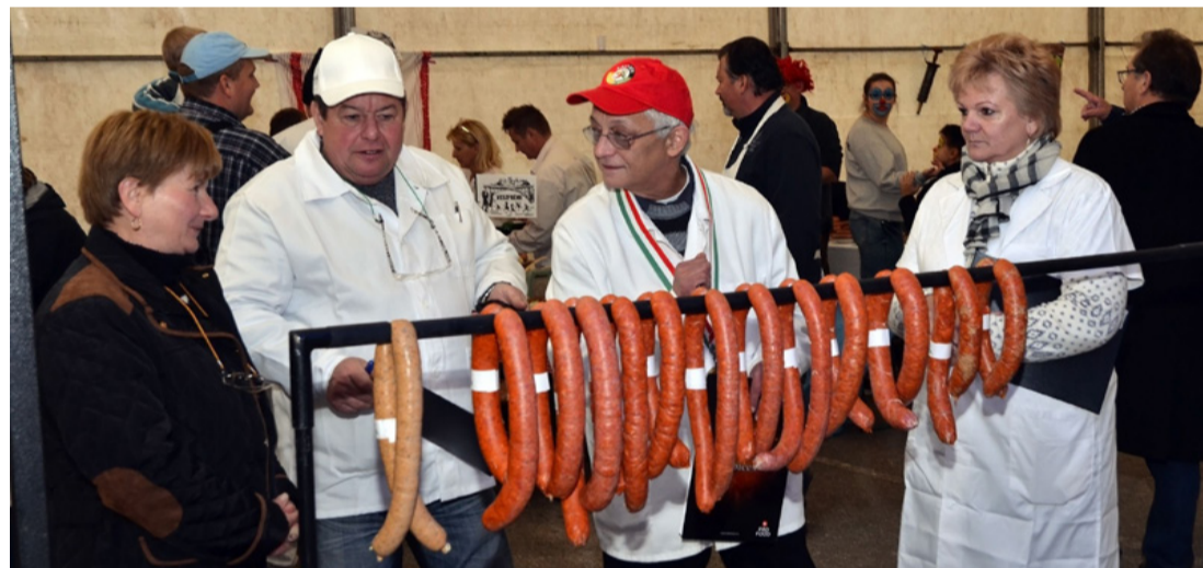
Szigorú a zsűri

A Belesek társaságának már a névválasztása is elárulta, hogy szeretik a belüket, ők egy rendkívül izletes tipikus finomságot töltöttek. Budapesti székhelyű cég Lokomotív nevet viselő környékbeli töltői egy hagyományos nemesládonyi majoránás és egy Bajor citromos – amelyben a gyulai ízek fellelhetőek