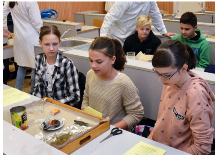
Érdekes kémiai kísérlet: előbújt a „fáraó kígyója”

Második alkalommal szervezték meg a nagy múltú ajkai gimnáziumban a tantermi sétát a pályaválasztás előtt álló diákok részére, ahova a szülőket is szívesen fogadták. Az iskola arra törekedett, hogy a fiatal korosztály igényeihez közelítsen: a tudást, az ismeretek átadását új köntösbe öltöztetve tárták eléjük, a bemutató tanórák közös jellemzője a kreativitás, sőt a szórakoztatás volt.