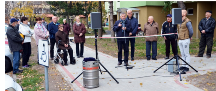
... és élvezik az életet

Immár a 790. közlekedési létesítményt adták át Ajkán, a Verseny utcában, ahol a járdafelújításon túl a lépcsőházbéjárók akadálymentesítése és parkosítás is történt a közelmúltban.