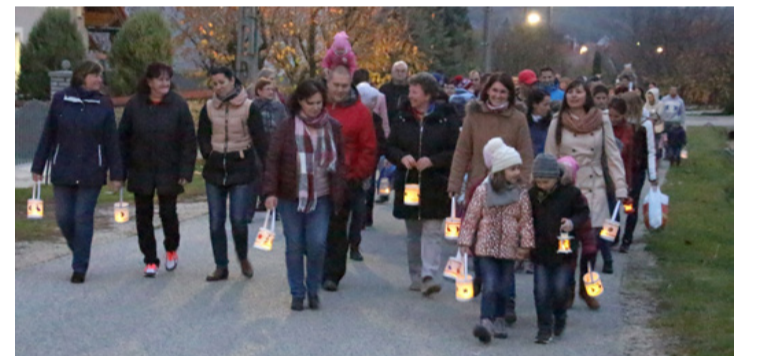
Mártonozók az alkonyatban Rendeken

A legenda szerint Márton még a római császár katonájaként szolgált, amikor egy hideg téli estén lovagolva, megosztotta meleg köpenyét egy nélkülöző koldussal. Aznap éjszaka álmában megjelent Jézus a koldus alakjában. Innentől kezdve nem a hadsereget, hanem Istent szolgálta. Jóságos férfi volt és mindenkinek segíteni próbált, ezért az emberek püspökké akarták választani. Márton szerénysége miatt méltatlannak tartotta magát erre a címre, ezért elbújt egy libaólbán, de a ludak hangos gágogásával elárulták, így megtalálták és mégiscsak püspök lett belőle.