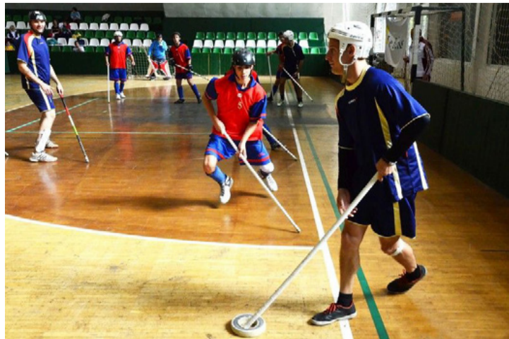
A padlólóki lendületes és élvezetes játék

Az utánpótlás csapat tagjainál tapasztalhatták a fejlődést, ami őszinte lelkesedéssel párosult, a felnőtt csapat tagjai pedig már profik. Az ajkaiak többsége a spe-