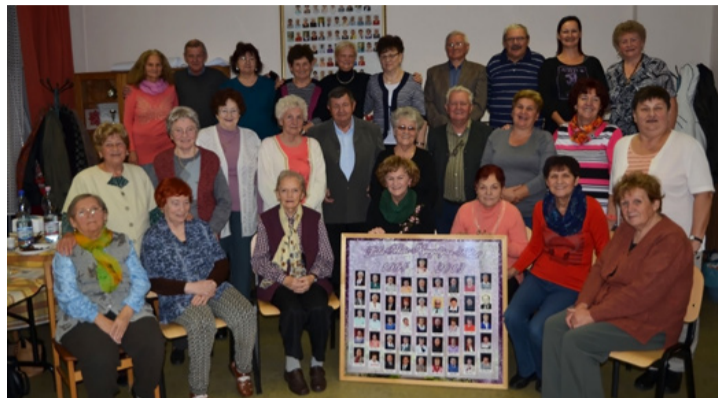
1994-2017 Tabló a tablóban