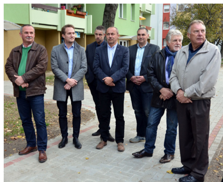
A salgótarjáni delegáció szétnézett Ajkán

Salgótarjában jelenleg a közterületi parkok, zöldterületek, temetők kezelését az önkormányzat tulajdonában lévő Salgótarjáni Foglalkoztatási Nonprofit Kft végzi, fő-