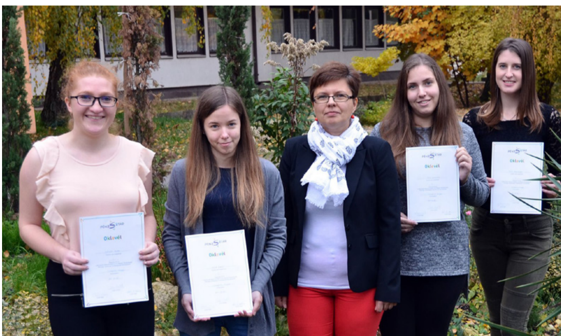
A Pénzmosók és felkészítő tanáruk a verseny után

Az első fordulóban a világhálón választották meg a kér-