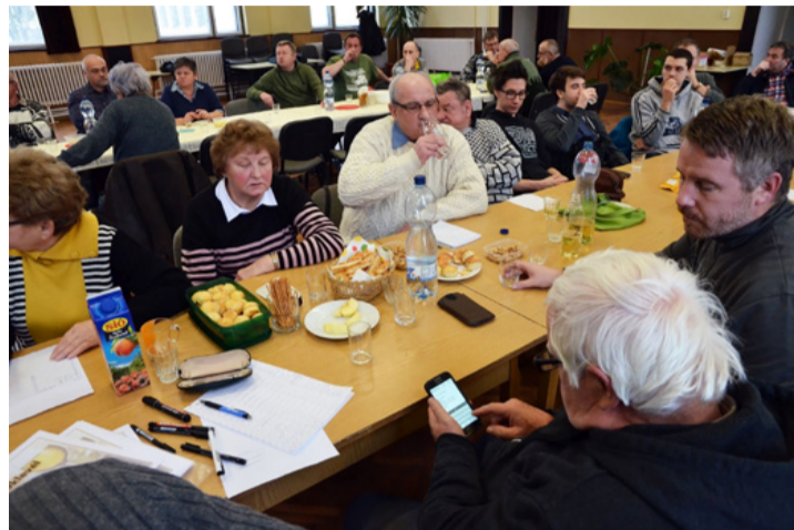
A közönség is kóstolt