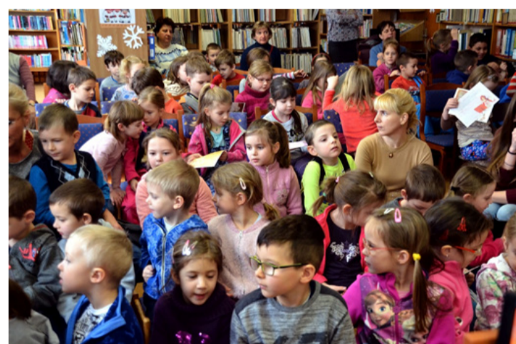
Vajon hány leendő zöldségtermelő van közöttük?

Bori Erdélyből, egészen pontosan Kolozsvárról származik és gyerekkorában az a szerencse érte, hogy találkozhatott egy igazi, élő íróval, magával Kányádi Sándorral , éppen vásárlás közben. Ekkor muszáj volt szembesülnie azzal a prózai ténnyel, hogy bizony az írók is hús-vér emberek. A különbség