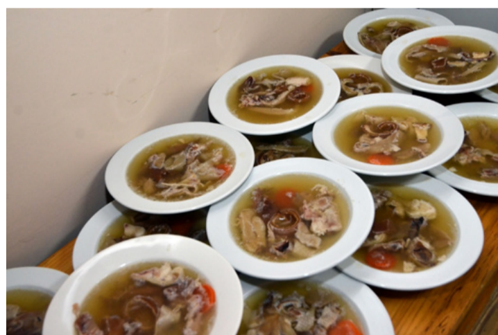
Nézni is „tereh”