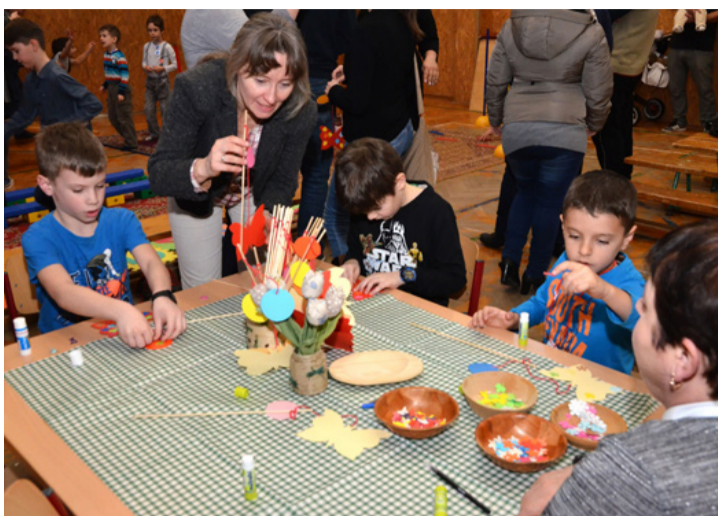
Már nagyon várják a sulit