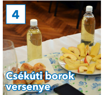
Csékúti borok versenye