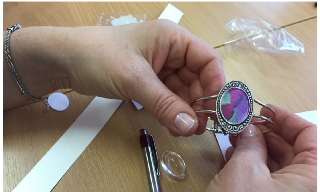
Bármelyik divatos kiegészítővel felveszik a versenyt