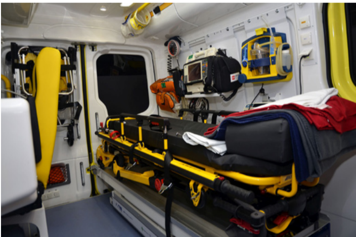
Az új esetkocsi felszereltsége minden igényt kielégít