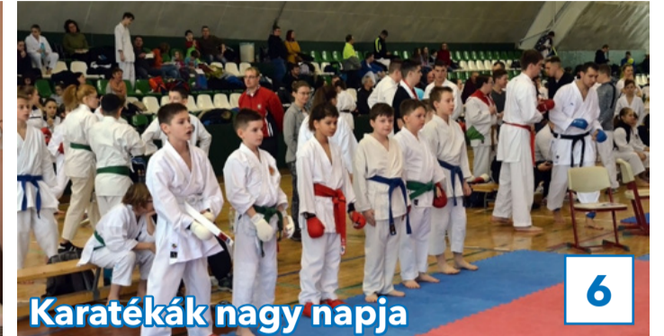
Karatéák nagy napja