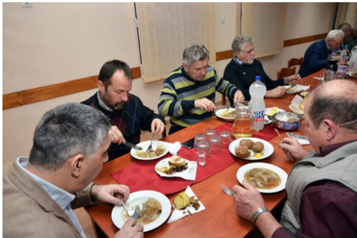
A városvezetés teszteli a kocsonyát