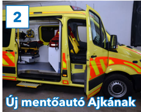
Új mentőautó Ajkának

31. évfolyam, 8. szám, 2018. március 9., péntek