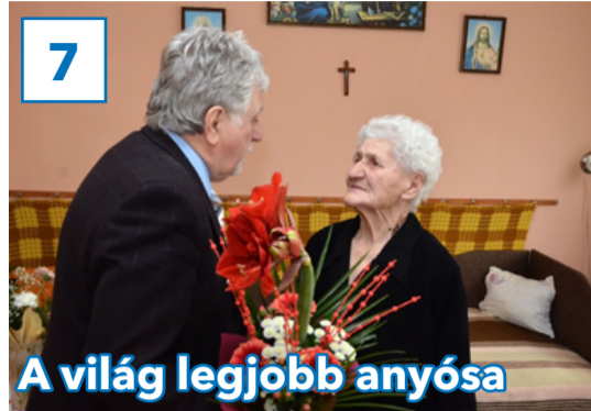
A világ legjobb anyósa