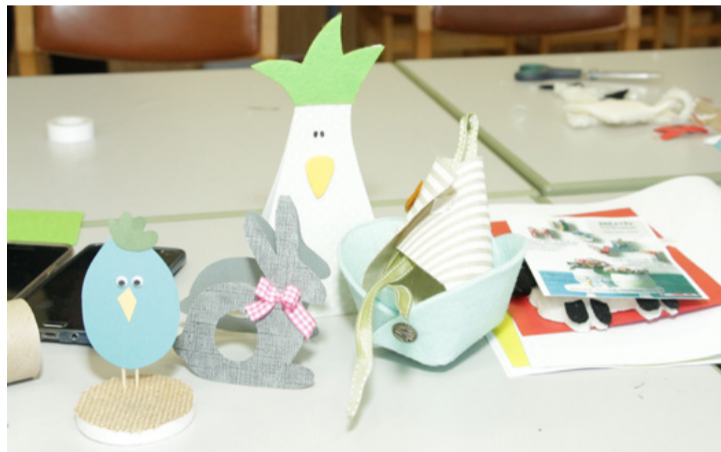
Néhány ötletes dekorációs tárgy