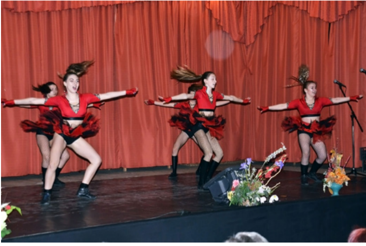
Rock and Roll!