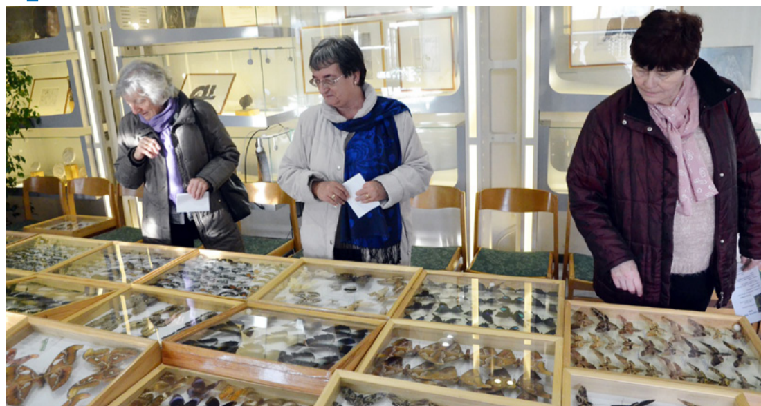
Nem csak nézelődni, tanulni is lehet

A gyűjtő neve a sportot kedvelőknek is ismert. Súlylökőként országos csúcsot állított fel, versenyzett a Sydney-i Olimpián, majd egy orvosi műhiba véget vetett a felfelé ívelő sportkarrierjének. Ma testnevelő ta-