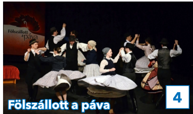
Fölszállott a páva