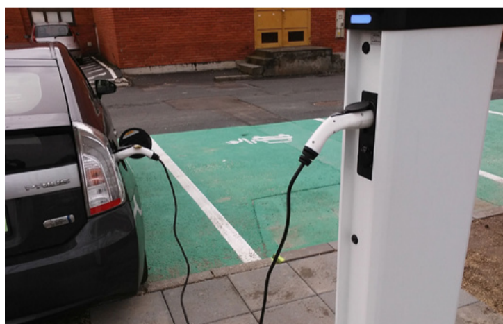
10 perc alatt több száz kilométerre elegendő „üzemanyag” tankolható így

Helló Ajka, itt a holnap – megkezdődött a Jedlik Ányos Terv Elektromos töltőállomás alprogramjának keretében az ajkai „A” típusú normál elektromos töltőberendezések tesztüzeme az OTP mögötti parkolóban, így már az elektromos autók rendelkezőknek sem kell azon gondolkodniuk, hol tudják feltölteni járműüket városunkban.