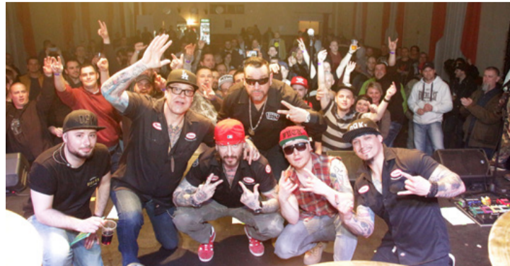
A koncertet közös fotózás követte

A srákok a 2017-ben megjelent KO című lemezükkel érdemelték ki a nívós elismerést, ami egy héttel a megjelenés után már aranylemez, majd nem sokkal később platina lemez lett. A 15 számból álló lemezről és régi slágereikből hoztak egy csokrot a rap fegyverei Ajkára, ahova időben érkeztek, így már a koncert előtt is bőven volt alkalma a rajongóknak a társasággal fotózni.