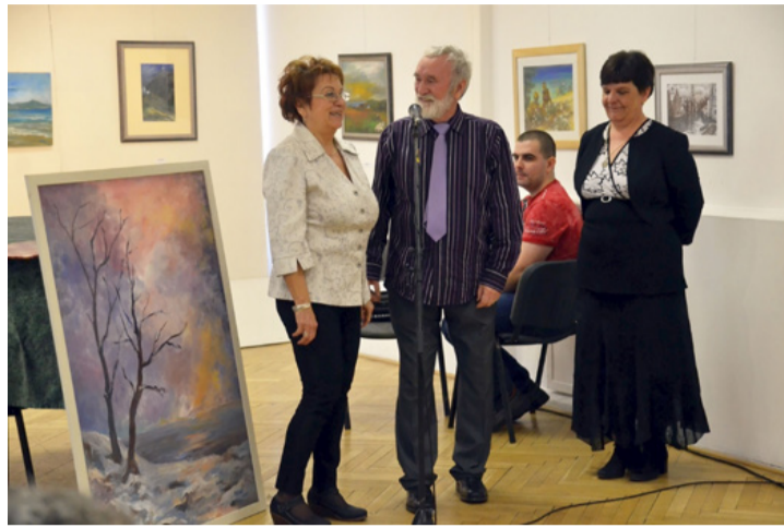
Szót kapott a festőpáros is