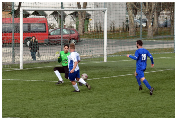
Szépen csillogott a Kristály a hét végén