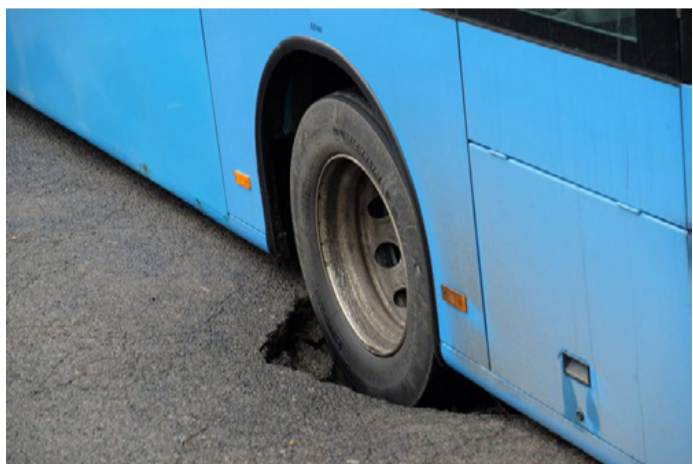
Kátyúban az erkölcs?

Felmentem hát a Volán vezetőjéhez és megkérdeztem, hogy a mai világban szabad-e ilyennek történnie? Én annak idején szerencsés voltam, mert a kisbabáimmal nem kellett buszoznom, de mi a rendje 2018-ban a babakocsis tömegközlekedésnek?