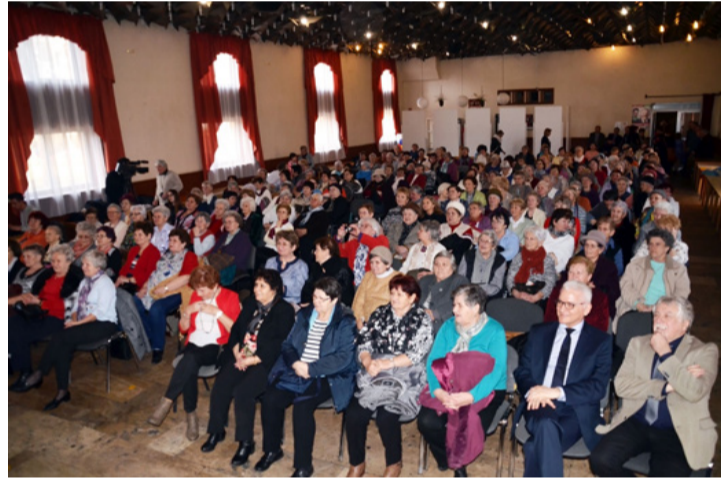
Zsúfolásig megtelt a Kaszinó