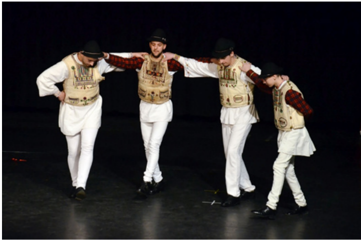
Lendület és elegancia - ez is a néptánc

■ Szólt a muzsika, zengett a dal és ropták a táncot március nyolcadikán, a Nagy László Városi Könyvtár és Szabadidő Központ színháztermében a Felszállott a páva két gáláján, ahol az eddigi pávák szereplői közül léptek néhányan színpadra. Délután ingyenesen nézhetők a diákok, este pedig a felnőttek vették birtokukba a nézőteret.