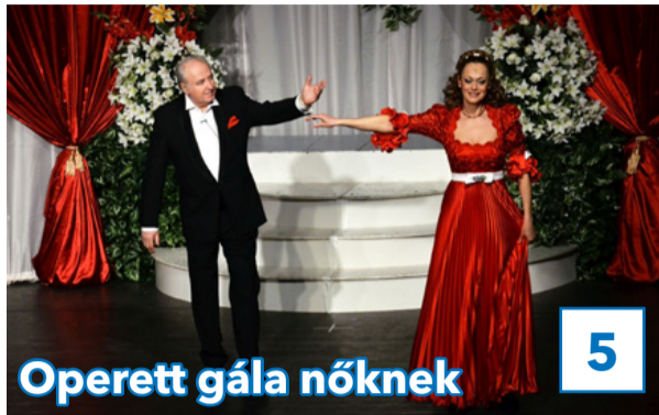
Operett gála nőknek