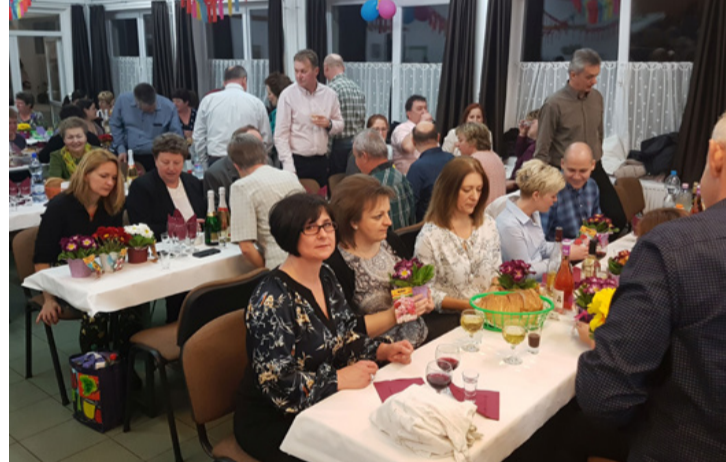
Virágot a virágnak

Az itt élők azt is megszokhatták, hogy a fiúk nem érik be