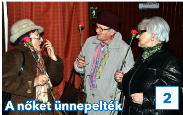
A nőket ünnepelték

31. évfolyam, 9. szám, 2018. március 16., péntek