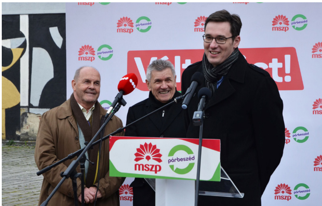
Jó hangulatú rendezvény volt