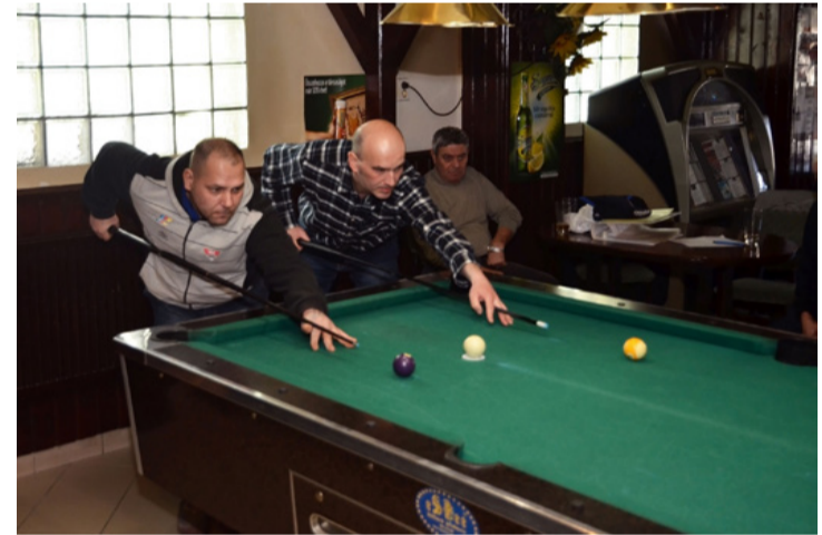
Ilyen a páros verseny