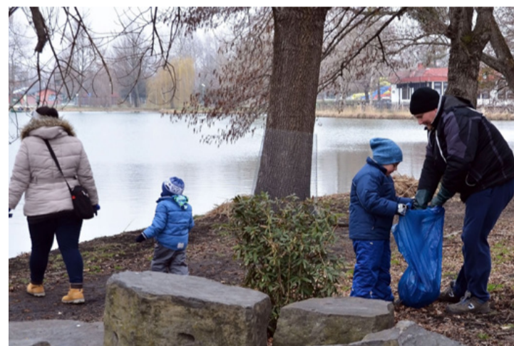
Nem lehet elég korán kezdeni

kőszénbányákból van borostyánjuk és azt tudományos célra kölcsönadnák, felajánlanák, vagy bemutatás céljából elhoznák! Az előadást követően megvásárolható a kutatócsoport „Bakonyi dinoszauruszok csodálatos világa” című könyve.