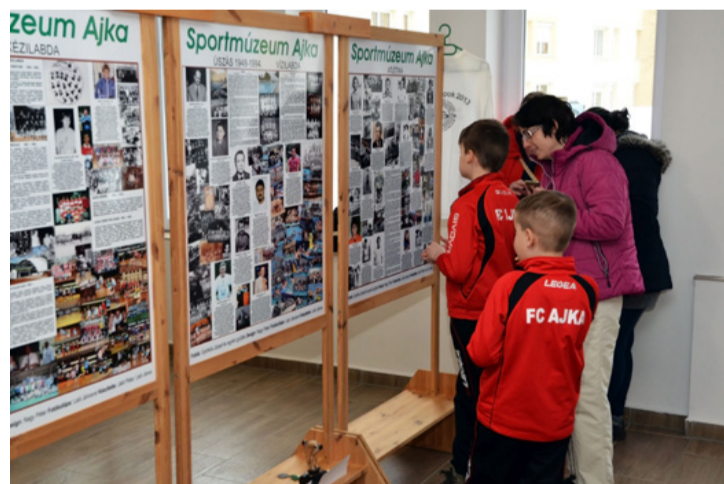
Bőven ad látnivalót minden korosztálynak