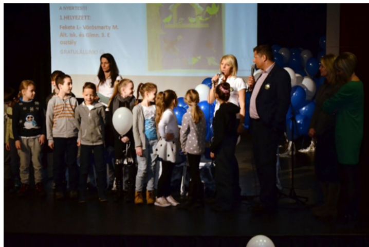
A díjátadó pillanatai