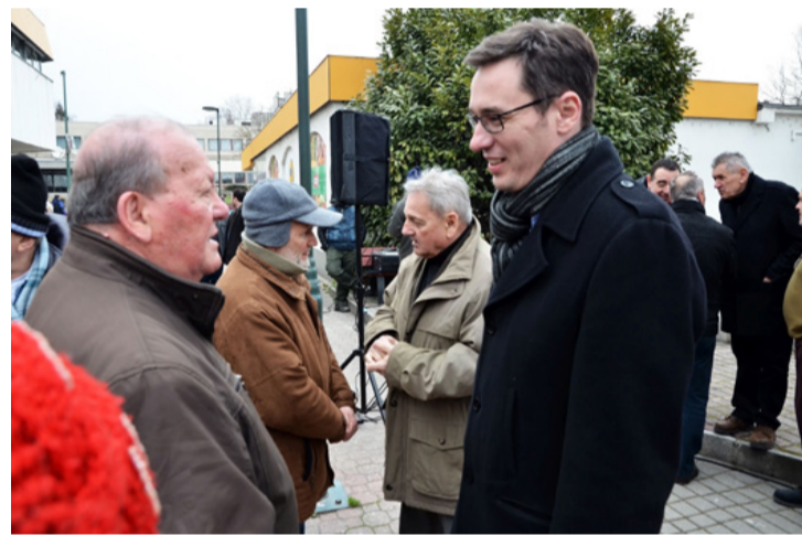
Szimultán válaszoltak kérdésekre