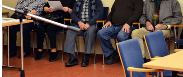
Több hozzászólással készültek

A képviselői hozzászólások után szót kapott Rig Lajos or-