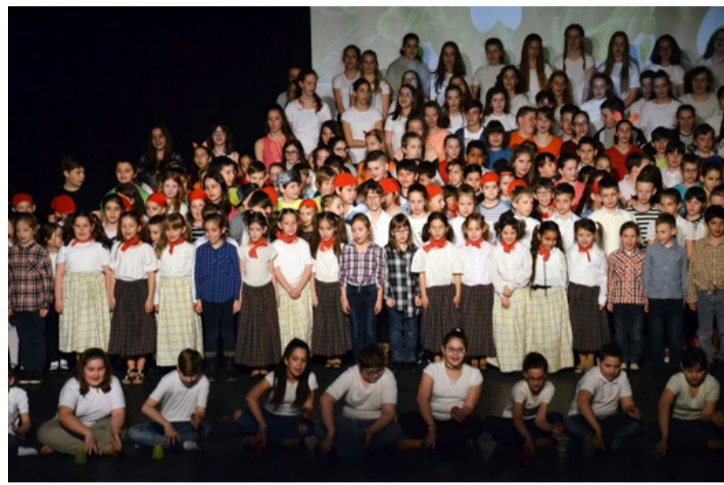
Egy majdnem teljes „családi kép”

A szeretetre építettek az 1/A-sok is vadnyugati cowboy táncokkal, amit némi kánkánnal fűszereztek, hogy a közönség garantáltan elolvadjon a látványtól.