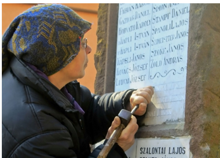
Egyetlen hős neve sem merülhet feledésbe