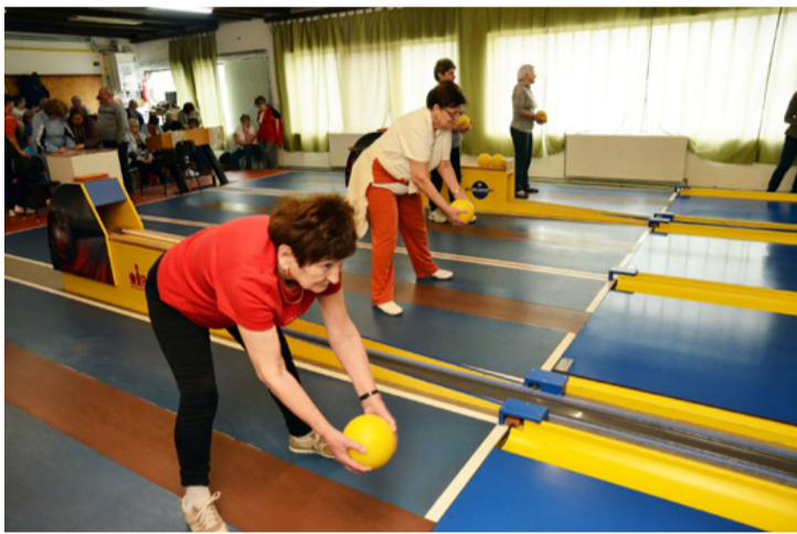
Lendület és pontos célzás