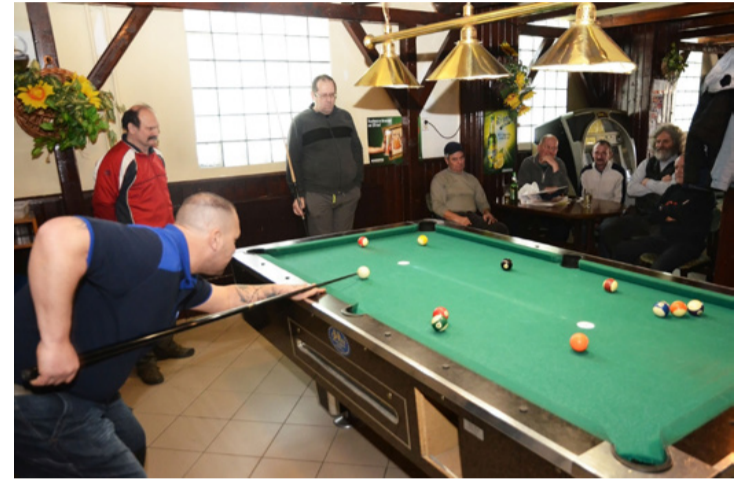
A biliárd nagy koncentrációt igényel