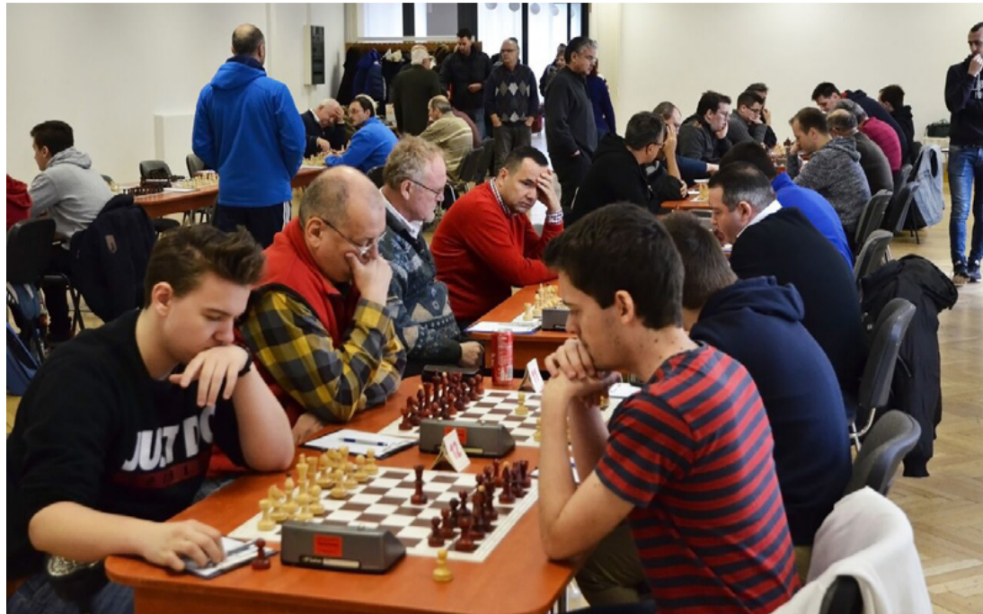
Nyerésben a bajnokcsapat