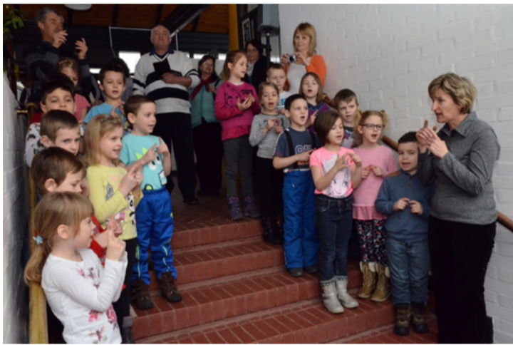
Az ovisok igazi partnerek voltak