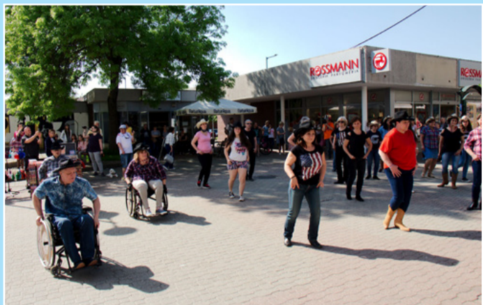
Kerekkel és anélkül, együtt ropták a villámcsödületen