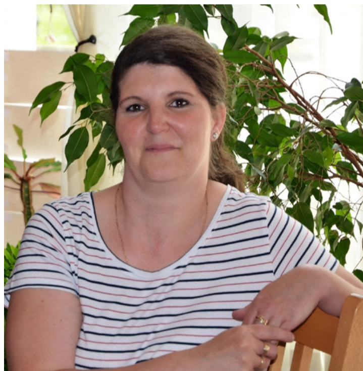
A dúla nyugalmat áraszt és biztonságérzetet ad

– Különbséget kell tennünk a szakképzett és a szakkép- zetlen között. Egy barátnő, aki bemegy a szülésre, hogy ott legyen mellettünk – ő is támogat, de a munkája nem professzionális. Ha valaki nem szakember, meg van az a kockázat, hogy esetleg árt és nem segít. Éppen ezért szakmává szeretnék tenni a dúla foglalkozást. A kétéves képzés három részből épül fel, ami vizsgával, tanúsít- vánnyal zárul. Az első része önismereti és motivációs tré- ning, a következőben külön- böző praktikákat sajátítunk el: masszázs, aromaterápia, szituációs gyakorlatok. Az elméleti oktatásban pedig szisztematikusan osztják fel a tananyagot: létezik úgyneve- zett apanap, nagymama nap, testvérnapi – hiszen velük is beszélgetünk, ők is érintettek a változásban.