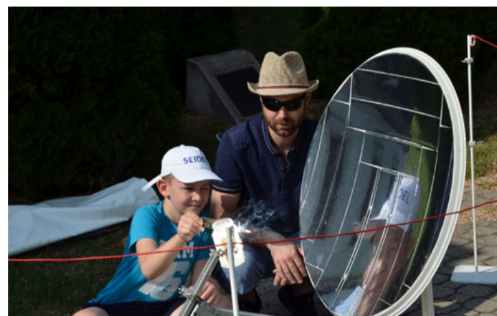
A Nap energiája űrhajót is hajthat és főzésre is jó

A rendezvény második felében a gyermekek közt ajándék suevit-darabokat osztottak ki az örök-lelkes egyesületi tagok. Sikert aratott a jelen-