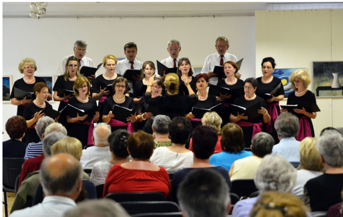
Ajkán kedvelik a vegyeskari előadást