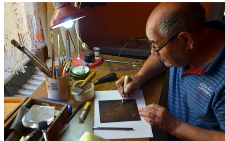
A művész legszívesebben otthonában alkot