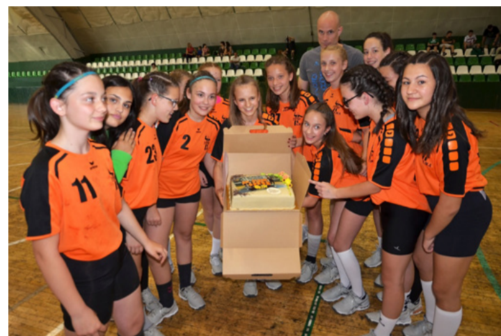
Az U13-as lánycsapat