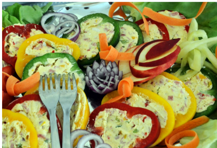
A sok zöldség az egészségtudatos táplálkozás egyik alapja