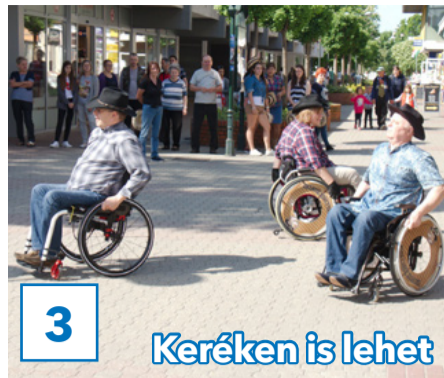
3 Keréken is lehet