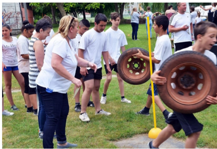
Itt a gumi, hol a gumi