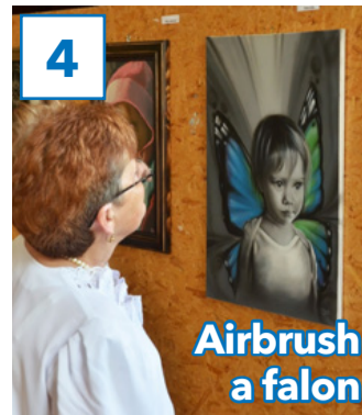
4 Airbrush a falon