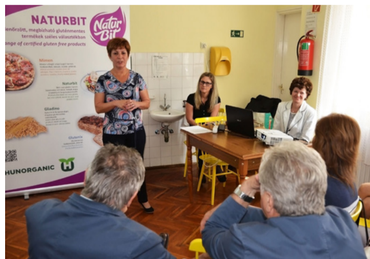
Jól egyél, tovább élsz