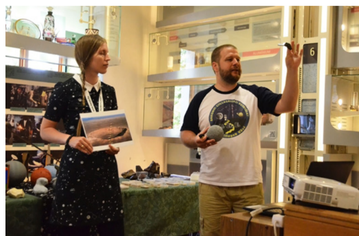
Ivancsék lebilincselőek voltak