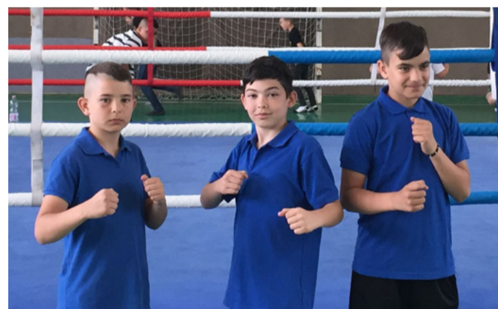
Egyre nagyobbakat ütnek