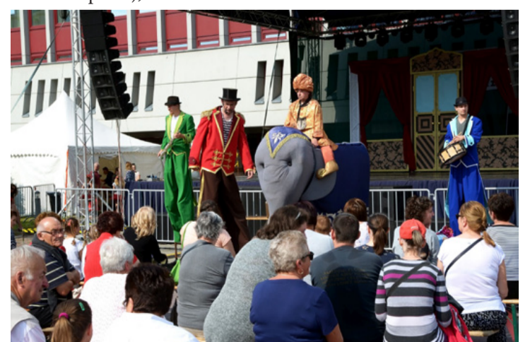
A Vaga Banda szellemes installációi

A pünkösdi mulatság vasárnapi napja főként az ifjúságnak, valamint a szépkorú közönség-