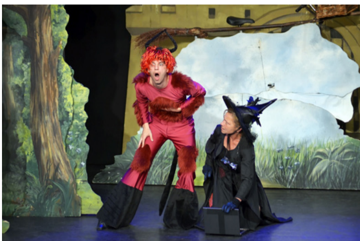
A szereplők a gyerekek nyelvén beszéltek

■ A bérletes gyerekszínházi előadások sorát zárta a Fogi Színház: Csetlő-botló fajankó című zenés mesejátéka, amit május 15-16 között láthatott az aprónép a vmk színháztermében.