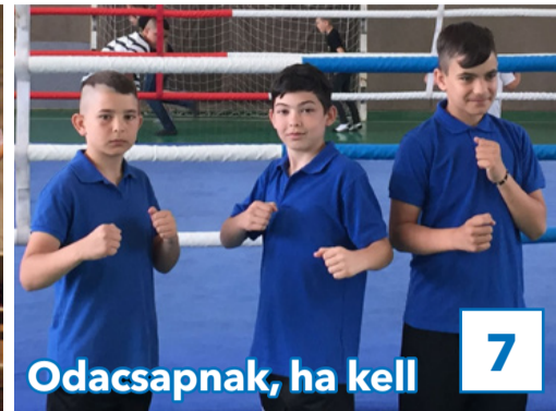
Odacsapnak, ha kell