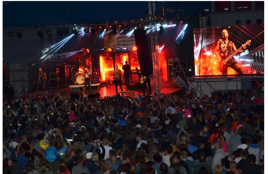
Kowáék mindent vittek

Kowalsky és csapata már csepergő esőben kezdte a bulit. Az első pillanattól betöltötte a teret a tömeg hangja, mindenki ovációval és csapózással üdvözölte a népszerű zenekart. A kezek mellett a szüleiikkel kilátogató gyermekek is a magasban „foglaltak helyet”, hiszen egy jó koncert mégiscsak apanyakából az igazi. Különleges pillanatok voltak ezek, amit Kowáék többször hangsúlyoztak is az este során, hiszen a jelenlévő tömeg ebben a formában először és valószínűleg utoljára találkozott így. Az öröme nyújtotta pozitív