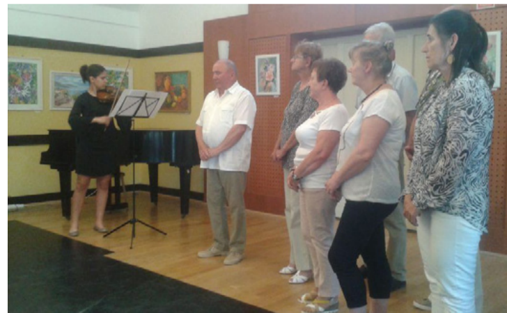
Megnyitó az arácsi népházban

füredi kiállítást a népházban működő civil szervezetek, a település lakói és természetesen a városban pihenők fogják főként látogatni június 16-ig.