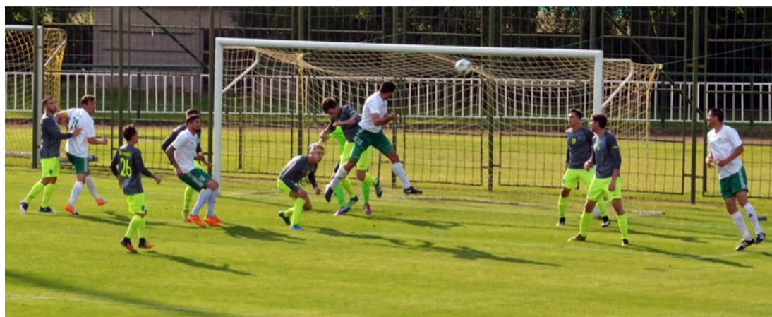
4:0-ra győzött a csapat