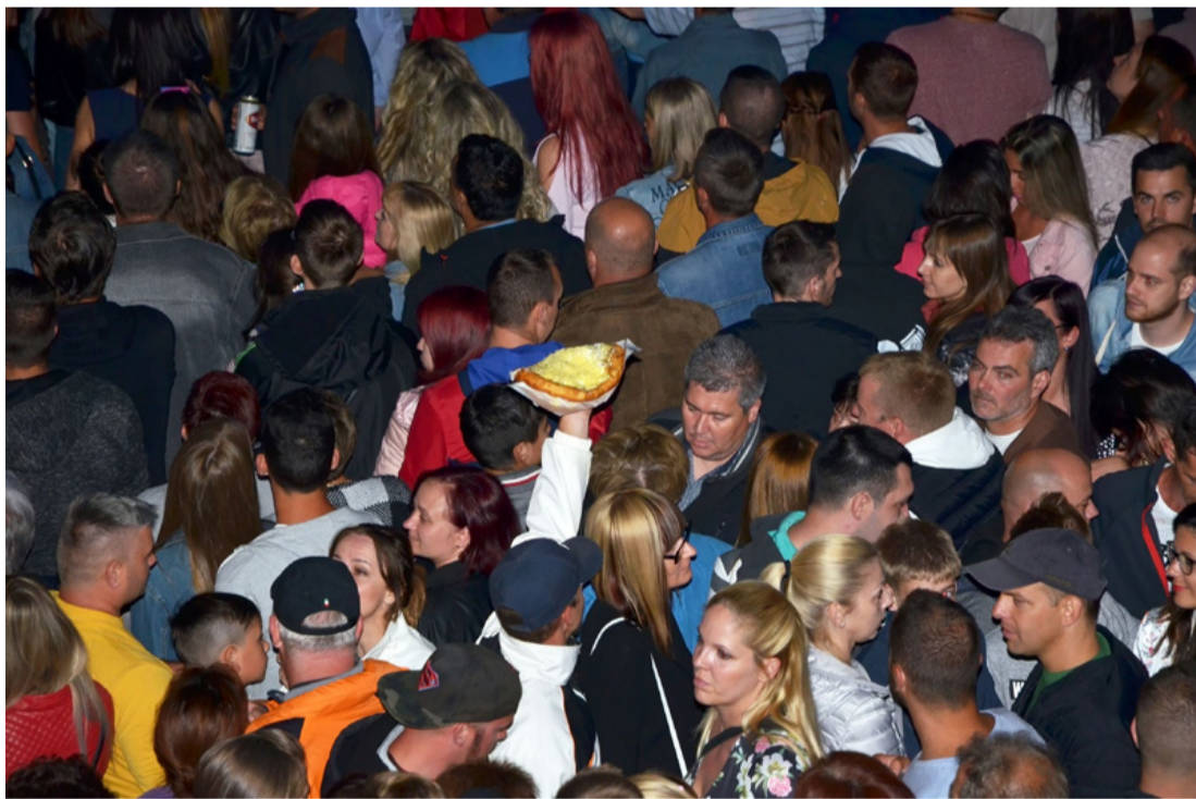
...és tócsi fesztivál

Az idősebbek a színpad előtt felállított padokra telepedtek, hogy onnan hallgassák a felcsendülő bordalokat, örökzöld slágereket, vagy dallamokat, illetve megnézzék a táncos produkciókat.