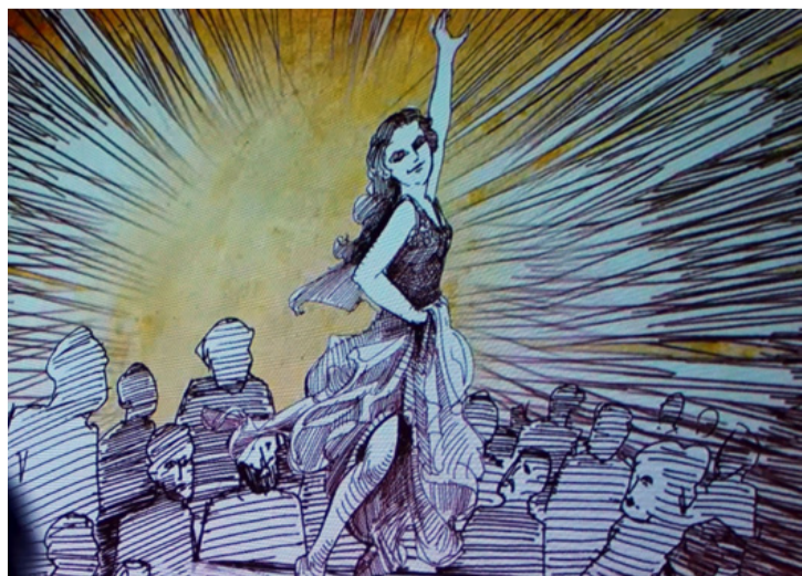
Az előadást vetített és mozgó grafikák tették még izgalmasabbá