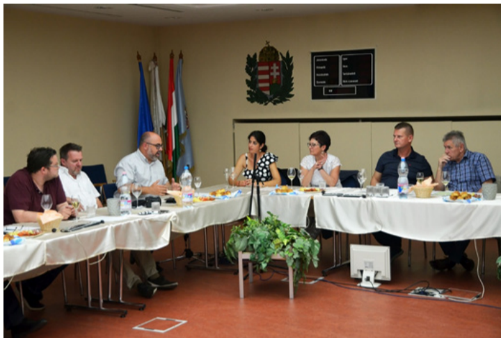
Fehér asztal mellett beszéltek meg a régió helyzetét

■ Minden pünkösdkor tiszteletüket teszik Ajka testvérvárosainak delegációi településünkön. Ez idén sem volt másként, ám a mostani látogatás rendhagyónak bizonyult, ugyanis ezúttal csak a weizi és a székelykeresztúri küldöttség tudott részt venni a barátságot és jó kapcsolatot erősítő rendezvénysorozaton. (Az unnai delegáció augusztusban érkezik majd, míg a finnekkel ősszel, vagy jövő tavasszal találkoznak a város képviselői).