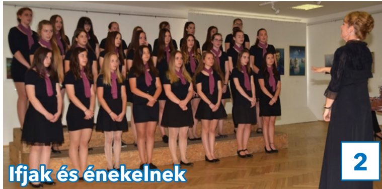
Ifjak és énekelnek

31. évfolyam, 18. szám, 2018. május 25., péntek