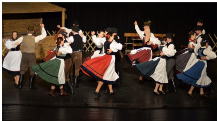
Nem fog rajta az idő