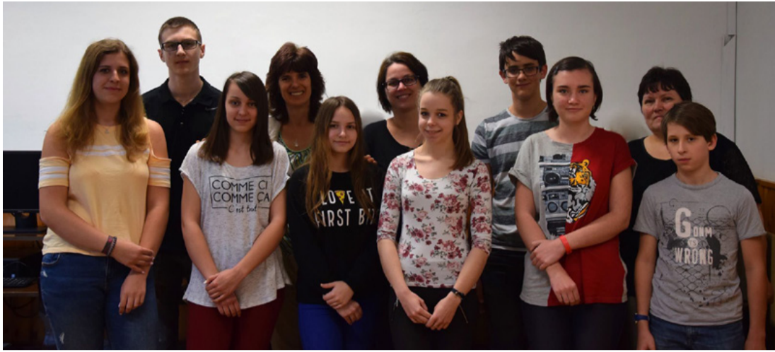
A sikeres diákok felkészítőikkel