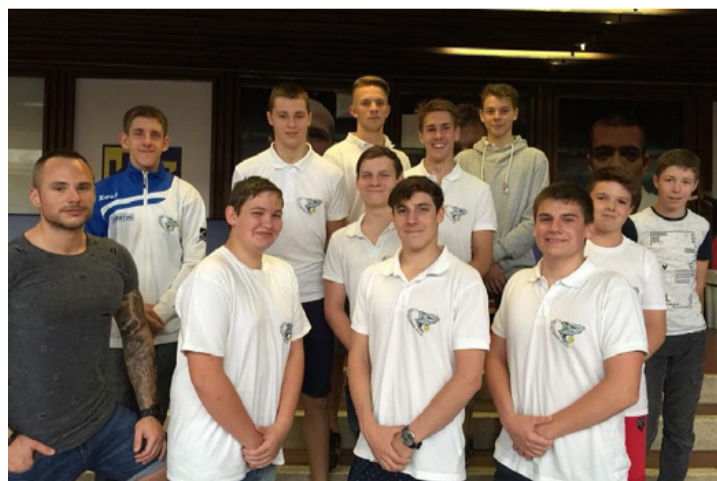
Egyre nagyobb az étvágyuk...