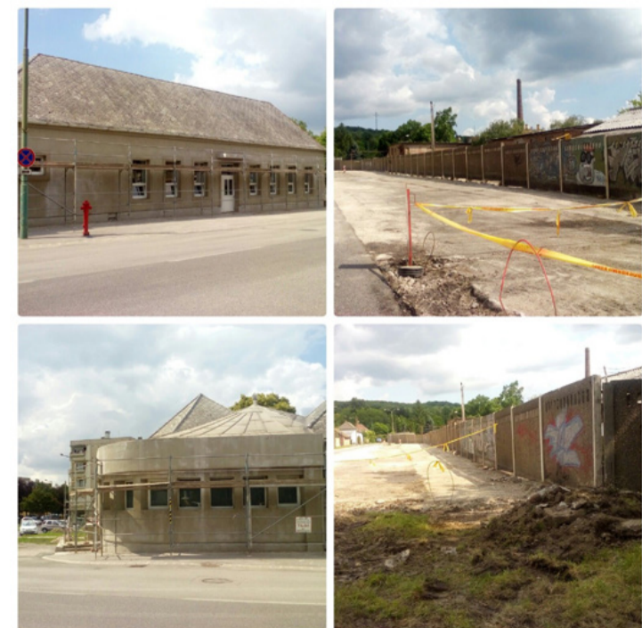
Látványos változások előtt a város