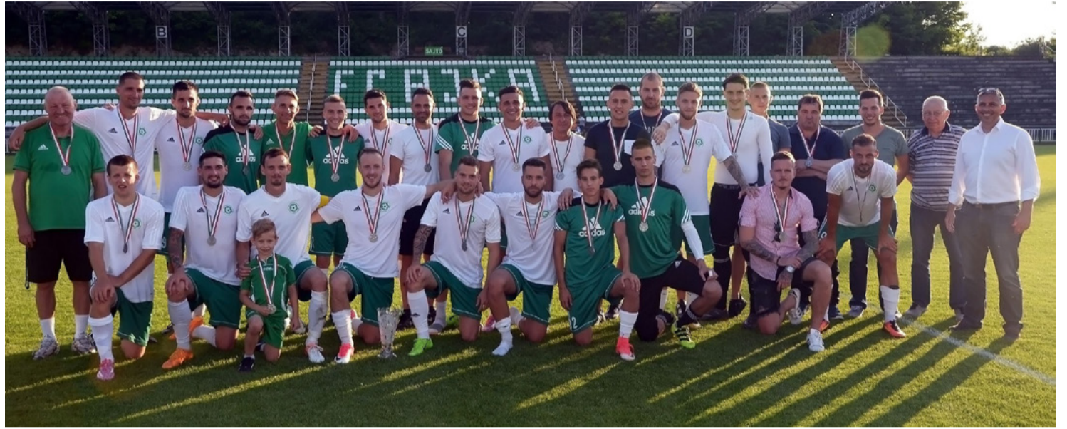
Búcsú a bajnokságtól