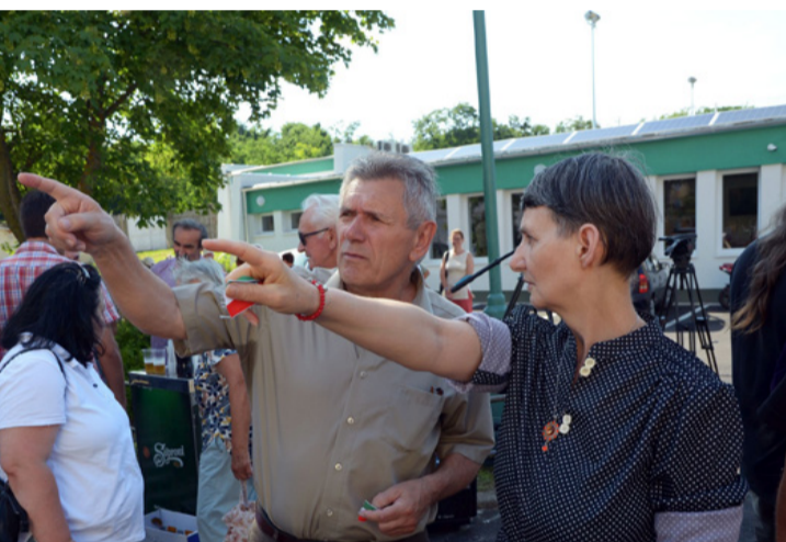
Összhangban a lakossággal