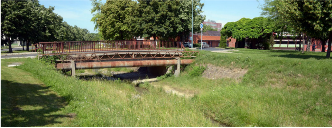
Ráfér a rekonstrukció