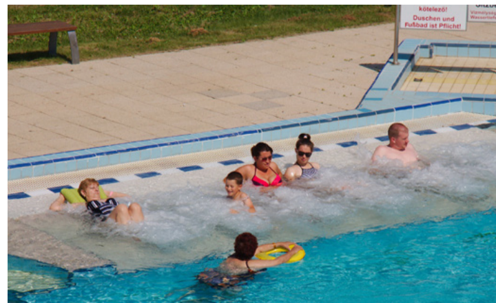
Itt a nyár!

Az első napon minden korosztály képviseltette magát, de sok volt a nyugdíjas és a kisgyermekes. Egy nagymama elmondta, hogy óvodás kiscikkkel nehéz az utazás, meleg van, elfáradnak, nem mindegy ezért, hogy pár kilométert kell csupán autózni, vagy több, mint fél órát a Balatonig. Itt van gyerekmedence, a fürdőzők be is tartják, hogy oda csak a 10 éven aluliak menjenek, az úszni tudókat úszómedence és