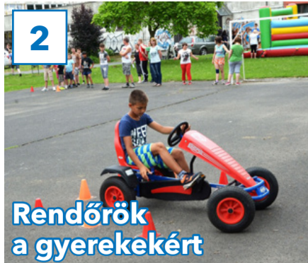
2 Rendőrök a gyerekekért

31. évfolyam, 20. szám, 2018. június 8., péntek