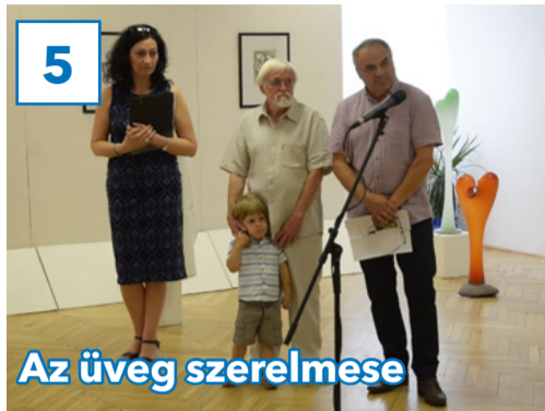
5 Az üveg szerelmese