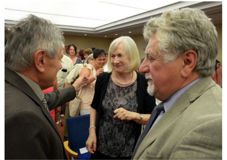
Ünneplők és ünnepelt

Kiemelt feladatának tekintti diákjai sikeres felkészítését a közép-, illetve emeltszintű érettségi vizsgákra és a felsőfokú tanulmányokra. Ezen túl a tehetséges diákokat folyamatosan készíti fel tanulmányi versenyekre, amit az országos eredmények és a sikeres egyetemi felvételik is alátámasztanak. Nagyon fontosnak tartja a tanulók érdeklődésének felkeltését és a kellő motiváció megteremtését, ezért a digitális eszközöket is rendszeresen alkalmazza óráin.