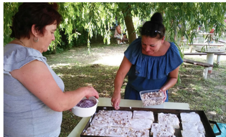
„Leőék” langalló készítés közben