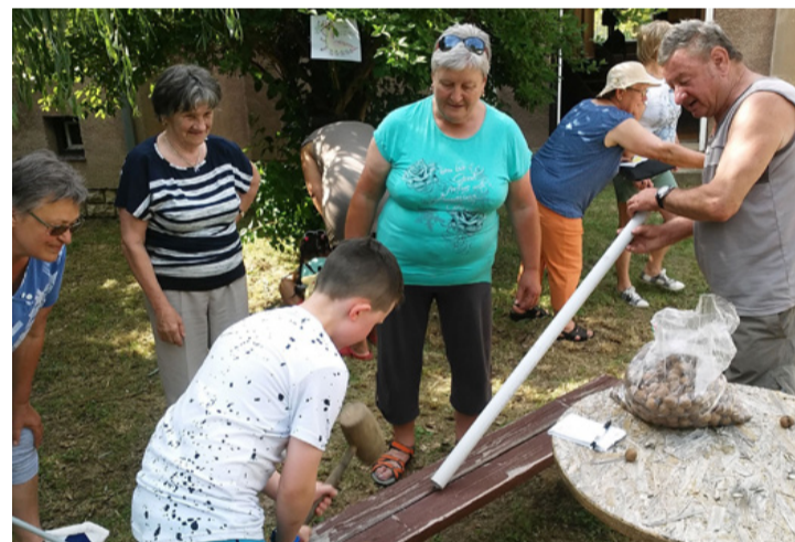
Együtt játszott idős és fiatal