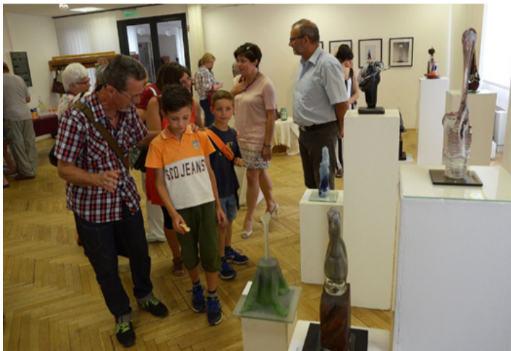
A szín, a forma és az anyag tökéletes harmóniája

később a marosvásárhelyi, majd 1986-tól az Ajkai Üvegyárban (ma már Kristály Kft). dolgozott formatervezőként, végül az Ajkai Múzeum igazgatója lett. A Magyar Üvegtervezési Társaság tagja, számos díj tulajdonosa. Egyéni és csoportos kiállításai vannak belföldön és külföldön egyaránt a városunkban élő képzőművészeknek, aki magyarpolányi műhelyében szerényen és alázattal alkot fáradhatatlanul. A széleskörű, sokoldalú munkássá-