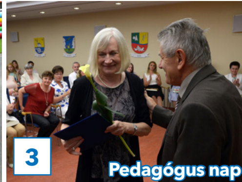
3 Pedagógus nap