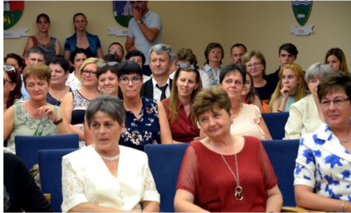
A pedagógus kar