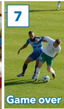
7 Game over