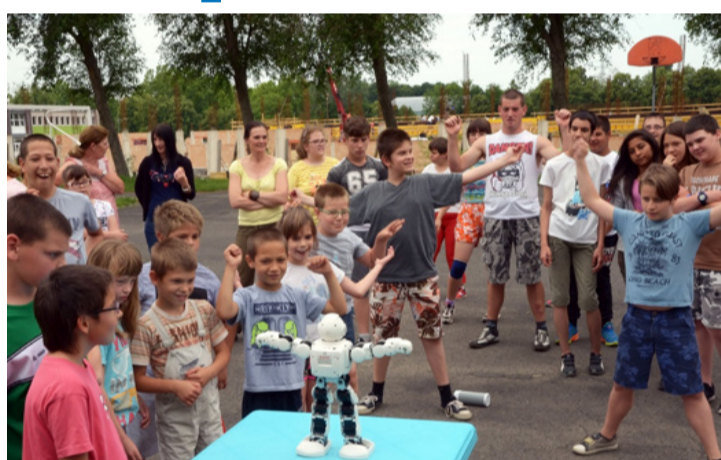
Népszerű volt a gyerekeknél is kisebb robot

– Nézzétek, ez igazi – kiabálták a fiúk. Majd kinyílt az ajtó, a rendőrök kiszálltak, a helyüket elfoglalták a gyerekek és még a szíréna is megszólalt. A fiatalok sokat kérdeztek. A fiúkat az autó végső sebessége érdekelte és az,