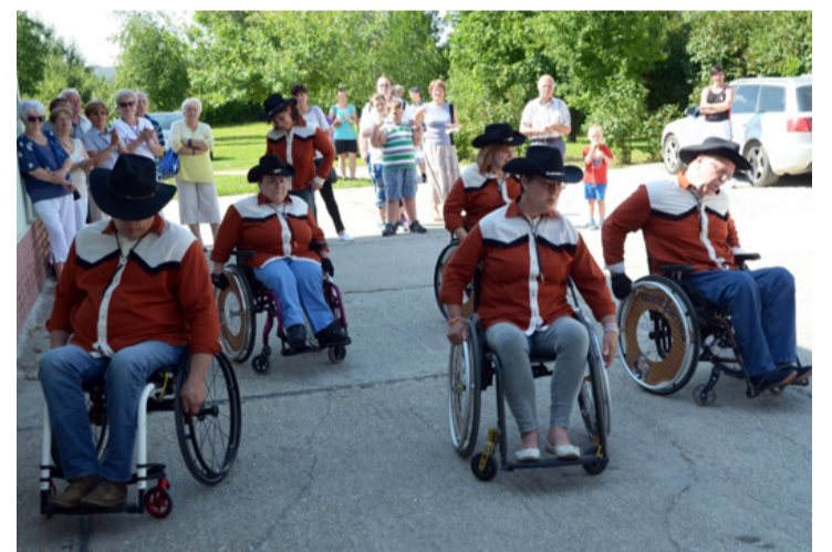
Most is nagy sikere volt a kerekesszékes táncosoknak

A rendezvény kezdetétől megtekinthették az érdeklődők