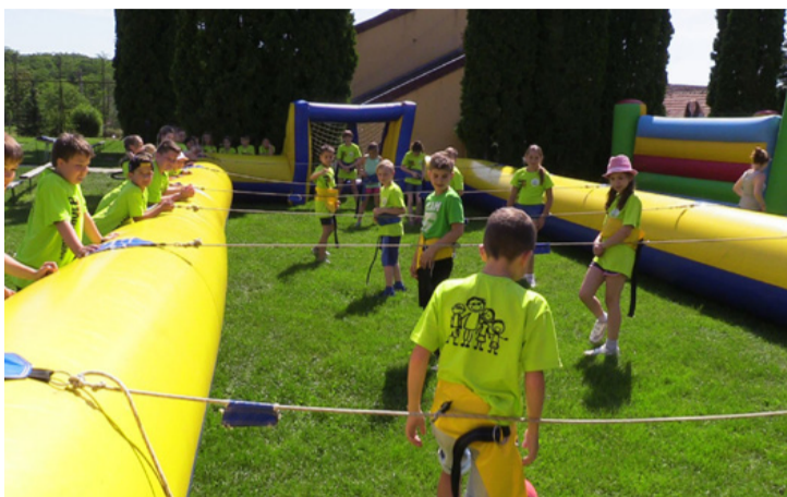
Különleges élményt jelentett az élő csocsó

■ Az ajkarendeki Laschober Mária Német Nemzetiségi Nyelvoktató Általános Iskolában már évek óta hagyomány, hogy június 1-én tartják a gyermeknapot. Bár az ideje egy kicsit más volt, mint az eddig megszokottak.