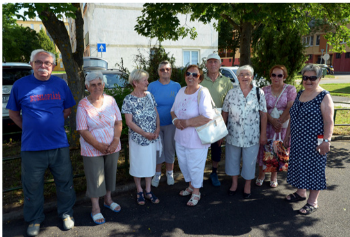
Értük van minden