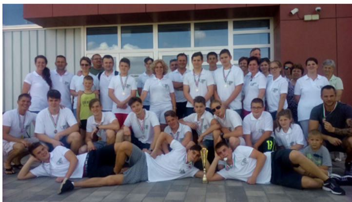
Az ezüstös csapat és a szurkolótábor