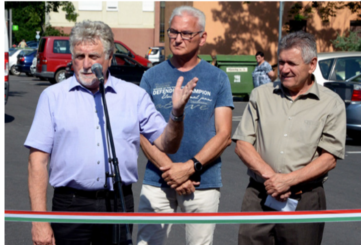
A fejlesztéssel az ingatlanok is értékesebbé váltak

program, ha a társasházak költségeik 50 százalékát át vállalja. Az elmúlt években a 7200 társasházi lakásból több, mint 6000 megújult, de a fennmaradók is megkapják a lehetőséget a fejlesztésekre. A Házunk tája programban az önkormányzat akkor rendezti a házak környezetét, ha azok már megújultak. Így a most átadott beruházást megelőlegezték, amely 15 millió forintba került. Az önkormányzat folyamatosan kéri a lakosok véleményét, hogy mire volna