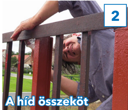
A híd összeköt

31. évfolyam, 22. szám, 2018. június 22., péntek