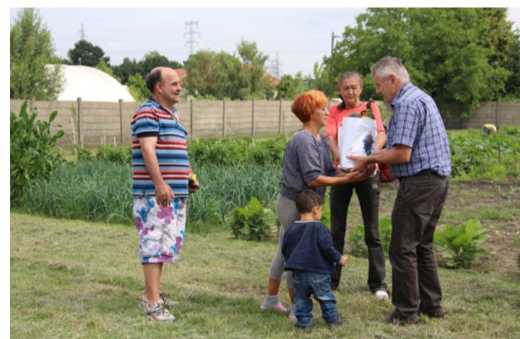
A nehéz helyzetű családok mostantól rendszeresen kapnak felajánlásokat