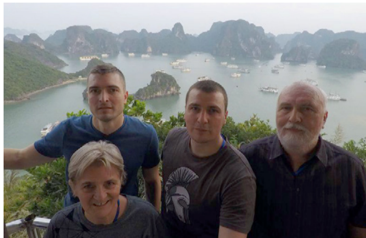
Dukánék egy mesés háttér előtt