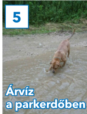
Árvíz a parkerdőben