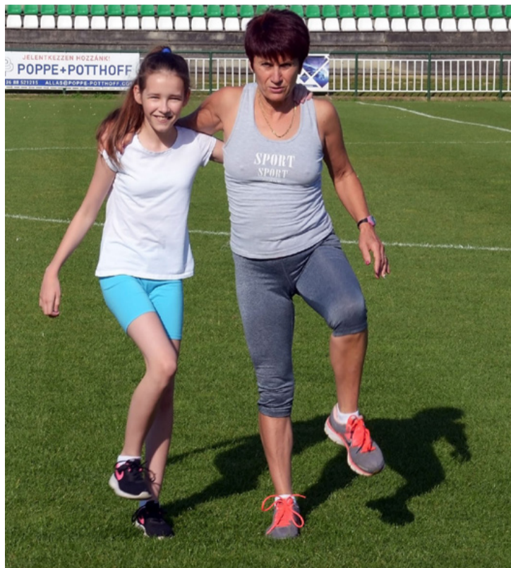
Nem csak a bábukát kell megmozgatni

Ezekben a napokban a fehérországi rapid- és vilámsakk világbajnokságon szoríthatunk kedvenc ajkai