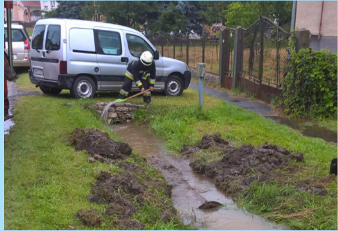
A vízelvezetés szakmai kérdése

Az Ajka Város Önkormányzatának kezelésében lévő közutakhoz történő csatlakozás kiépítésének vagy átépítésének szándékát az Ajkai Közös Önkormányzati Hivatal Építési- és Városgazdálkodási Irodája felé írásos kérelem formájában egy egyszerű rajzmelléklettel kell jelezni. A hivatal által adott hozzájárulás tartalmazza az adott területre jellemző sajátosságok figyelembevételével elvárt műszaki paramétereket, amelyek biztosítják a szélsőséges időjárási viszonyok ellenére is a megfelelő működést. Az engedélyeztetési eljárás rövid átfutású és díjmentes.