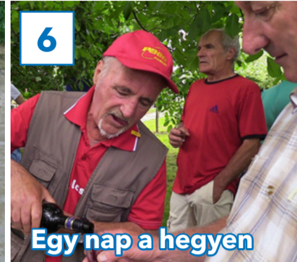
Egy nap a hegyen