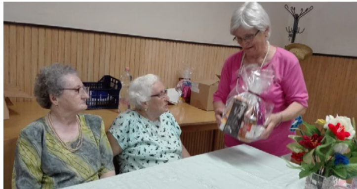
Ketten együtt 170 évesek

A június eleji foglalkozáson köszöntötték az első félévben névnapjukat ünneplő tagokat is. A köszöntéseket követően mindenki megkínálta a saját maga készítette süteménnyel a társait, majd beszélgetéssel telt a délután.