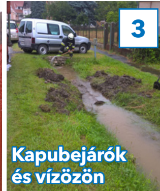
Kapubejárók és vízözön