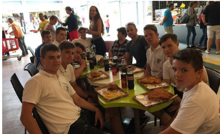
Meccs után jöhet a jól megérdemelt kalória

– Az emberelőnyös védekezésünk egyaránt sokat javult, bár így a szezon végén már éreztem