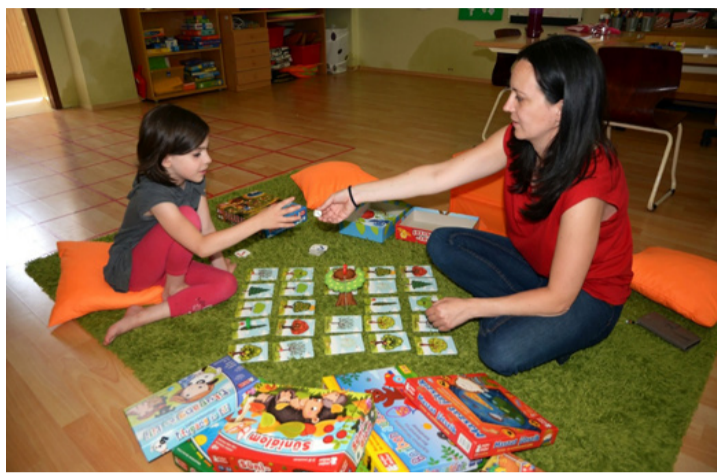
Teszt, és önfeledt játék együtt jár

Magyarországon többnyire még mindig tartja magát az a