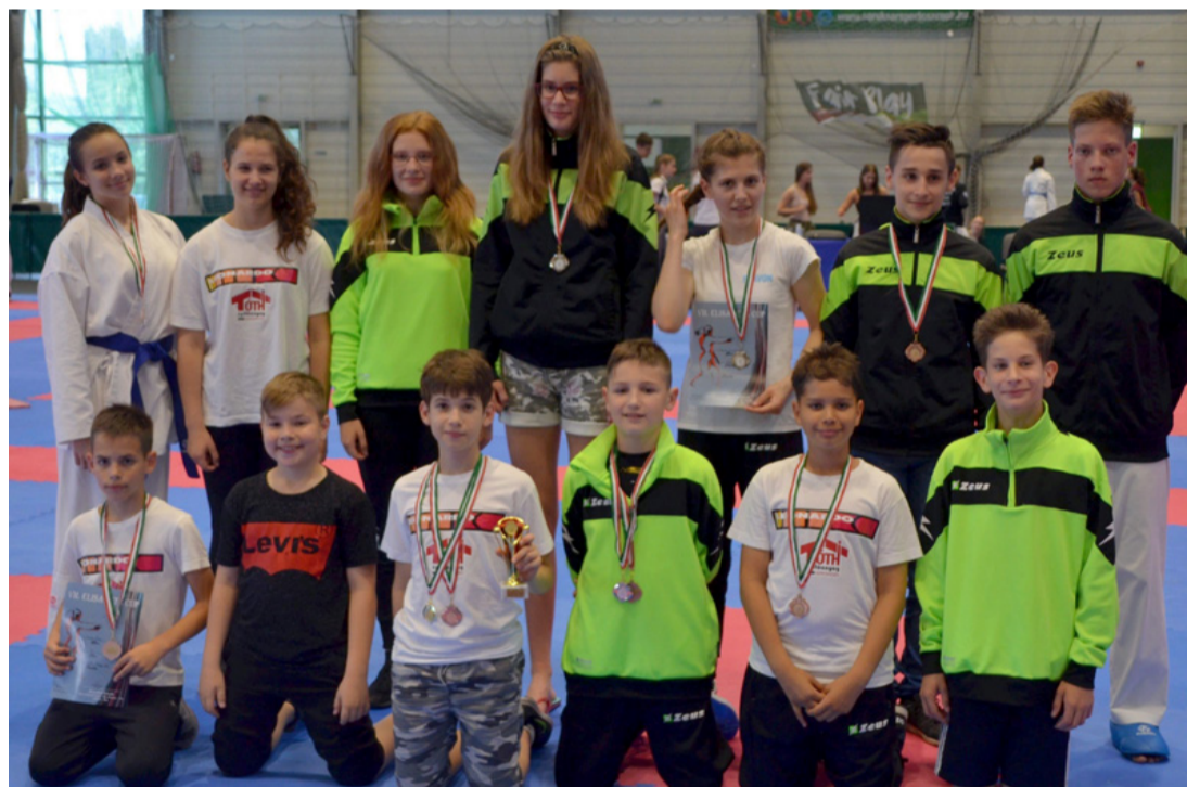
Éremesével zárt a karate csapat

csapata bejutott a Magyar Kupa négyes döntőjébe, amit szombaton rendeznek Egerben. A fináléban az ajkaiak a Győrrel, a Szegeddel és a Ferencvárossal csapnak össze. A Kristály a döntőbe jutásért az NB I-es Bábolnát kettős győzelemmel búcsúztatta. A négyes élén vég-