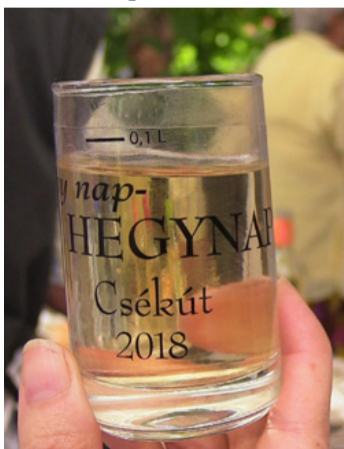
A hegy leve