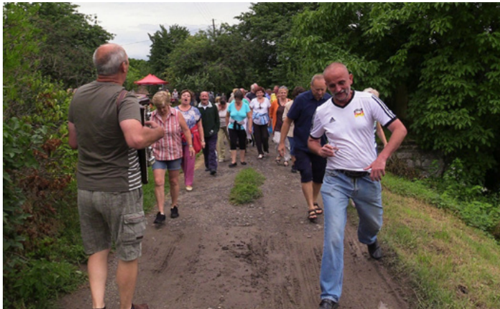
Hegybejárás harmonikaszo mellett