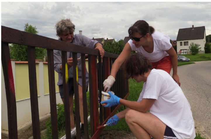
Önkéntesek festik a hidat