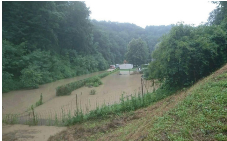
A parkerdőben szinte minden évben van árvíz