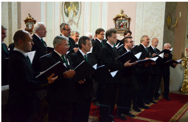
A templomért énekeltek