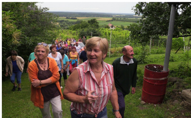
Hegybejárás az Ajka60 szellemében