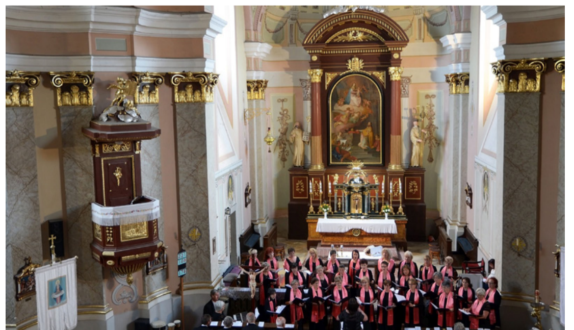
Méltán tartják a környék legszebb templomának