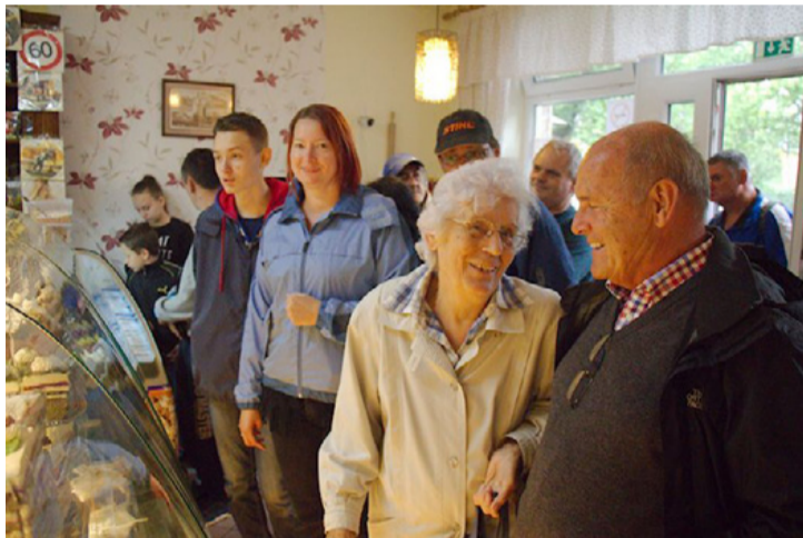
A program a cukrászdában végződött