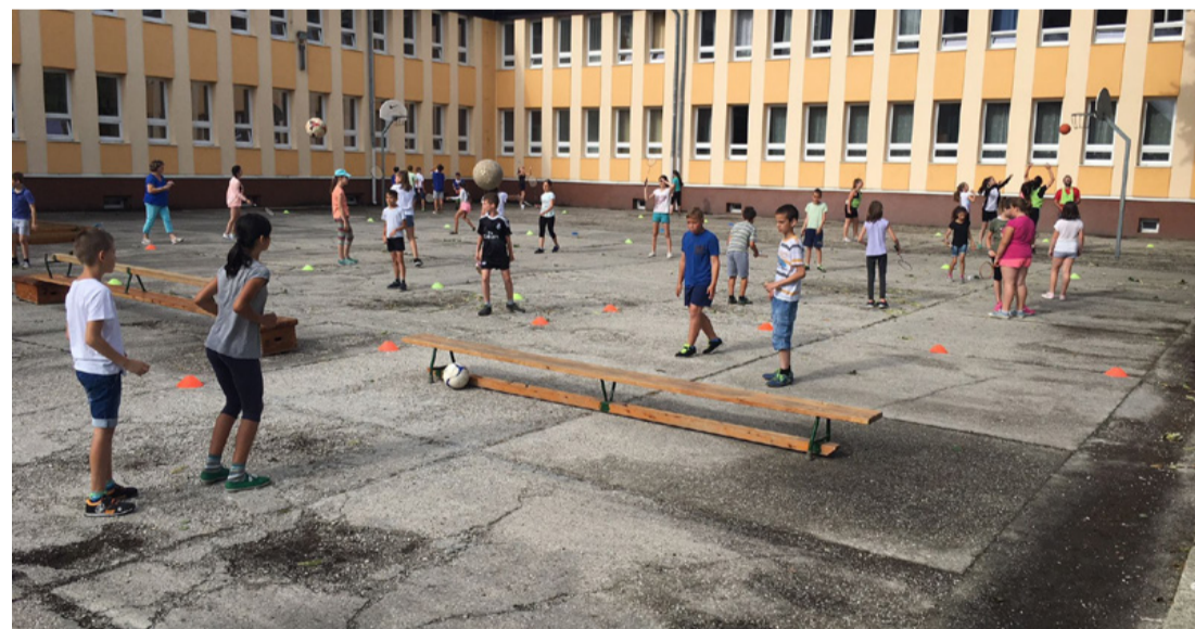
A sport kikapcsol, szórakoztat és mások megismerésére is jó