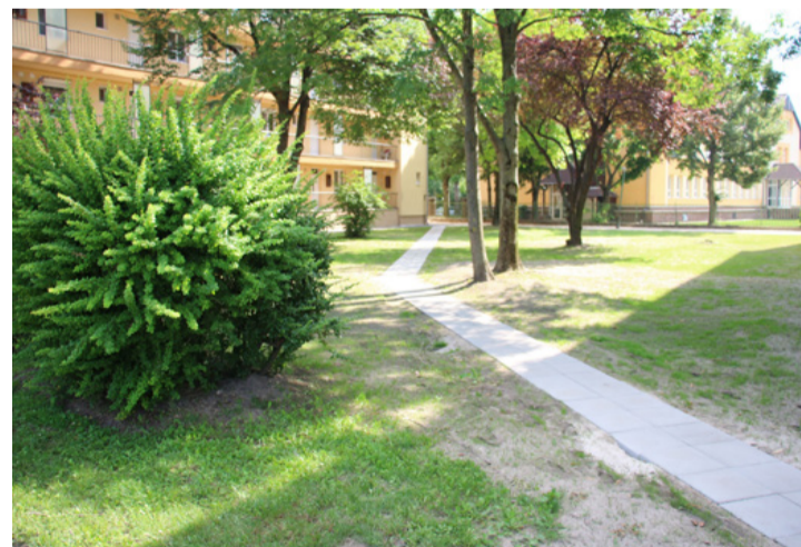
Járda oda kell, ahol az emberek járnak