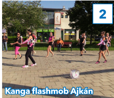
Kanga flashmob Ajkán

31. évfolyam, 23. szám, 2018. június 29., péntek