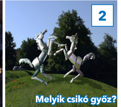
Melyik csikó győz?