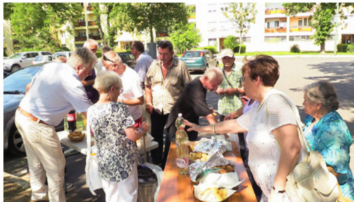
Az átadó ünnepségen szokás szerint megvendégelték a résztvevőket

■ Újabb nagyszabású beruházást adott át az önkormányzat, azonban most nem egy parkolót, vagy felújított járdaszakaszt avattak. Ezúttal komplex beruházásnak örülhettek a Sport utca 7. 9. 11. és 13. számú épületek lakói.