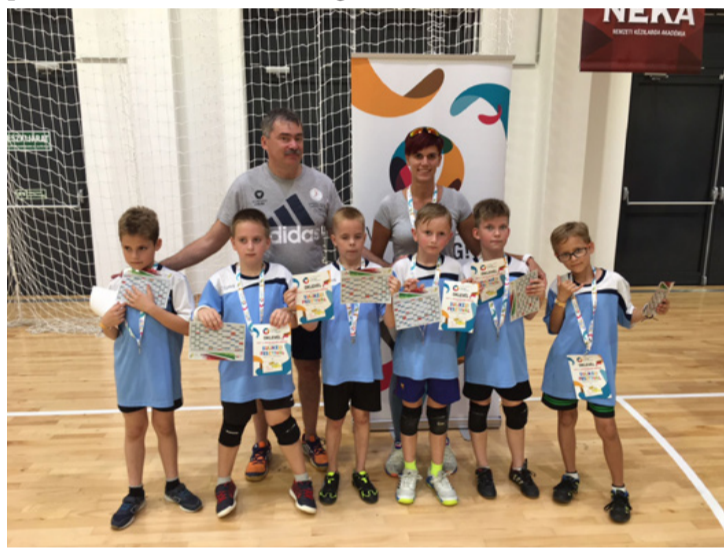
Tavaly óta heti két edzésük van