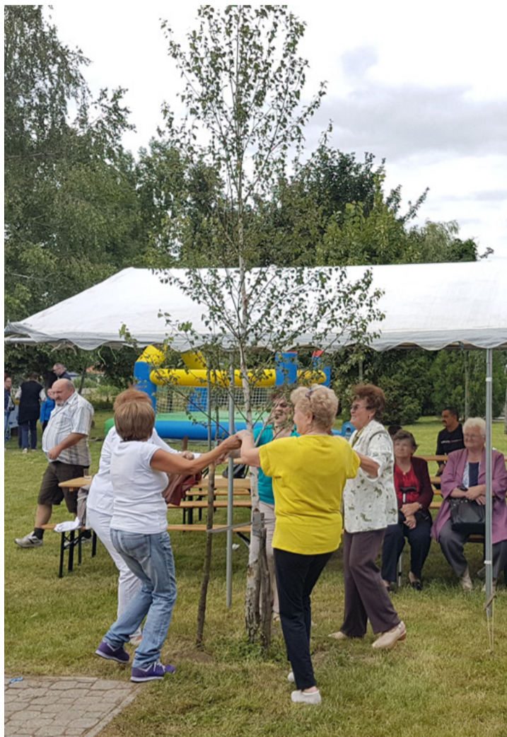
Kitáncolták a májusfát is