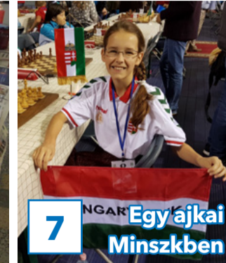
Egy ajkai Minszkben