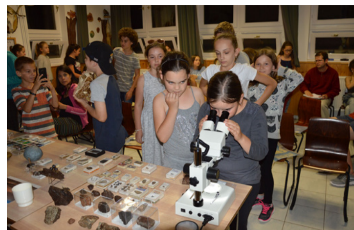
Vajon melyikük lesz csillagász?