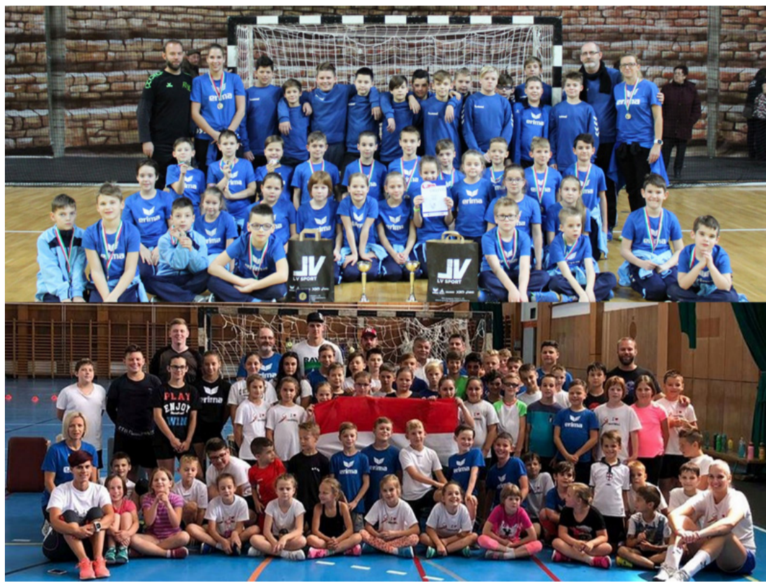
Egy „családi fotó” az egyesületről