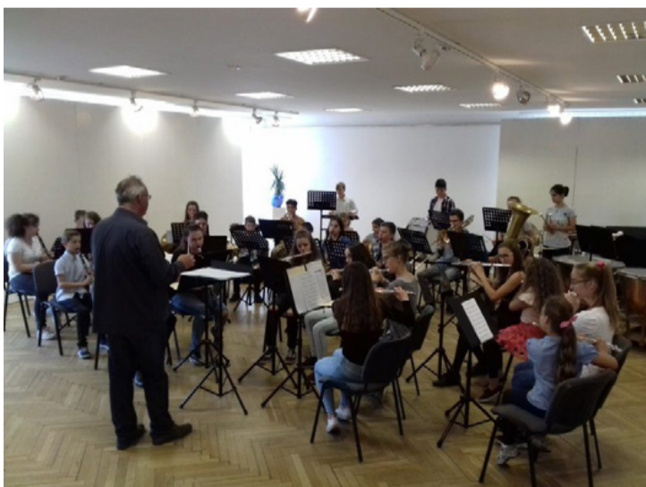
A zene összeköt