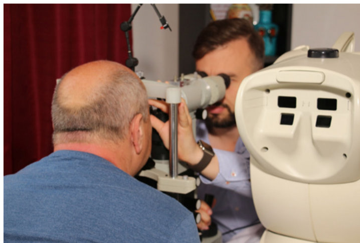
A kép melyik része életlen?