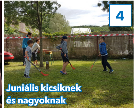
Juniális kicsiknek és nagyoknak