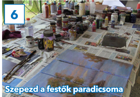
Szepezd a festők paradicsoma