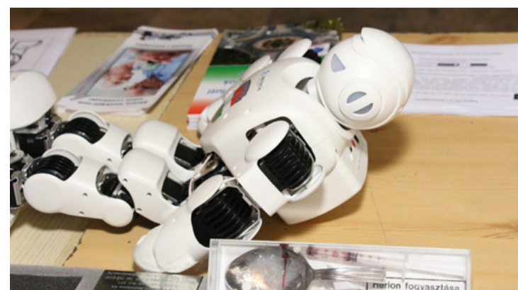
Addig jó, míg csak a „robotzsaru” dől ki tőle