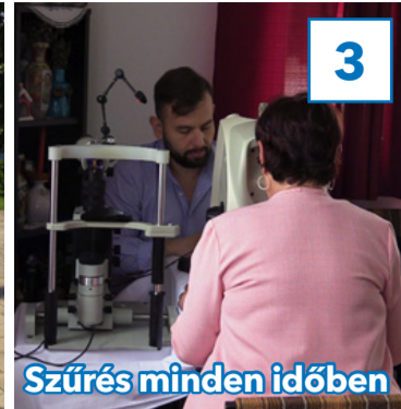
Szűrés minden időben