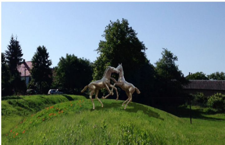
A műalkotások terveit Dienes Attila készítette