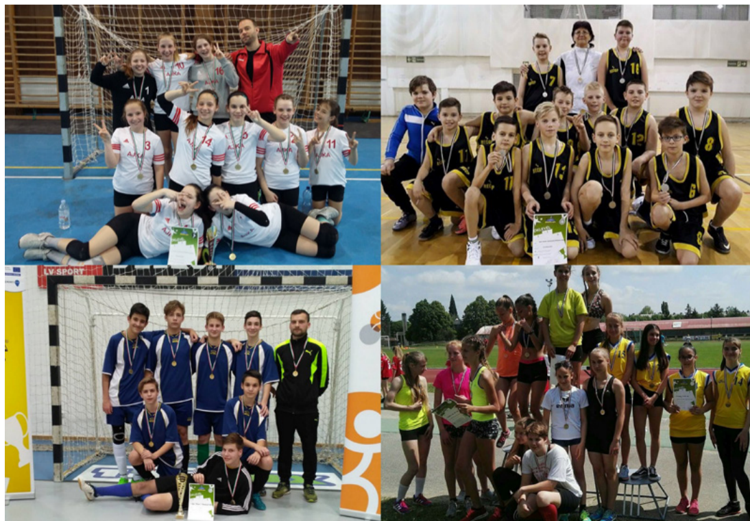
Az iskolában népszerű elfoglaltság a sportolás