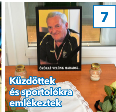
7 Küzdöttek és sportolókra emlékeztek