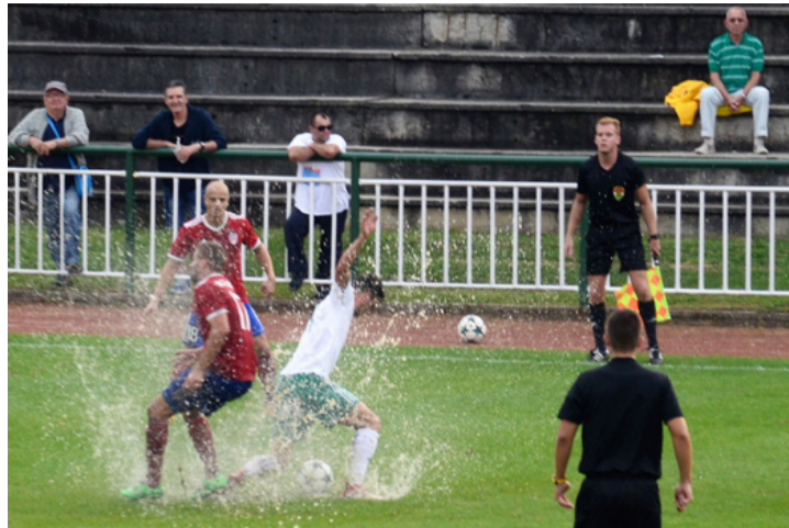
Már megint az a vízibalett

■ Az FC Ajka és a Kristály is betalált a 92. percben legutóbbi két mérkőzésén. A hajrában esett gólok néha fontos pontokat értek, máskor csak a kegyelemdőfést adták meg.