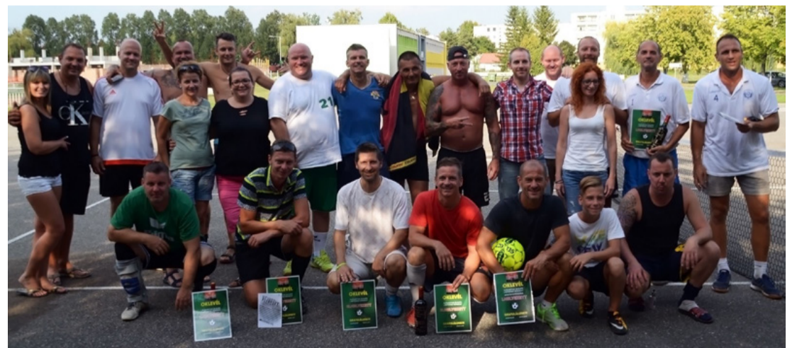
A lábtenisz hagyomány legfőbb ápolói

A szervezők szeptember 23-ig várják a jelentkezéseket az egyre nagyobb népszerűségnek örvendő versenyre. Nevezni a Tova-Futók honlapján, elektronikusan lehet, helyszíni nevezés nincs!