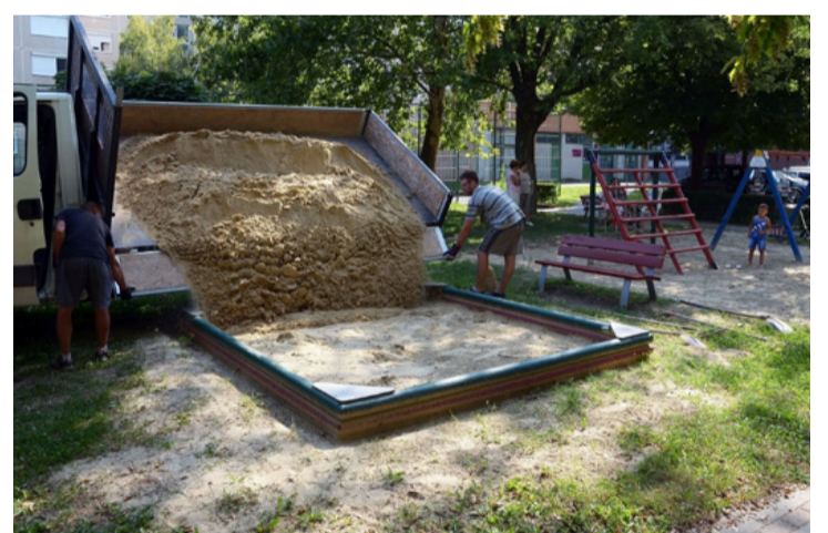
Az önkormányzat nagy figyelmet fordít a játszóterekre

A játszóterek karbantartása abból áll, hogy összeszedik a környéken a szemetet, fellazítják a talajt, felkapálják a homokozót. Ha jön egy vihar, egy nagy eső, az ezt a munkát tönkreteszi – akár