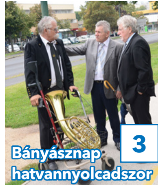
3 Bányásznap hatvannyolcadszor