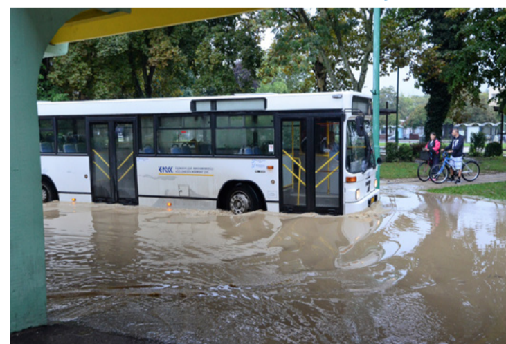
Víz alatt az ajkai autóbusz pályaudvar