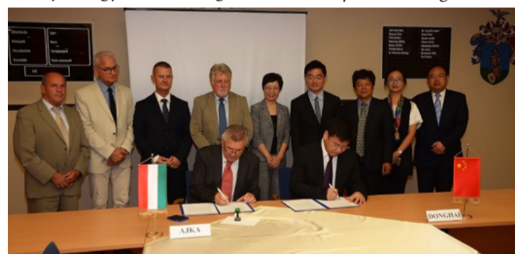
A testvérvárosi egyezmény aláírása

később pedig a szakemberek képzése, vagy a humán erőforrás fejlesztése képezhetné az együttműködés főbb területeit, de van lehetőség a kultúra, vagy a turizmus terén is szorosabb kapcsolatra, ha megismerjük egymás erősségeit.