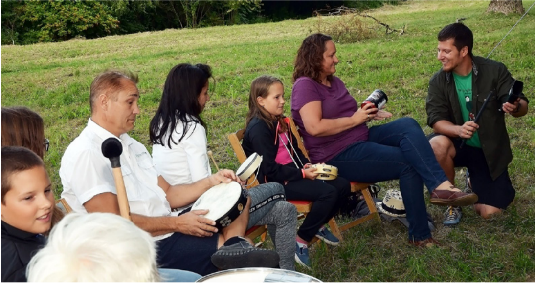
Szinte észrevétlenül repült az idő