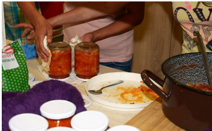
A vegyszermentes tartósítás alapja a hőkezelés