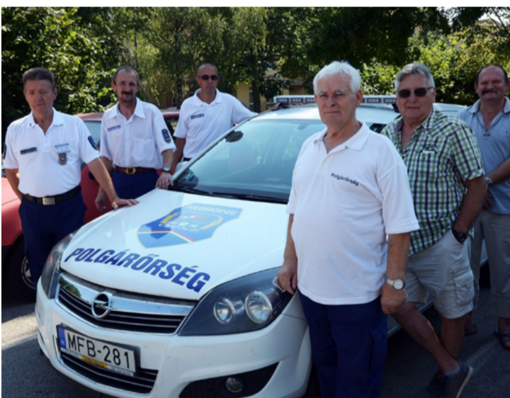
A polgárőrök szinte mindenre figyelnek