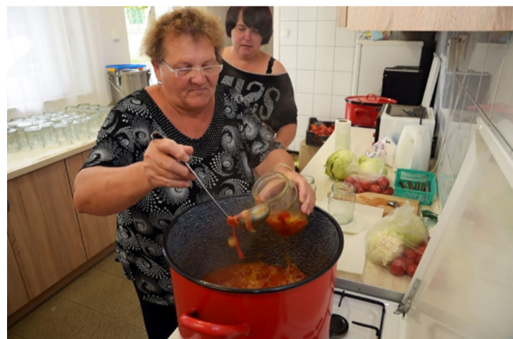
Végy öt liter lecsót – az eltevés fortélyai