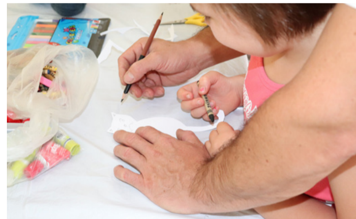
Segítő kezek ölelésében

Kézműveskedés nélkül nem igazi egyik játszóház sem és