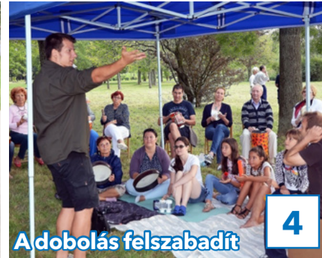
4 Adobolás felszabadít