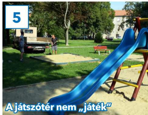
5 Ajátszótér nem „játék”