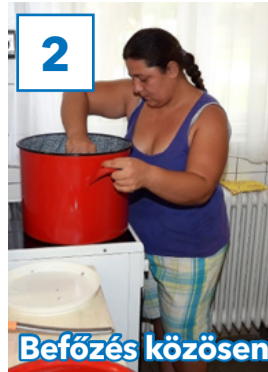
2 Befőzés közösen

31. évfolyam, 29. szám, 2018. szeptember 7., péntek