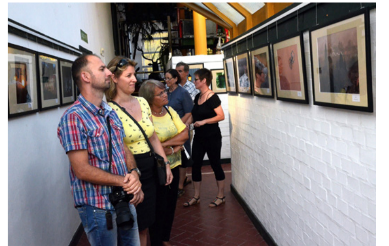
Három év terméséből láthattunk válogatást