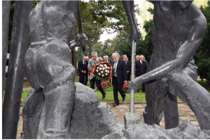
A bányászok és a bányászok emlékére

■ Szerencse fel, szerencse le, ilyen a bányász élete - hangzott fel a hétvégén a Bányászhimnusz városzserte. A bányásztársadalom legnagyobb ünnepe 1951 óta minden év szeptember első szombatján a bányásznapi. Ajkán már pénteken délután megkezdődtek a megemlékezések. Elsőként a Bányászati Aknamélyítő Vállalat kopjafájánál koszorúztak a csingeri Bányászati Múzeum udvarán, majd Padragkúton a bányaiüzemi emlékműnél folytatódott a program.