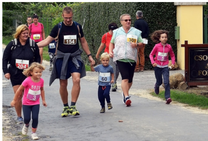
Kicsik és nagyok együtt futottak