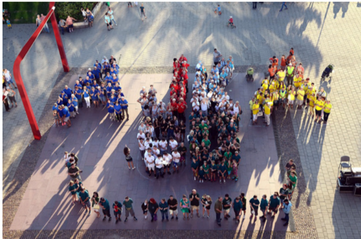
Egy „gigaszmájlí” az utókornak