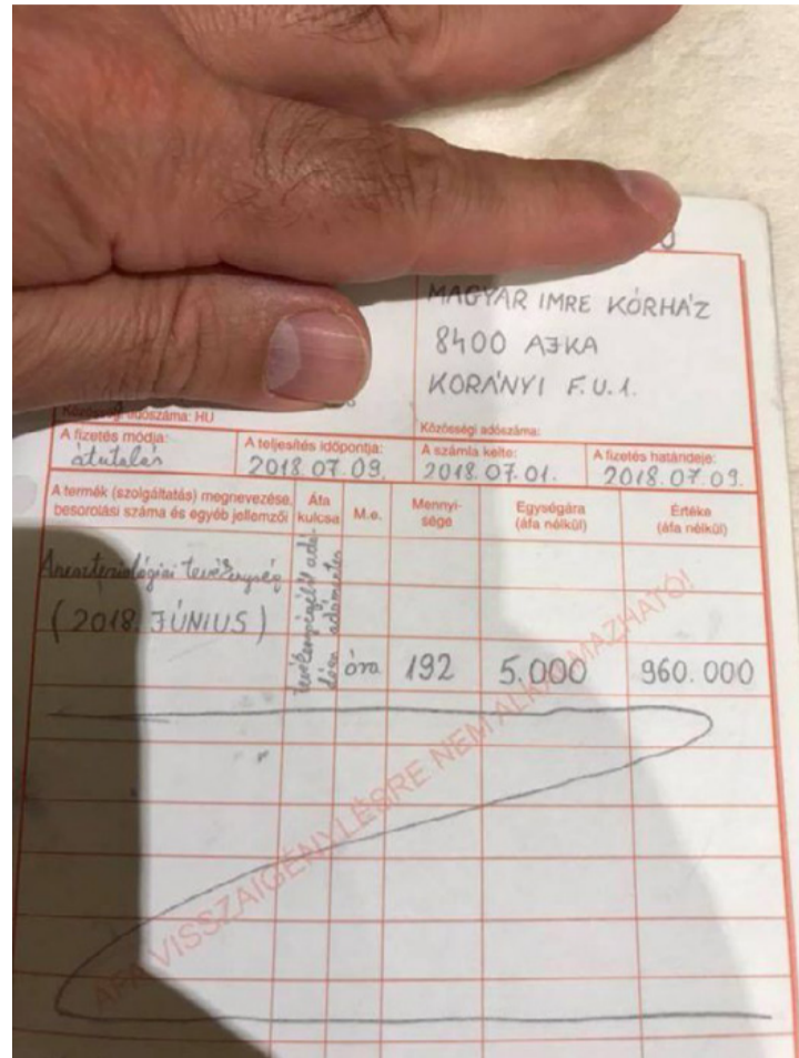
Az első példány a kórház könyvelésében található

szakápoló a közösségi médiában az alábbi véleményt fogalmazta meg az ajkai helyzettel kapcsolatban: „...az ajkai kórház és az egészségügyben felmerült helyzetet látva, ismerve, ex résztvevőként talán hiteles leszek: 1972-ben átadtak egy akkor országosan is nagy méretű kórházat ami, korát megelőzőnek számított mérete és modernsége miatt. Nagy létszámú, jól képzett személyzettel, komoly szakmai munka révén, kimagaslóan működő osztályok a közel százezer területet profi módon látták el. A társ szervek munkájának támogatásával minden területen zökkenő-