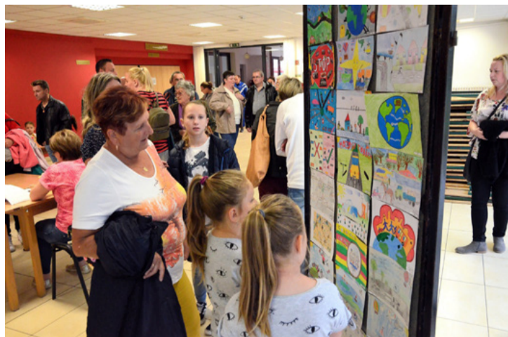
A színes rajzok sok-sok fantáziáról tanúskodtak

A képviselő elmondta, hogy a városban jelentős a kerék-