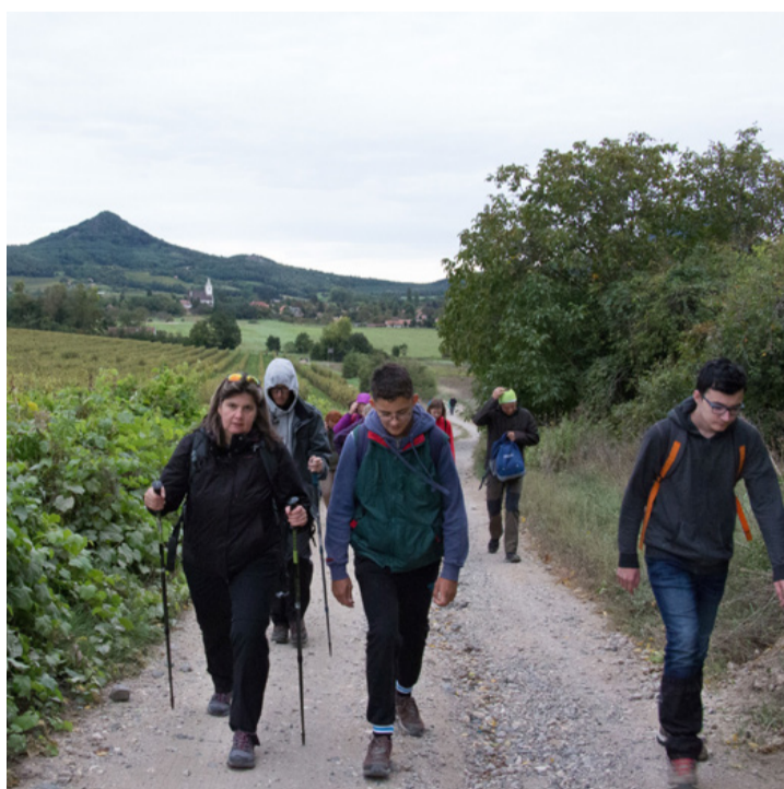
Mindenért kárpótol a csodás panoráma

A vár több irodalmi alkotás ihletadója is volt, írt róla Kis János, Vachot János, Jókai Mór és Kisfaludy Sándor is.