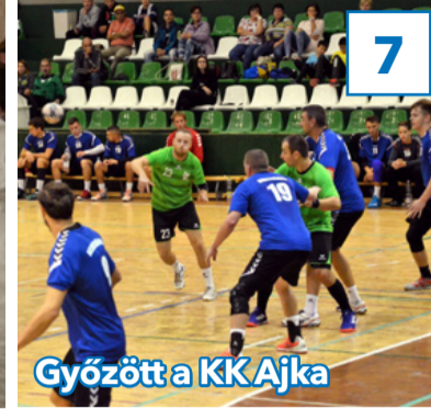
Győzött a KK Ajka