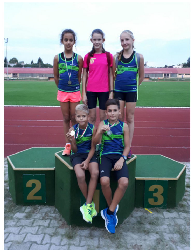
A TovaFutók eredményes versenyzői

Ötödik alkalommal rendeznek nagyszabású duetlon versenyt városunkban, amelyre az egész országból érkeznek sportolók. Vasárnap a rendezvény ideje alatt útlezárásokra kell számítani.