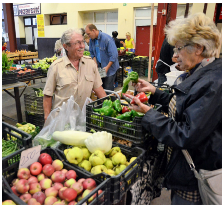
Őszi árúbőség az ajkai Vásárcsarnokban

Az árusok gondolnak az elfoglalt háziasszonyokra is, ezért dióbelet, mandulát, mogyorót tisztítva, mákot fél