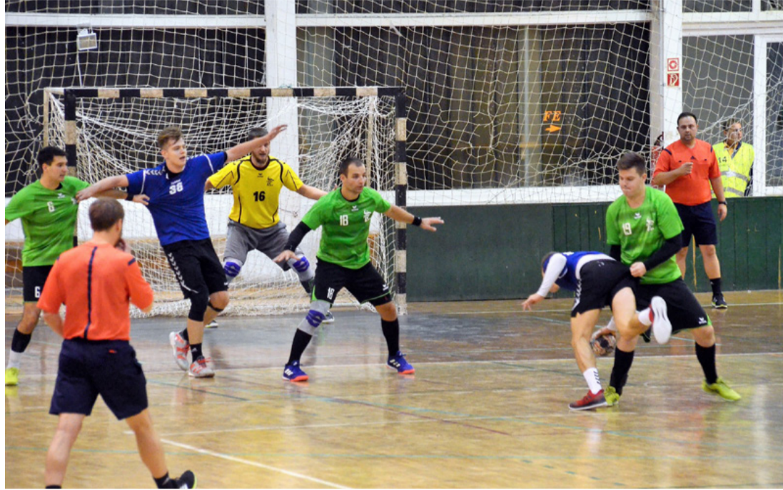
A Le Bélier-Nemesvámos mérkőzés egyik izgalmas pillanata