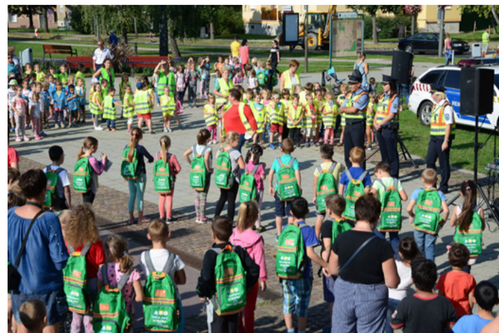
A KRESZ-szel való ismerkedést sem lehet elég korán kezdeni