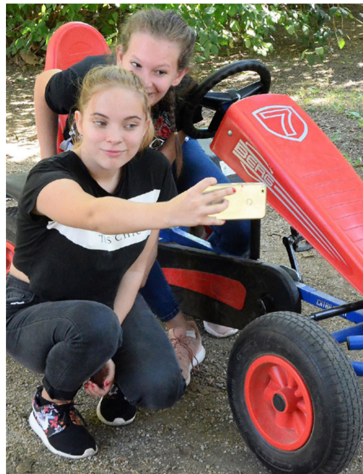
TA ■ Szelfivel az egészséges környezetért

A Borsos ökoiskola, amelynek nevelési tervében kiemelten szerepel a környezettudatosság, a fenntartható fejlődés. A rendezvény kezdetén osztályonként felírták, melyik diák mivel érkezett az intézménybe, majd kresz tesztet tölthettek ki a tanulók a sportos kihívások mellett.