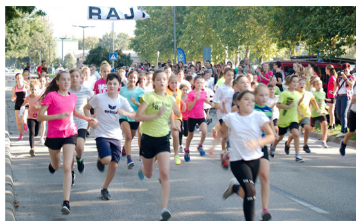
A futás felszabadító élmény