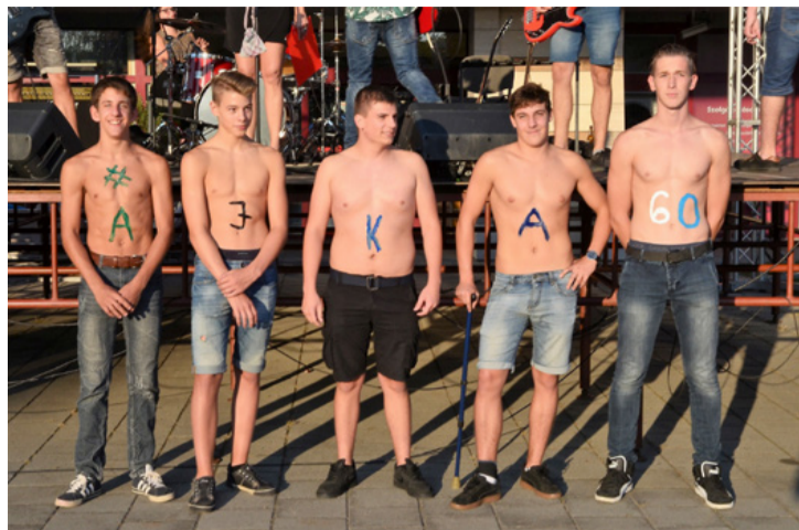
Pólósok – póló nélkül

A Bio Rock Company – Szeretlek Ajka című számmal úgy tűnik megszületett a város kissé bohém, reggae stílusú himnusza, amiről va-