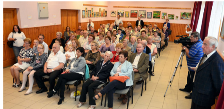
Az érdeklődő bakonygyepesiek