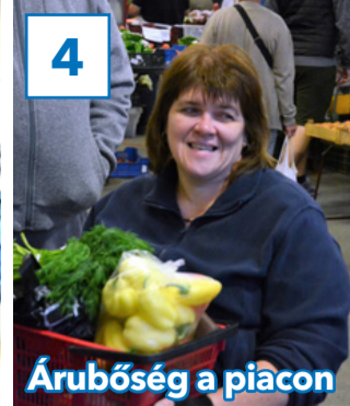
Árubőség a piacon