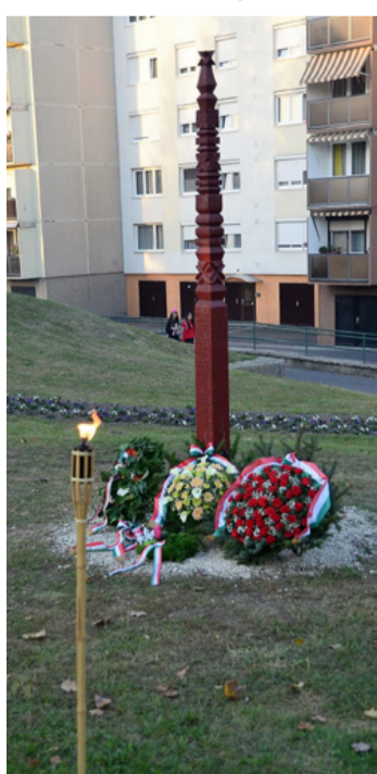
Emlékmű a panelek árnyékában