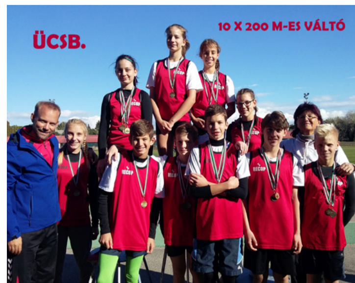
Az egyik győztes csapat

A 10x200 méteres váltófutásban, amelyen öt fiú, és öt lány képviselte az ajkai intézményt fő-