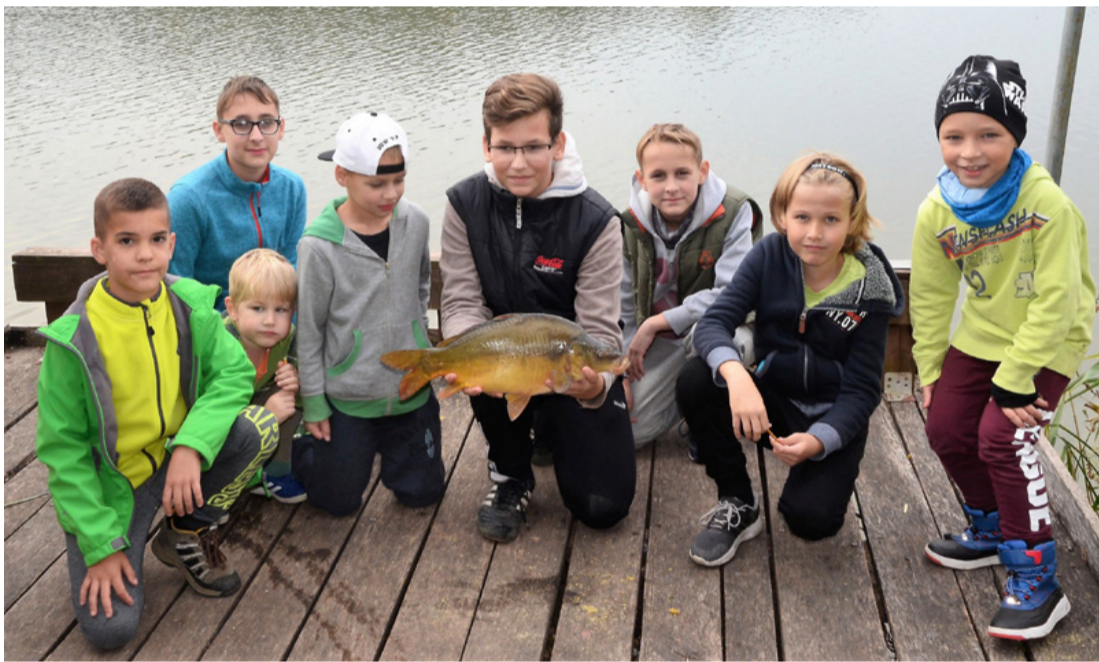
A jövő horgásza már ma is horgásznak