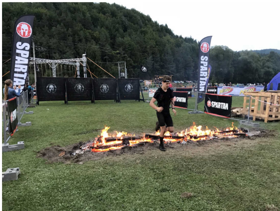
A Spartan Race-en extrém körülményekkel is meg kell küzdeni

A Spartan Race lényegében egy katonai (vagy előre kialakított) akadálypályán, katonai jellegű akadályokkal lebonyolított futóverseny, ahol az extrém körülményekkel (sár, víz, kosz, hideg) is meg kell küzdenie az indulóknak. Több kategória is létezik és nincs időkorlát. Azt mondják, hogy aki egyszer elkezd és megéri a Spartan életérzést, az garantált, hogy vissza fog térni újra és újra, hiszen megszállottságot okoz. A kemény akadályok leküzdése nemcsak fizikailag, hanem mentálisan is megterhelő lehet, ezért aki sikeresen túllép rajtuk, annak folyamatosan újabb adrenalin löketet adnak. Ezeket a versenyeken fiatalok és idősek egyaránt kipróbálhatják rátermettségüket és felismerhetik határaikat, érdekesség, hogy az amerikai megmérettetésen a testi fogyatékosok is képviselik magukat. Érdemes barátokkal indulni először, hiszen a verseny egy nagy buli is egyben.