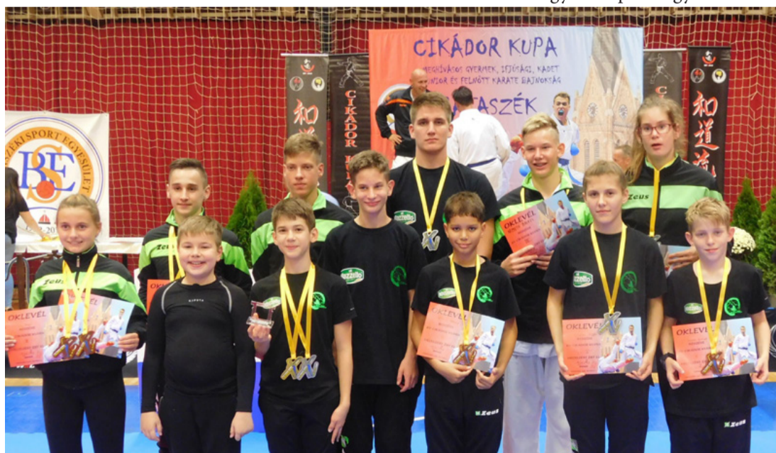
Ajka büszke lehet rájuk