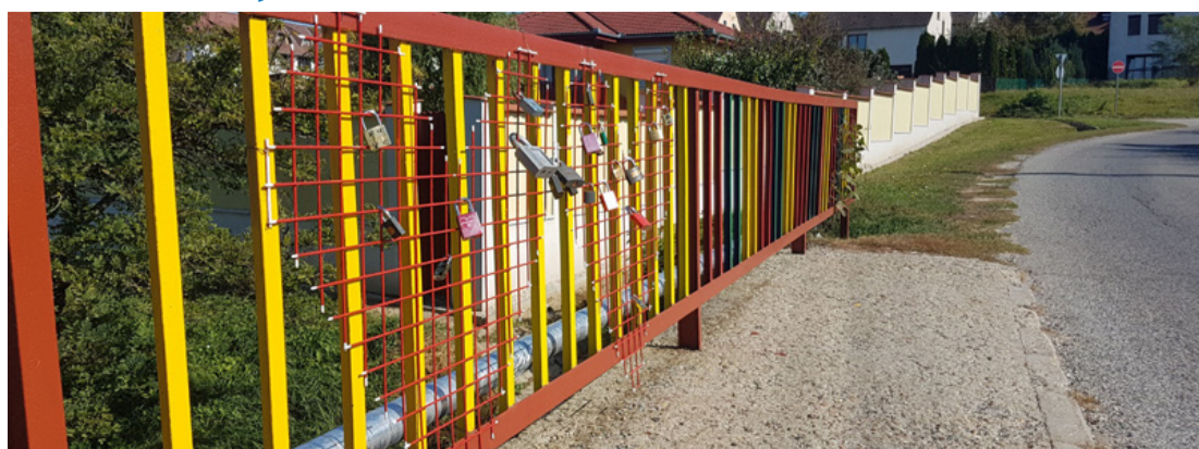
Van még hely...