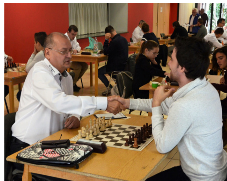
A végén ki nyújtja a kezét...?