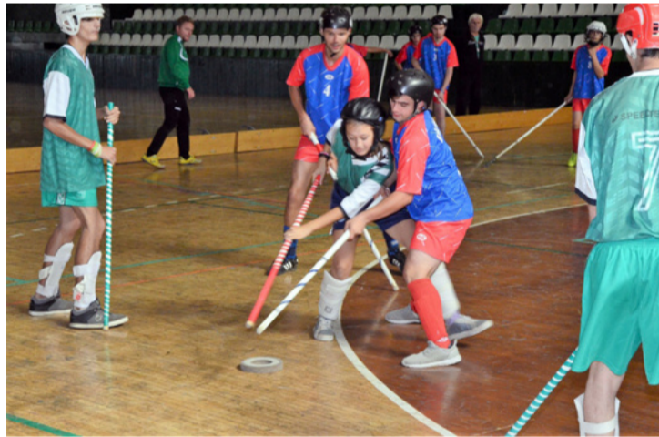
A padlöhoki küzdelmes sport