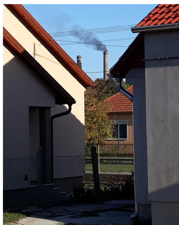
Ahol a füst, ott a korom is?