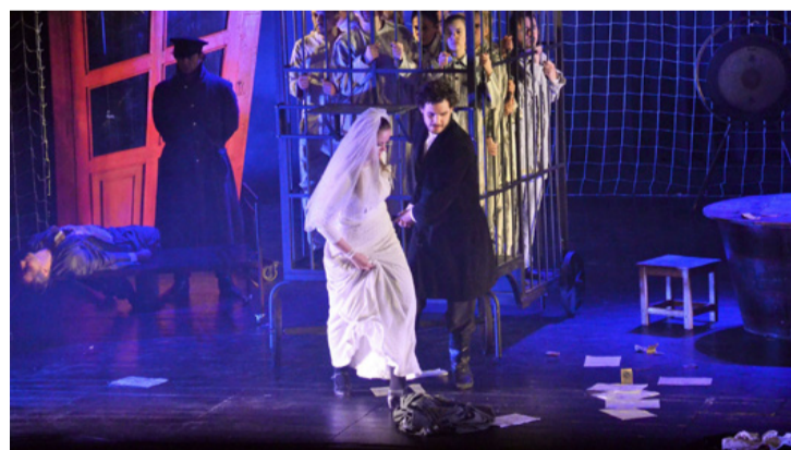
Az előadás szuggesztív jelenetek sorozata

A lélektanilag hiteles mű eseményei Péterváron játszódnak, a XIX. században. Főhősünk, Raszkolnyikov, szegény egyetemista, aki jogásznak készül. Kirúgják az egyetemről, nagy nyomorban él. Gyilkosságot tervez, amit precíz előkészít: tanulmányt ír a bűnről, előre kipuhatója a helyszínt, terepszemlét tart, majd végrehajtja