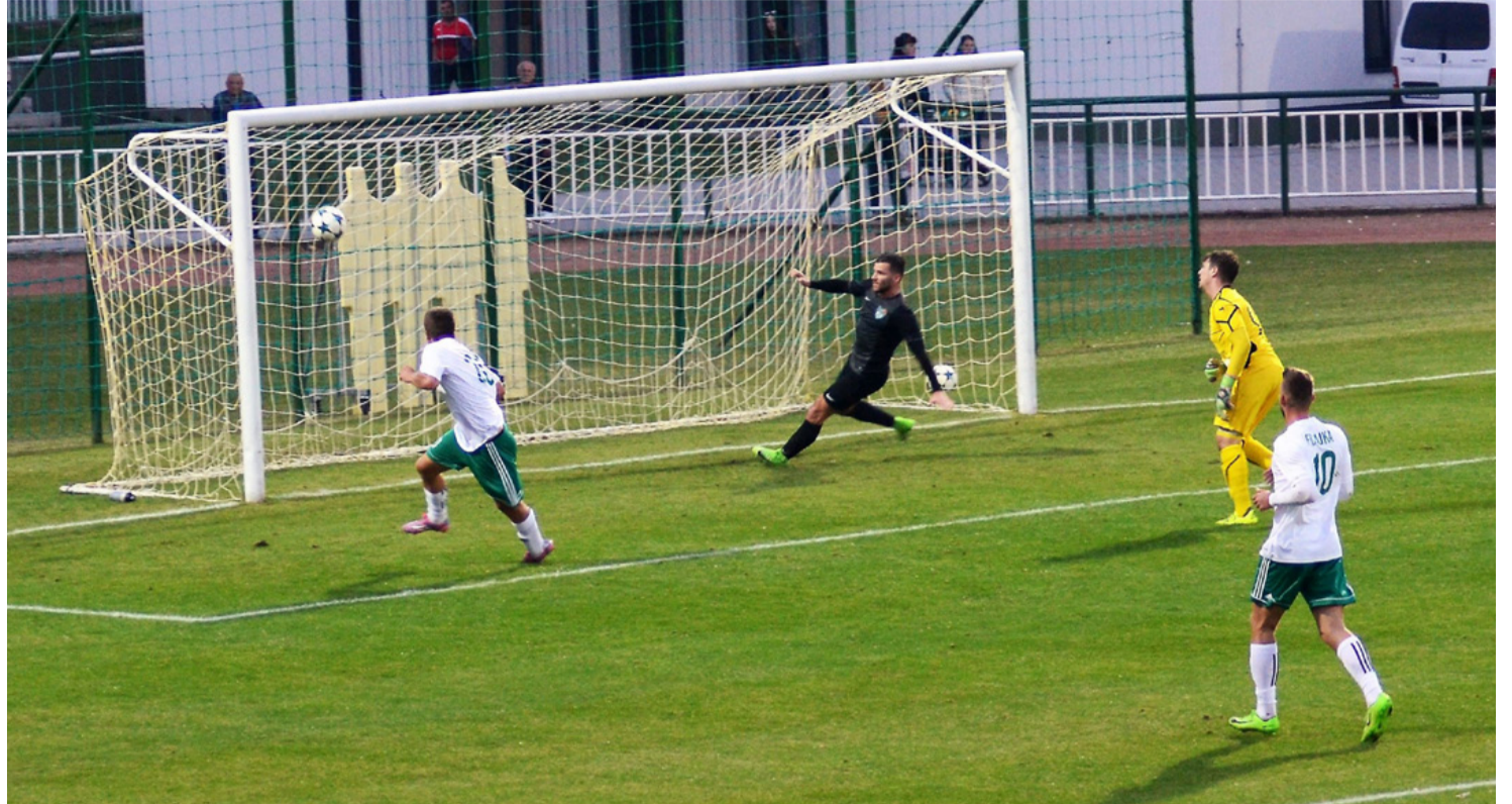
Az Érd ellen „kötelező” volt a győzelem