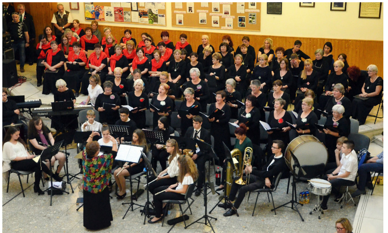
Éljen a muzsika!