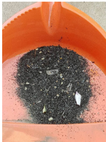
A reggeli „termés”

ós programjának részleteibe beavathassa őket és felmerülő kérdéseikre válaszolhasson. Azt Vollár Attila sem tagadja, hogy hullik a korom Ajkán, bár kevesebb, mint mondjuk egy évvel ezelőtt. Sajnos a koromhullásnak technológiai okai vannak, elavult berendezéseket örökölték, amelyek korszerűsítése folyamatban van. Vonatkozik ez az égési folyamat tökéletesítésére és a füstgázok