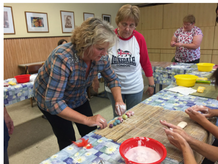
A nemezéléssel egyszerű, de sok ága-boga van

A technika amilyen ősi, olyan egyszerű. Ám meglehetősen időigényes. A klubtagok egy lapított gömbékszer elkészítésére vállalkoztak. A festett gyapjuszálakat meleg víz és szappan segítségével tömörítették össze kemény, gömb alakú textíliává, majd szappanos vizet csurgattak