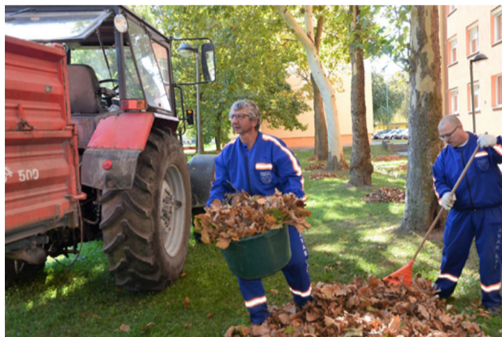
A munkák elvégzéséhez kézi erő is kell