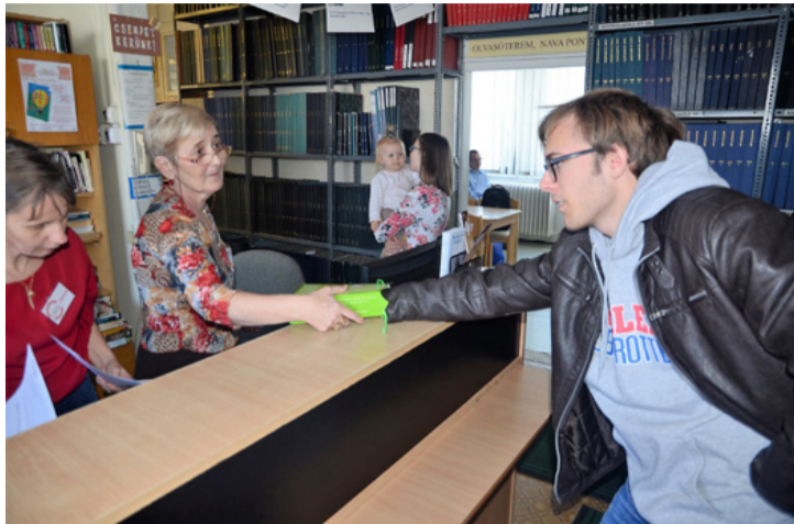
A sorsolás izgalmas pillanatai