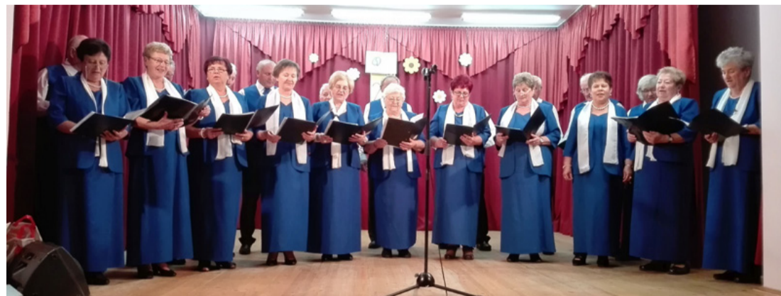
Az est fénypontja volt az énekkar fellépése