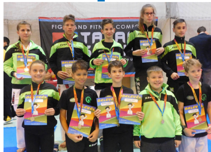
Jól szerepelt a karate csapat a budapesti tornán

Közel háromszázan voltak kíváncsiak a Le Bélier