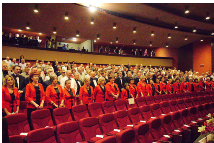
Százak ünnepelték a kórust