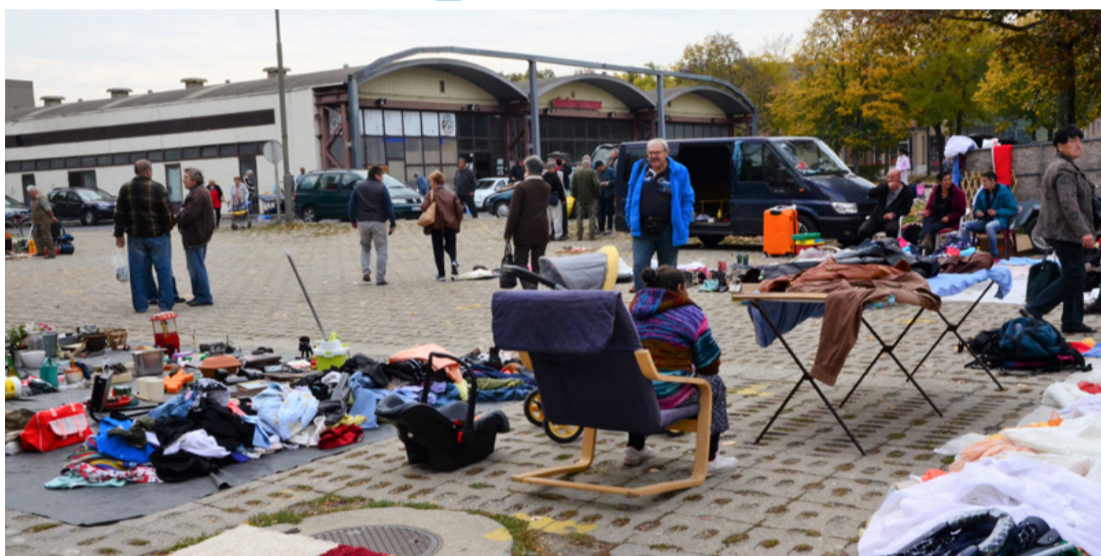
Májustól már egységes asztalokról árusíthatnak, távolabb a lakóházaktól