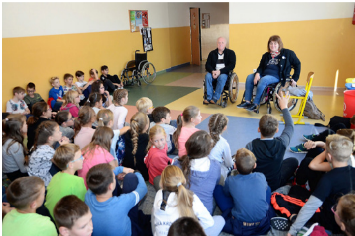
Andréát ismerősként üdvözölték a gyerekek

■ A tósokberéni Szent István Király Római Katolikus Általános Iskola alsós osztálytermeiben rendhagyó foglalkozásokat tartottak október 12-én. A kisdíjak Esélyegyenlőségi nap keretében ismerhették meg a hallássérülteket, a mozgáskorlátozottakat és a látássérülteket életét.