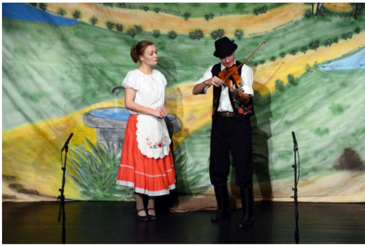
Így kell lefőzni „Mága Zolit”