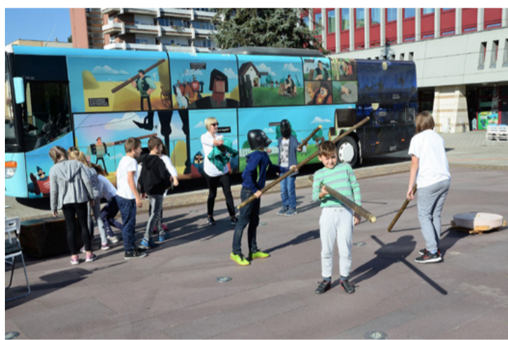
A petrencés rúd nagy kihívás volt mindenkinek