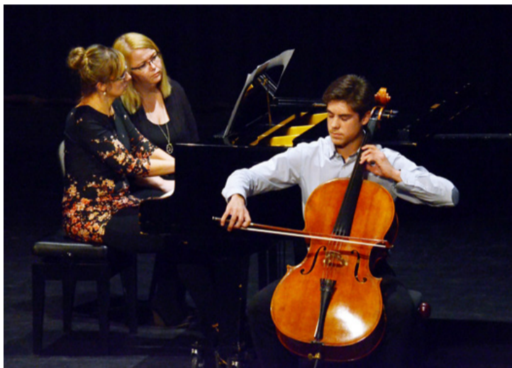
Áhítat zongorán és gondolkán elmesélve