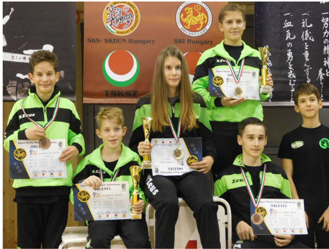
Az egri sikercsapat