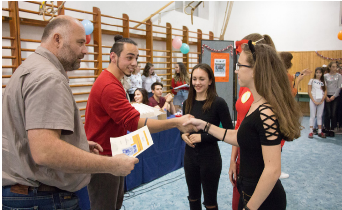
A versenyben a 9. A volt a legjobb