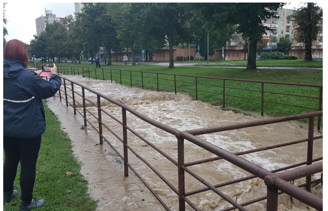
A patakából tó lesz és nem fog kiönteni