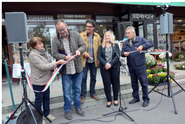
Az átadás jó hangulatban zajlott