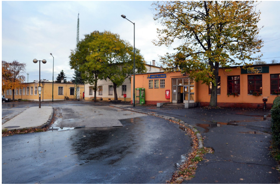
Az állomásépület is a régi lesz!