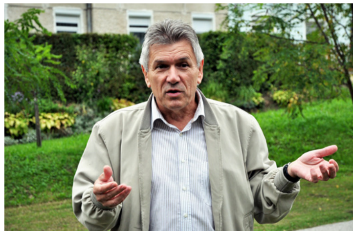
Kérem az ajkaiak türelmét, meg fogja érni...