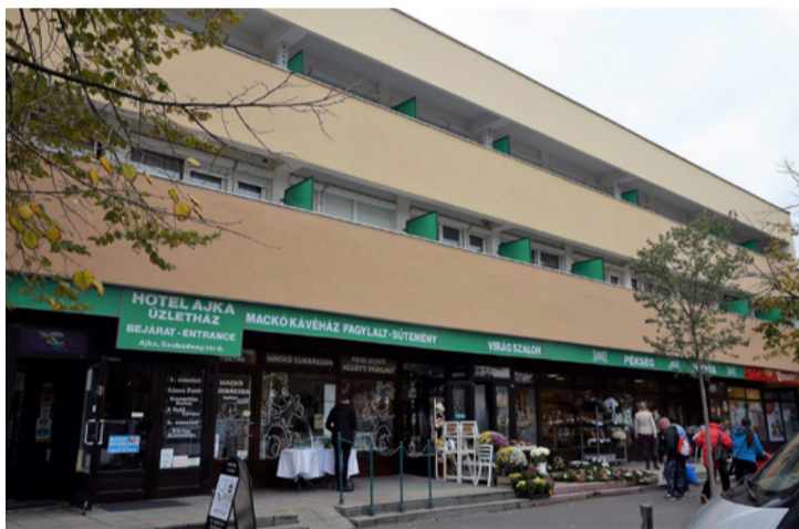
A Hotel homlokzata már megújult