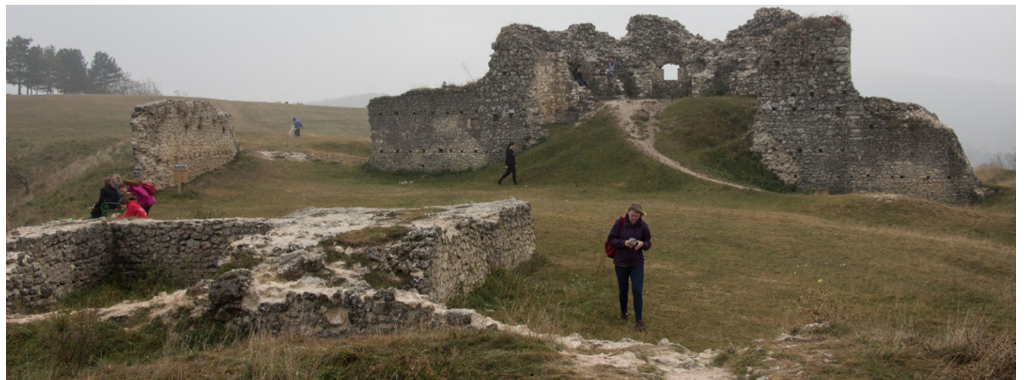
Szarvaskő vára – ma is impozáns látvány