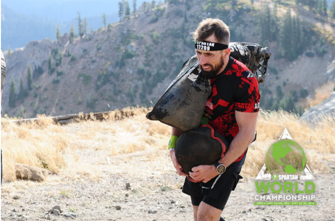
Lehet utána csinálni