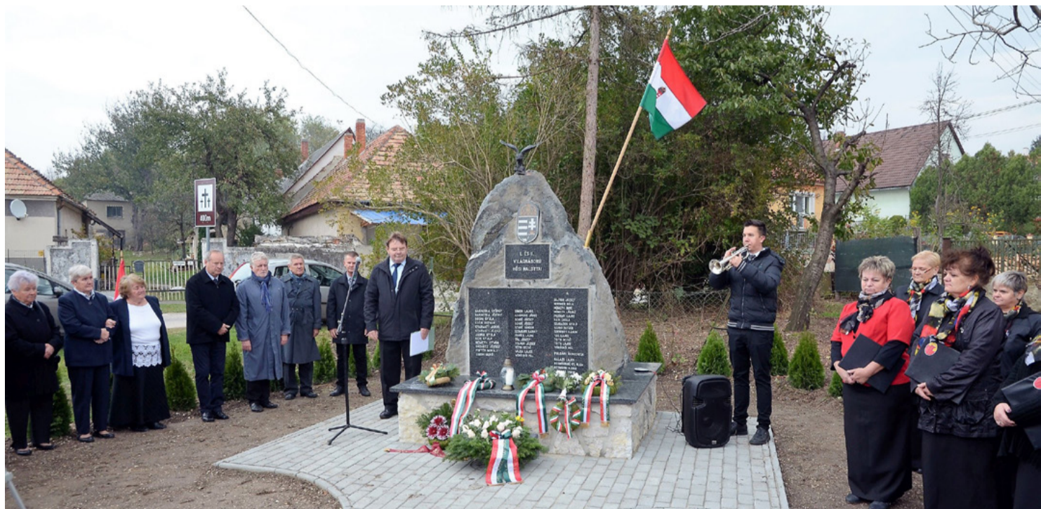
Búcsúzóul az II. Silenzio szólt