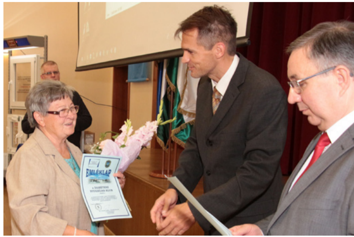
Az ajkai Diabetesz Klub régóta segíti kortársait

A Veszprém Megyei Rendőr-főkapitányság színvonalas rendezvényen Pogány Péter rendőr ezredes, a Veszprém Megyei Rendőr-főkapitányság bűnügyi rendőrfőkapitány helyettese köszöntötte a megjelenteket. Beszédében elhangzott, hogy az országban elsőként Veszprém megyében indult el az önkéntes bűnmegelőzési kortárs program 2011-ben, melyben évről évre egyre több személy vesz részt. Dr. Hatala József, a Nemzeti Bűnmegelőzési Tanács elnöke köszöntőjében kiemelte, hogy a kortárs segítőhálózat Veszprém megyében működik a legnagyobb létszámban, tagjai az elmúlt 3-4 évben kiváló eredményt értek el a bűnmegelőzés területén.