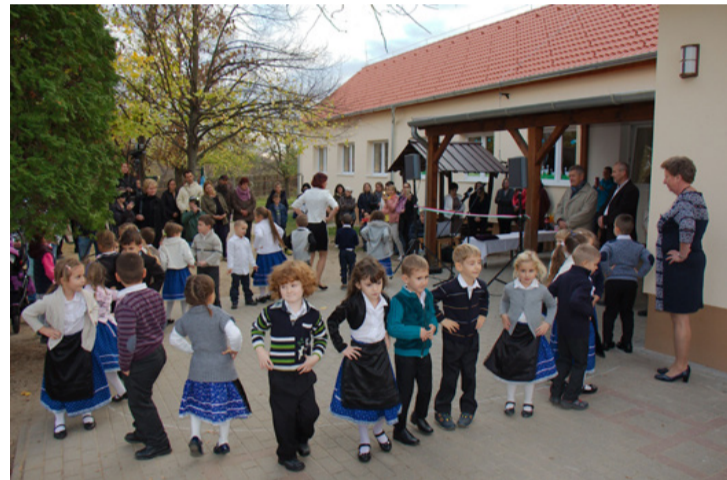
Talán a legkisebbek örültek a legjobban