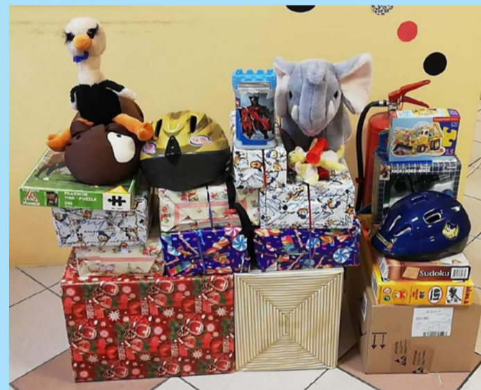
Sok cipősdoboz sokra megy...