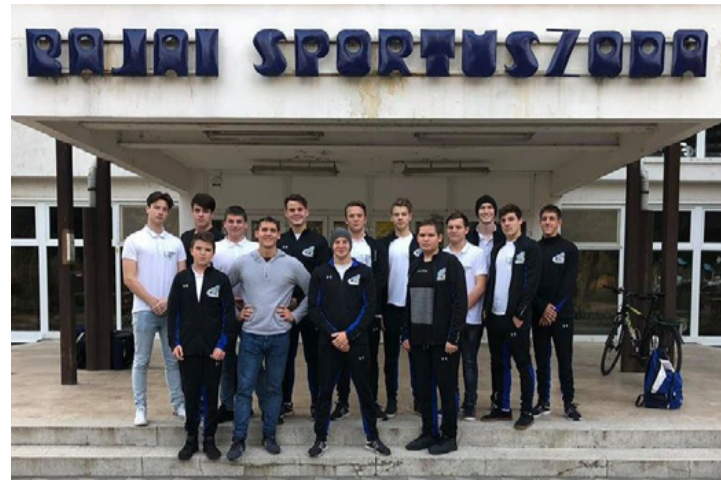
A Cápák ifi csapata

A mérkőzésekbe egyre javuló helyzetkihasználással lendültünk bele. Koncentráltak voltak a fiúk az elejétől a végéig, remekül védekeztek minden poszton. Egy-egy játékost ezért nehéz is lenne kiemelni, mert rengeteg kimagasló teljesítmény volt. Örülök, hogy a mostani játékunk képe újra hajaz a tavalyi évezüstérmes csapat teljesítményére. A bajnokság vége még messze van, de a célunk a