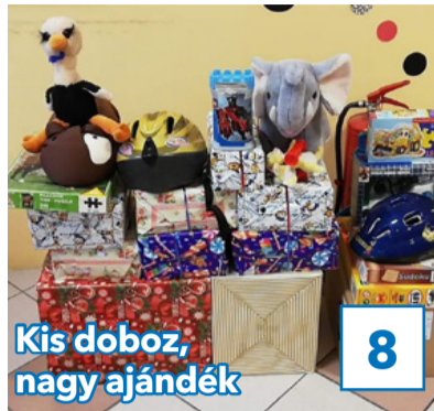
Kis doboz, nagy ajándék