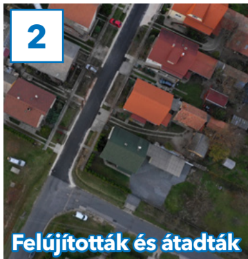
Felújították és átadták

31. évfolyam, 40. szám, 2018. november 23., péntek