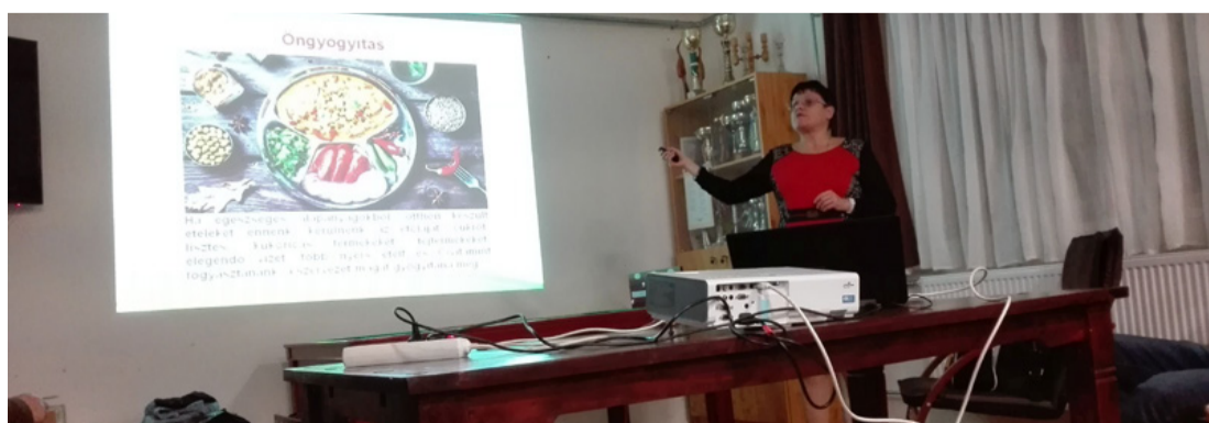
A prezentáció az egészséges életmódot propagálta