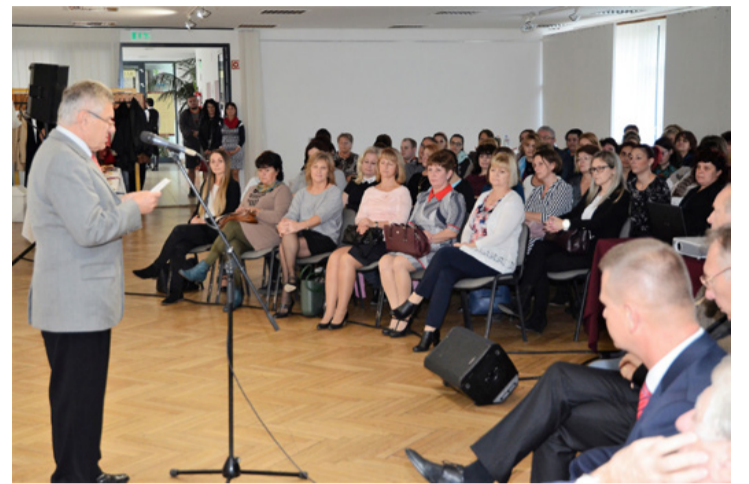
A polgármester köszöntötte az elhivatott szociális munkásokat

A Városi Bölcsőde Ica néneje 40 évig szívvel lélekkel