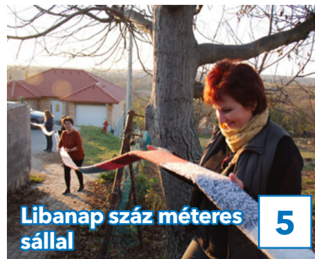
Libanap száz méteres sállal