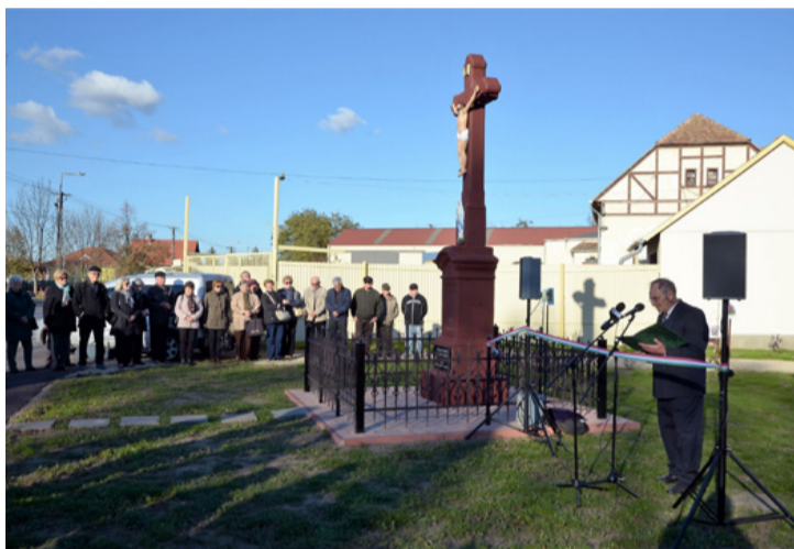
Bóde népe büszke múltjára és hisz saját jövőjében

■ A régóta Budapesten élő Bóday család tagjai is eljöttek a Bóday tér avatására és a kereszt megáldására november 16-án Bódéra. A terület, amely egykor a településrész központja volt, visszanyerte ezzel régi funkcióját. A kereszt köré fákat, cserjéket ültettek, amelyek megnöve árnyékot adnak. Azok alatt az arra járók megpihenhetnek, a helyiek találkozhatnak.