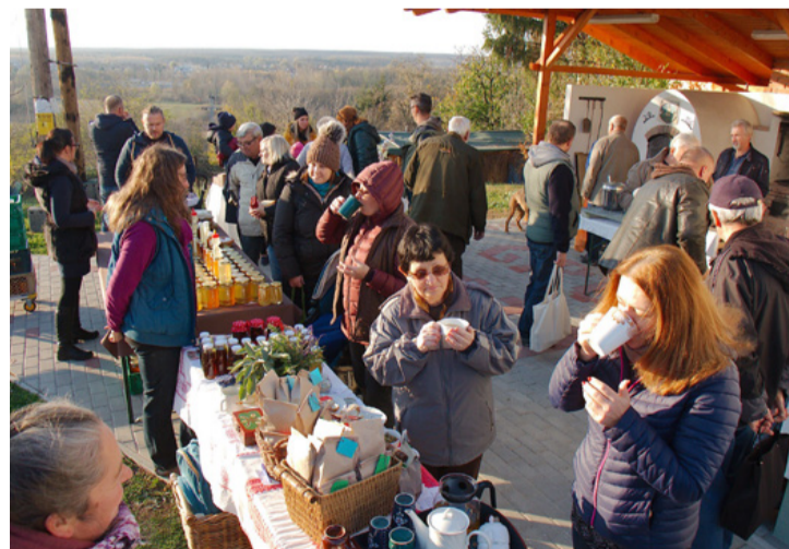
Testet lelkelt melegenítő esemény

A termékek között Kovácsoltvas dísz- és lakberendezési tárgyakat is megcsodálhattak a szemlélők