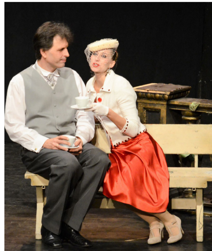
A végén minden jóra fordul – néha a valóságban is