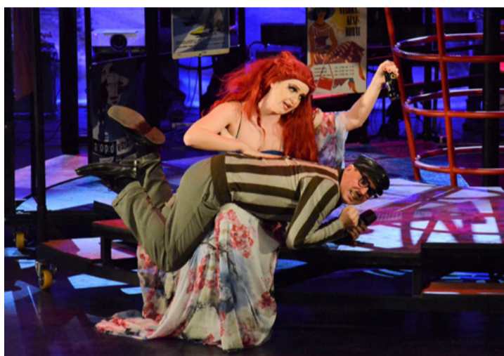
Retro minden mennyiségben

A darabban gyakran felcsendülnek a '60-as évek örökzöld slágerei, megjelennek a hatalmas napszemüvegek, a színes ingek, a korabeli diva-