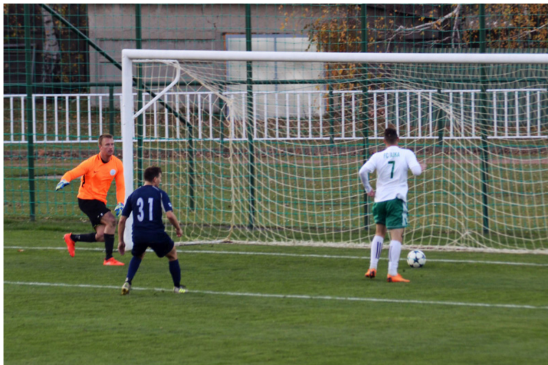
Ebből mi lesz...?