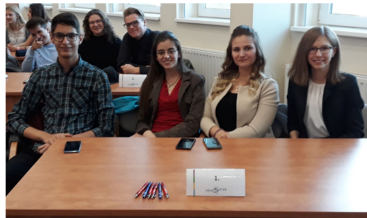
A győztes csapat

A szellemi erőpróbát idén már hatodik alkalommal tartják meg több mint 50 hazai és határon túli magyar szervezett összefogásával, köztük a NAV, egy neves hazai pénzintézet és