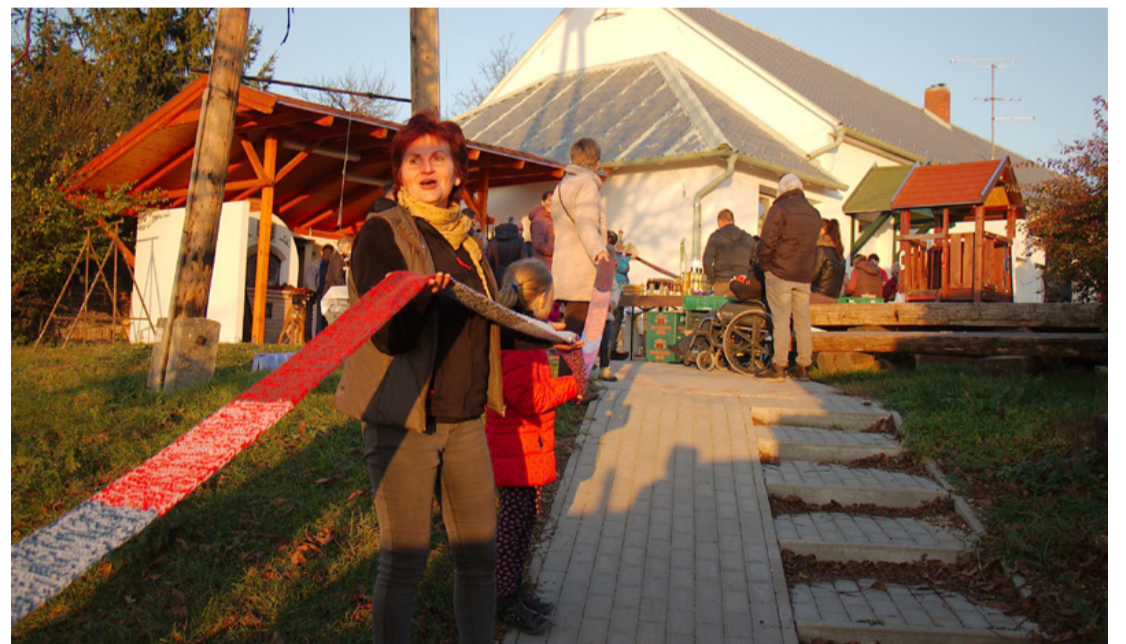
A 60 méteresre tervezett sál már több mint 100 méteres