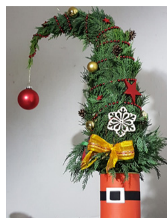
Reneszánszát éli a grincsfá

A grincsfá tehát ennek a mesének a világát idézi, a hegye lefelé lóg, keresztény szemmel azt is mondhatnánk, hogy a "pokolba néz" és nincsen rajta sem gyertya, sem világítás.