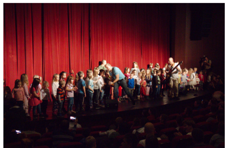
Rebekáért szólt a zene

A szervezőktől megtudtuk, hogy a zenekarnak kezdetektől fogva az a hitvallása, hogy támogatják a beteg gyerekeket, illetve a fogyatékkal élőket. Énekesük úgy kezdte pályáját, hogy kórházakban, beteg gyerekeknek énekel. (Azt is elmondták, hogy saját oldalukon valamilyen formában közlést tesznek a Rebekáért indult összefogást.) A fergeteges hangulatú koncerten végig a gyerekek voltak a középpontban, ugráltak, táncoltak, énekeltek a nézőtérén – később aztán a színpadon is. „Egy mindenkéért, mindenki egyért” – zengett a színházterem, a gyógyító energiák beindultak.