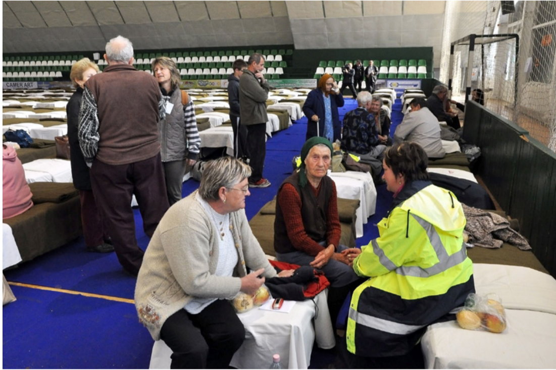
Kolontári károsultak az ajkai sportszarnokban az iszapömlés után

Tizenhárom vádlott esetében szabadságvesztést indítványozott az ügyész