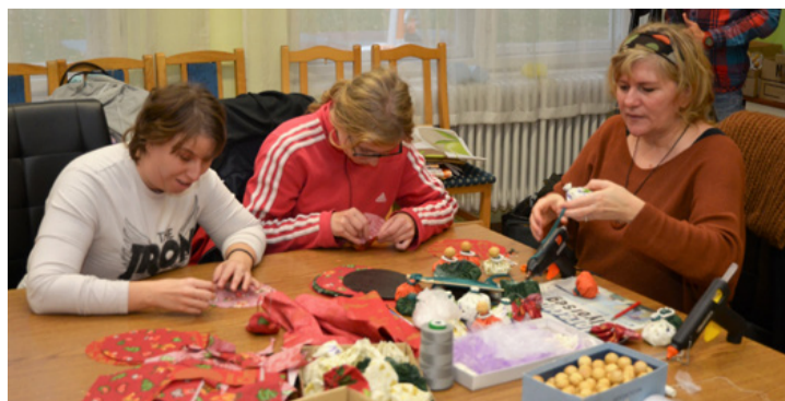
Az ajándékkészítés nagy odafigyelést követel, de sok örömet szerez az alkotóknak is

nek. A tárgyakat talán évenként át fogják őrizni, ezért fontos, hogy szépek legyenek.