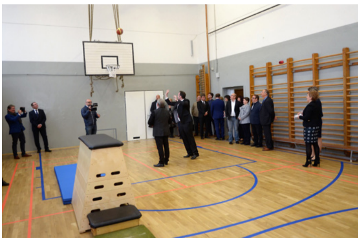
A felnőtt bácsik máris felavatták a gyerekek uniós támogatással újjávarázsolt tornatermét

A Borsos Miklós Általános Iskola, illetve a Fekete István-Vörösmarty Mihály Általános Iskola és Gimnázium diákjai négy felújított tornateremmel és új sporteszközökkel találkozhatnak testnevelés órákon, valamint az edzéseken. A beruházásnak, amely intézményenként 70 millió forintba került, diák, tanár és szülő egyaránt örül.