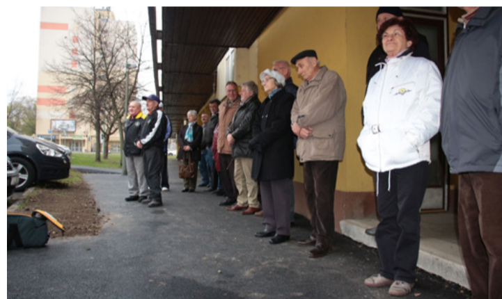
A Csokonai utca lakói már felújított járdán állnak