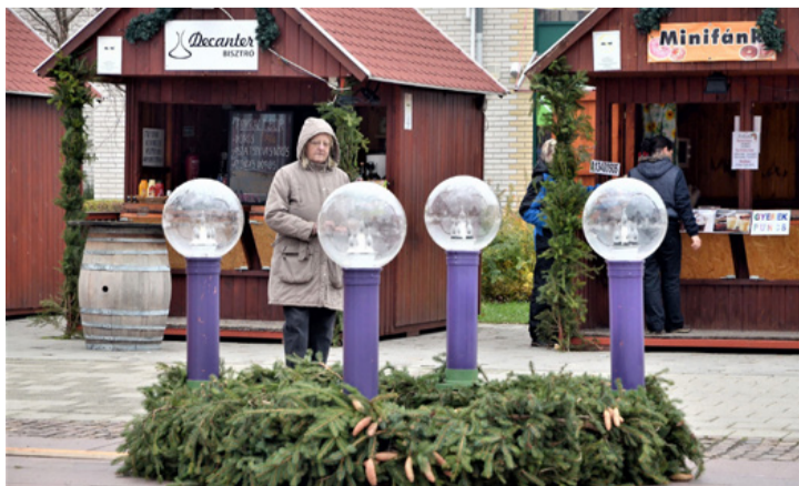
Még várják a tömeges érdeklődést

Az ünnepek közeledtét már napok óta jelzi a térre ismét felállított rénszarvas a szánon utazó Mikulással, a rénszarvas