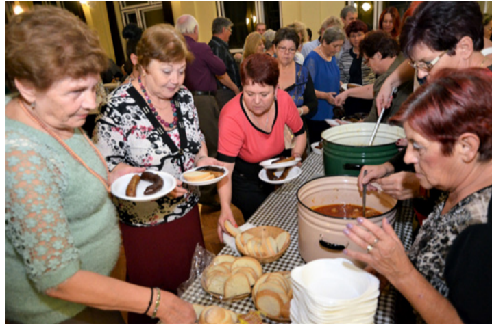
Jutott disznóság mindenkinek