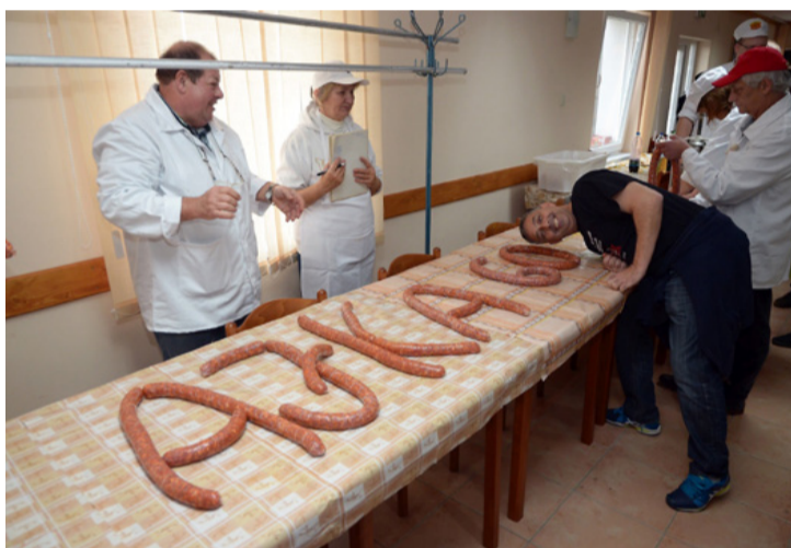
Minden az Ajka60 jegyében zajlott Tósokberénden