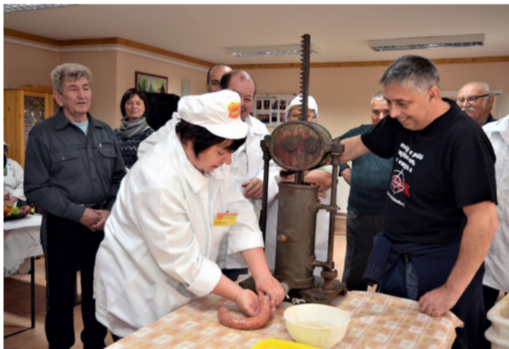
A százéves töltő hatvan éve még csak negyven éves volt