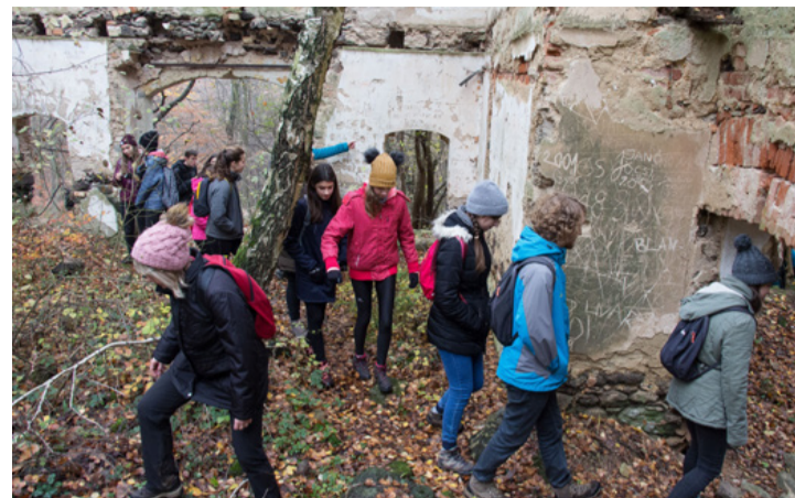
Romtól romig zárandokoltak

szíven viselkednek az erdőjáróval szemben. Jó tudni, hogy nem érdemes visszatámadni és hirtelen futásnak eredni sem, mivel az állapot rendkívül kitartó futó, sebessége pedig elérheti a 45 kilométer/órát is. A természetjárók első állomása a „Fingó-kút” volt. A forrás elnevezésének eredete a vulkáni tevékenység utóműködéseire vezethető vissza. Ha valaki néhány percig türelmesen vár és figyel a forrást, a feltörő gázok miatt buborékok keletkezését tapasztalja, amihez ezúttal csak néhány diáknak volt szerencséje. A kúttól a Hertelendy kastélyrom felé vették az irányt, amit a helyiek csak elfeledett kastélyként emlegetnek. Tény, hogy a II. világháború óta sorsára van hagyva ez az egykor szebb napokat is megélt épület, amit még Békássy