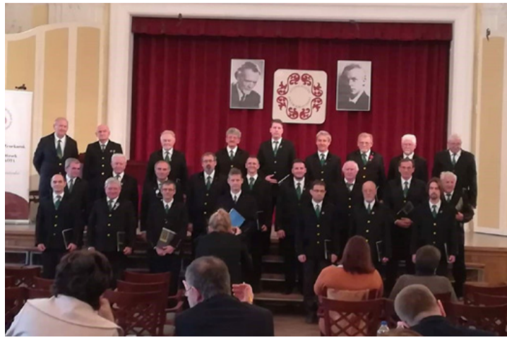
A verseny pillanatai