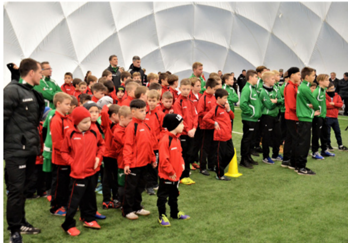
Közöttük vannak a jövő bajnokai