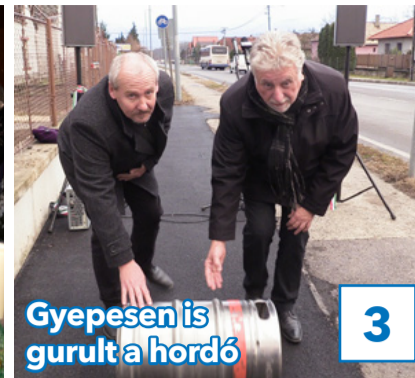
3 Gyepesen is gurult a hordó