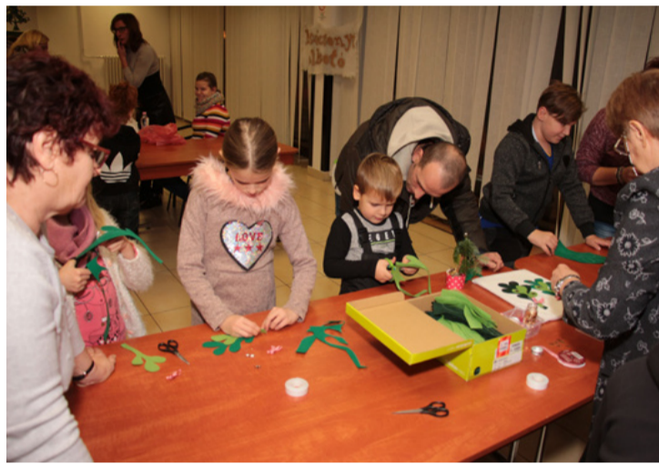
Az alkotási vágy és szeretet kifejeződése