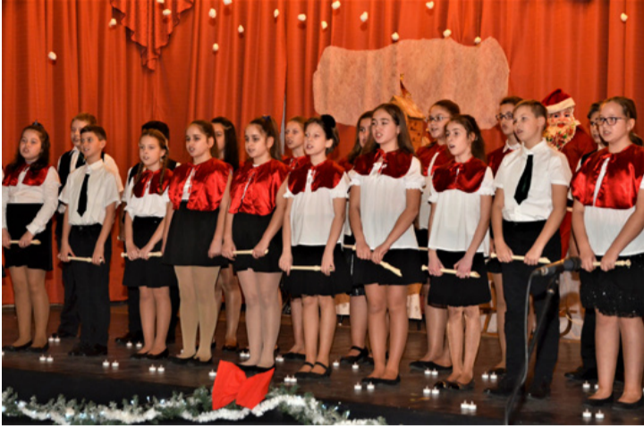
A kicsik meglepték a nagyokat