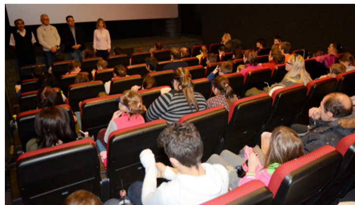
Telt ház volt a moziban