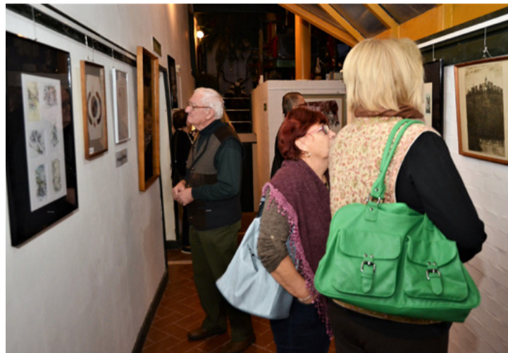
A falakról 60 év köszön vissza ránk