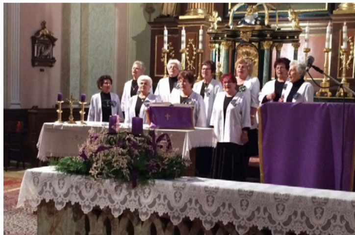
A Regös Nyugdíjas Klub dalosai a szakrális színpadon