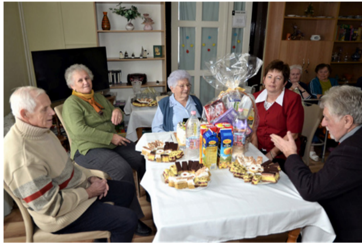
Fő a jó kedély