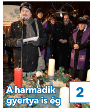
2 A harmadik gyertya is ég