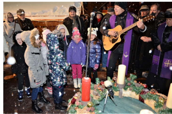
Jézus bekopog az ajtón