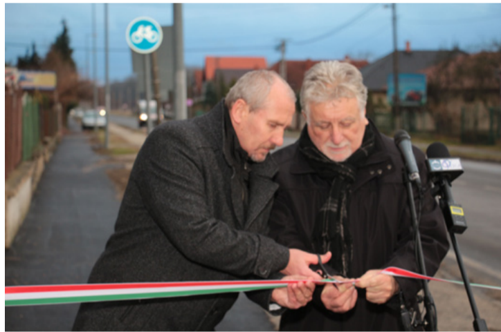
A gyepesieknek 600 négyzetméterrel kisebb lett a problémája