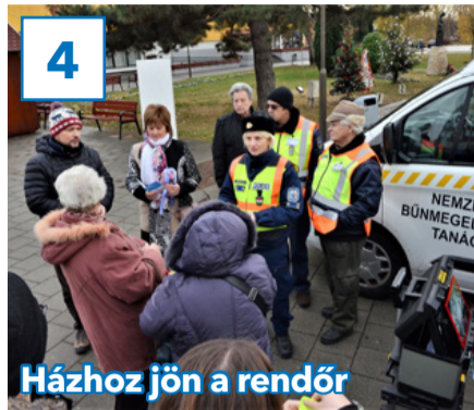
4 Házhoz jön a rendőr