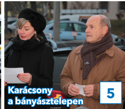
5 Karácsony a bányásztelepen