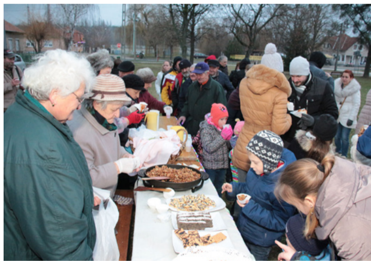
Dióillat járta át az ünnepi készülődést