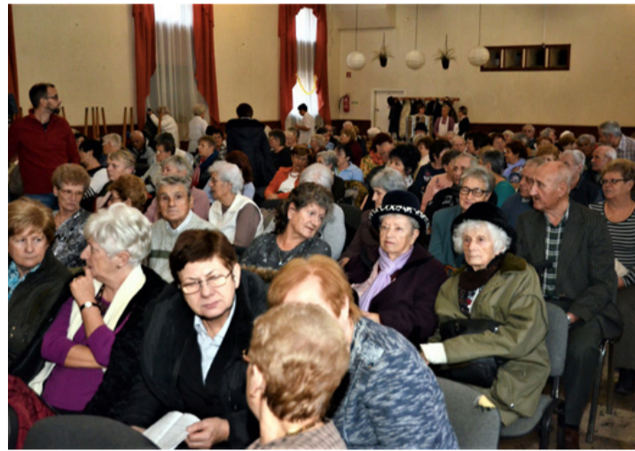
Nyugdíjasok egymás között