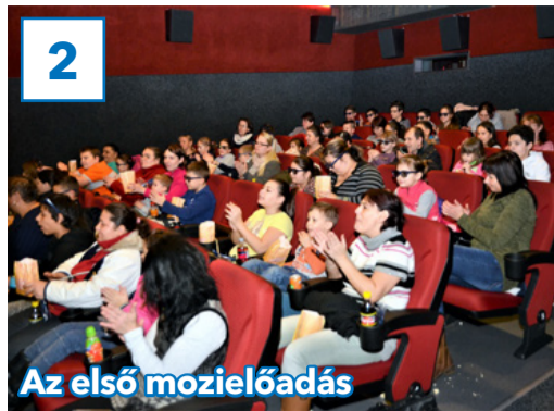
2 Az első mozielőadás

31. évfolyam, 44. szám, 2018. december 21., péntek