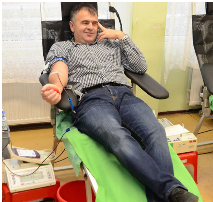
Szolgálok és vérünk...