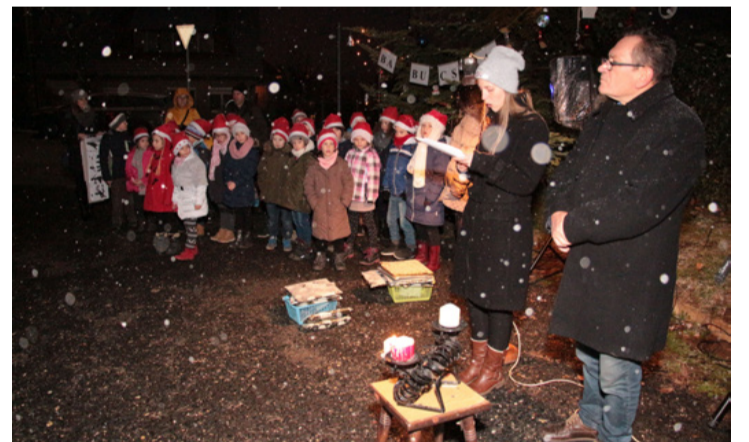
Miközben sűrűn hullt a hó...