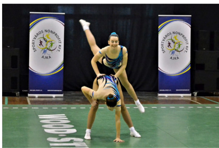
Az aerobik látványának sem utolsó