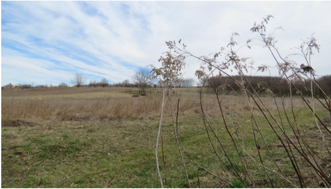
Összesen 118 telket alakítanak ki Ajkarendek határában