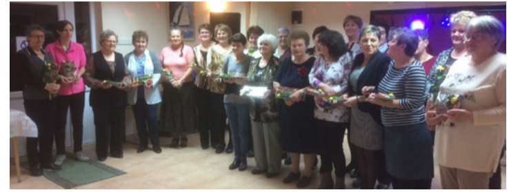
A „családi fotón” az ünnepelt tósoki hölgyek

Kellemes meglepetést szereztek a Tósokberéndért Egyesület férfi tagjai, amikor március 8-án nőnap rendezvényre hívták az egyesület lányait, asszonyait.