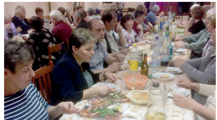
Gazdagon terített asztal várta a meghívottakat

folytatódott a remek hangulat, amikor fény derült a pletyka születésének a folyamatára és, hogy kinek milyen jó a megfigyelőképessége. Fialtságukat nemcsak a megszólaló zene és tánc idézte fel, amikor a padlásról előkerült a karikadobáló játék. Hamarosan eldőlt, hogy ki milyen ügyes jó né-