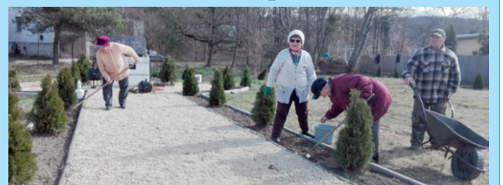
Az idősek tujákat is ültettek