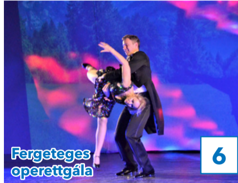
6 Fergetes operettgála