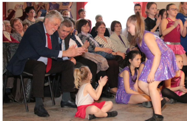
Ugye milyen jó a műsorunk?