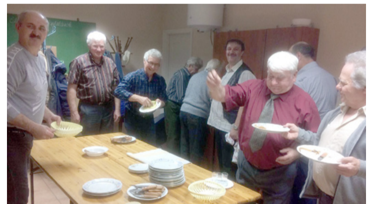
Nekik a mosogatás is szórakoztató volt