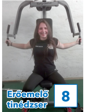
8 Erőemelő ténédzser