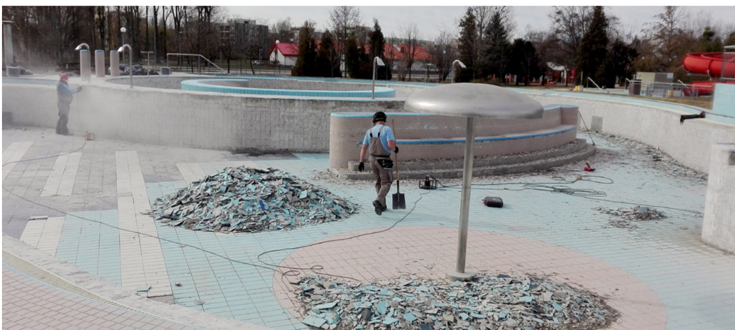
A szakemberek már dolgoznak a felújításon