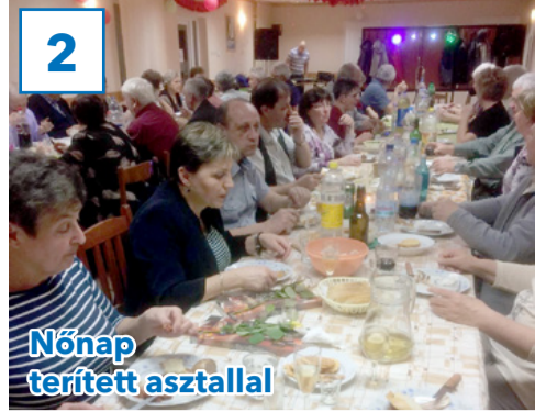
2 Nőnap terített asztallal

32. évfolyam, 9. szám, 2019. március 15., péntek