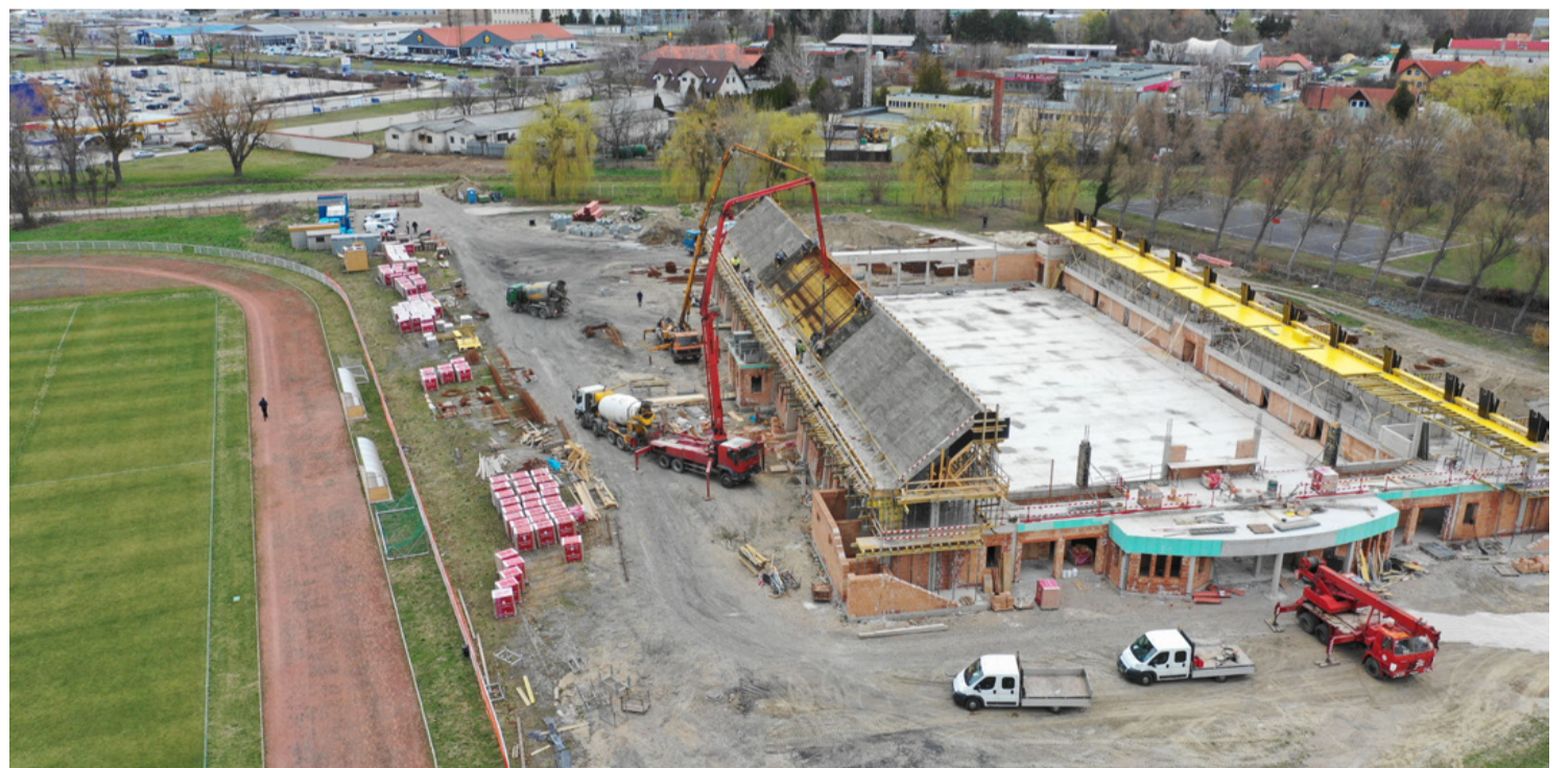
Látványos szakaszához érkezett az ősre elkészülő jégcsarnok építése. Ezen a légi felvételen látszik amint óriási betonpumpák veszik körbe az épületet és a magasba juttatják a tetőt majdán szilárdan tartó anyagot.