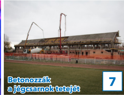
7 Betonozzák a jégcsarnok tetejét