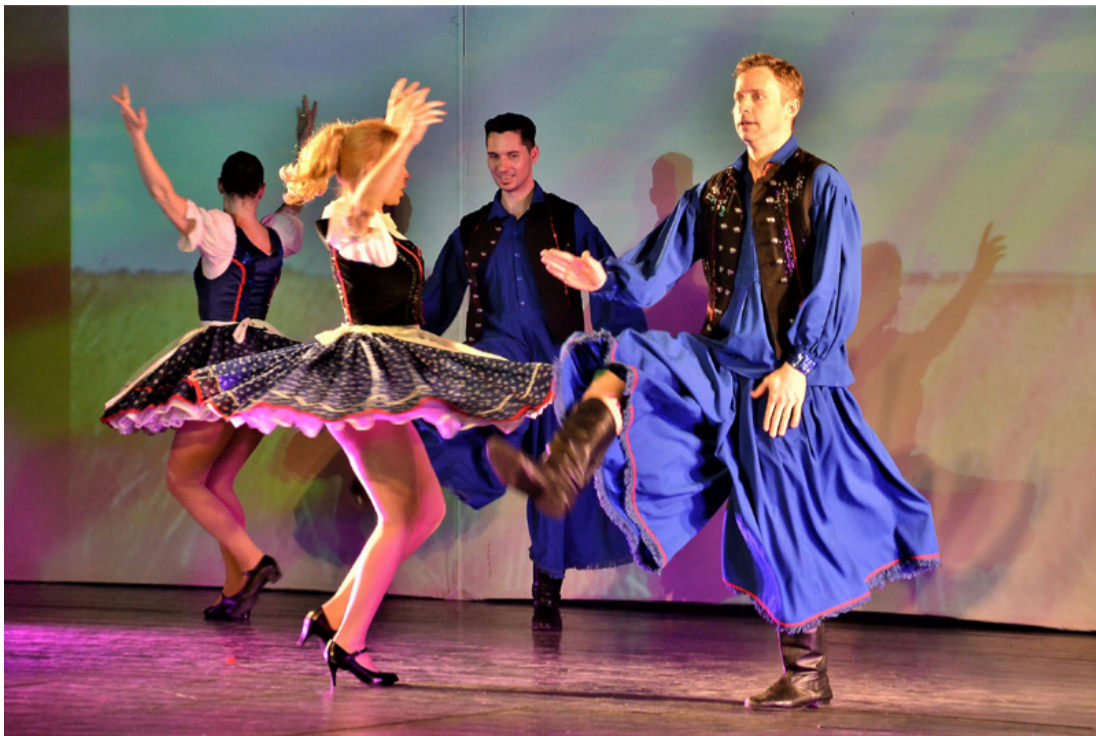
Fergeteges műsor volt