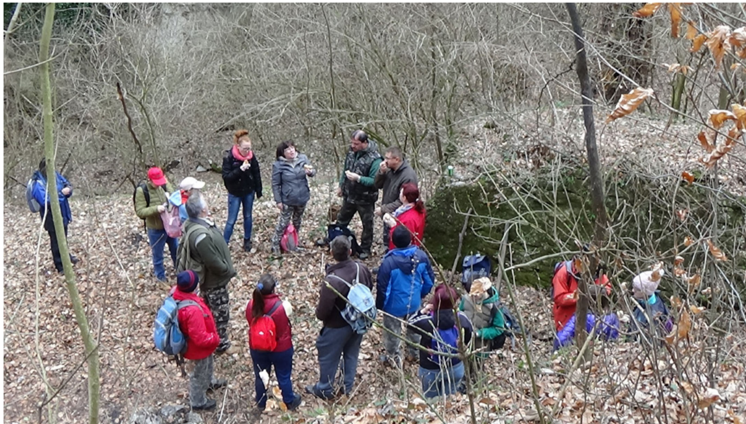
A túrázás egyik legszebb pillanata, a pihenő