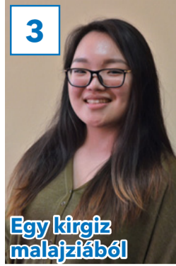
3 Egy kirgiz malajziából