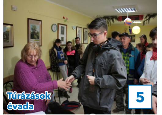
5 Túrázások évada