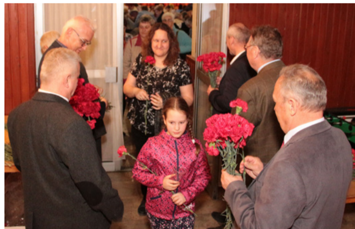
A köszöntő est után mindenkinek egy szál vörös szegfű járt