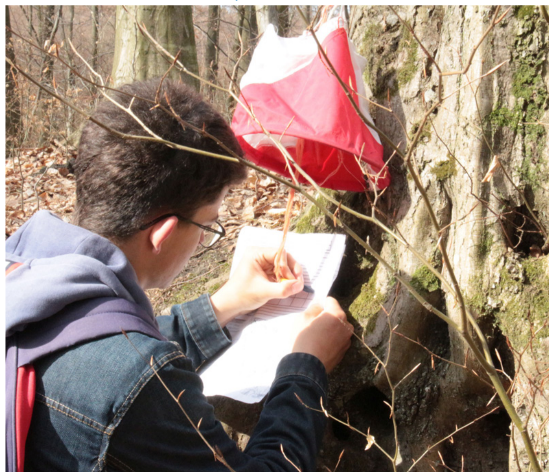
Az állomások érintését igazolni kell