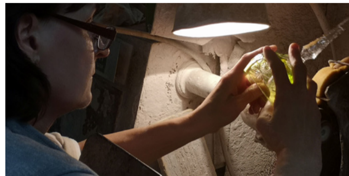
Ügyes kezek alakítják a csiszolatot

Munkaerő gondjaik persze nekik is vannak. Hiszen ki megy manapság üvegfúvónak, vagy -csiszolónak? Pedig szép munka ez, remek darabokat hoznak létre napról napra, óráról órára az ügyes kezű munkások, erről