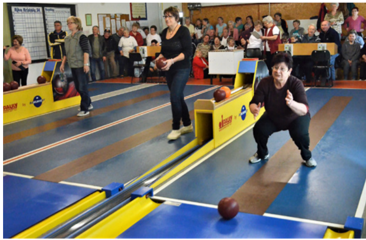
Három résztvevő, három mozdulat