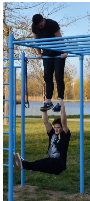
Egy laza páros gyakorlat

Ajka sportos város, rengetegen futnak, kerékpároznak, sportolnak. Az első Civil házban található Kondiparkot is ajkai fiatalok találták ki közösségi tervezés során, így most az EFOP-1.5.2 Humán közszolgáltatások fejlesztése projekt keretében, uniós forrásból