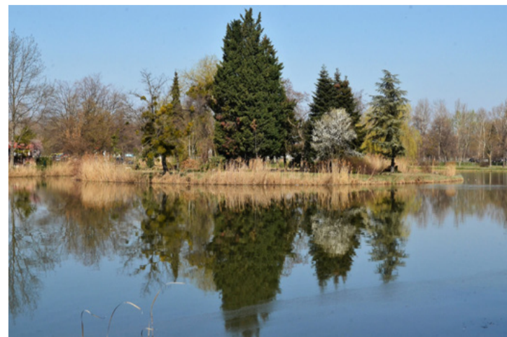
Az egészséges ivóvíz nagy kincs, de mennyisége világszerte csökken

Népességünk 90 százaléka „alulhidratált”, vagyis kevés vizet iszik, 70 százalékunk pedig krónikusan alulhidratált. Egy felnőtt ember napi optimális folyadék szükséglete legalább 2 liter tiszta víz. Ennek ellenére az emberek többsége sokkal kevesebbet iszik. 45 év felett nem ismerjük már a szomjúsá-