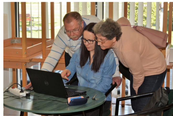
A szerződés aláírása előtt gondosan tájékozódni kell