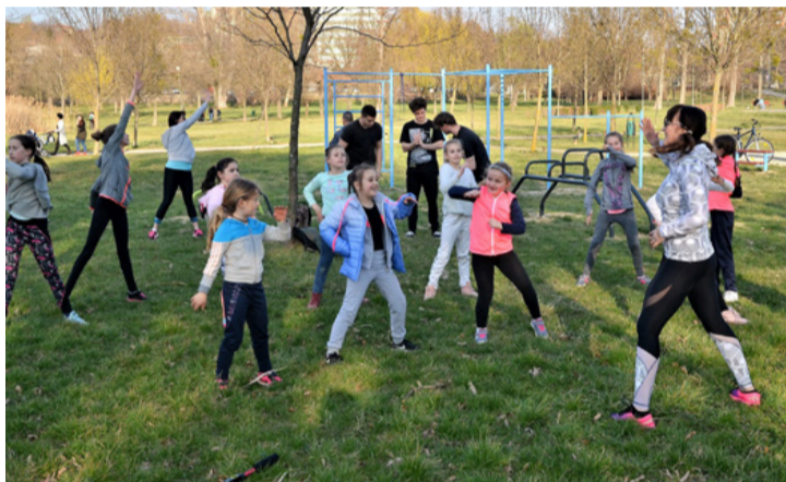
Tömegeket is vonzhat az új sportpark