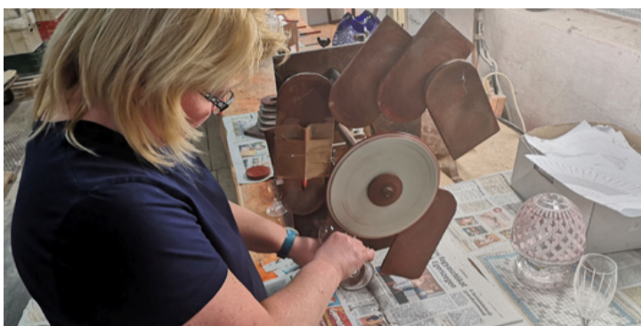
Viaszkoronggal jelölik a leendő csiszolás vonalát

A gyár túlélte két nagy háborút és néhány rendszerelést. A kilencvenes évek legvégén került egy magán tőkés csoportba amikorra az