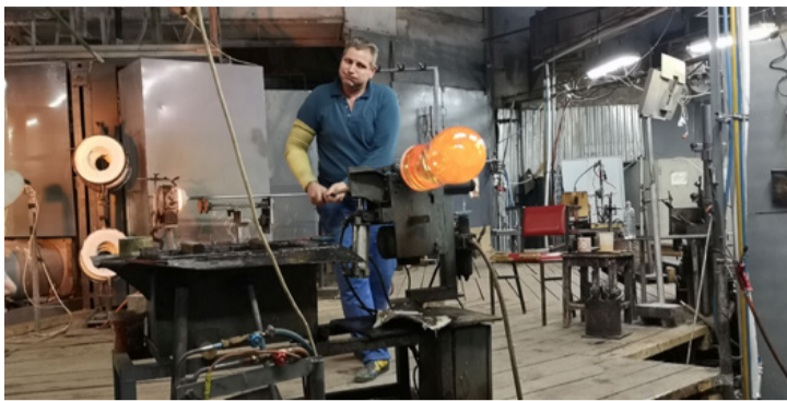
Az üvegfúvás ma már „romantikus” foglalkozásnak számít

■ Valamikor az „ajkai kristály” fogalom volt, közeli és távoli földekről jártak csodájára. Ajkának is meghatározó foglalkoztatója volt, több mint ezer család megélhetésének megingathatatlan alapja.