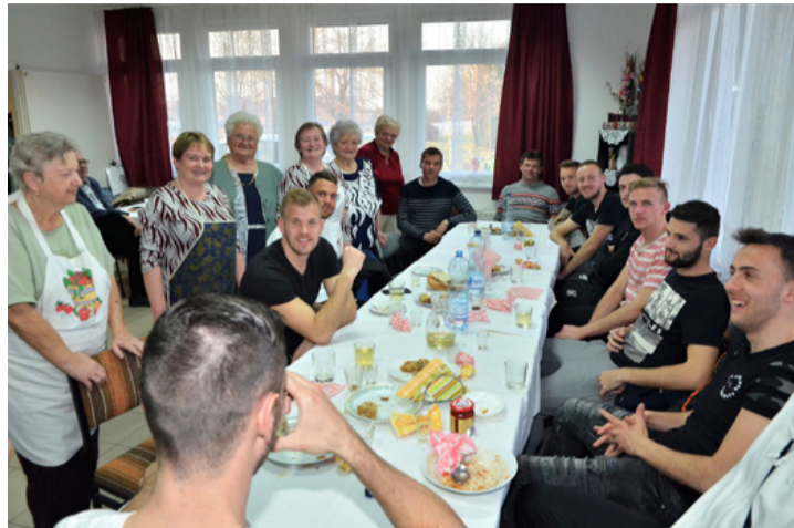
A focisták és vendéglátóik