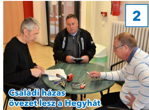
Családi házaspár lesz a Hegyhát

„Gondolkoj globálisan, cselekedj lokálisan!”