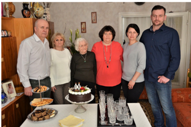
Az a két gyertya sokat elmond...