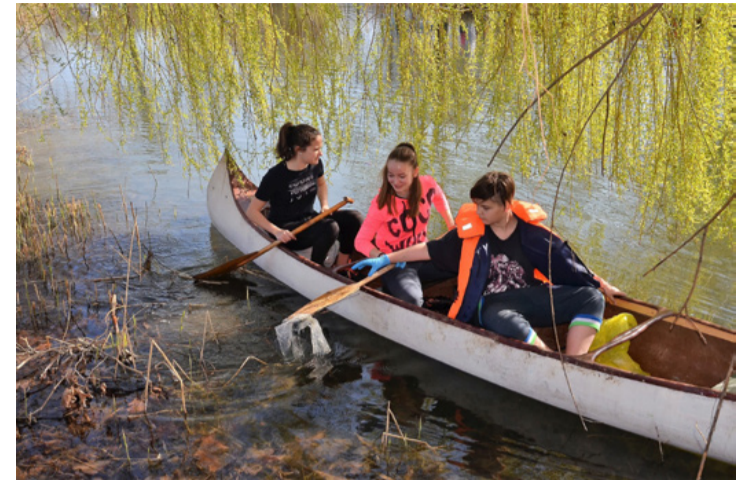
Szemetet szedni nem csak a szárazföldön kell

Tagadhatatlanul megérkezett a tavasz március 24-én, hiszen a Csónakázó-tó környékén minden a kikeletre utalt. Ragyogó napsütésben piknikező gyerekek és felnőttek népesítették be a tó környékét, a kenekut, pedig vízre tette az Üveggyári Ifi Flotta legénysége.