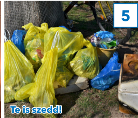
Te is szedd!