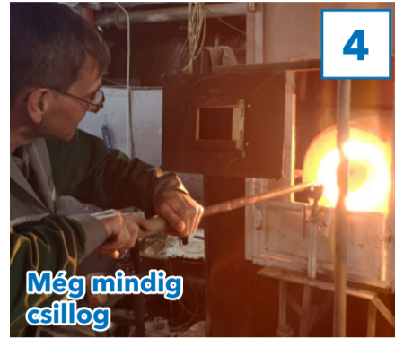
Még mindig csillog