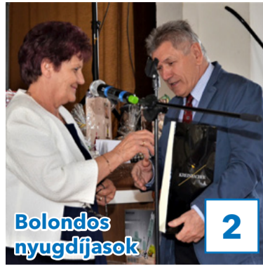
Bolondos nyugdíjasok 2

„Gondolkodj globálisan, cselekedj lokálisan!”