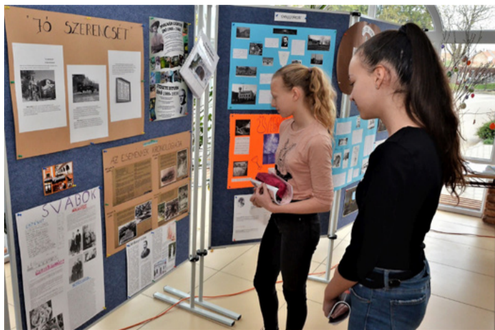
A kiállítás az aulában a tanulók lelkes hozzáállásának eredménye

A tóskberendi katolikus iskola 5. osztályos diákjai magyar irodalomból a La-köhelyünk kultúrája című tananyag feldolgozása során 10 órás projekt keretében ismerkedtek Ajka múltjával, kulturális hagyományaival.