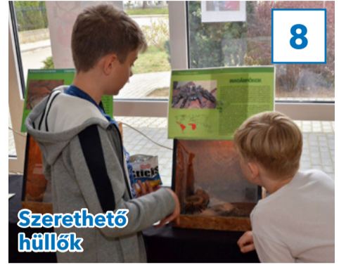
Szerethető hullók 8