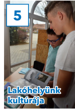
Lakóhelyünk kultúrája 5