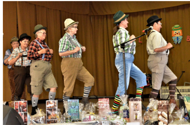
Se vég, se hossza nem volt a mókázásnak