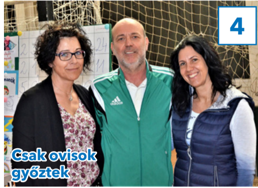
Csak ovisok győztek 4