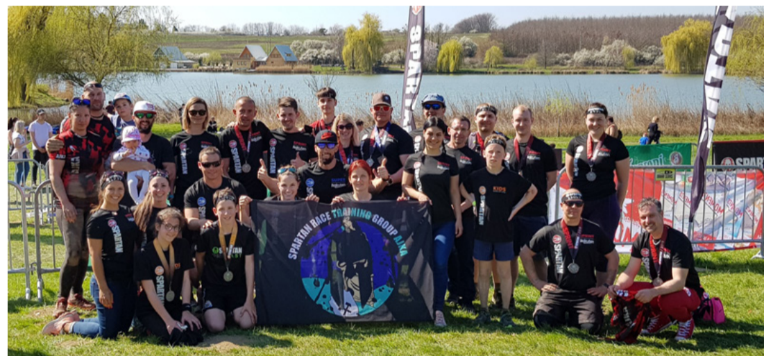
Spartan Training Group Ajka