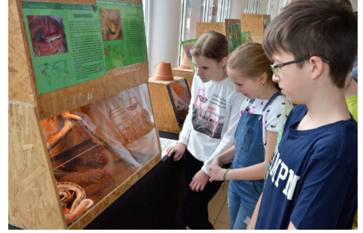
Szakértők szerint a gabonaszőlő elindult a háziállattá válás útján...