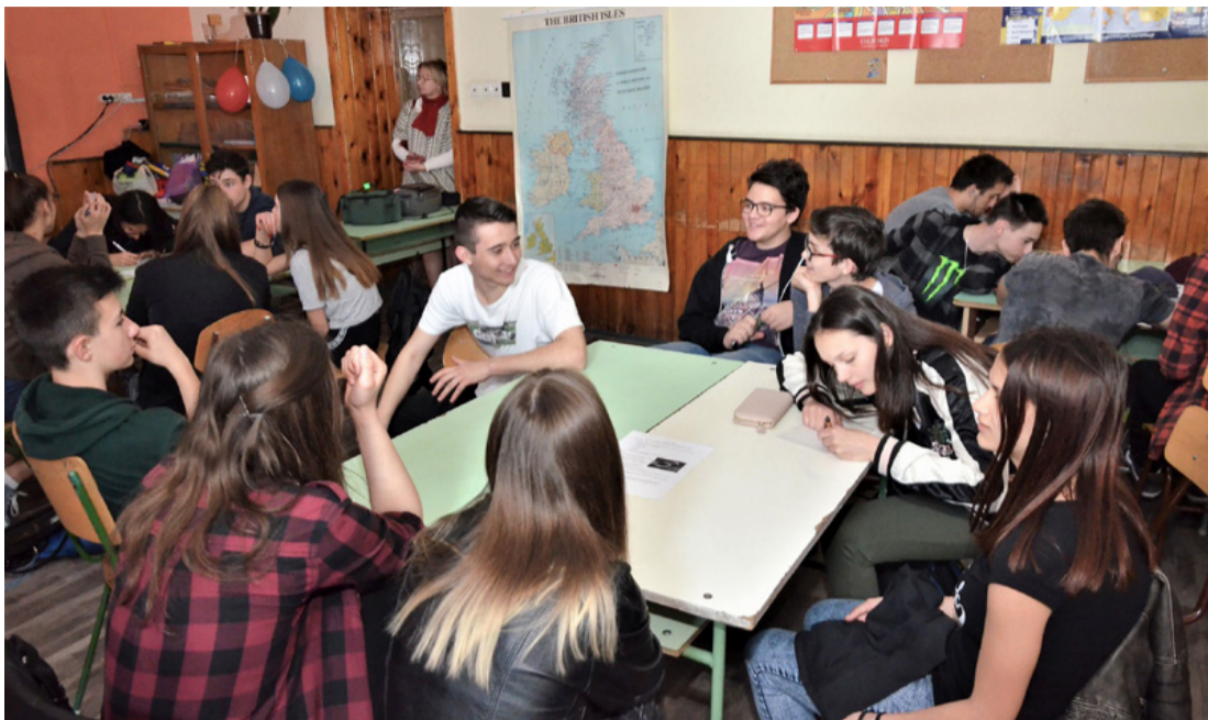
A választások az ő jövőjükről szólnak majd