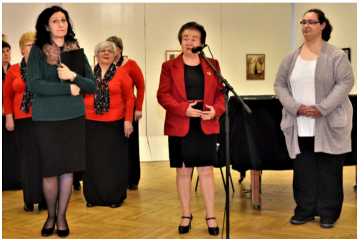
A kiállítás megnyitója

Az alkotó elárulta, hogy legszívesebben diófapác technikával dolgozik, de kedveli a kollázst is, emellett szén-ceruzát, különböző krétákat (pasztell, olajpasztell, pitt) használ szívesen. 20 éve tagja a devecseri felnőtt körnek, leginkább csendéleteket, portrékat készít. Művészeti vezetője kiemelte az amatőr képzőművész sajátos látás-