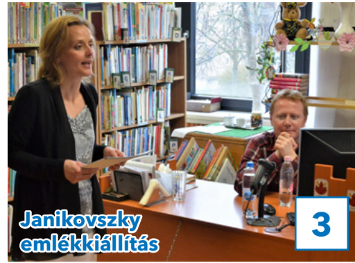
Janikovszky emlékkiállítás 3