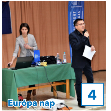
Európa nap 4