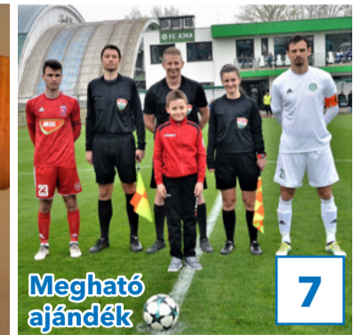
7 Megható ajándék