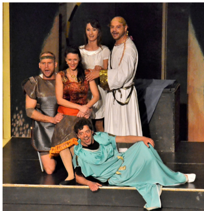
Minden jó, ha a vége jó

A mesedarabban a címszereplőnek az a feladata, hogy megmentsse a Földet a gonosztól. Az alvilág urát kell legyőznie, ő pedig nem más, mint Hádész, „aki nem valami lángész” - ugyan ki félne tőle, hiszen ráadásul még pösze is. Így „kénytelen” a testvére irányítani őt abban, hogy a jó embereket rabul ejtse. De Zeusz fia éppen hősszerelmes, így egészen addig nincs felkészülve a rábízott feladatra, míg a szíve választottját, a tűzről pattant, ámde jóhiszemű Megarát csellel (álomporral) el nem rabolják, és az alvilágba nem viszik. Ekkor Hercules isteni erejével és tanítómesterének: Filoktészesnek a segítségével megmenti a szerelmét, vagyis felhossa az alvilágból. Ezután jó barátját, az