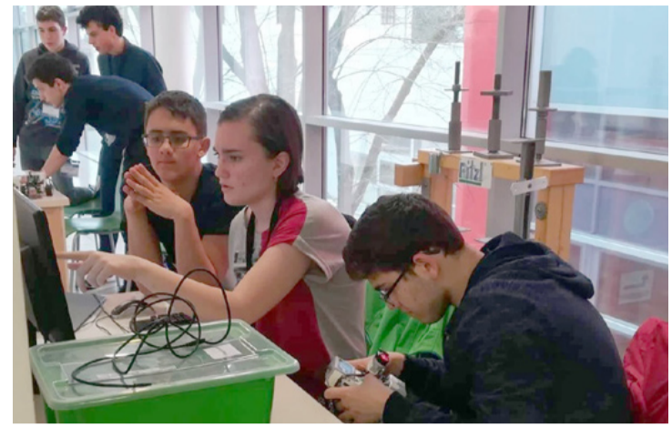
Versenytelen Tili Nóráék

A végeredményt hűen tükrözi az ország oktatási intézményeiben folyó műhelymunka színvonala, háttere, hiszen első helyen a magyarországi LEGO-Orobotika megalapozójának,