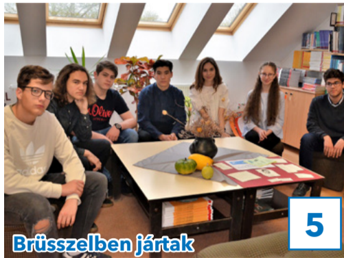
5 Brüsszelben jártak