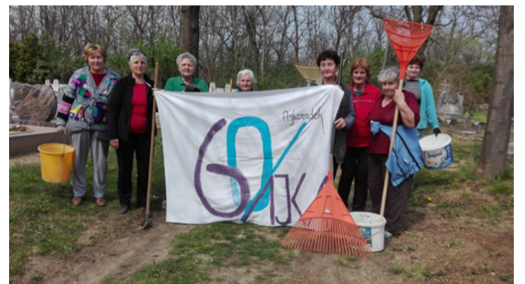
A szorgalmas „dálások”