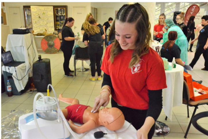
A csecsemő újraélesztése – ez még csak gyakorlat

■ Érdeklődve nézték a hatodik és hetedik osztályosok, amint a szakközépiskolások bemutatták nekik a szakmájukat, amelyet az általános iskolások is kipróbálhattak. A Szakmák éjszakáját az idén negyedik alkalommal hirdették meg, a felhíváshoz 160 város közel 500 iskolája csatlakozott. Ajkán a Veszprémi Szakképzési Centrum Szent-Györgyi Albert Szakgimnáziuma, Szakközépiskolája és Kollégiuma várta a helyi és térségi pályaválasztás előtt álló diákokat április 12-én délután fél hattól este tíz óráig.