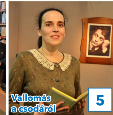
5 Vallomás a csodáról