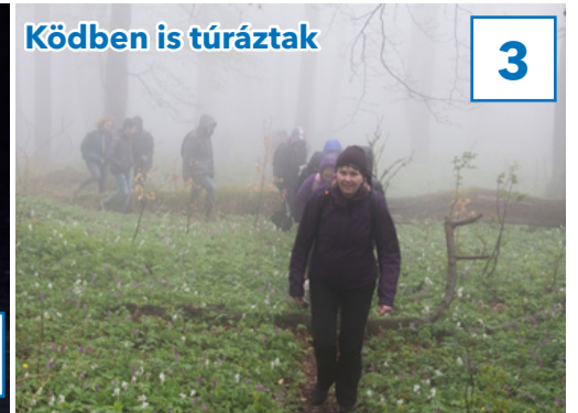
Ködben is túráztak