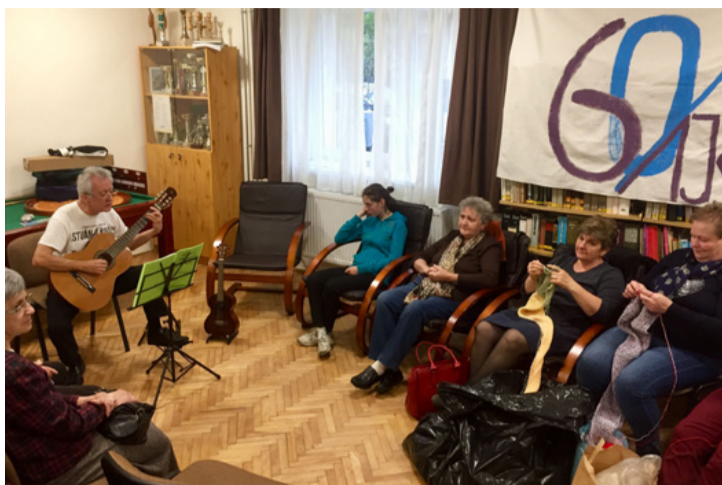
Meghitt együttlét a zenés-verses délutánon