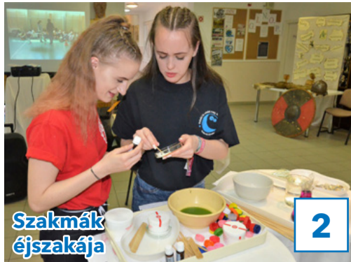
2 Szakmák éjszakája

32. évfolyam, 14. szám, 2019. április 19., péntek