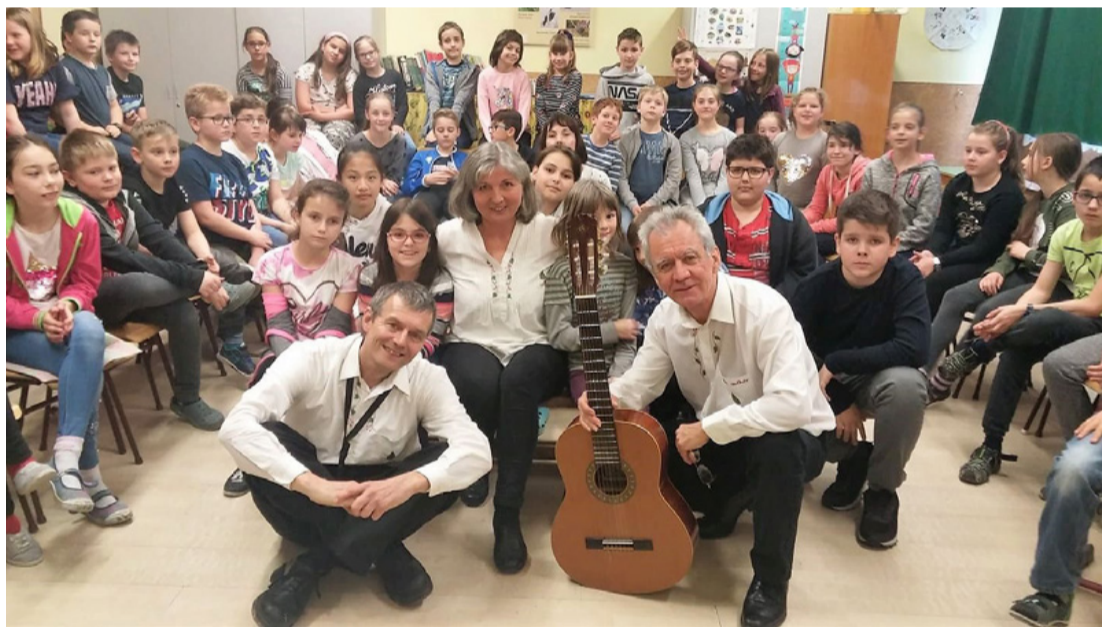
A Hársfa trió a Fekete-Vörösmarty iskolásai között