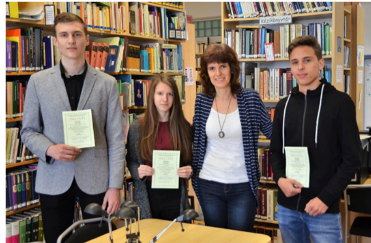
Alkalmazott informatikából az országban a legjobbak