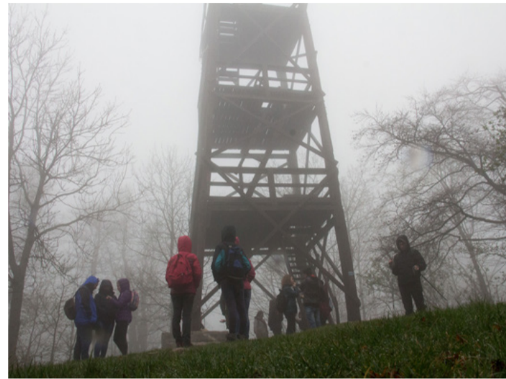
Erdemes felmászni oda?

légtérelenőrző radarállomás gigantikus, golflabda formájú kupolájából se. Lefelé menet útba ejtették az Ördög-lik barlangot ami egy 21 méter mély aknabarlang és a Pörgöl barlangot amit a mészkő repedéseibe, a felszínről beszivárgó víz, oldó hatása hozott létre. A barlangban 14 védett és fokozottan védett denevér fajt tartanak számon. Útjuk során érintették a Százhalom elnevezésű halomsírműzt is, ami a nevét a kelták temetkezési szokásairól kapta, ugyanis egykor a halottak hamvait urnákba helyezték, mellé ékszer, fegyvert, agyagedényeket tettek, fölé földből vagy kőből halmot építettek. Így, ez a hely a 226 halomsírjára