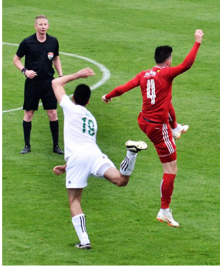
A foci és a balett édestestvérek

■ Karatésaink a népes mezőny ellenére is medállokkal megpakolva térhettek haza a kontinensviadlóról.