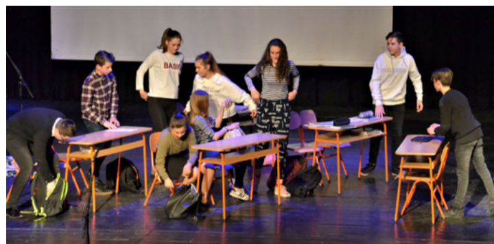
Tantermi nyüzsgés, ezúttal a színpadon