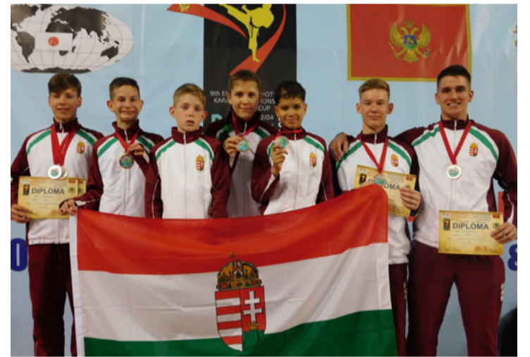
A Montenegróban járt karatésok