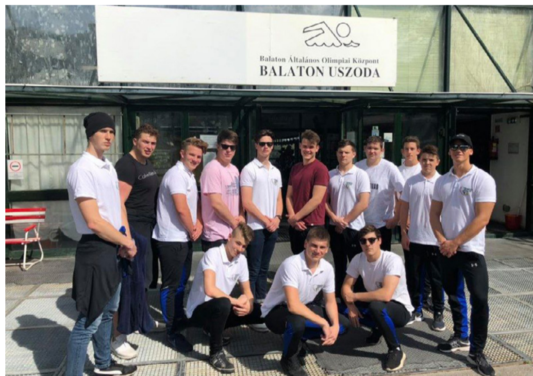
Elcsíphetik az ezüstöt is