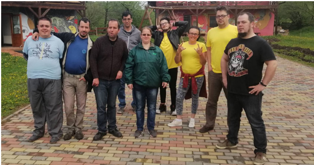
A Hangadók Sepsiköröspatakon