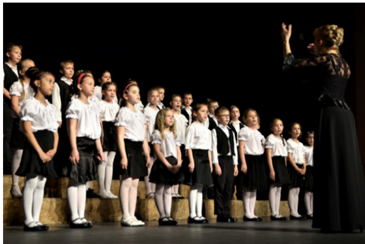
Ajkán minden iskolának van gyermekkórusa

Városunk minősített kórusai is bemutatkoztak az Éneklő Ifjúság szakmai napokon