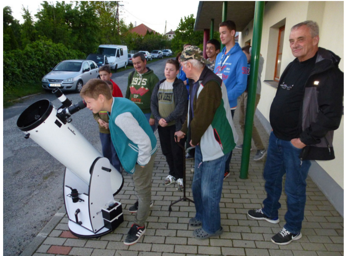
A távcső és az érdeklődők