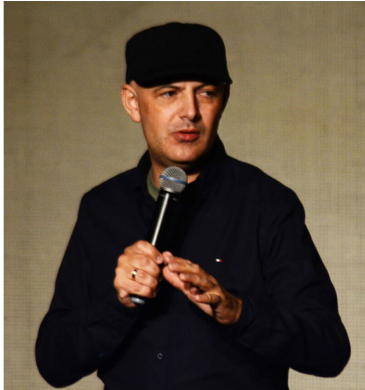
Bányász szeretett volna lenni, de „véletlenül” újságíró lett

■ Vujity Tvrtko: Túl minden határon című motivációs előadását láthattuk május 9-én a művelődési központ színháztermében. Két óra alatt körbeutaztuk a Földet, láttunk mulatságos és kevésbé mulatságos diktatúrákat, hétköznapi hősokeket, akik megmentik a világot, és akik legyőzték azt, amit lehetetlen: a halált. Mesélt egy fiúról, akinek nincs lába, mégis mindig talpra áll. Mélységek és magasságok, sírás és nevetés, menny és pokol – óriási energiák szabadultak fel a teremben.