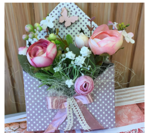
Az utolsó műremek: selyemvirágok a boríték alakú dobozban

A felnőtteknek szóló kézműves foglalkozások most véget értek, de szeptember-