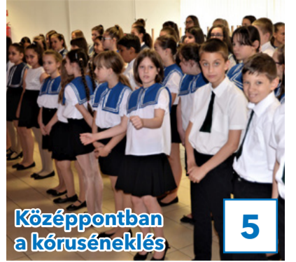
Középpontban a kóruséneklés