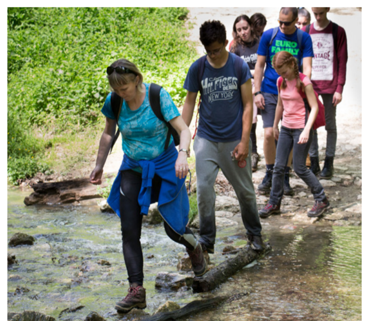
Átkelés a Cuhán

- Köszönöm nektek azt, hogy velem tartottatok és akkor is kitarítottatok, amikor már "csak" pár kilométer volt hátra a túráinkból. Úgy gondolom, hogy mindenki sokkal edzettebb, életreva-