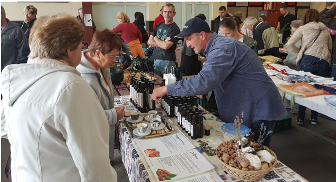
A kézműves étolajok egyetlen háztartásból sem hiányozhatnak