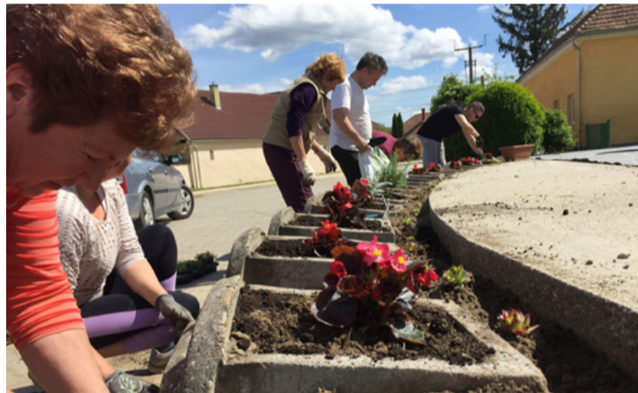
A színpad előtt mostantól begóniák nyílnak

ány, hiszen kettő órákor kapákkal, ásókkal, gereblyével felszerelve megérkeztek a falu lakói és nekiálltak rendbe tenni az iskola mögötti tér környékét. A színpad előtti kő kaspókban már elnyi-