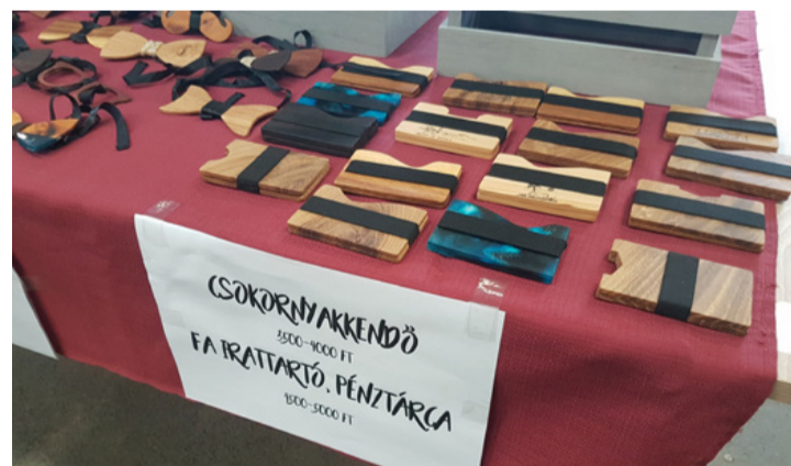
Hogy mi minden készülhet fából

A szervező Tanya Világ Om jóvoltából a látogatók az ízlelőbimbóikat is kényeztethették, ugyanis 25 féle dzsem-különlegesség volt kóstolható. Annyi kikötés volt csupán, hogy a kóstolást bírálati lapon véleményezni kellett. És ha valakinek netán egy íz annyira megtetszett, hogy szeretett volna magával haza is vinni, akkor ugyan nem mind a 25 féleből, de 13 féle jam közül természetesen vásárolni is tudott.