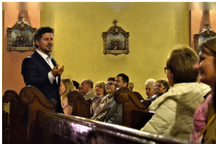
Az előadóművésznek fontos a közönség reakciója