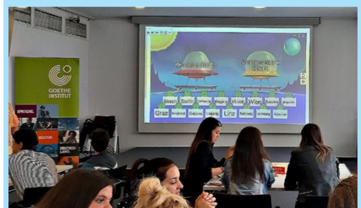
Bánkisok a rendhagyó nyelvórán

A Bánki Donát Intézményegység diákjai április 30-án látogatást tettek a budapesti Goethe Intézetbe, ahol német nyelvi környezetben próbálhatták ki tudásukat. A rendhagyó 90 perces németórát az intézet munkatársa tartotta, ahol természetesen mindvégig csak németül zajlott a kommunikáció. Egy kis játékos ismerkedés után, érdekes interaktív feladatok segítségével bepillantást nyertek tanulóink az intézet működésébe. Országismereti vetélkedő, Németország puzzle és a közkedvelt Kahoot (online feladat készítő és -megoldó rendszer - a szerk.)