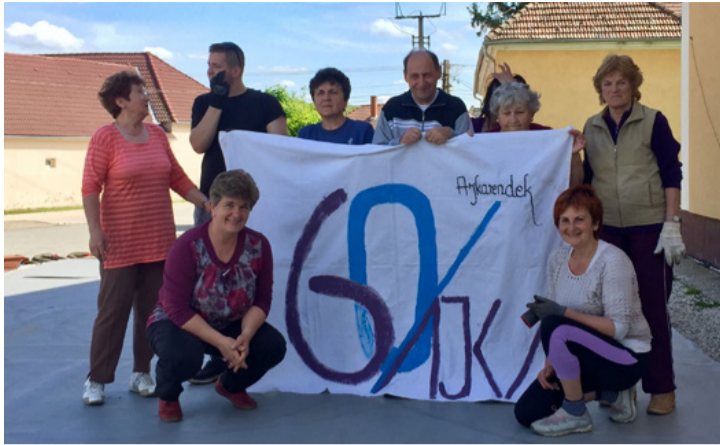
Hosszú hajrát nyitottak a rendekiek