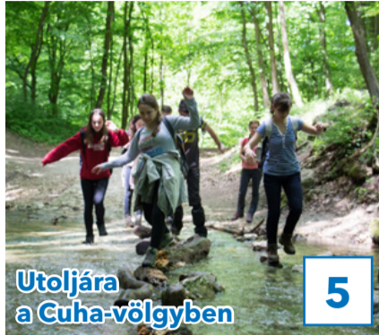
Utoljára a Cuha-völgyben