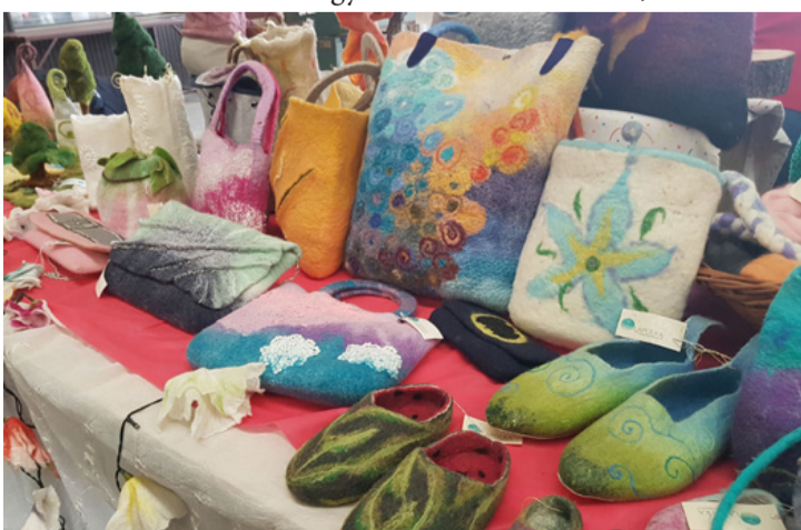
Nemezcsodák: szépek és hasznosak

A nemez ősi eredetű textil, amit hagyományosan birka- vagy gyapjúból gyúrnak vizes közegben. A nemez készítők megkülönböztetik a kézzel előállított nemez a gyári, műszaki nemeztől, bár készítésük alapja azonos. A nemez a textiliparban és gyakran a köznyelvben is filcnek nevezik; szűkebb értelemben csak a műszaki nemez a „filc”, megkülönböztetve azt a hagyományosan, kézzel készített anyagtól. Más nyelvekben nem tesznek különbséget a két-féle nemez között, és mindket-