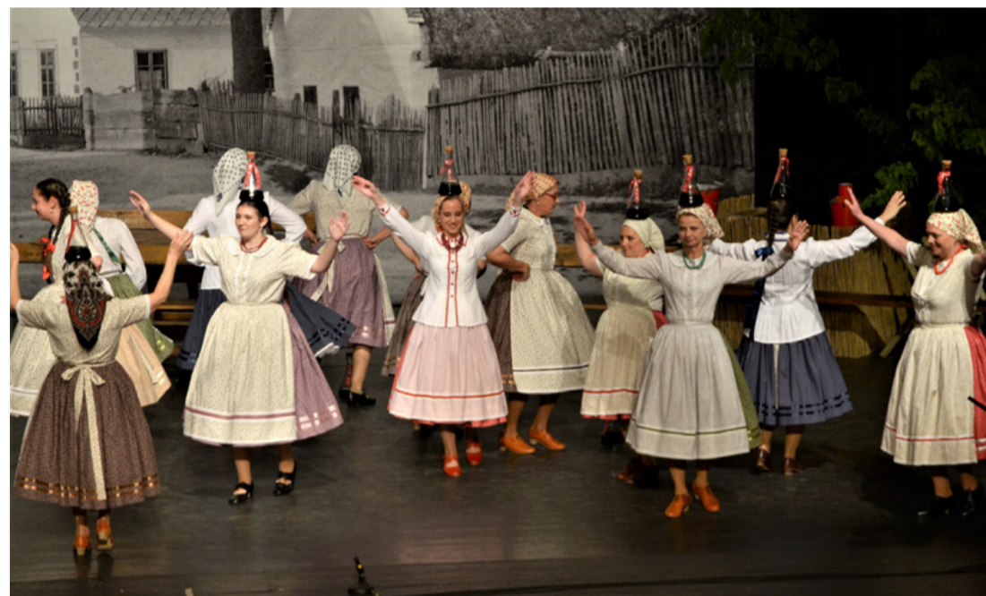
Egy jó asszonynak párja nincsen!

embereket hattárokon túl is.” hangzott el a bevezetőben. Az Antal D. Csaba által tolmácsoló versek vezérfonálként szöttek egyégy az előadás darabjainak szövetét. A bemutatott alkotás egy vallomás volt a Mezőségről, halhatatlan muzikusairól,