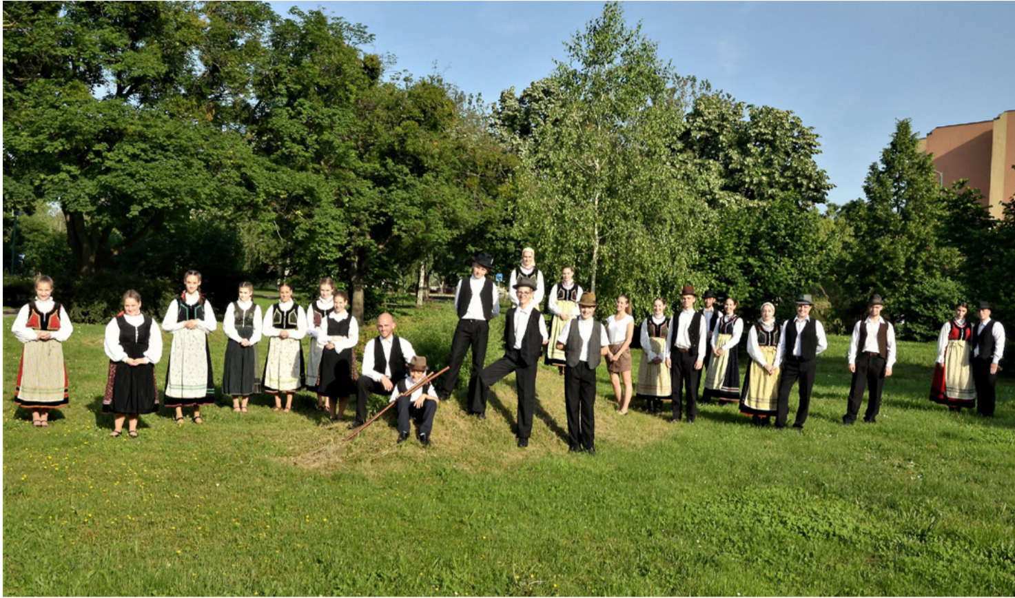
Az APTE táncosainak tudását a szakmai zsűri is elismerte