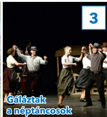
Gáláztak a néptáncosok