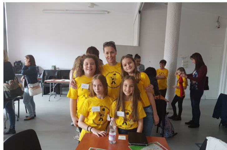
Heted 7 határon túl is a legjobbak