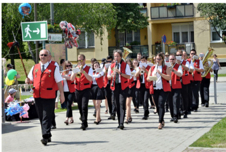
Már 95 éve színesítik a város kulturális életét a fúvósok