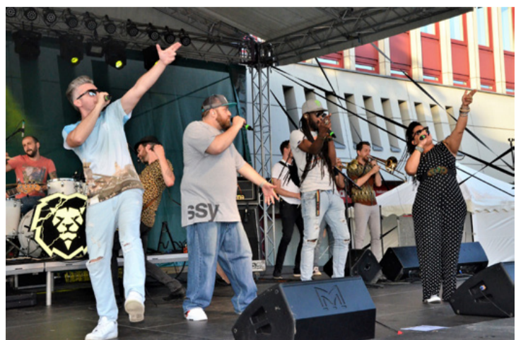
Megmozgatta a közönséget az Irie Maffia