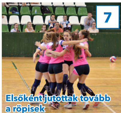
Elsőként jutottak tovább a röplabdások