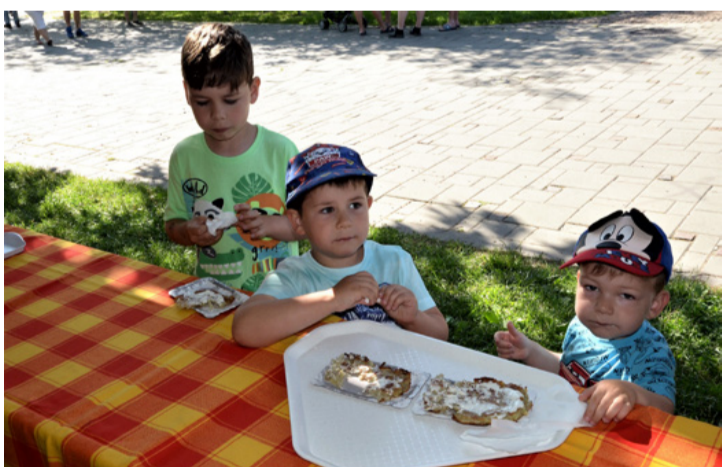
A legkisebbek sem hagyták ki a fesztivál névadó ételét