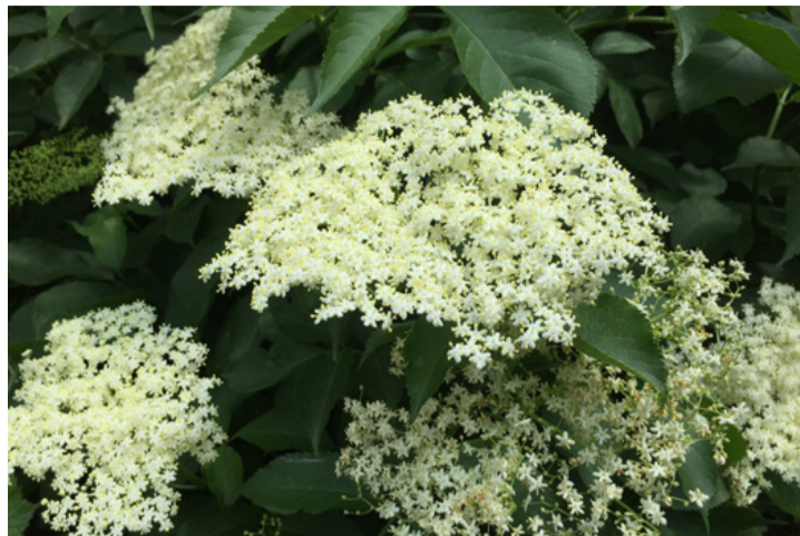
Egy kis bodzából bármikor készíthetünk frissítő nyári italt

Ismét elkezdett felkúszni a hőmérő higanyszála, ilyenkor jól esik egy kis hűsítő. Csak néhány bodzavirágra van szükség ahhoz, hogy elkészítsük a legfinomabb nyári italt.