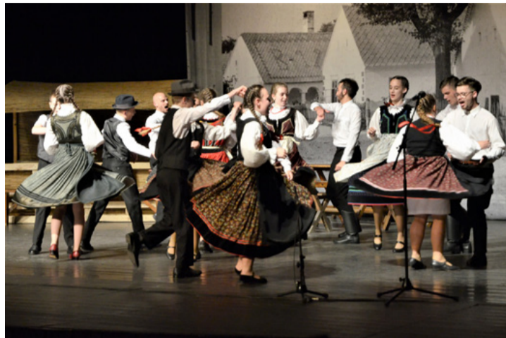
Pörögtek-forogtak a szoknyák