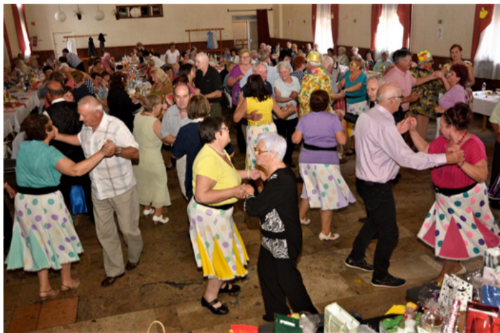
Visszafogott rock and roll