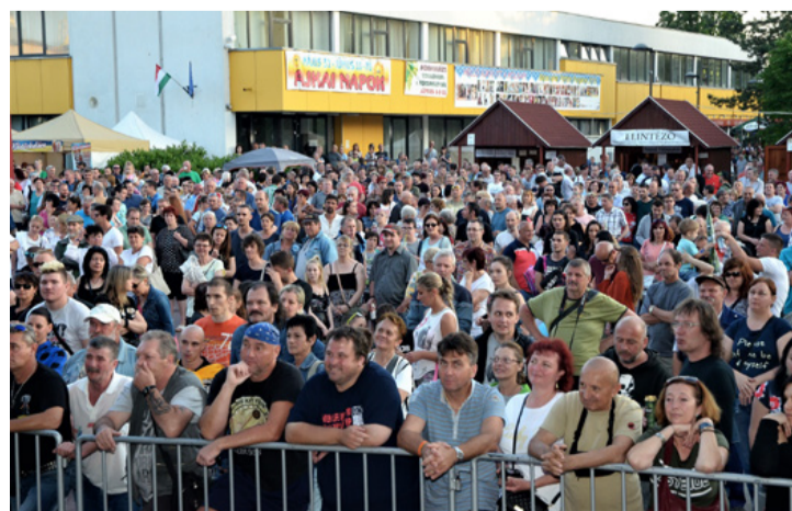
Tömeg várta a Karthagot