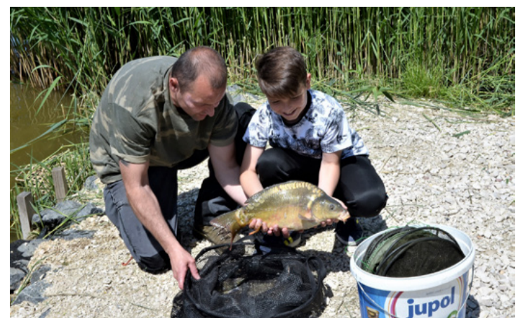
Gyermei öröm a tükörponty láttán