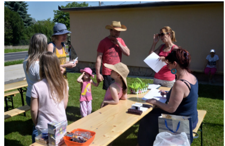
Kicsi és nagy is jól érezhette magát a városrészi napon