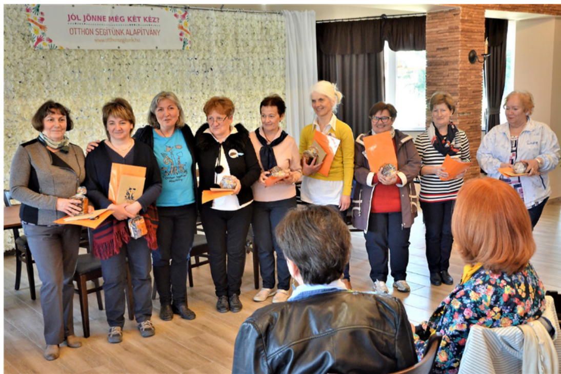
Új önkéntesekből nincs hiány, emléklappal (is) motiválták őket