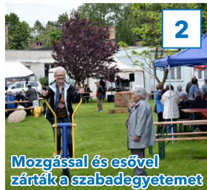
Mozgással és esővel zárták a szabadegyetemet