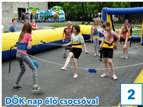
DÖK-nap élő csocsóval

32. évfolyam, 22. szám, 2019. június 14., péntek