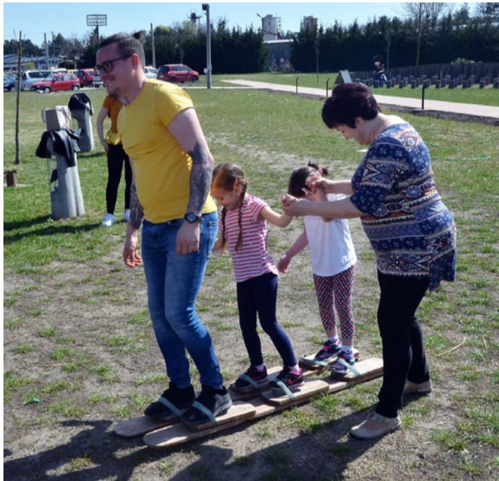
Egy kis segítséggel minden sikerülhet