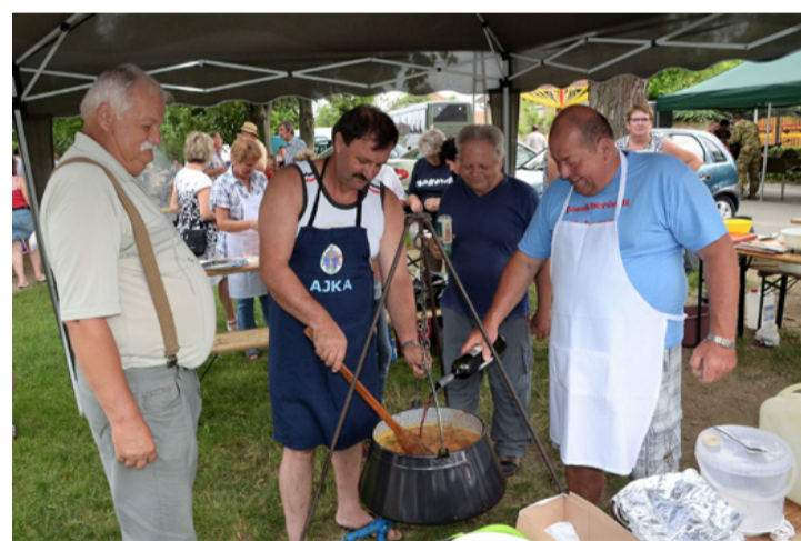
A Tósokberéndért Egyesület tagjai főzés közben