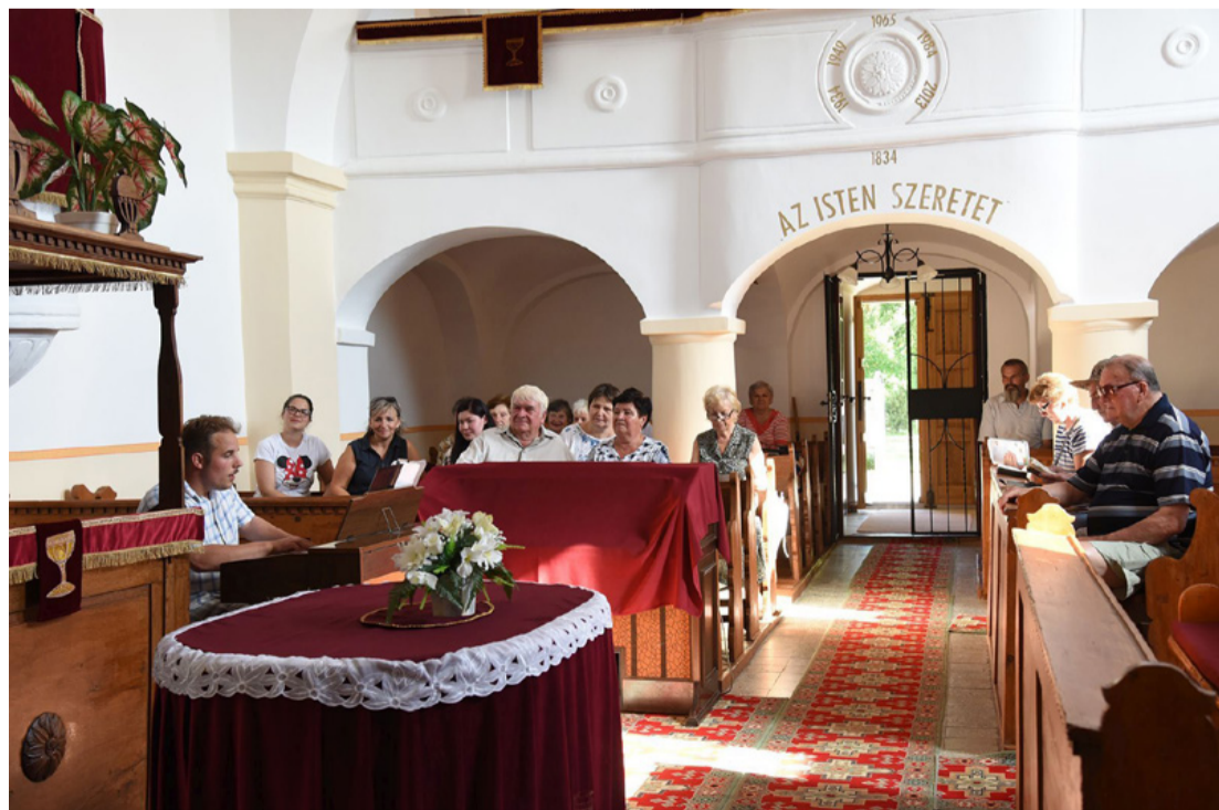
Tósokon mélyen gyökerezik a protestánsok vallása