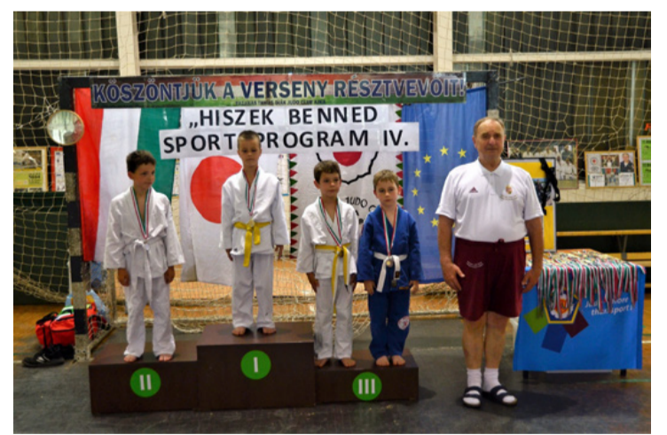
A legtöbb keleti sport alapja az önfegyelem. Jobbra a torna névadója