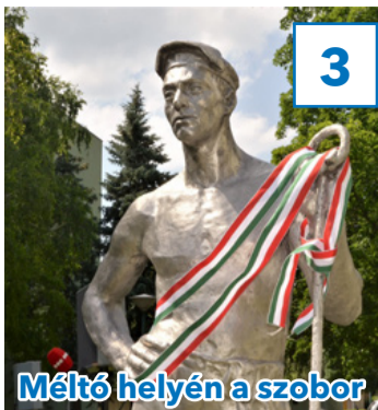
Méltó helyén a szobor