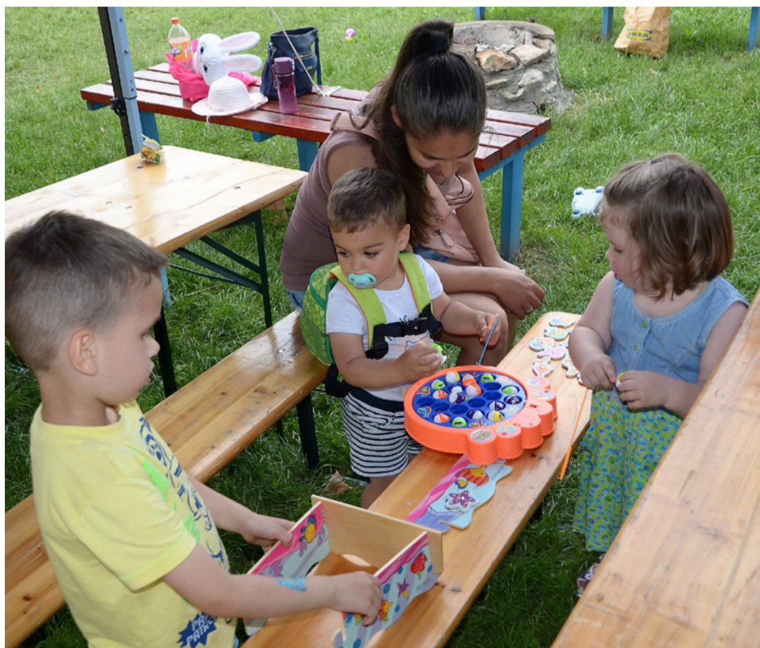
A bölcsis családi naphoz sok játék dukál