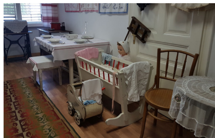
A premontreiek emlékszobája Bakonygyepesen