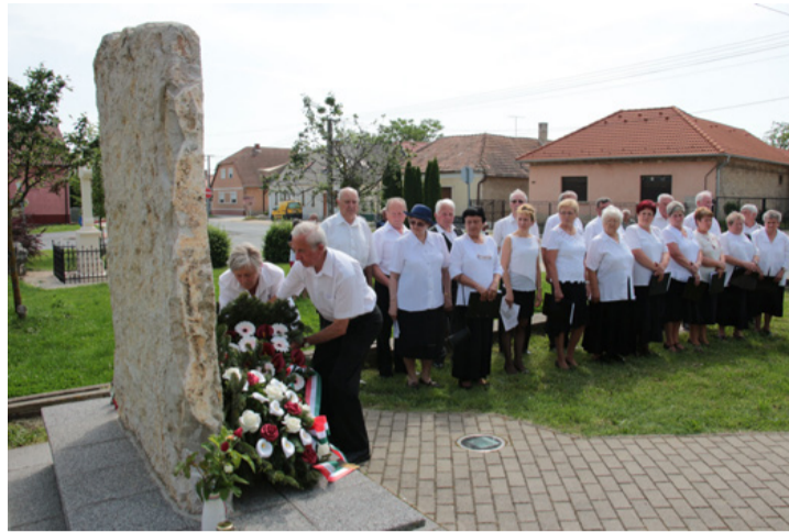
Koszorúzás az emlékműnél Bakonygyepesen