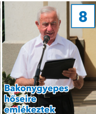
Bakonygyepes hőseire emlékeztek