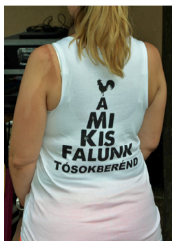
Így kell közösséget kovácsolni

A reggeli fröccsös ébresztő után egy óraker kezdődött a 11 nevezett csapat számára a szabad ég alatti főzés. Üstben, bográcsban, köcsögben és nyárson készültek az ételek. Közöttük a Tósok City, a Tósokberéndért Egyesület, a Fekete István Vadásztársaság nagyobb mennyiséget készített, amelyet kiporciózott a látogatók számára. A végén kiderült, hogy a zsűri szerint idén a Tósok City káposztás szarvas tokánya volt a legízletesebb. Második helyezett a Szentgáli veteránok étele a Bakonyi csülök zsemlegombóccal, de ők mellett még kuriózumként köcsögös csülkös babot is főztek. Harmadik helyre az ágyúban főtt kicsülök került,