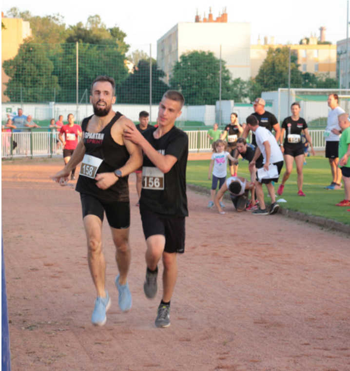
A sportban a sportszerűség is benne van