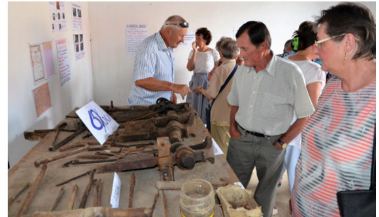
A régi kovácsszerszámok sok érdeklődőt vonzottak