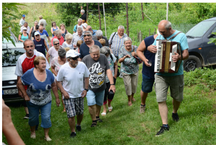
Jobban esik a bejárás harmonikász mellett