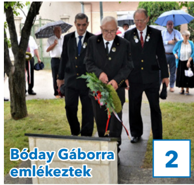
Bóday Gáborra emlékeztek

32. évfolyam, 24. szám, 2019. június 28., péntek