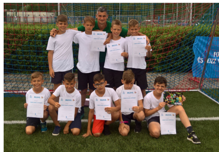
Kilenvenhat csapat között a tizenegyedik lett az ajkai U12

maga mögé utasítva, mint az Illés Akadémia, a Haladás, vagy a Zalaegerszeg. Az ajkaiak így részt vehettek a fináléban, ahol a végső győztes elnyerte a jogot, hogy a nemzetközi döntőben szerepeljen, amit ezúttal Barcelonában rendeznek. Az ajkaiak nem üres kézzel, hanem sok-sok dobóval érkeztek, amelyben a selejtezőn gyűjtött sportfelszereléseket, labdákat, cipőket, mezeket hoztak az állami gondozásban élő gyerekek számára. A szervezők ugyanis az egészséges táplálkozás és életmód népszerűsítése mellett a rászorulóknak megsegítését is célul tűzték maguk elé. Mivel a döntőre szinte csak akadémiaiak jutottak be, az ajkaiak tudták, hogy minden gólért, pontért keményen meg kell dolgozniuk. Bár a fiatalok becsülettel helytálltak, hatodikként zártak csoportjukban, így a másik csoport hatodik helye-