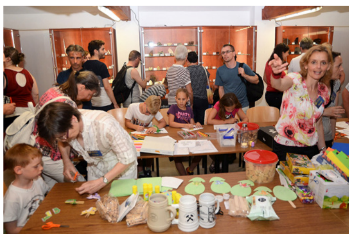
A megnyitó legnagyobb nyertesei a gyerekek voltak