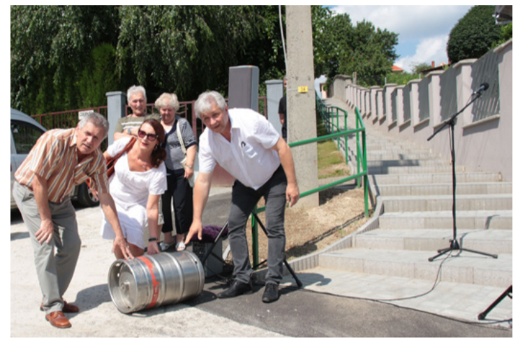
A „ritus” ezúttal sem maradhatott el