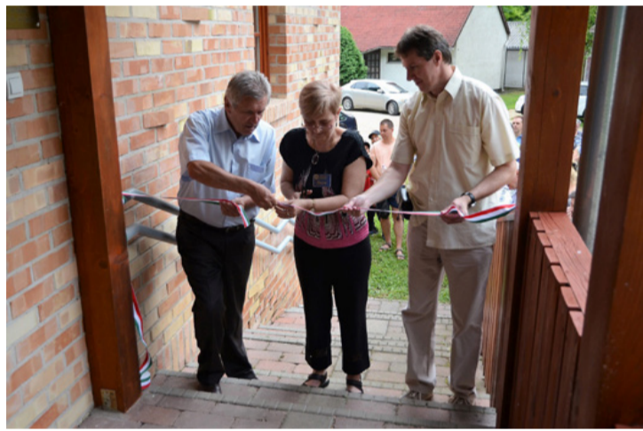
Lezárult a projekt, megnyílt a múzeum

A bakonyi dinoszauruszok nyomába eredtek az ajkaiak június 22-én Csingervölgyben. Az összetett program aktualitását a megújult Bányászati Múzeum átadása és a nyolcadik alkalommal megrendezett Múzeumok Éjszakája adta. Több, erre az időpontra tervezett program közül Pecsics Tibor biológus vetített képes előadása nyerte el legjobban a közönség tetszését.