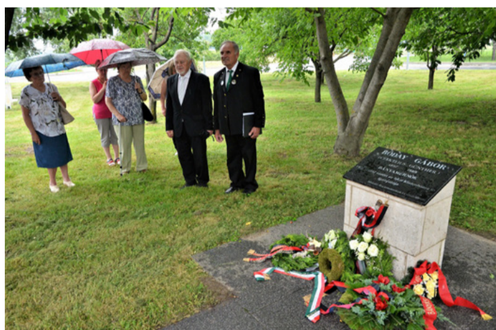
Tisztelet a nagy elődnek

Az ünnepséget kedves ven- déglátás követte sok régi emlék felidézéssel, mert bányászaink a kitermelés megszüntetése óta megannyiszor az emlékeikből táplálkoznak. Cs.B.É. ■