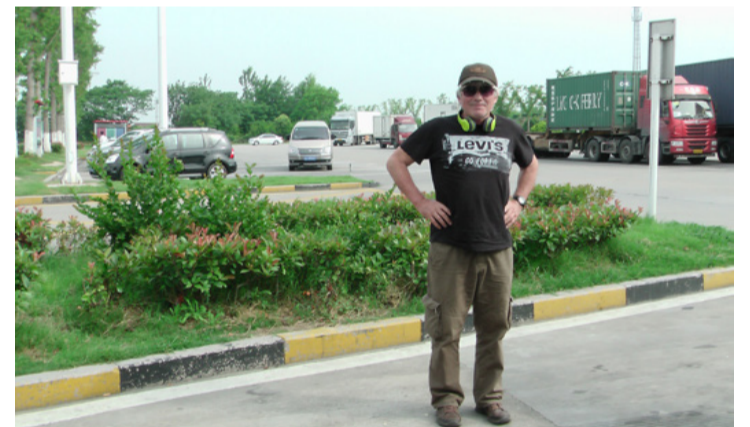
A szerző valahol Shanghai és Donghaj között, egy autópályá pihenőn

Hamar eljött az idő, amikor egy hatalmas Airbuson elhelyezkedve emelkedtünk a francia betontól, hogy tizenegy óras utazás után Shanghajban landoljunk. A kiszolgálás a gépen kifogástalan volt, nézhetünk filmeket és hallgathattunk zenét és három étkezés is benne volt a jegyben, persze kicsit „tábori körülmények” előre csomagolt kaját bontogatva az apró, lehajtható asztalkán. Végül is nem borult ki semmi, légörvénybe sem kerültünk és aludni