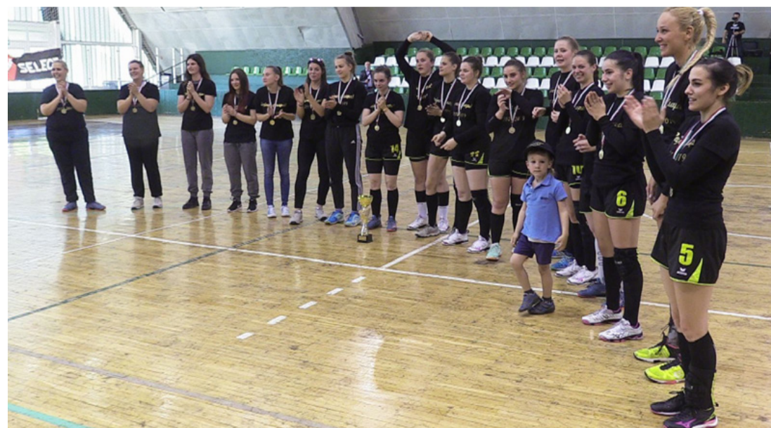
Már az NB II-ben. Szép volt lányok!