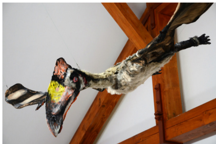
A dinók legközelebbi rokonai a madarak