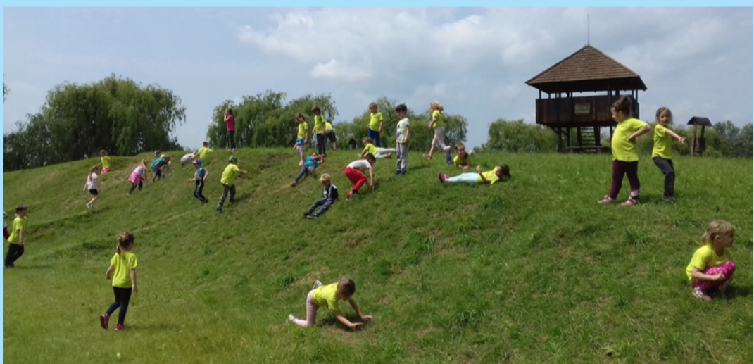
A kicsinyek szemlátomást jól érezték magukat

Pappné Káplai Ildikó óvodapedagógus, óvodavezető-helyettes