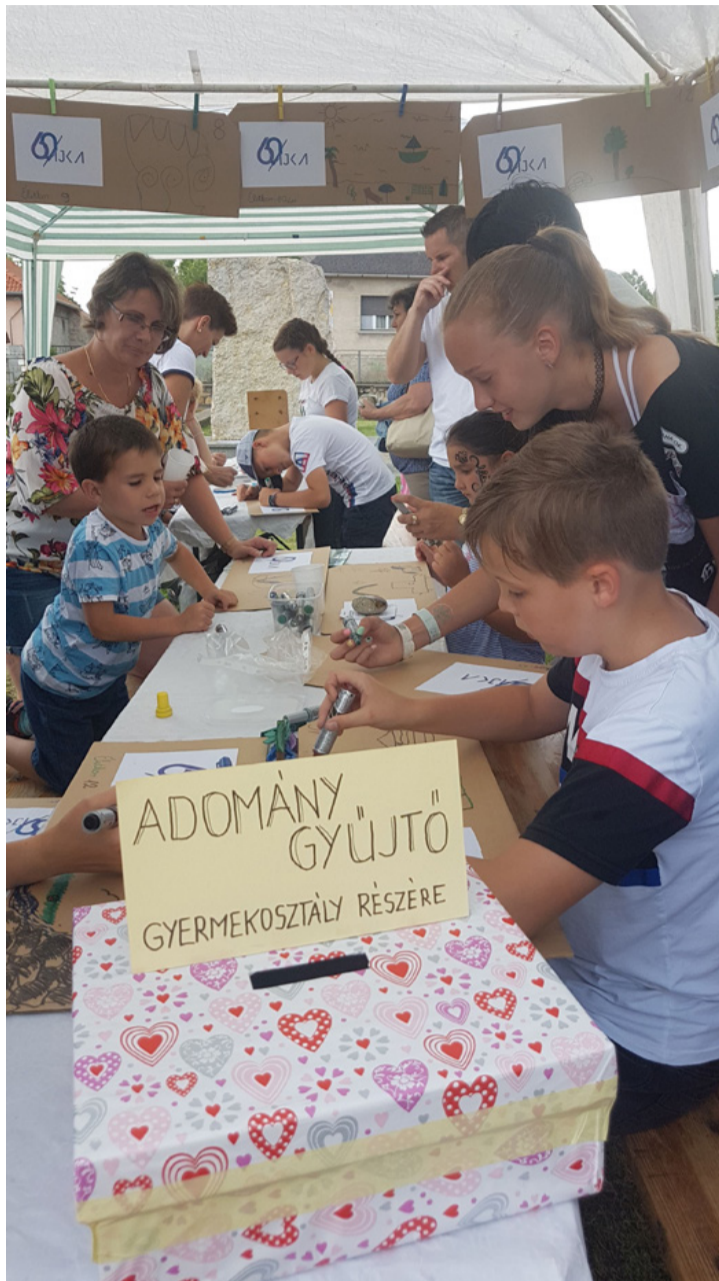
Jól és hasznosan telt a nap