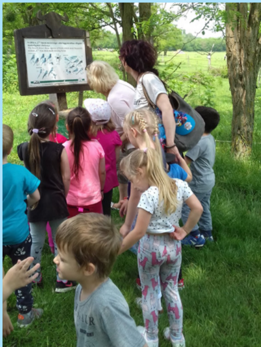
A felnőttek felolvasták, a gyerekek meg értelmelték

Mindannyiunk öröme áthaladtunk a hatalmas fahídon, melynek tetejéről megcsodáltuk a Kis-Balatont. A szigetre érve újból előkerültek a szendvicsek és a szomjoltó italok. Ezután felmentünk a kilátóba, ahonnan gyönyörködtünk a szép tájban, megcsodáltuk az elénk táruló látványt.