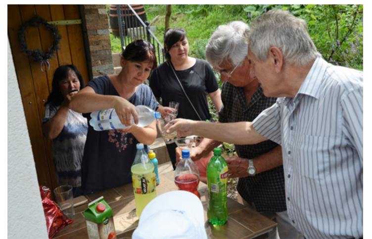
Néha egy kis ásványvíz is jólesik