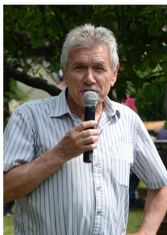
Utat, vagy vízvezetékét? Az itt a kérdés

Kettős jubileumot ünnepelt a Csékúti Hegyért Egyesület június 22-én. Fennállásának huszadik évében a tizedik „Egy nap, hegy nap” programot tartották meg a hegy középső és felső dűlőjében.