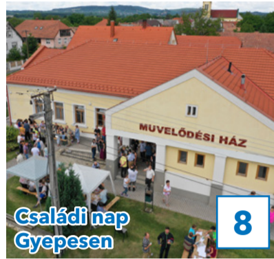
Családi nap Gyepesen