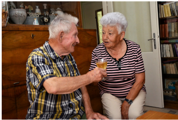
Jó bor, jó egészség! A hosszú, boldog házasság élő példája Tóni bácsi és felesége

Létszámléépítés következtében visszakért Gyulára tanárnak. Ekkor érezte, hogy igazán tanárrá kezd válni. Tagja lett az