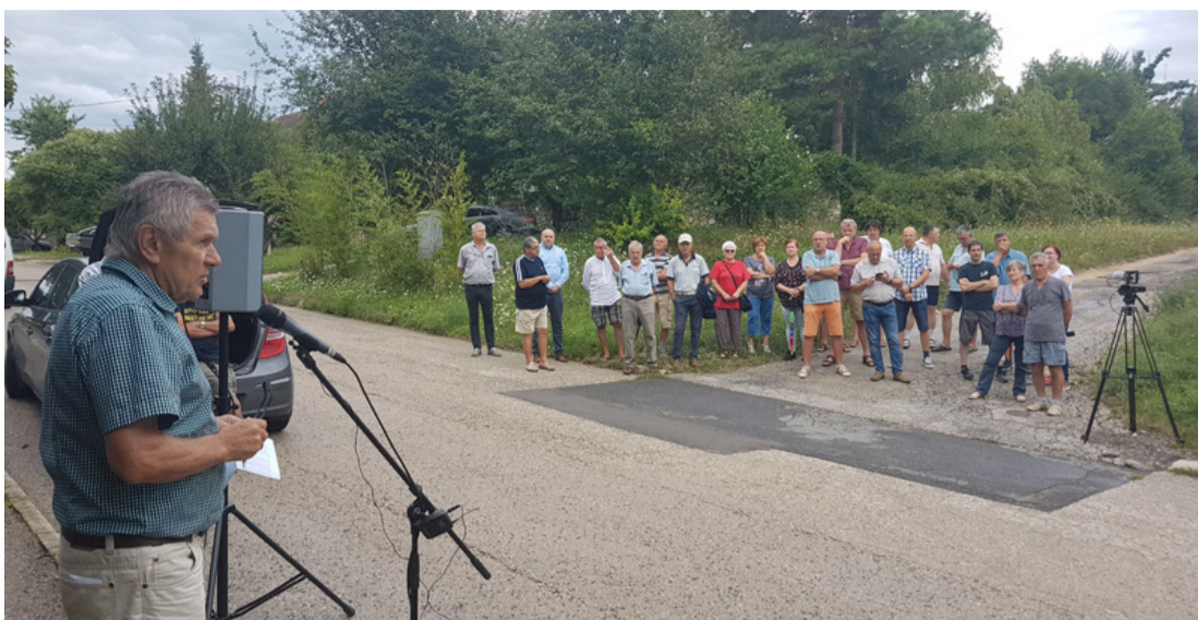
Köszönet mindenkinek, aki ingyen felajánlotta az ingatlanrészét a városnak!