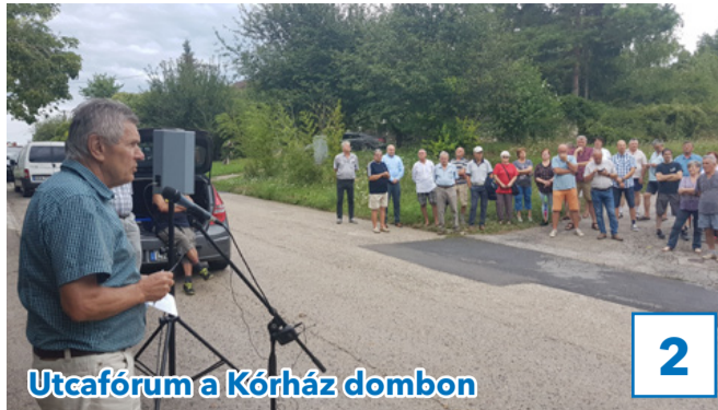
Utcaforum a Kórház dombon

32. évfolyam, 28. szám, 2019. augusztus 16., péntek