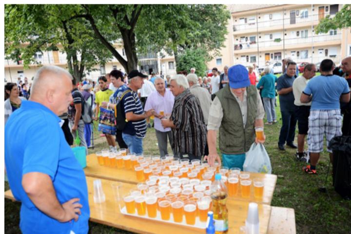
Két mosoly, két sör...