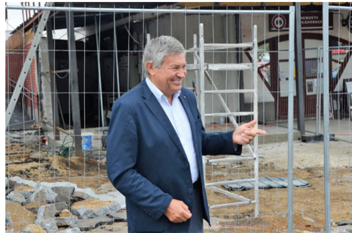
A jó hír az, hogy ki is nyit a Zenit – de rá sem fogunk ismerni

A felújítást követően az ABC, mivel a jelenleginél magasabb is lesz, jobban illeszkedik majd