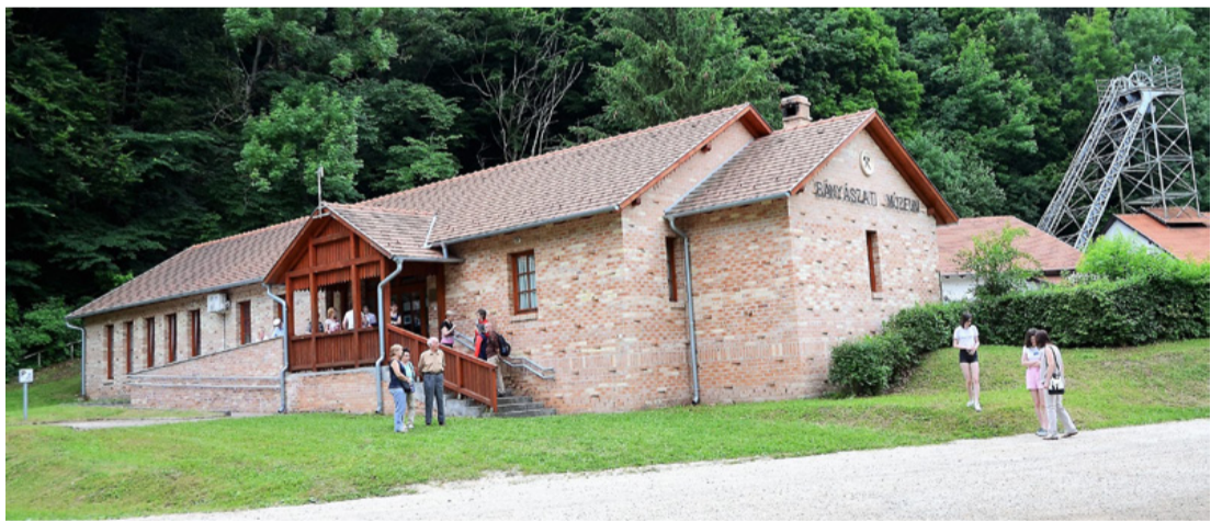
Csingervölgy őrzi a hagyományokat, kiváló helye lehet a múzeumi negyednek