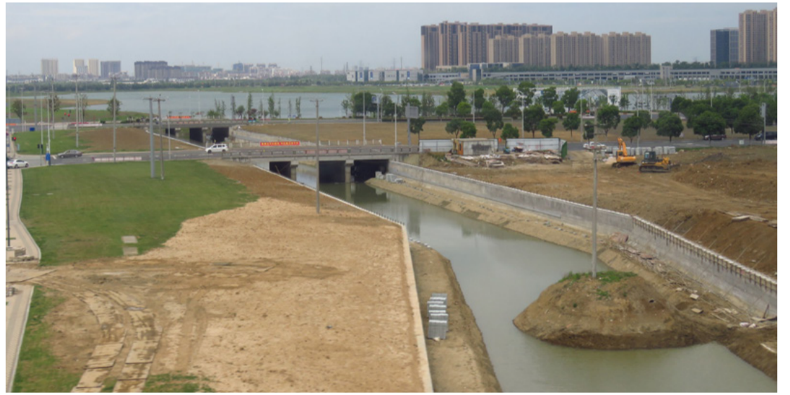
Félúton Ningbo felé. Nem volt könnyű egy 350 km/h-val száguldó vonatból fényképezni

Következik: Konferencia, kiállítás és ezeréves múlt