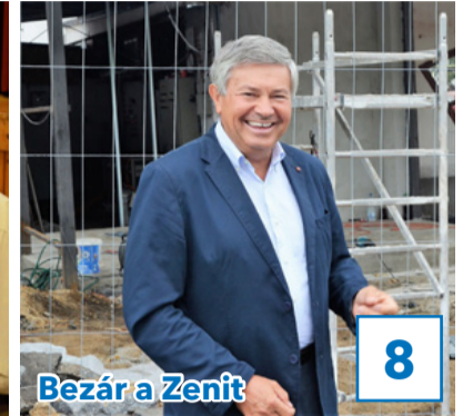
Bezár a Zenit