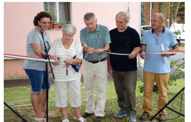
A közös képviselők és a város vezetői a szalagátvágásnál