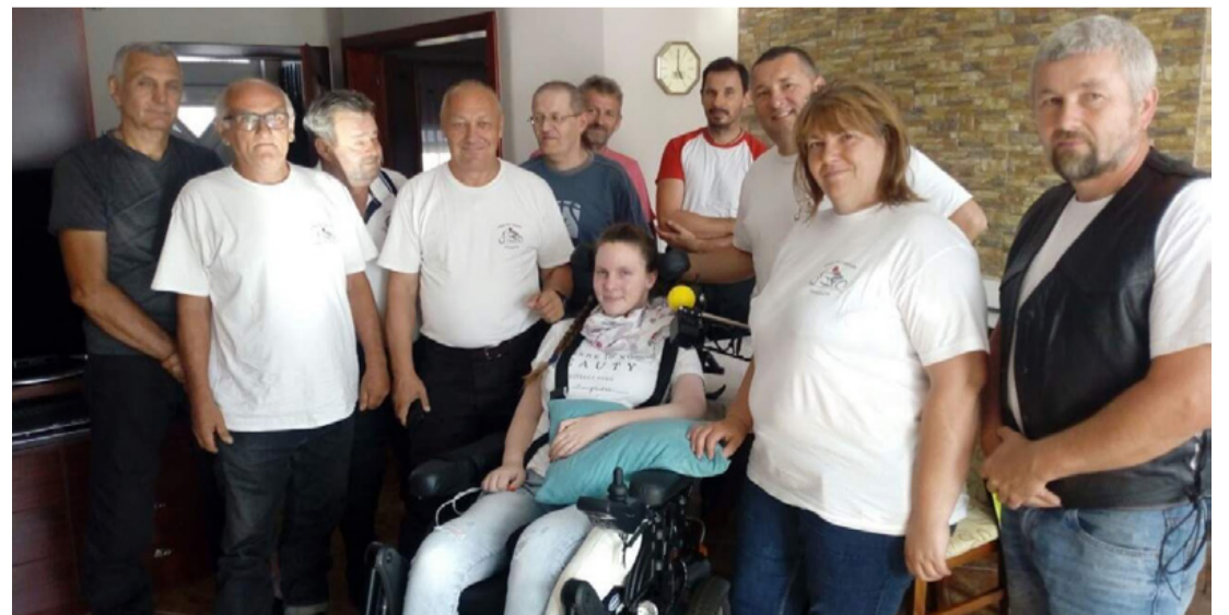
A szeretet is gyógyíthat...