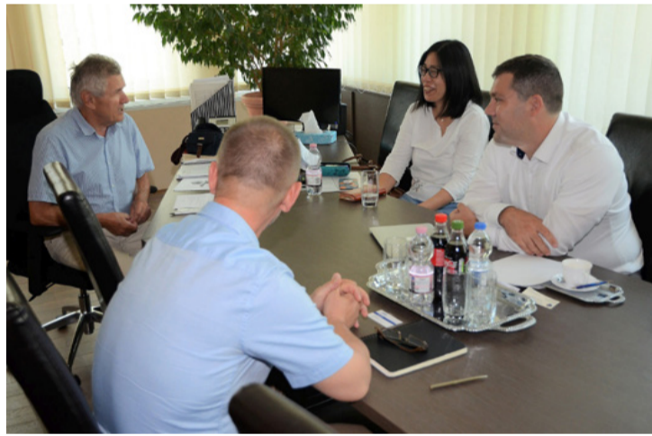
Terítéken az okosórágyár a polgármesteri hivatalban