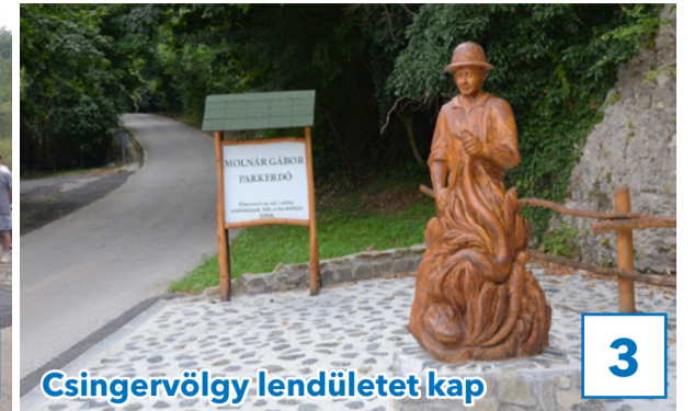
Csingervölgy lendületet kap