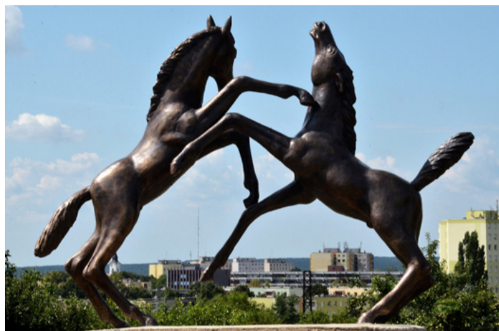
A csikószobrok derűt sugároznak