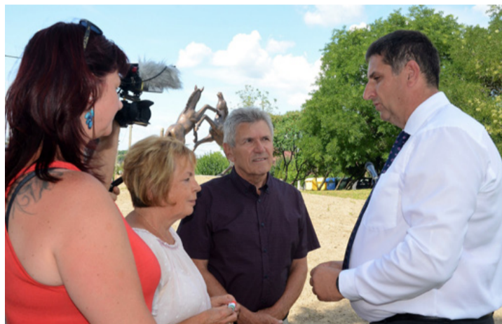
Rögtönzött tájékoztató a frissen átadott szoborcsoport mellett