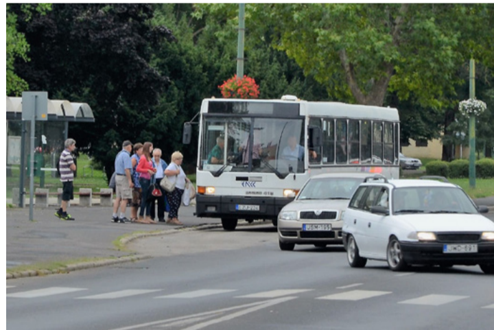
Az ajkai önkormányzat évente százmillió forinttal támogatja a helyi tömegközlekedést