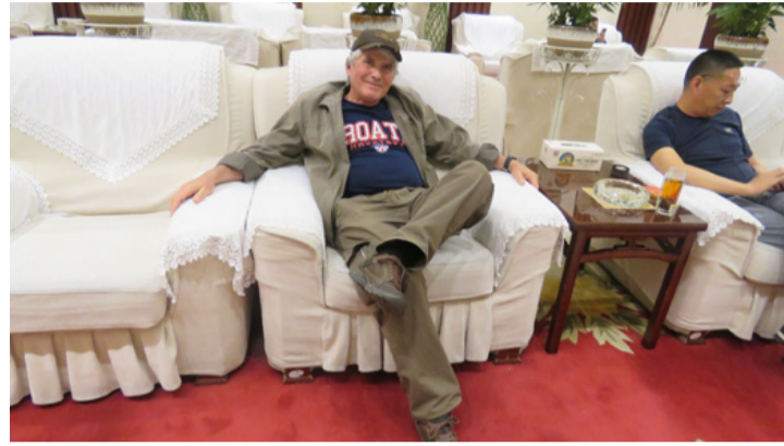
En még ilyen vasúti várótermet nem láttam