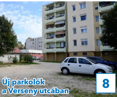
Új parkolók a Verseny utcában