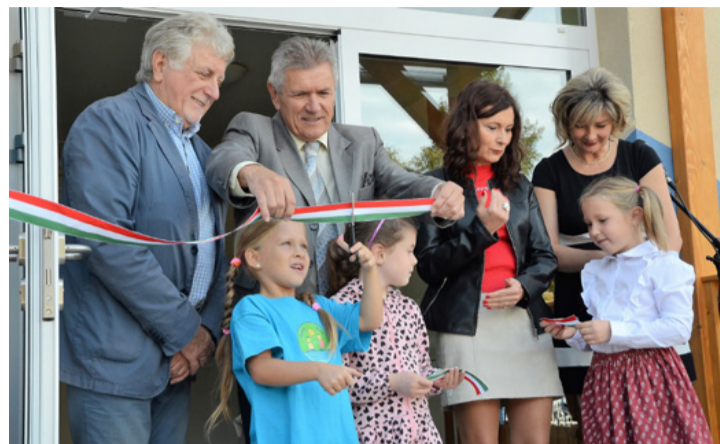
A legilletékesebbek avattak