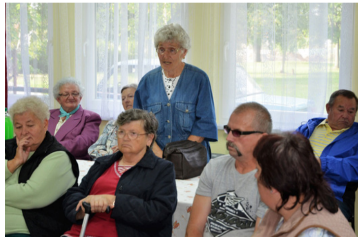
Mindenki elmondhatta a véleményét