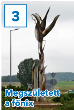
Megszületett a főnix