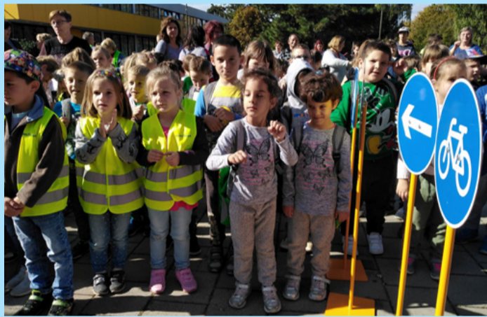
A gyerekek élvezték a foglalkozást

A kampánnyal azt szeretnék elérni, hogy minden közlekedő gondolkodjon el azokkal a