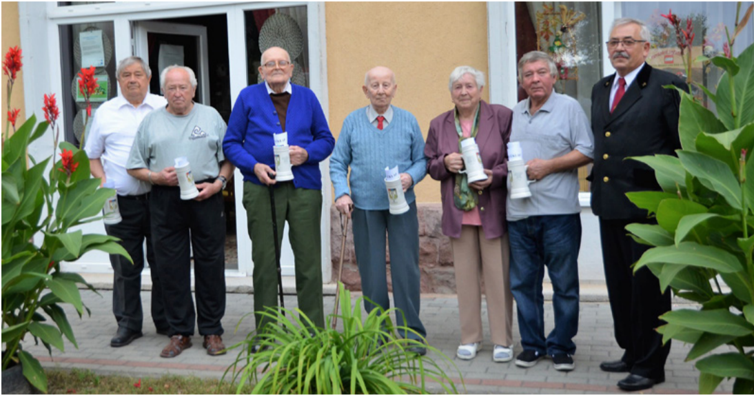
Kitüntették a legkitartóbbakat. Jobb szélén a nyugdíjas szakszervezet elnöke

■ A Bányász Közösségi Házban adták át az Ajkai Bányász Nyugdijas Szakszervezet tagjainak az emlékkleveleket és a bányász korszakat szeptember 28-án, melyekkel a szakszervezetben végzett sok éves munkát és az 50, vagy még ennél is több éves tagságot köszönték meg.