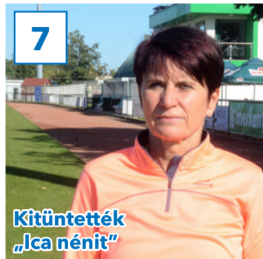
Kitüntették „Ica nénit”