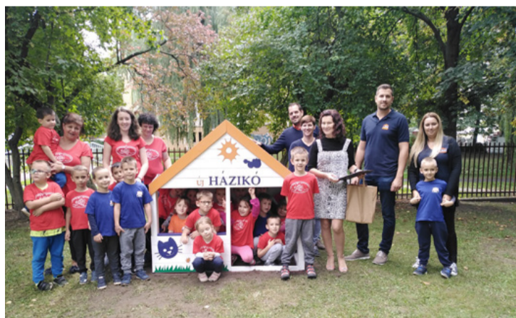
A kicsik örömmel vették birtokba a játszóházat