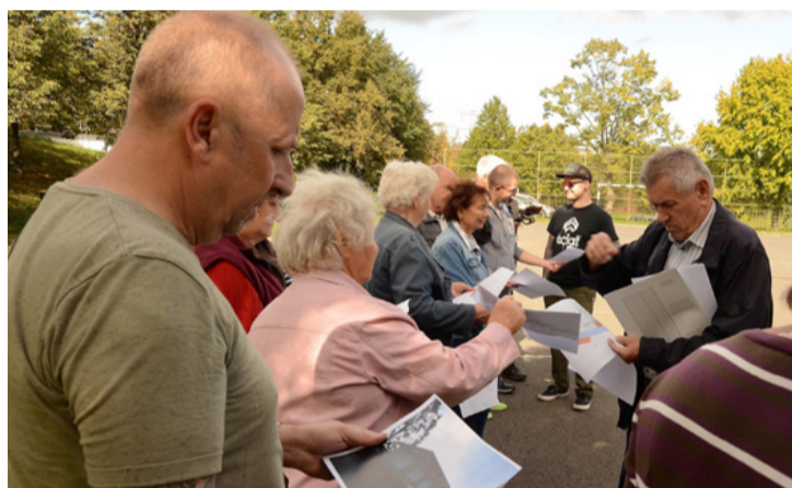
A tervek szinte minden megjelentet érdekeltek