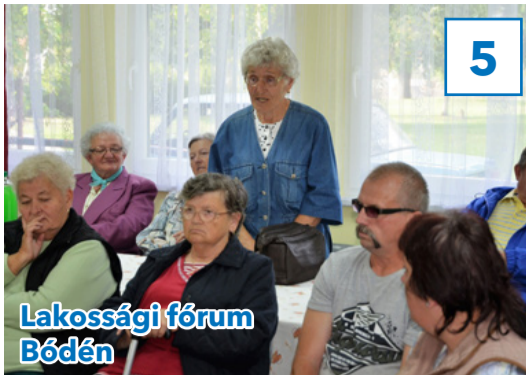
Lakossági fórum Bódén