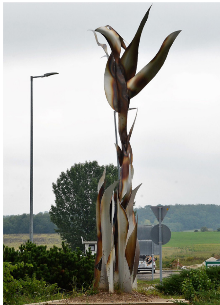
Impozáns szoborral gazdagodott a város

hamvából új, fiatal madár kelt életre. Az ajkai Főnix park története 1996-ra nyúlik