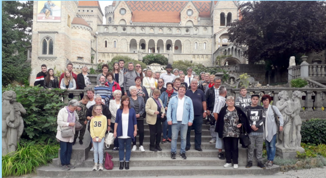
A kirándulók a Bory-vár előtt