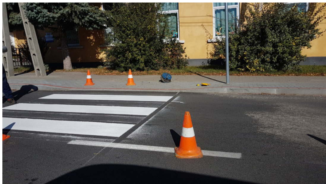
A fejlesztések egyik eredménye az új gyalogátkelő