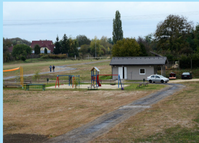
A bányakertre szinte rá sem lehet ismerni