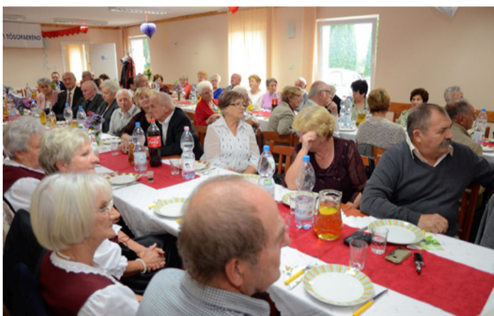
A „regösök”

■ A Tósokberéni Községi Házban nagyszabású ünnepséget tartottak a Hagyományörző Regös Nyugdíjas Klub 25 éves jubileuma alkalmával október 10-én. Az eseményen kitüntetések és ajándékokat is átadtak.