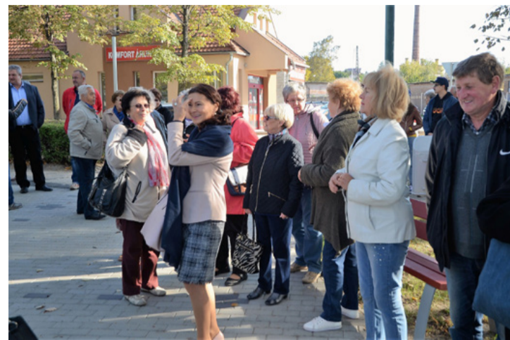
A piactér már az ókorban is emberek találkozóhelye volt