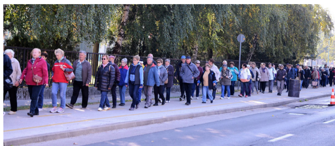
Hosszan kígyózott a sor a kerékpárúton

Ezután a menet a Korányi utca felé vette az irányt. A