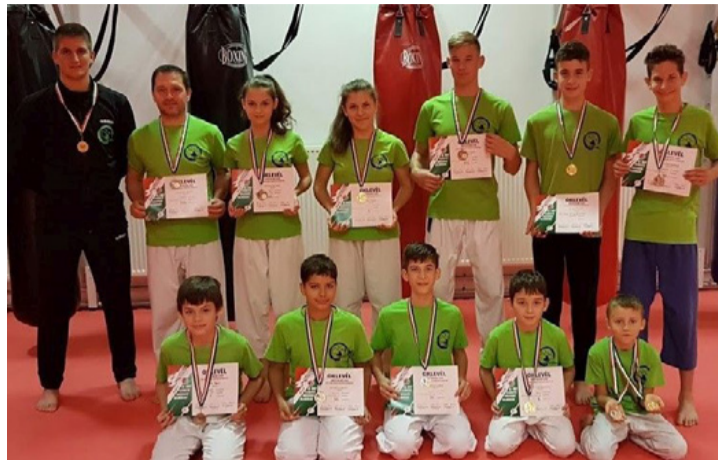
A Sun-Dome SE versenyzői