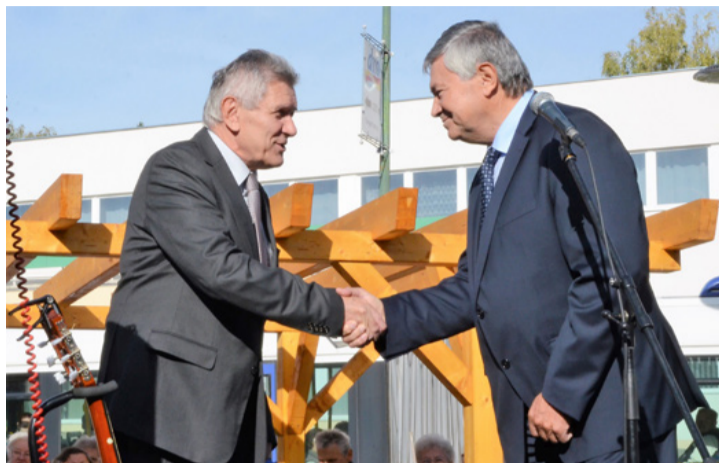
Az együttműködők kézfogása