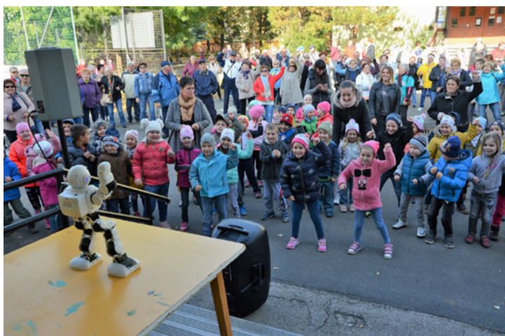
Bemelegítés sok nevetéssel