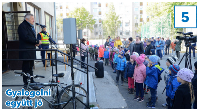
Gyalogolni együtt jó