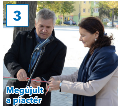
Megújult a játszótér