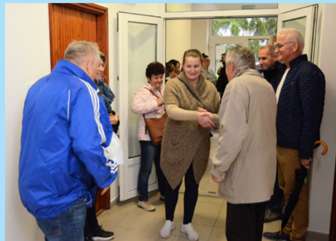
Elkezdődött a beköltözés a Galambházba

Október 10-én két létesítményt adtak át. A Galambház épületét 100 millió forintért vette meg az