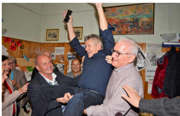
Ez a pillanat is eljött