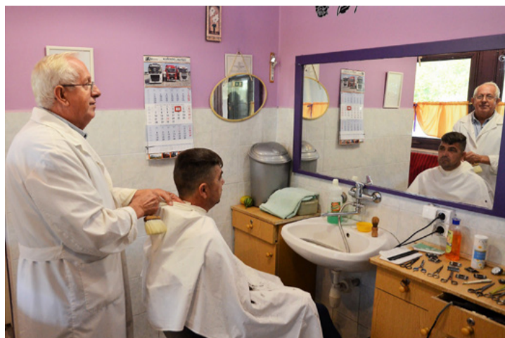
Szembenézés a múlttal