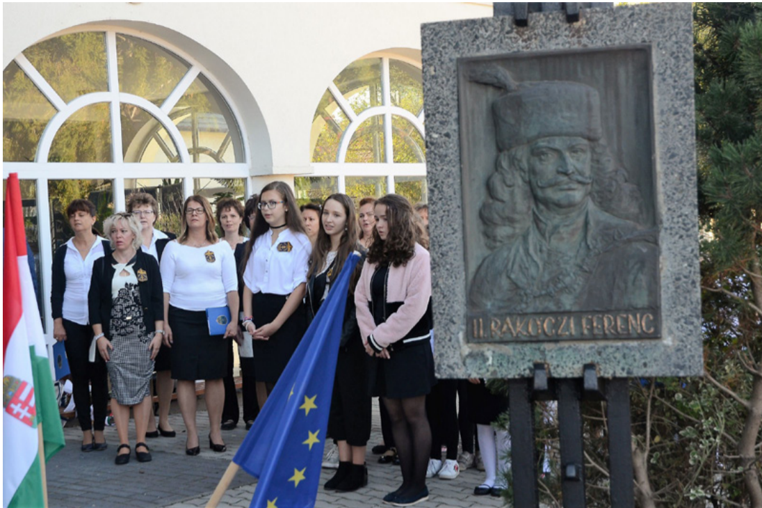
Ismét régi helyén a szabadságvágy szimbóluma