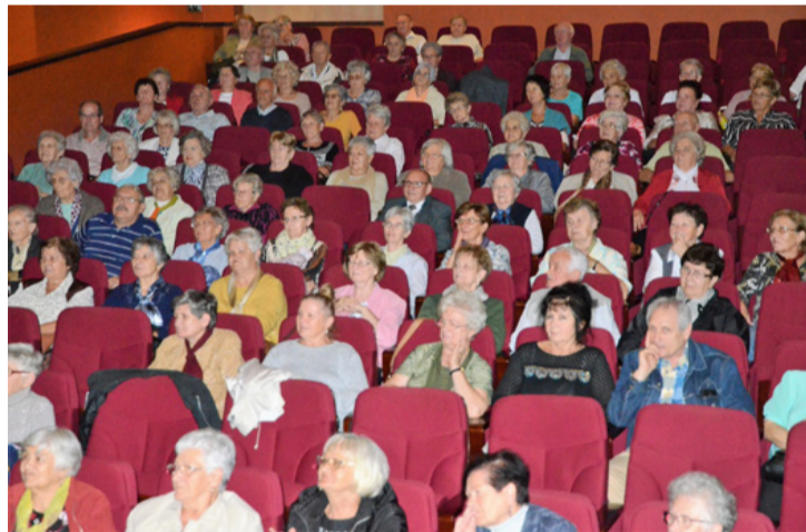
Ajkán több, mint 6000 hatvanöt év feletti polgár él