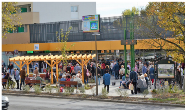
A felújított Zenit ABC homlokzatán egy 3x2 méteres LED-fal is helyet kapott

a felújítása. A rendelőintézet, a múzeum, a művelődési ház és a városháza épületei megújítását követte a városközpont ebben a ciklusban. Megújult a Center