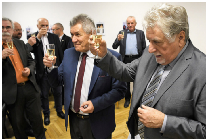
A város vezetői köszöntik az ajkaiakat