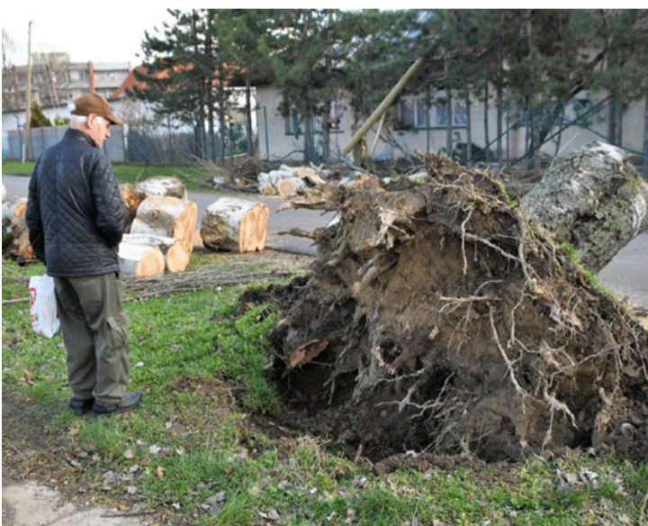
Némelyik fának már alig van gyökérzete