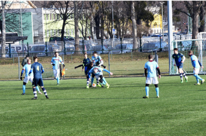
Elbotlott a Kristály