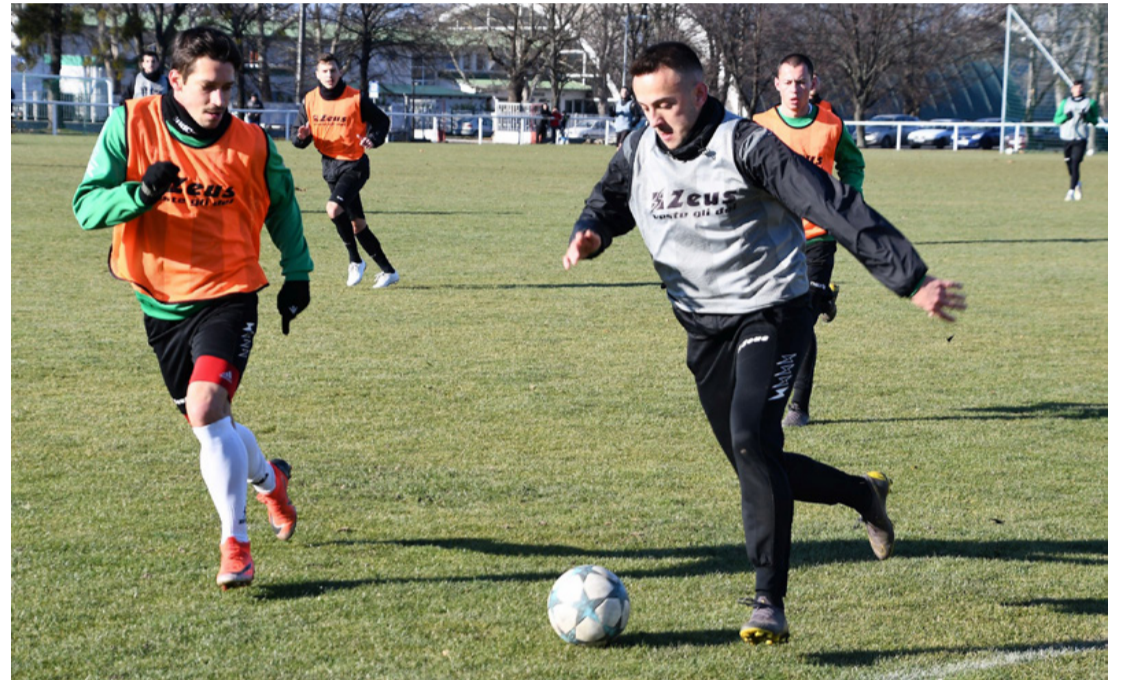
Az őszinél eredményesebb szezonra készül az FC Ajka