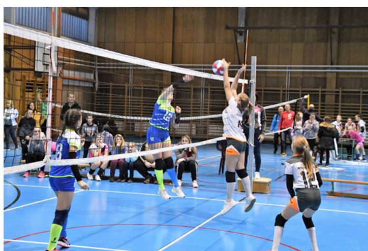
Légiarc a hálónál