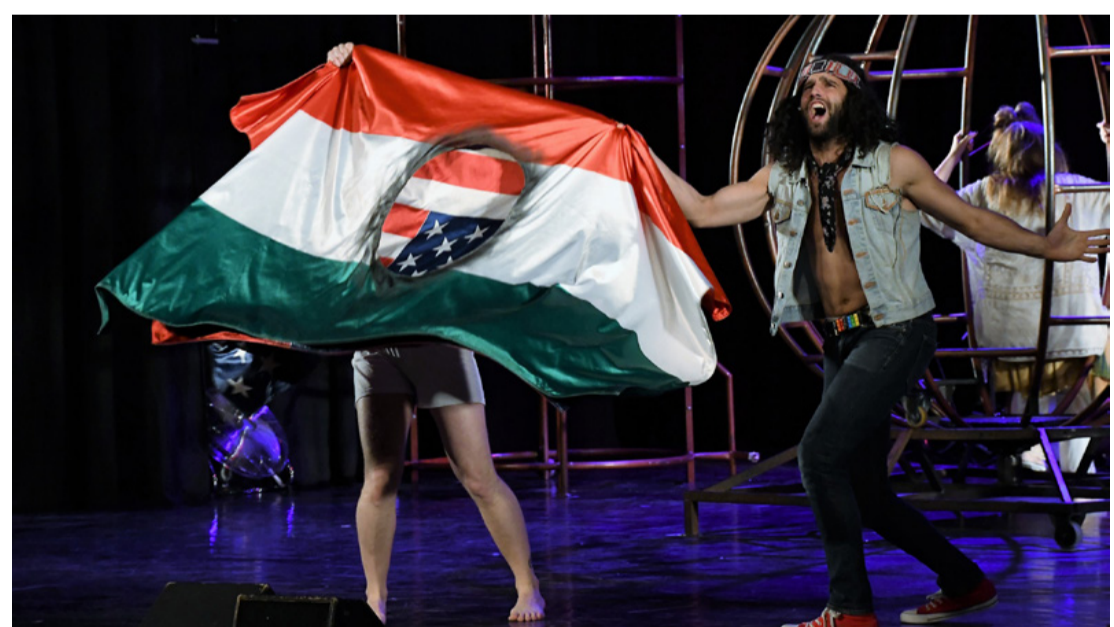
Bármilyen furcsa, a magyar szabadságharcra is történik utalása az előadásban (Fotó: Györkös)

Mielőtt bármi logikát keresnénk a sztoriban, nem árt tudnunk, hogy a főhős, Claude Bukowski katonai behívót kap - a fiatalember egy kivándorolt család sarja, azaz lengyel is meg magyar is, mégis be kell állnia az amerikai hadseregbe, hogy Vietnámban harcoljon. De a sors más irányba fordítja az életét, mondhatni szerencséjére, hiszen belecsöppen egy identitását kereső társaságba. (Ezt így is megfogalmazhatjuk, de még nyilvánvalóbb, ha azt mondjuk: egy szenvedélyes, őszinte, szabadon élő és gondolkodó, a szabályokra és a törvényre fittyet hányó hippi csapatba tereli a sorsa.) Az örök lázadóknak szenvednek attól a világtól, amelyben élniük kell. Hovatartozásukat keresik és nem igazán értik, mi közük van saját hazájuk döntéséhez, ahol a