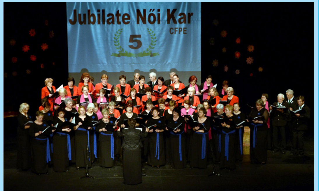
A Jubilate évfordulós hangversenye