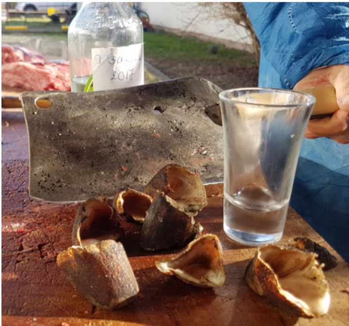
A pálinka disznókörömből az igazi

■ Bőséges böllérreggeli, hurka, kolbász, töltött káposzta és még megannyi finomság várta a falubelieket Rendeken ahol január 11-én tartották immár tizenkettedik alkalommal a hagyományos sváb disznótort. Az Ajkarendekért Egyesület így szeretné ezt a kiveszőben levő szokást tovább éltetni. A disznóvágásból nemcsak a nagyok, a kicsik is kivették a részüket. Az egyesület a Német Nemzetiségi Önkormányzat támogatásával a 180 kilós ártányt (egy süldő korában kiherélt disznót) egy helyi gazdától vásárolta meg. A kan disznót azért fosztják meg férfi mivoltától, mivel így könnyebben hízik és húsa sem lesz „kanizú”.