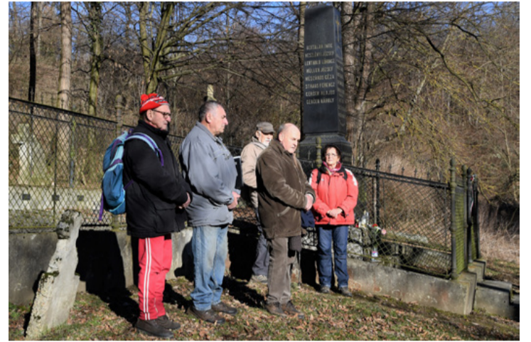
Az áldozatok emléke bennünk él tovább

Hősies, önfeláldozó mentést folytattak a bányászok vezetőikkel együtt, többen lettek rosszul, vagy vesztették el mentés közben az eszméletüket, életüket, mire sikerült a felszínre juttatni az élőket. Délután 3 óra lett stabil a szellőzés, és egy kassal a szállítás. Az elakadt másik kast, benne a halottakkal másnap tudták kiszabadítani, ekkor vált véglegessé a veszteséglista. A 14-én reggel leszállt 259 emberből 55 vesztette életét.