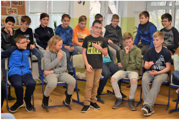
Megtanulják, hogy az esélyegyenlőség mindenkinek alapvető joga