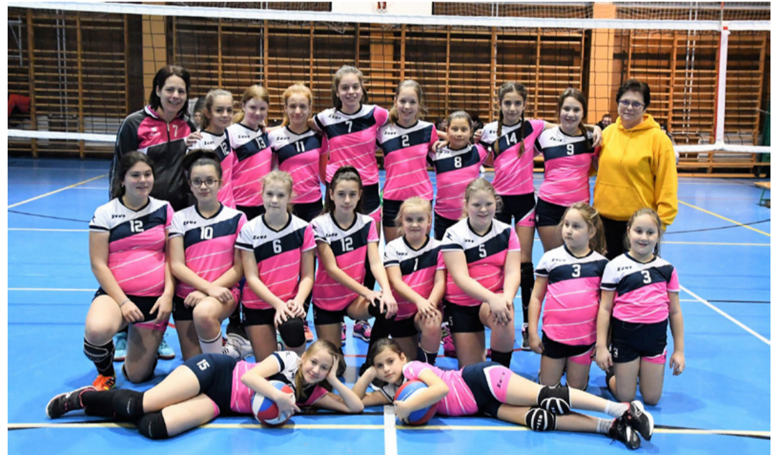
Egyszer majd nagyok lesznek. A győztes szolnoki csapat