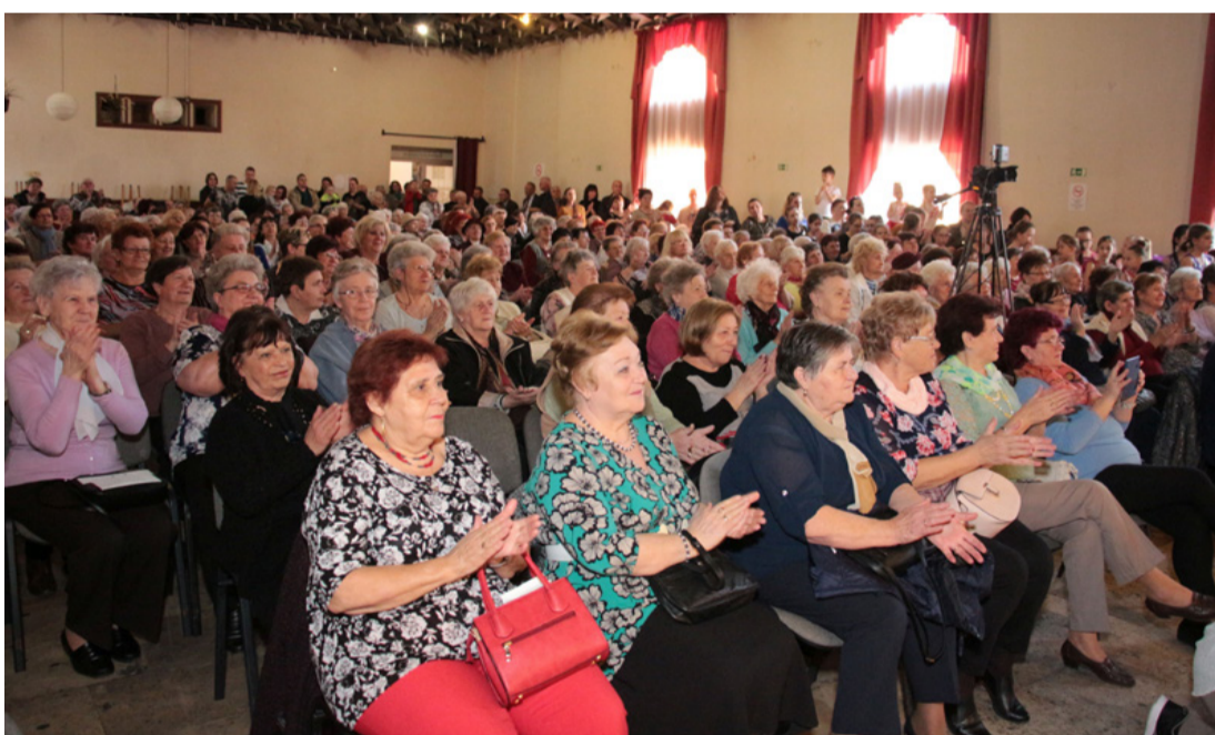
Nyugdíjasok nőnapjára ünnepségen a Kaszinóban

Az idősök a lakóhelyükön működő kulturális vagy hagyományörző egyesületekben is tevékenykednek és végeznek az adott városrész fejlődése érdekében is kiemelkedő tevékenységet. Megszervezik a nemzeti vagy egyházi ünnepeken a megemlékezést, gondozzák a parkokat, a hősök sírjait. Csinger városrészben a Csingervölgyért Egyesület tagjainak nagy része ma már nyugdíjas egykori bányász, akik emlékparkot hoztak lét-