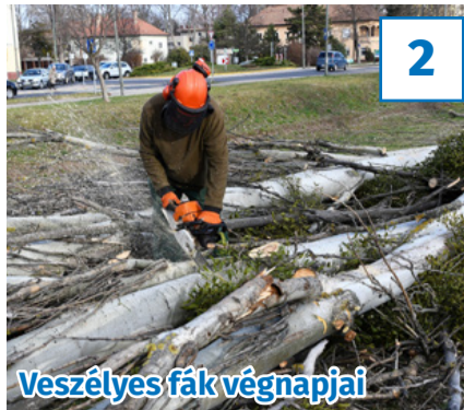
Veszélyes fák végnapjai

33. évfolyam, 2. szám, 2020. január 17., péntek