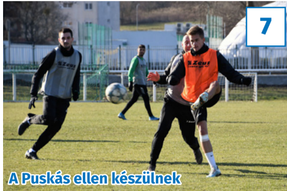
A Puskás ellen készülnek