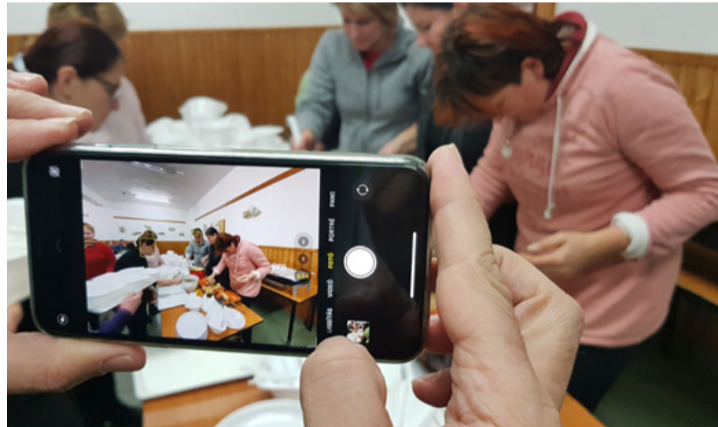
Emlék fotó a vacsora előkészületeiről