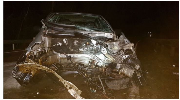
Ha ez nem ijesztő, akkor semmi sem

Rövid idő leforgása alatt több baleset is történt megyénk útjain. Információink szerint két súlyos sérültje is van annak a balesetnek, ami január 15-én késő délután történt Bakonygyepes határában. Az ütközés következtében az egyik gépkocsiból a motor is kirepült.