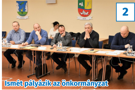
Ismét pályázik az önkormányzat

33. évfolyam, 3. szám, 2020. január 24., péntek