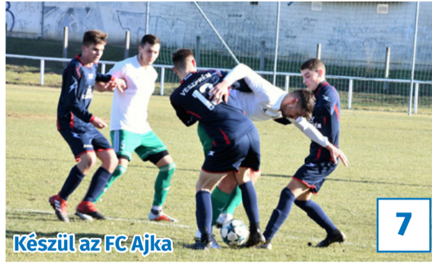
Készül az FC Ajka