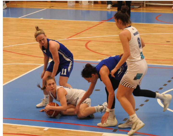
Végül a Csata DSE fogott padlót