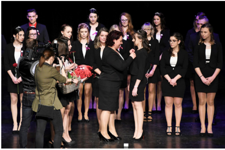
Az élet nagy pillanata