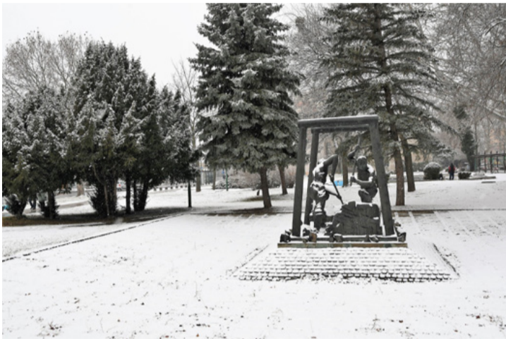
Visszaköszön a fekete-fehér múlt