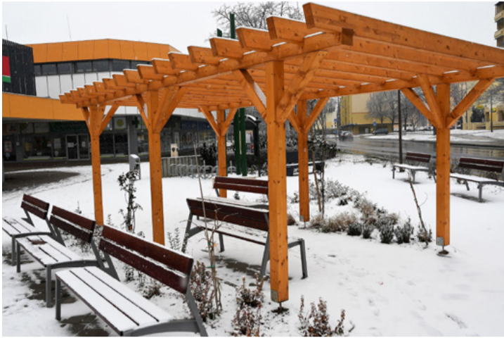
A pergola most először látott havat