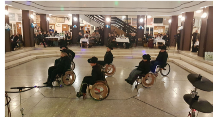
Kerekesszékekkel a „táncparketten”

fontosnak tartják, hogy a pedagógusok, szülők, külsős kollégák egy ilyen rendezvény kapcsán is együttműködjenek, hiszen az ő közös munkájuk elengedhetetlen feltétele az intézmény sikeres és hatékony nevelő-oktató munkájának. Ahogy a neve is sugallja, a jótekonysági bál teljes bevételét a gyerekekre fordítják majd. Terveik között szerepel egy korszerű és modern fejlesztőterem kialakítása, az óvodai csoportok számára csepphinta, a nagyobbaknak pedig multifunkcionális játékasztal vásárlása.