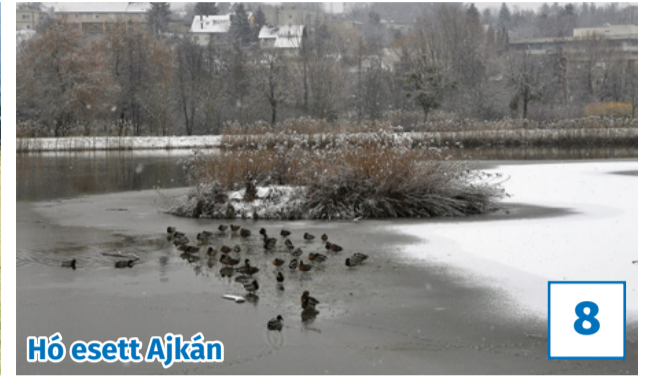
Hó esett Ajkán