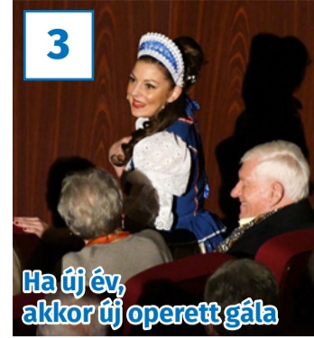
Ha új év, akkor új operett gála