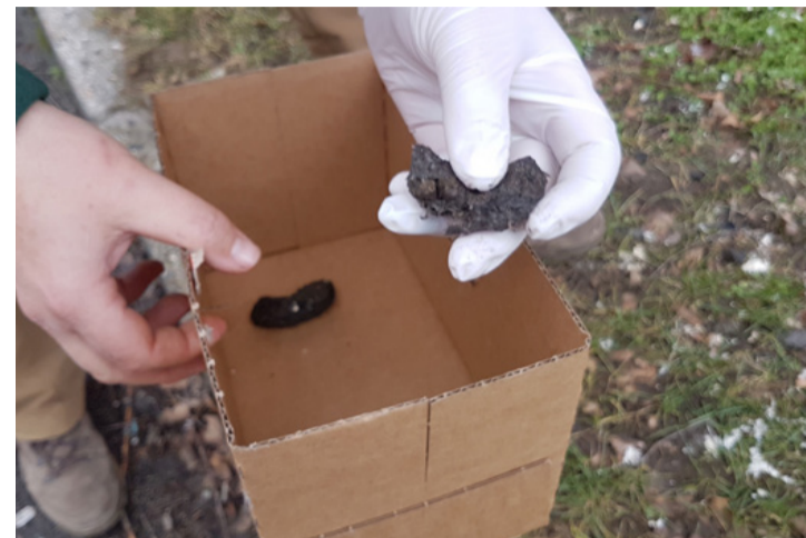
Bagolyköpet premier planban

– Mert ezeknek a változásáról meg tudjuk állapítani egy-