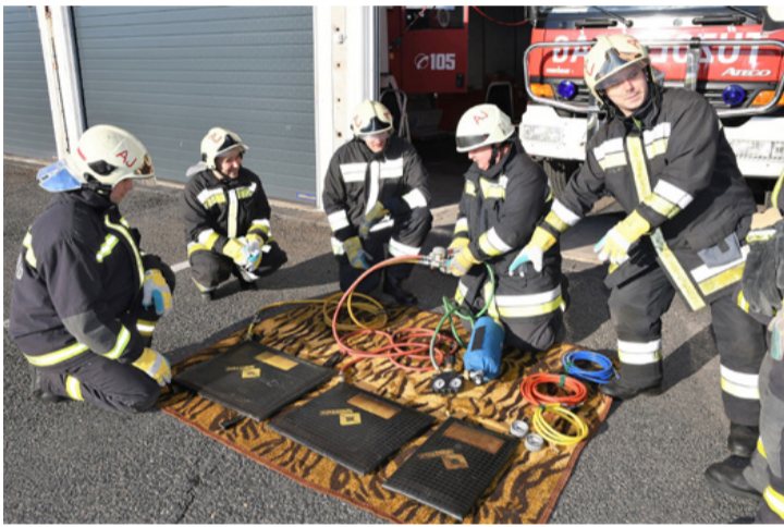
Az év legjobb tűzoltói gyakorlat közben