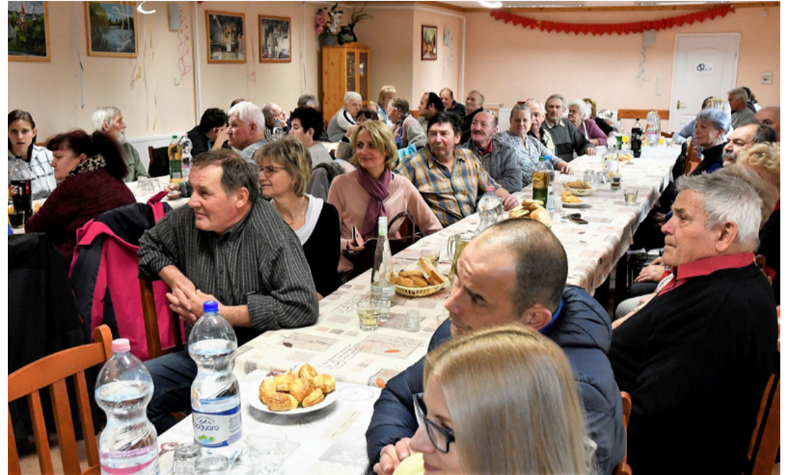
Megtelt a terem egyesületi tagokkal és vendégekkel, disznótorosra várva