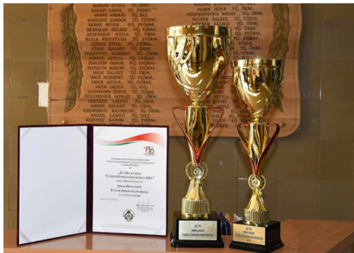
A vándorszerleg és a díj

Aján és a térségben is egyre erősebbek a szelek és egyre hevesebbek a zivatarok, hirtelen lezúduló csapadékkal, aminek oka talán a klímaváltozásban keresendő. Az ezek által okozott károk elhárítása egyre több feladatot ad a tűzoltóknak is. A