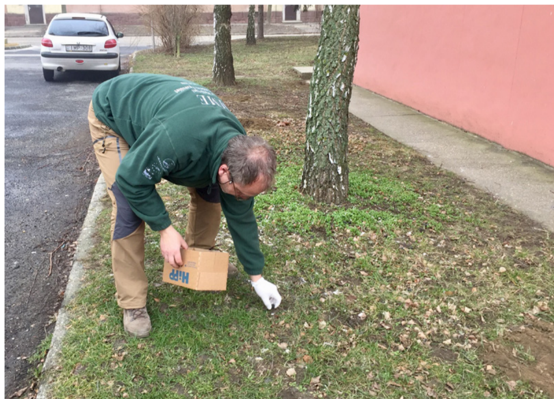
Ami a járókelőnek szemétkupac, az a kutatónak értékes információforrás