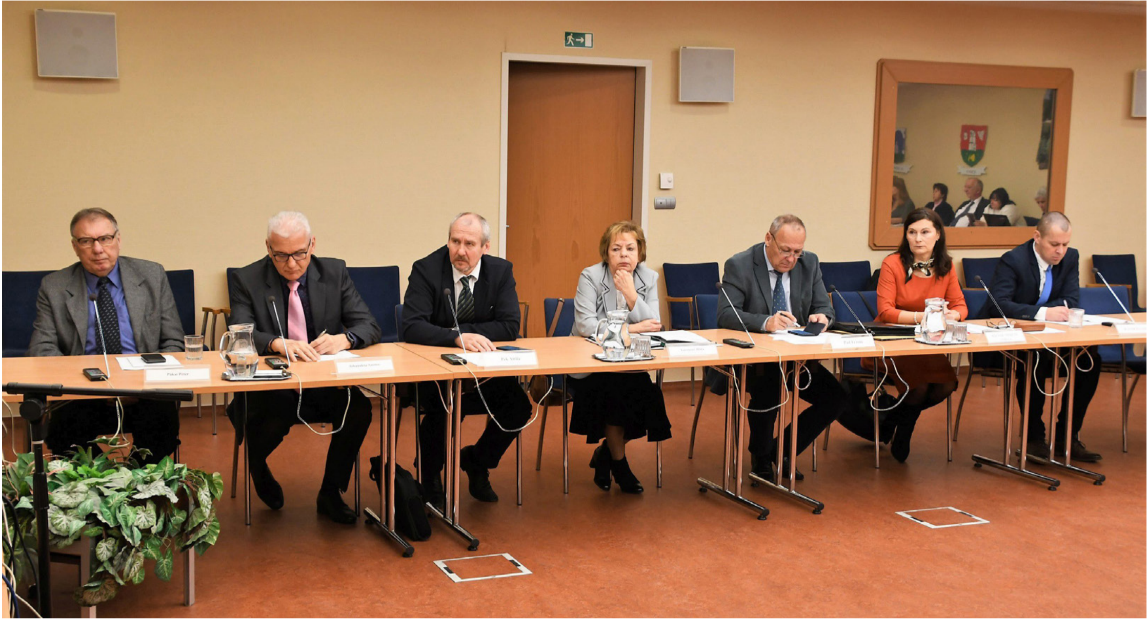
Ezúttal teljes volt a létszám (a Közösen Ajkáért Egyesület képviselői)