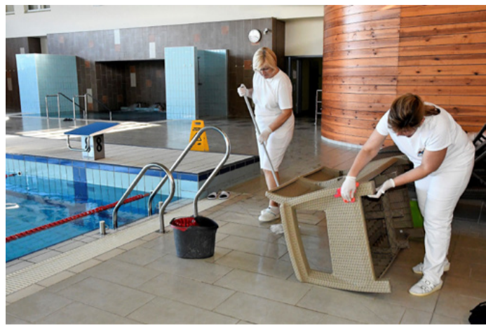
Hol az a vírus?