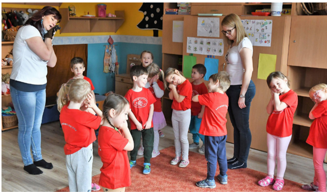
Jó játék a nyelvtanulás is