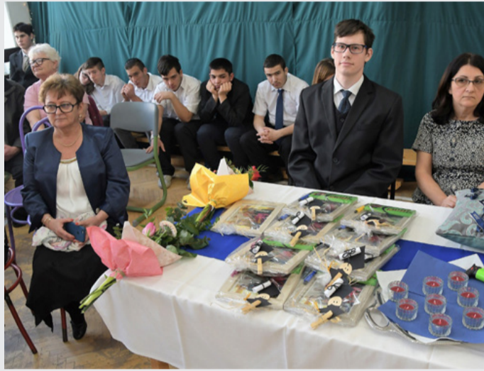
Az előkészített „relikviák”