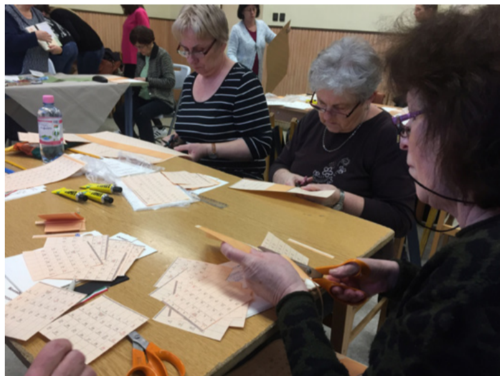
Készül az emlékek tárháza