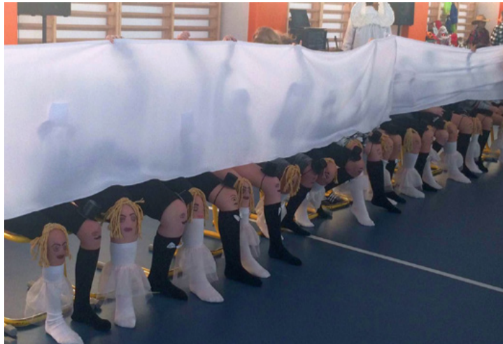
Láb balett – nem volt egyszerű összehangolni a mozgást

Bizony hiába kereste a látogató a maszkba, álruhába öltözött felvonuló farsangolókat. Az idők változnak, a korosztályok is, de a lényeg az megmaradt: a vidámság, az önfeléd szórakozás, a játéka volt a főszerep. A hagyományt is felelevenítették, amikor a kiszebábót előkészítették a gondülő cédulákkal. Sajnos az erősödő szél miatt az elégetés egy későbbi időben fogják megtenni, de mindenképpen a farsang időszakában, mert