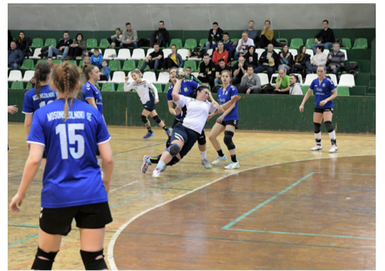
Egy pazar áttérés