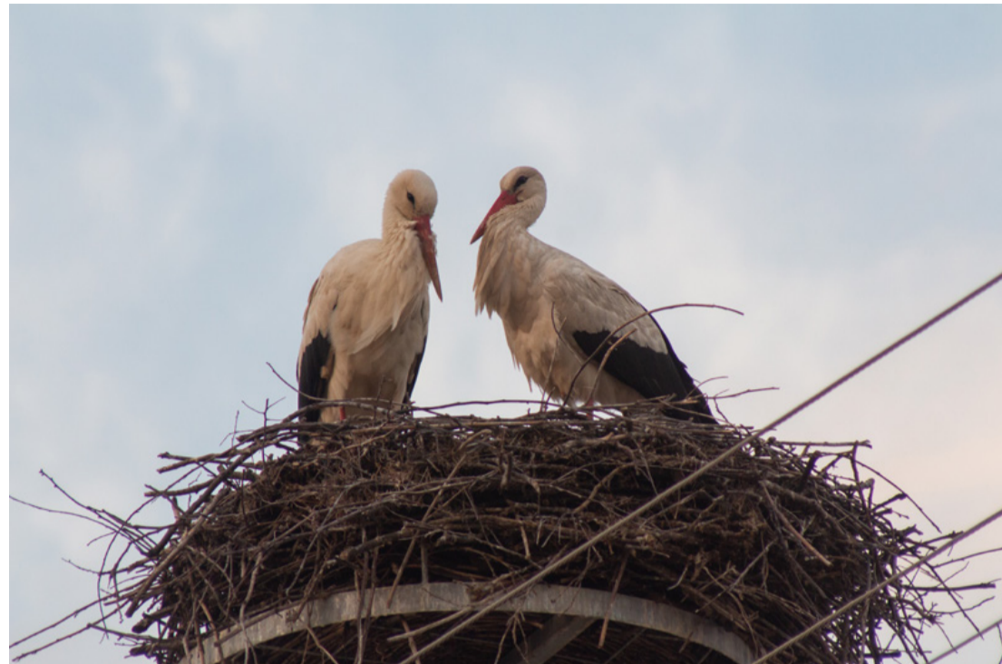
A rendeki gólyapár a rendbehozott fészükben

Tavalyelőtt az E-ON szakemberei távtartót raktak a villanyoszlopra, mert nem a kijelölt biztonságos helyre kezdték az építkezést hanem közvetlenül a magasfeszültség fölé. A fészük építgetése a költés ideje alatt sem szünetel. A 0,8-1 m átmérőjű fészük vastagabb, majd vékonyabb ágakból rakják, csészéjét gyepcsomóval, szénával, szalmával és különféle hulladékokkal bélelik. A fészükanyag gyűjtésében a hím az aktívabb. Az évenként tovább épülő fészük súlya a több száz kilogrammot is elérheti. Idén a hím gólyának nem volt sok ideje csinosítani a közös otthont, mert a tojó két nap eltéréssel követte őt.