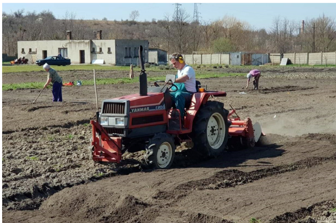
Tavaszi talajlezítés a bolgárkertben