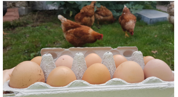
Ők „elkészültek”, már csak vevő kellene

- Ezzel mi is támogatnánk a koronavírus elleni harcot - mondta az ésszerű kezeltetést Sókuti Zsóka. - A jelenlegi helyzetben biztosan sokan vagyunk, akik szeretnénk elkerülni a nagy szupermarketeket, piacokat, és