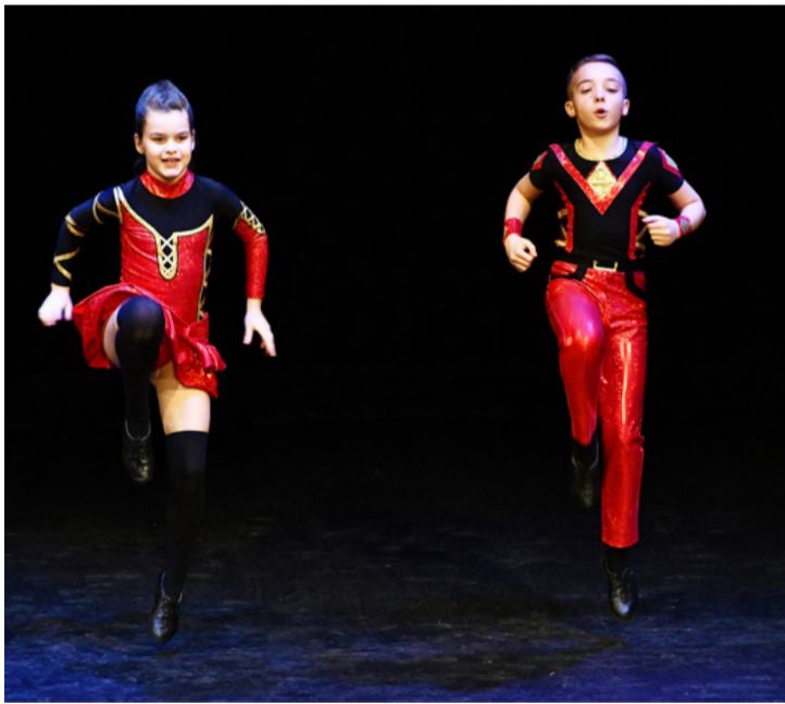
Mindig észbontó dolgokat művelnek