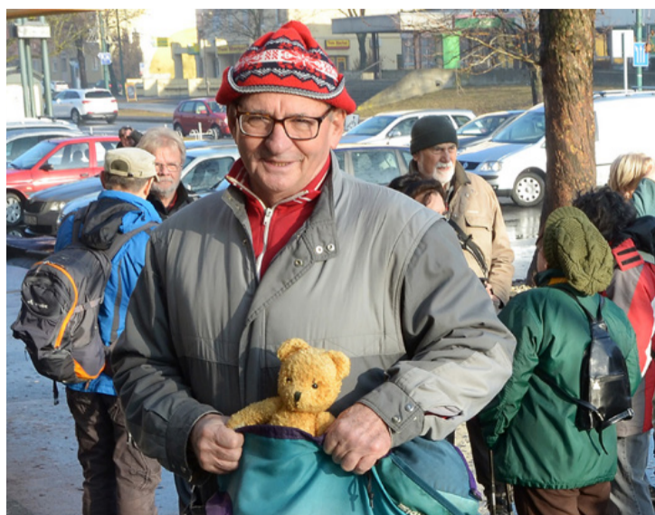
Hej, amikor még talpalhattak!