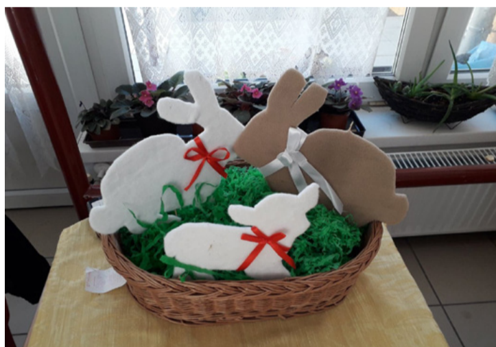
Húsvéti dekoráció a szociális gondozóban