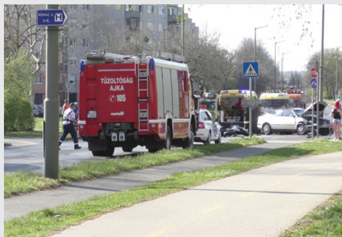
A helyszínelés pillanatai