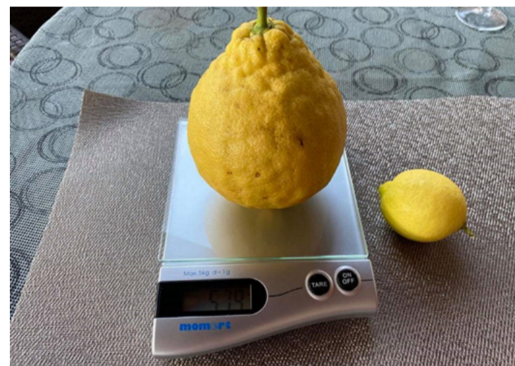
A hatalmas citrom, Micsurin is megirigyelhetné...