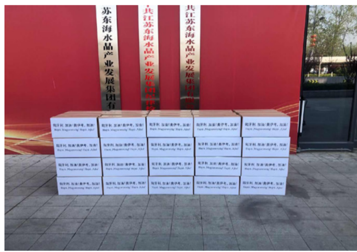
A maszkok már csak az engedélyekre várnak és indulnak Ajkára

Az eddigi időszak sem volt könnyű, de a nehezebb napok most következnek. Tudom, mindenkit megvisel az otthon maradás, de ne kockáztassunk! Csak bevásárlás, gyógyszerért, valamint testmozgás címén hagyjuk el a lakásunkat. Aki nem tud eleget tenni az előbbieknél, annak segítünk. Tapasztalataink szerint naponta 15-20-an vannak azok, akik ezt a szolgáltatást igénybe veszik. Többet is tudunk vállalni!