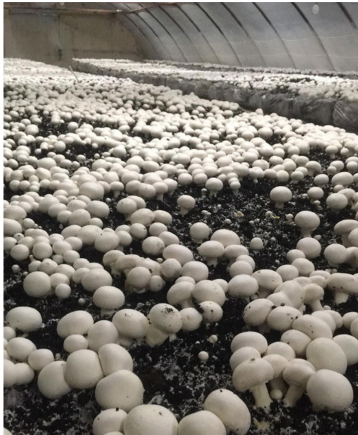
A gombaerdő vevőre vár...