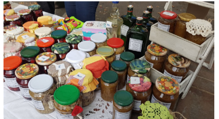
Csak egy telefon és minden a miénk lehet