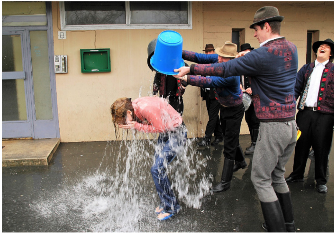
Amikor még „full kontaktban” tölték a legények