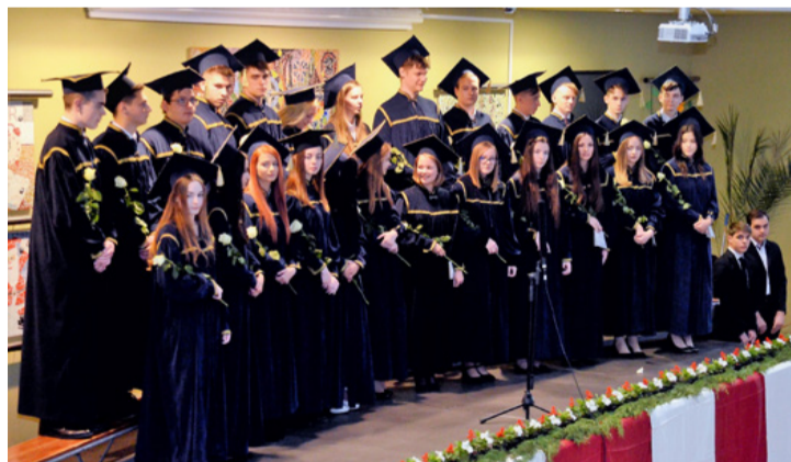
Na, ilyen nem lesz az idén...