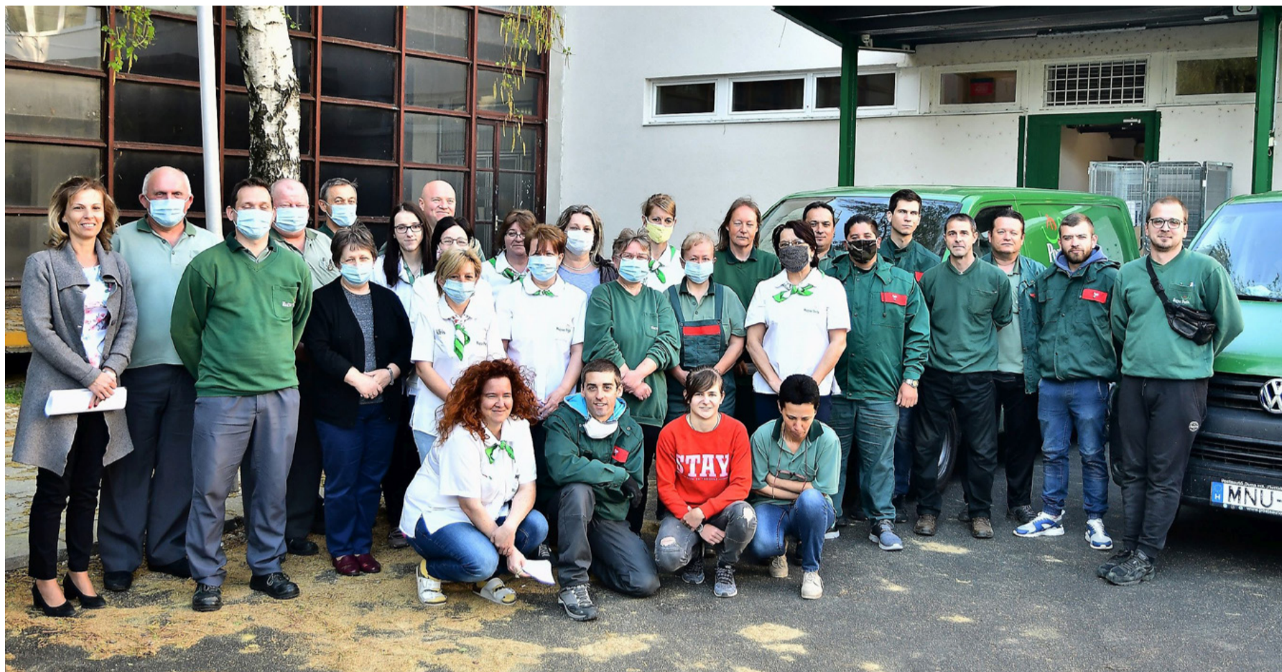
Ők is a „frontvonalban” vannak