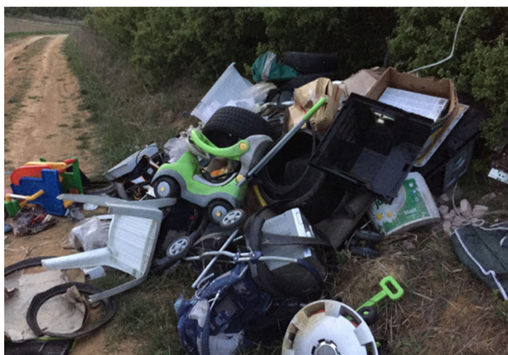
Nézni is rossz – egykori tulajdonosa is valószínűleg csak „kirándult” erre

Ajka és Ajkarendek között a bicikliút mentén egyre több és több ruhakupac „ékesíti” a zöldterületet. Az első adag megjelenésekor még csak azt gondolta az erre járó, hogy véletlenül hagyta el valaki a kabátját, pulóverét vagy nadrágját. Most már olyan nagy mértéket öltött az illegális ruhasomagok elhelyezése, hogy szinte néhány méterenként találhatunk zacskóba csomagolt cipőket és ruhákat. Úgy néz ki ez a szakasz, mintha valaki ingyen ruhaturkálót nyitott volna. Ezek az illegális hulladékok nem csak esztétikai, környezetvédelmi de egészségügyi okokból is gondot jelentenek. Nem beszélve arról, hogy a hulladékgazdálkodási törvény értelmében az elhagyott hulladékok esetében, ha a tulajdonos nem állapítható meg, az eltakarítása azt az ingatlanhasználót terheli, akinek az ingatlanán a hulladékot elhelyezték, vagy elhagyták. De nem csak ez a rendeki rész néz ki ilyen gyalázatosan. Ajka több peremkerületében is az utak mentén, bokros, erdős részekben gyakori látvány, hogy kidobott szemeteszsákokkal, törmelékekkel, megunt bútorokkal, használhatatlan műszaki cikkekkal találkozunk,