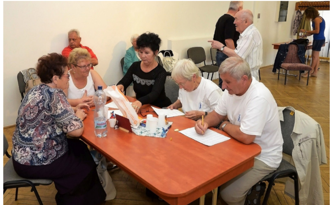
Vetélkedő nemzet a magyar

A másik felhívás a Nyugdíjasok „Életet az éveknek” Veszprém Megyei Egyesületének tagszervezetétől érkezett. Az idén 50 éves Fegyveres Erők Veszprém Körzeti