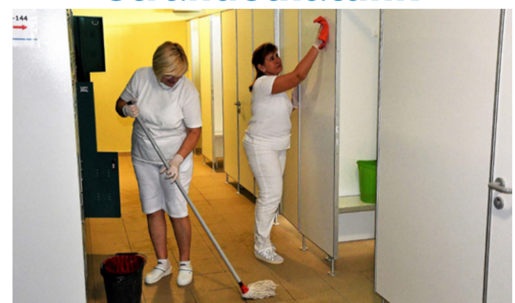
Az uszodában a zárva tartás alatt sem tétlenkednek