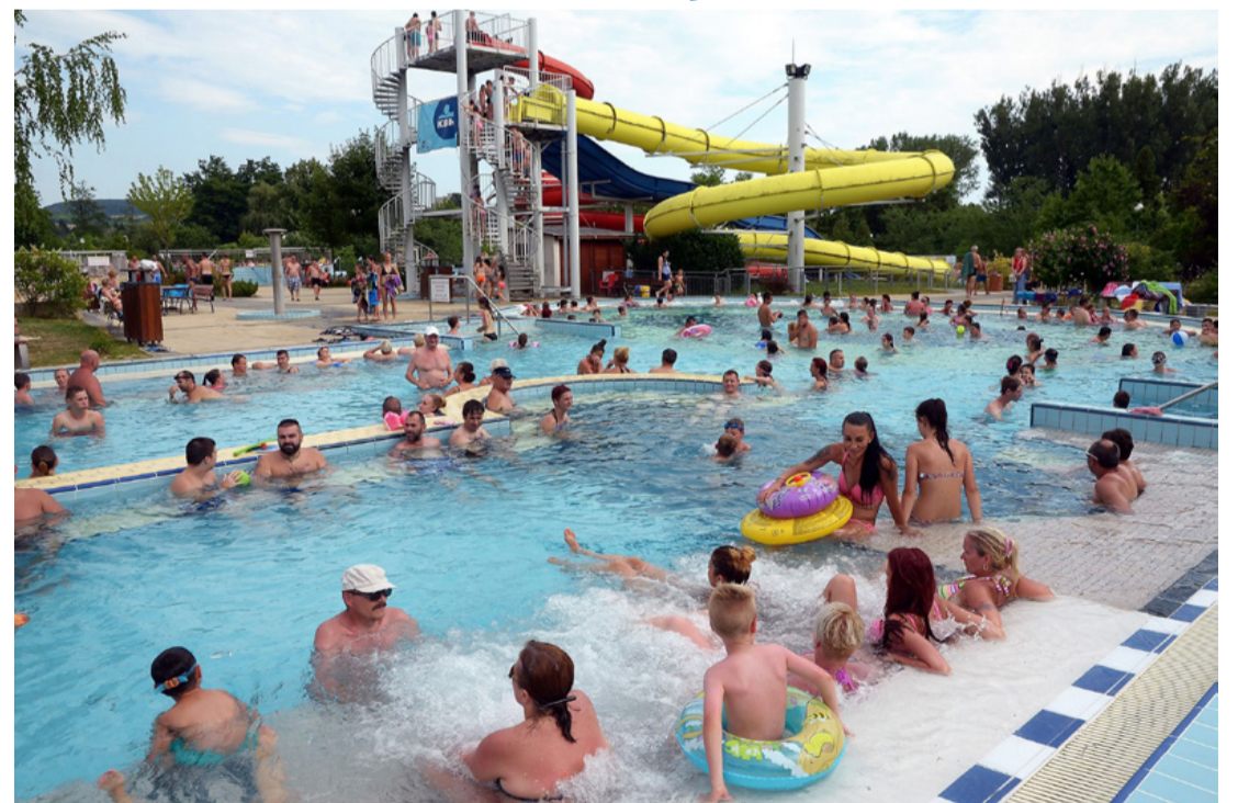
Rövidesen az ajkai strand is kinyit. Emlék kép

A legszigorúbbak a légi közlekedésben hozott intézkedések. Az érintés nélküli csomagfeladás és -fogadás rendszere miatt korlátozottak az elérhető járatok. Július elsejétől Görögország is megnyitja reptereit, Törökországban fertőtlenítő szállodai berendezésekkel készülnek a szezonra, Horvátország pedig egy mobiltelefonos alkalmazással segíti majd az odautazást, és a nyarálást. Többek között ezek