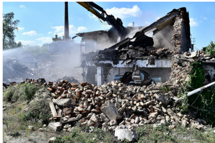
Bontják a kiszolgált épületeket. Török a múlt