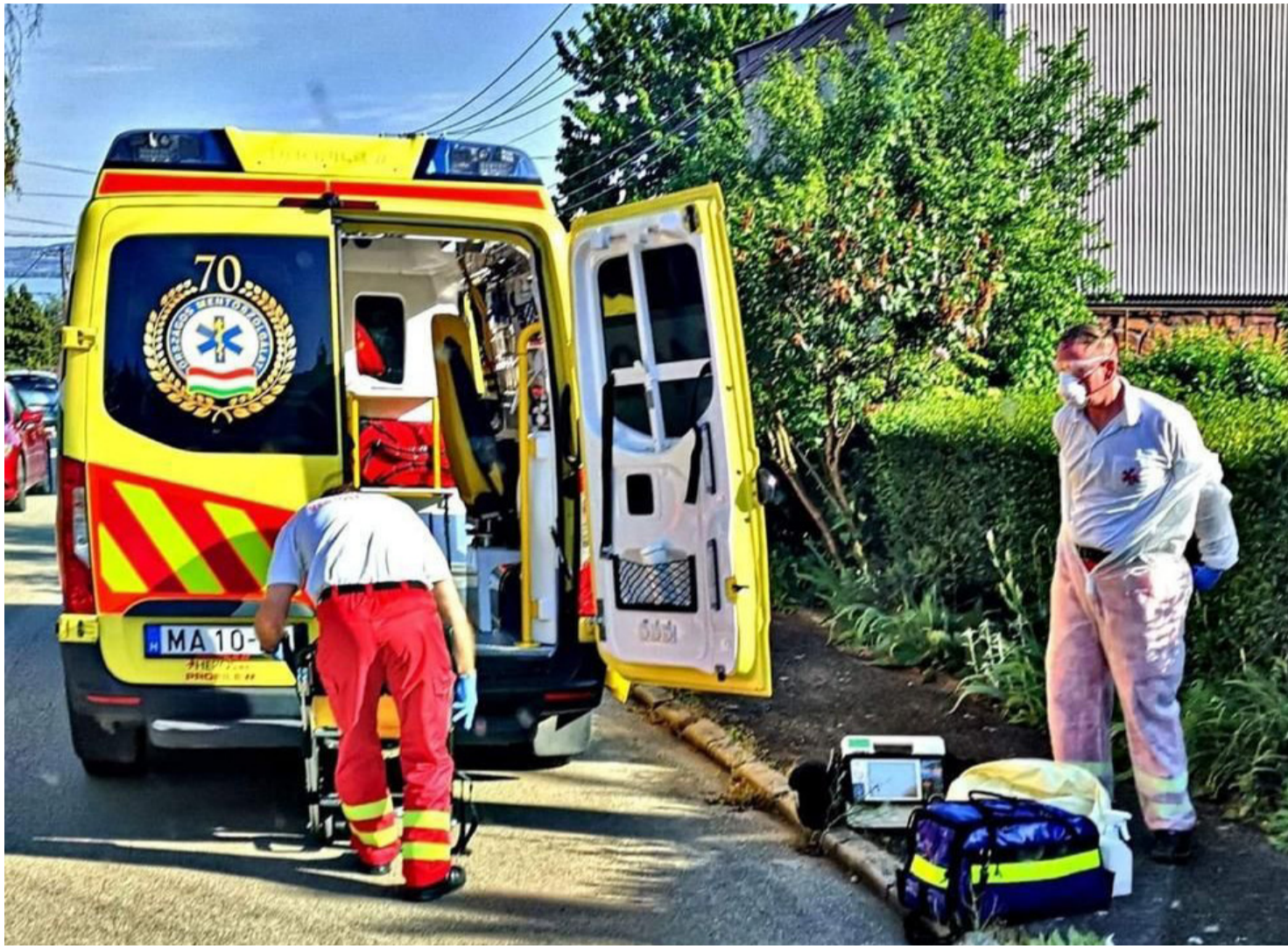
Akción után. Támad a COVID-19