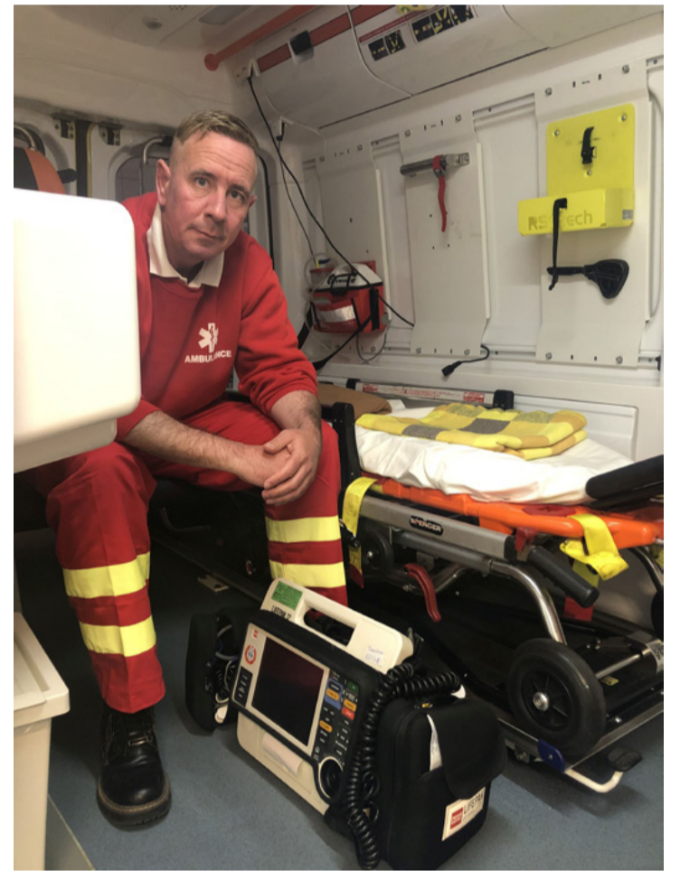
Mindig készségszolgálatban. A mentőápoló magányossága