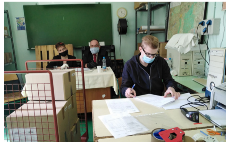
A logisztikus technikusok vizsgája az iskola tanműhelyében