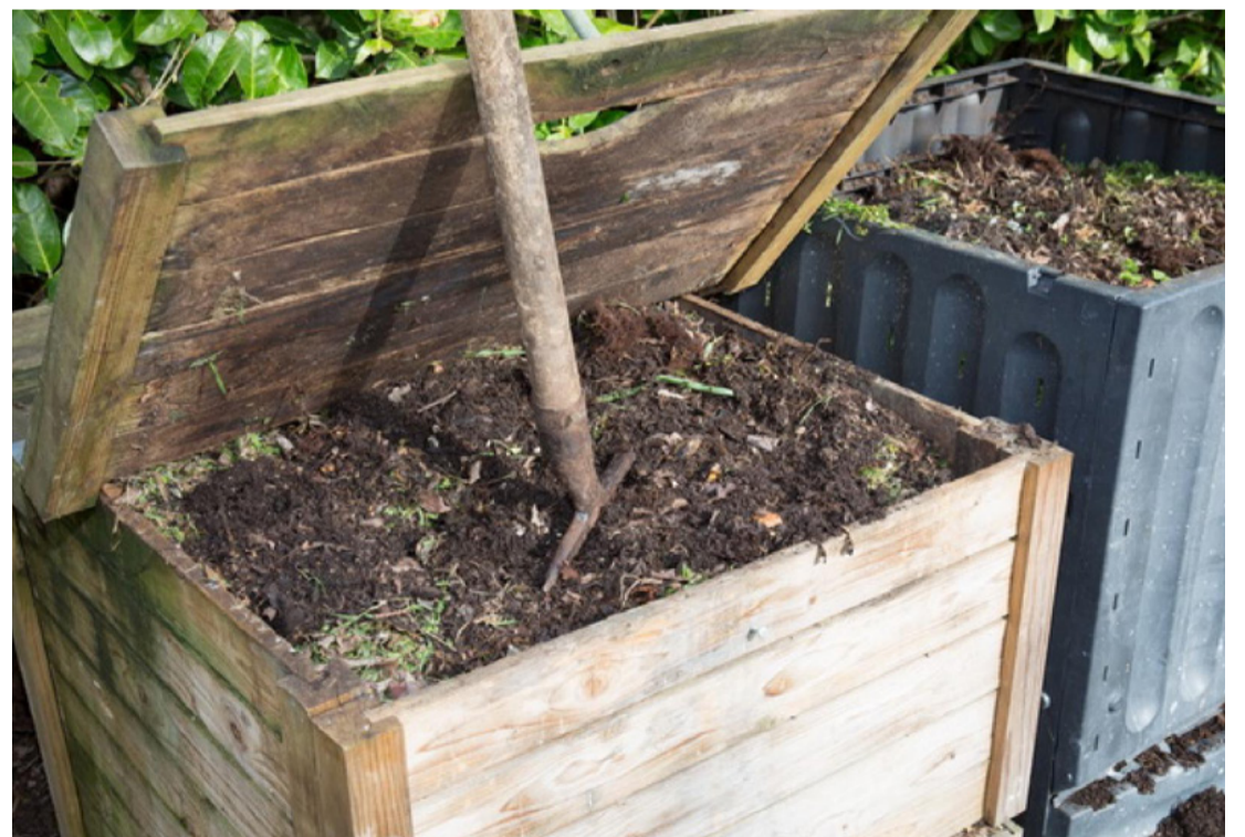
A láda készülhet fából, vagy műanyagból is

De miért is érdemesebb a kertekben összegyűlt szerves hulladékot az égetés helyett komposztálni? Egyfelől azért, mert mindenki igyekszik környezettudatosabban élni. Másfelől így a kerti és konyhai hulladékokat vissza tudjuk juttatni a természetbe, aminek hatására termékenyebb lehet a talaj. A komposzt visszajuttatásával tápanyagban gazdag humuszszal ajándékozunk meg a talajunkat, és egyben a benne fejlődő növényeket is.