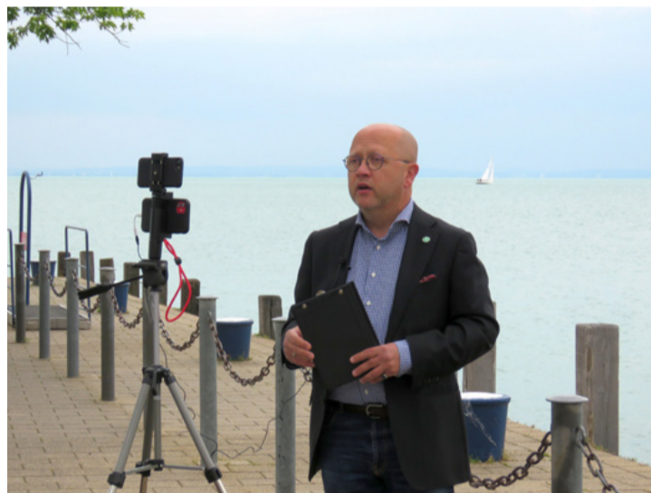
Kendernay online sajtótájékoztatója

Az LMP szerint (új) Balaton törvényre van szükség, hogy ne oligarchák számára