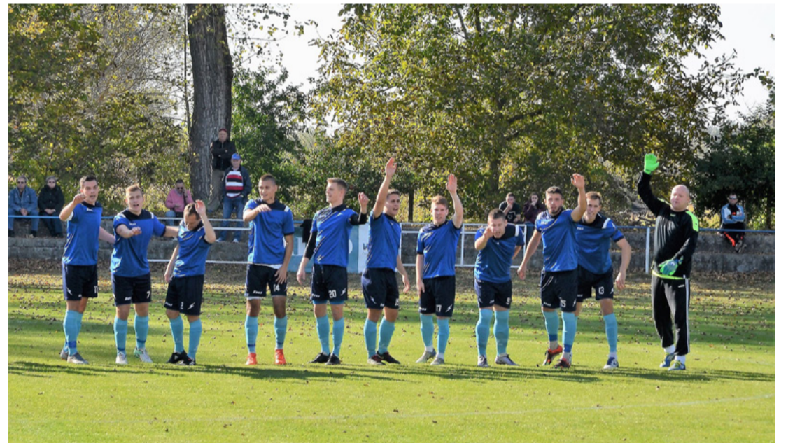
Az Ajka Kristály csapata egy tihanyi meccsen. Jó a visszhangjuk