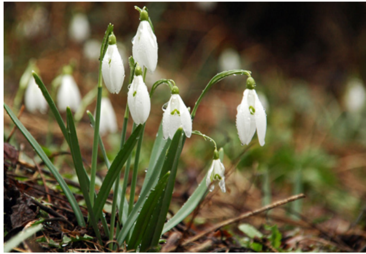
A hóvirágot már telefonos applikációval is védik. Szép és értékes növény

tartós csökkenésében. Ellenben a világ növény- és állatpopulációi napjainkra sosem látott fogyatkozásnak indultak, és nemcsak az élőhelyek szűkülése, változása miatt, hanem legfőképpen az ember környeztkárosító tevékenységének következtében. Átfogó kutatást 2015-ben kezdtek dokumentálni a Kaliforniai Egyetem, a Berkeley, a San Diego-i Egyetem és a Yale kutatói, akik az utóbbi 70 évben a megfigyelt 2500 állatfaj közül 727 tömeges pusztulásának elemzéséből vontak le következtetéseket. Ebből az derült ki, hogy az ilyen esetek egyre gyakoribbak a halak, a madarak és a tengeri gerinctelenek között. Az emberi tevékenységgel közvetlenül összefüggő hatások, például a környezetszennyezés, a tömeges pusztulások 19 százalékaért felelős. A klíma okozta folyamatok – a szélsőséges időjárás, a hő-stressz, az oxigén- és táplálékhiány – összesen 25 százalékát okozták