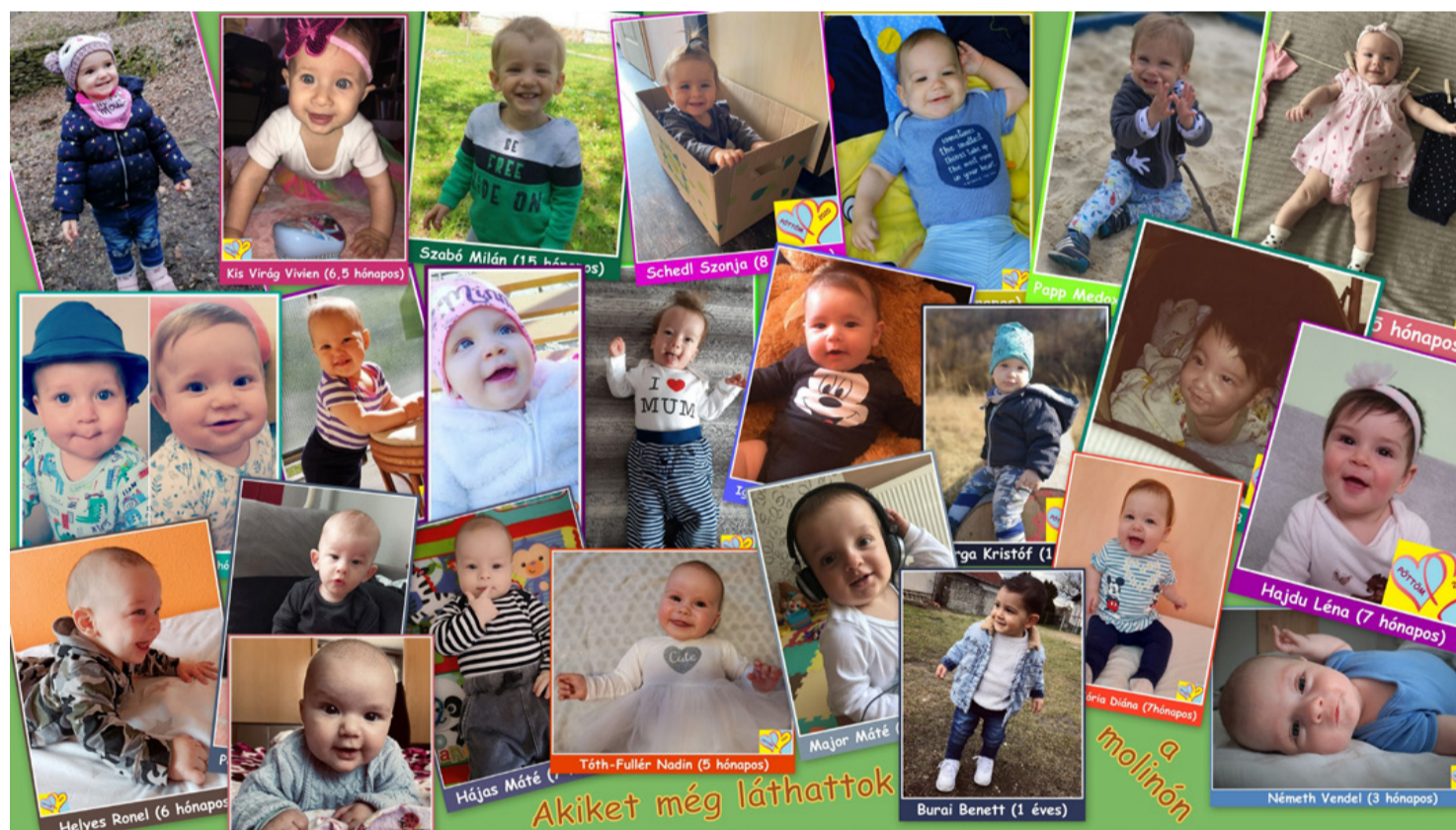
Hamarosan már az óriás molinóról mosolyog ránk a 40 Legbájosabb Pöttöm és teszi szebbé a napunkat. Portfóliók a babákról – éjszakai termés (Illusztráció: SzR.)