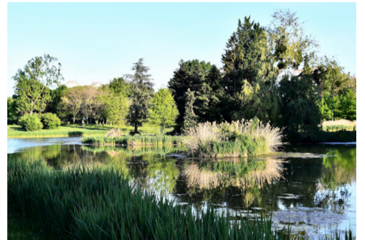
A természet csodálatos. A lét a tét