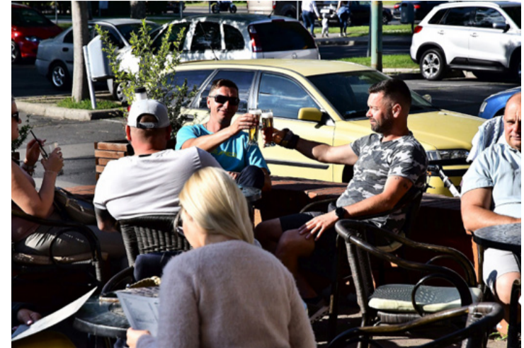
Jól esik egy sör a teraszon. Újra együtt

Megnyitottak végre a vendéglátóhelyek teraszai, és már az étteremben is elfogyaszthatjuk az ebédünket, nem csupán elvitelre szolgálják ki azt. A fagyizók terasza gyakran van tele beszélgető barátnőkkel (és barátokkal), fiatalokkal, akik örülnek, hogy újra találkozhatnak, nem csak a telefonon küldött üzenettel tudatják a másikkal, hogy gondolnak rá. A belvárosban a Café La Rosa, a Lángos bár és a Velvet is megnyitotta a teraszát. A járványveszély enyhülésével egyre többen hagyják el hosszabb-rövidebb időre az otthonukat, hogy élvezzék a napsz-