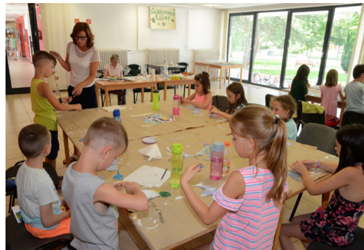
Kreatív tábor a vmk-ban. Szabadon alkothatnak

Ajka Város Önkormányzata és a Bányász Kulturális Egyesület nyári néptánc tábort szervez, amelyre 4-7 éves óvodásokat hív. A június 8-tól 12-ig, valamint június 15-től