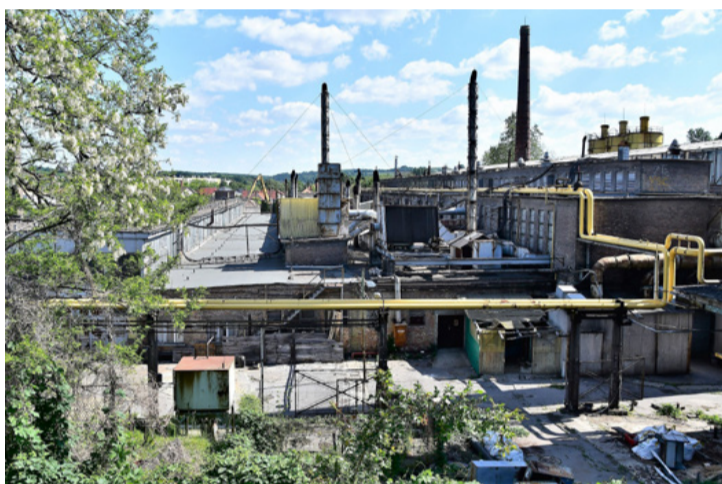
Az egykor szebb napokat megélt Üvegyár látképe ma. Nem eladó

Elkezdődött néhány üvegyári épület bontása, aminek okán újra fellángolt az érdeklődés az 1878-ban alapított gyár sorsát illetően. Természetesen elindultak az ilyenkor szokásos találgatások is, aminek bő tere akadt a közösségi médiában. Ettől függetlenül lapunkat is érdekelték a legújabb fejlemények, különösen az, hogy milyen hatással van a világvjárvány az amúgy is összehúzódóban lévő gyár helyzetére.