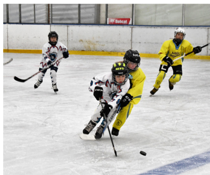
Visszajönnek a régi mozdulatok