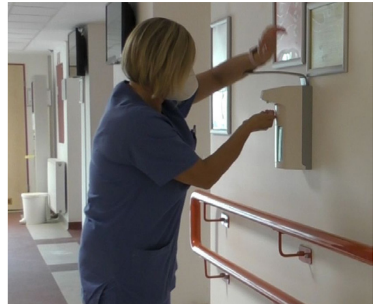
Kézfertőtlenítés a kórházi folyosón. Minden tiszta

A szakrendelőbe való bejutást a minisztérium szabályozta, aminek részleteiről részben a helyszínen, részben interneten lehet tájékozódni. A portán mindenkinek megméri a testhőmérsékletét, ez után egy külön bejáraton át juthat be a kórházba. Itt ismét hőmérséklet mérés következik és a páciensnek ki kell tölteni egy rövid kérdőívet is, hogy kizárják a korábbi fertőzés gyanúját. Ha itt fennakad a rostán, izolálják majd a