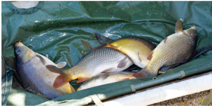
Lőrintei pontyok mérlegelés előtt. Sokat nyomnak a latban

után újabb ötleteket vehettek be a versenyzők a nagy fogás érdekében. Előkerülhettek a különböző ízesítésű pelleték és darák, hátha az új helyen erresz lesz kapás. A horgászok szinte mindannyian jól ismerik az itteni halak viselkedését, de mint mindig, a tudás mellett most is nagy szerepe volt a szerencsének. Az esti hat órai eredményhirdetésre csupa pirosra sült, vidám