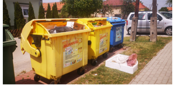
A jelek szerint egy elhúzódo fűrdőszoba felújítás követ-kezménye a szennyezés. A rendőrség kinyomozza?

kért. Sajnálatát fejezte ki, hogy ilyen elszomorító, érthetetlen esettel kellett szembesülniük.