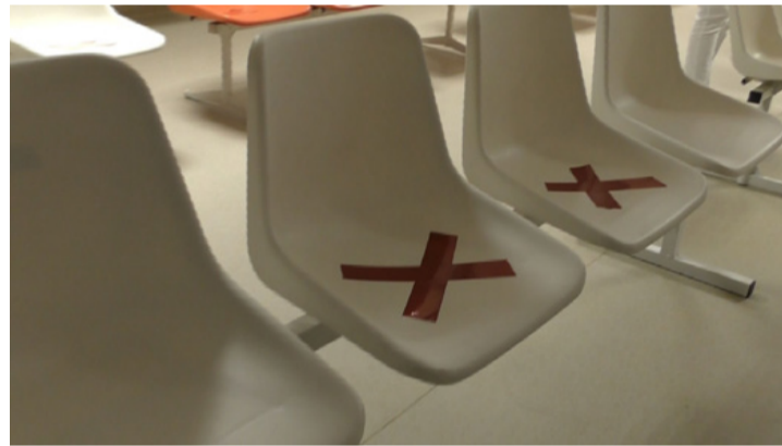
Ha jönnek majd a betegek. Lassan minden helyreáll

A kórházon belül Covid betegek kezelését végezték, nagyfo-