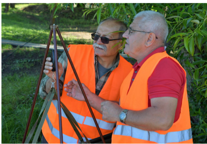
A horgászbarátság alapja a pontos leolvasás. Méri, ami mérhető

Ezen a napon a horgászok összesen több mint 531 kg halat raktak a szákokba, bár sokan nem voltak elégedettek a délutáni eredménnyükkel. A következő alkalommal a gyermek-és