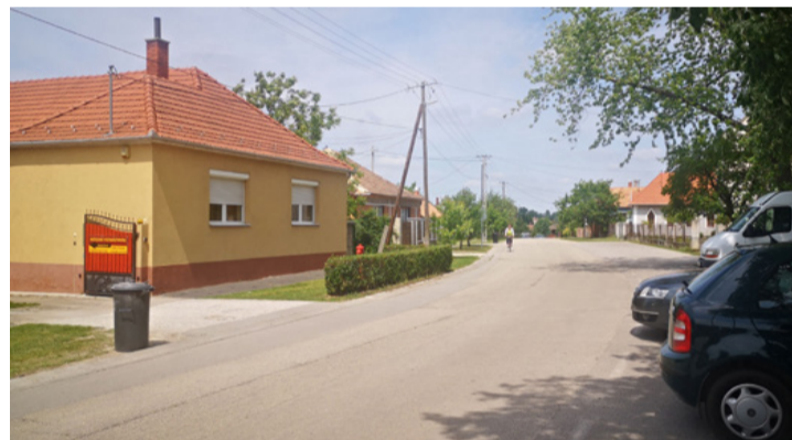
Tiszta, rendezett környék. Ebbe rondítottak bele

Egyben köszönetet mondott az Avar Ajka Nonprofit Kft dolgozóinak, a hulladékbe-gyűjtés területén végzett ma-gas színvonalú tevékenységü-