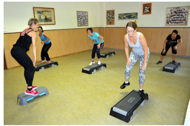
A hölgyek közösen vigyáznak az alakjukra