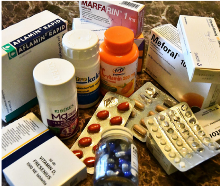
Idős korban egyre több gyógyszerre van szükség. A napi betevő

A gyógyszerek beszerzése nem, inkább az egyes betegségekkel járó életmódváltás okoz gondot, és anyagi nehézséget az általunk megkérdezett nyugdíjasoknak. Arra kértük a válaszukat, hogy mennyi gyógyszert szednek, mennyibe kerül a beszerzésük, és havi rendszeres jövedelmüknek hány százalékát hagyják a gyógyszertárban. A kérdéseinkre mindannyian válaszoltak, azt kérték, a teljes nevüket ne írjuk le, ugyanis még ismerőseik és a nyugdíjas klub tagsága sem tud minden betegségükről, és nem szeretnék, ha sajnálnák őket, valamint azt is szeretnék elkerülni, hogy a csodaszereknek mondott méregdrága bogyókat árusító ügynökök baleknak nézzék őket. Ők ugyanis ilyenre nem vevők. Az orvosuk által felírt gyógyszereket és javasolt vitaminokat szedik, és mindent a gyógyszerterápiából szereznek be.