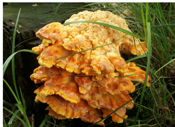
Korhadtt farönkön is terem ínycsemeté. Fiatalon izletes