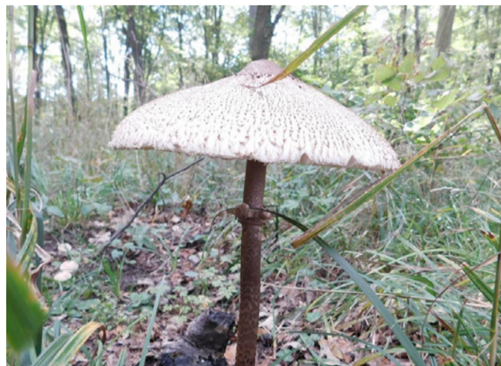
Közeleg a nagy őzlábgomba szezonja. Csak az gombázzon, aki nem „gombázza el”

A biztos található nagyon kell ismerni a lelőhelyeket. Ez a közepes termetű, szürkésbarna, selymesen fénylő kalapú, rózsaszín lemezű gomba na-