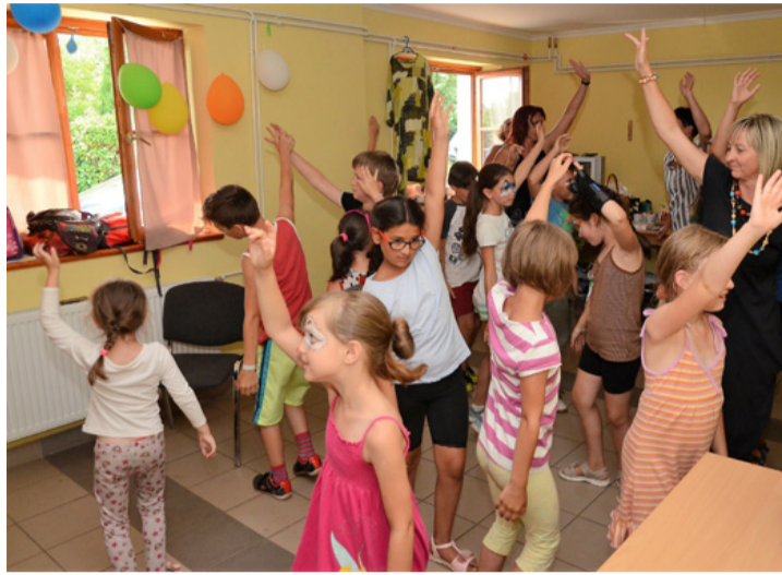
Mindenki számít. Senkit nem hagynak hátra

Kiemelte, hogy a „serdülőkort a második születésnek is nevezhetjük. Fokozatosan leválják a gyermek ilyenkor a szülőkről, felerősödik a társas kapcsolatok szerepe. Úgy mond az lesz az első szociális színtér az életében. Nagyon fontos, hogy a serdülő kiket választ barátjának, barátainak, mi a szerepe ezekben a kapcsolatokban. Ennek kialakítása, tudatosítása a cél a táborban. Egy olyan közösséget szeretnék a fiatalokkal megalkotni, ahol a bizalom létrejön, bátran felvállalhatják saját magukat, érzéseiket, és egy olyan „útravaló pogácsa a tarisznyába”, amely segít a kortársaikkal való viszony elmélyítésében, konfliktuskezelésében”.