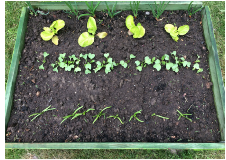
Mint egy „légifelvétel”

Úgy tűnik, hogy beválik ez a módszer nemcsak a lótetűmentesítés miatt. Jövőre na-