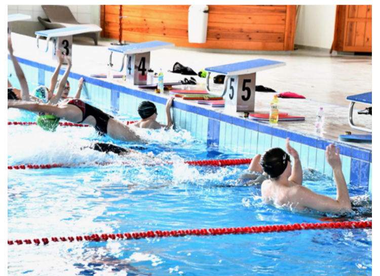
Az úszók már gyakorolnak. Kint vagyunk a vízből

Az uszodához hétfőn reggel, már néhány perccel a nyitást követően megérkeztek az első látogatók, egy úr és egy hölgy. Megváltották a belépőjegyet, majd sietve mentek átöltözni, hogy végre úszhassanak egy jót, csak-