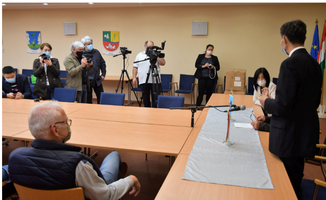
Az ajándékozást élénk sajtóérdeklődés övezte

A hatóanyag összeállítása a Pekingi Hagyományos Kínai Orvosi Hivatal által javasolt recept alapján történt. A gyártó a Beijing Sifang Herbal Pieces Co. Ltd.