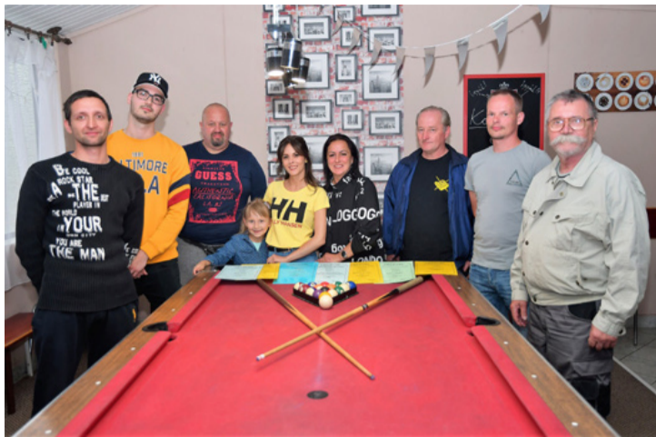
A legbátrabbak. Elsők lettek csapatban

A koronavírus-járvány miatt a legtöbb bajnokságot félbehagyták, így a sportkedvelők és a versenyzők is csónka szezon tanúi lehettek. Am az ajkai biliárdos közösség még éppen le tudta játszani az utolsó fordulót a korlátozások előtt, viszont az eredményhirdetés és a hozzákapcsolódó rapid verseny május végére csúszott, amit most a Bázisban tartottak szigorú egészségügyi szabályok mellett.