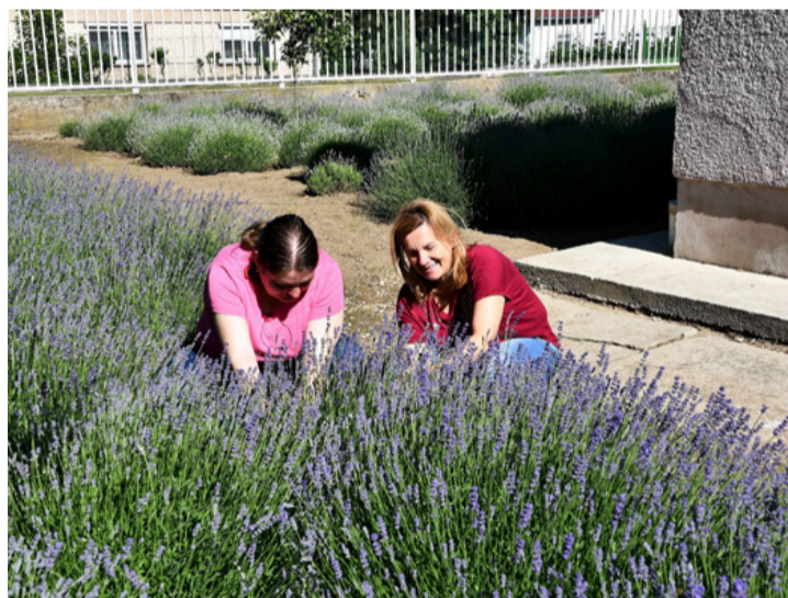
A levendula illat az idegekre is nyugtatóan hat. Számos kedvező hatása van

■ Amíg az anyukák a levendulát szedik a Molnár Gábor Műhely Alapítvány udvarán, a gyerekek a szövődében ismerkedhetnek a szőnyegkészítéssel. Csütörtöktől kezdődött a levendulaszüret az alapítvány padragkúti telephelyén. A lehetőséggel sokan élnek. Örülnek, hogy a városban is megszédhetik azt a mennyiséget, amennyiből illatszákot, vagy szörpöt készíthetnek, és még segíthetnek is másoknak. A bevételt a közhasznú nonprofit szervezete a foglalkoztatásba forgatja vissza, hogy jobb körülményeket biztosíthasson a fogyatékkal élő foglalkoztatottaknak.