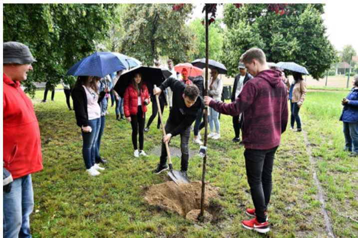
A kertben fa őrzi majd emléküket. Öt év múlva ugyanitt