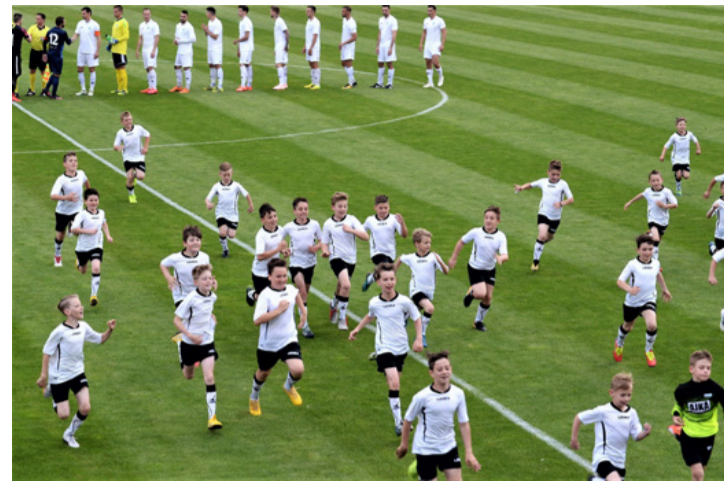
Az utánpótlás egy tavalyi meccs előtt. Melyiknél van marsallbot?

– Elégedett vagyok az itt töltött időszakkal, jó volt itt játszani főleg úgy, hogy a szurkolók az első perctől szerttek és támogattak. Az NB III megnyerésére vagyok a legbüszkébb és az is megtiszteltetés hogy viselhettem a másodosztályban a csapatkapitányi karszalagot. A szurkolóknak pedig szeretném megköszönni a sok támogatást, amit az itt eltöltött három idényben