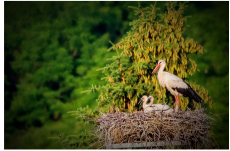
A rendeki gólyaszaporulat. Elöttem az udódom

A fekete gólyáknál szerencsésebbnek mondhatóak az ajkarendeki kis fehér gólyák. Idén az április közepén érkezett gólyapárnak két egészséges fiókája kelt ki a tojásokból, amiket remélhetőleg fel is tudnak majd nevelni. A gólyaszü-