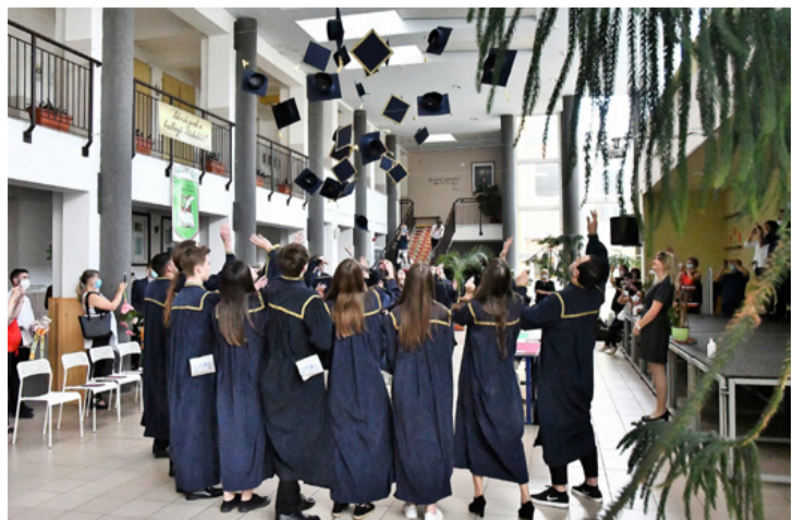
Az elmaradhatatlan pillanat. Feldobták