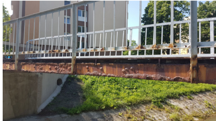
A híd még régi állapotában. Nem jut a Lánchíd sorsára

■ Csaknem 10 millió forintból újul meg a Béke utcát a Pataktarti Óvodánál összekötő gyalogos híd. A beruházást a tervek szerint napokon belül befejezi az önkormányzat megbízásából dolgozó kivitelező.