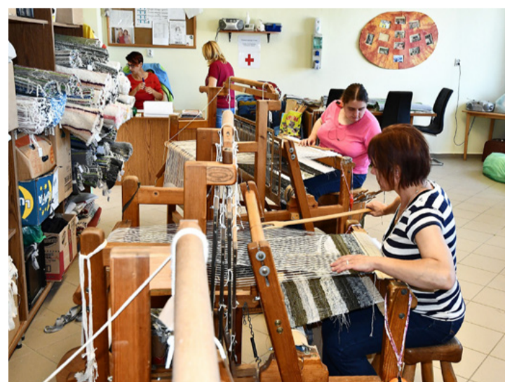
A virágszüret kapcsán a szőnyegszövés is ismerkedhetek az érdeklődők. Ez is hasznos