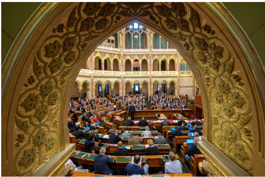
Most megmutathatják a „bátrak”, van-e lelkiismeretük. 133 esély a gyógyulásra

■ Rig Lajos országgyűlési képviselő, aki többször tanúbizonyságát adta már, hogy Ajkáért (is) dolgozik – legutóbb COVID-19-es mentőautón teljesített önkéntes szolgálatot – a költségvetés vitájából is szeretné a lehető legtöbbet kihozni. Ebbéli törekvésében együttműködésre kérte fel Fenyvesi Zoltán országgyűlési képviselőt, még az esetleges eredmény „dicsőségében” sem szeretne fürdőzni, azt önzetlenül, átengedi Fenyvesinek. A költségvetés végszavazása július elejére várható.