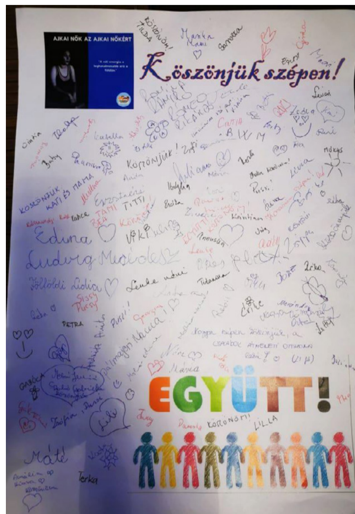
Hála, ami szavakkal nehezen kifejezhető

A NEMLUXUSTÁSKA akcióra ők így emlékszenek vissza: „Amikor nekiálltunk, beszélgettünk róla, hány táskánál mondjuk azt, hogy sikeres a kampány. Azt mondtuk, ha összejön 30, már egész jó. Hú, ha 50 összejön, az lenne az igazi. Ha 60, az már a csúcs! Aztán ti ajkai lányok, asszonyok, hoztátok sok-sok szeretettel a táskákat. Csak pakoltuk, számloltuk, megkönyyeztük. Közben jelentkeztek azok a hölgyek, akiknek ez nagy segítség. Sokan meséltek az életükről, még jobban megkönyyeztük. Álmunkban sem gondoltuk, mekkora a menstruációs szegénység még városunkban is. Ami sokunknak teljesen természetes, az bizony másoknak sok-sok megpróbáltatást jelent. Nem hittük, hogy itt közöttünk van még olyan, aki rongyokat használ és mos. Hogy lányoknak megszégyenülve haza kell menni az iskolából, mert nem tudtak betétet cserélni. Hogy vannak lányok, akik ezeken a napokon nem tudnak iskolába menni. Vagy csak a homokba dugtuk a fejünket, hogy ne tudjuk? Nem a mi egyesületünk feladata, tevékenységünk köre ezzel foglalkozni. De nem tudtunk és tudunk emellett elmenni csukott szemmel. Ve-