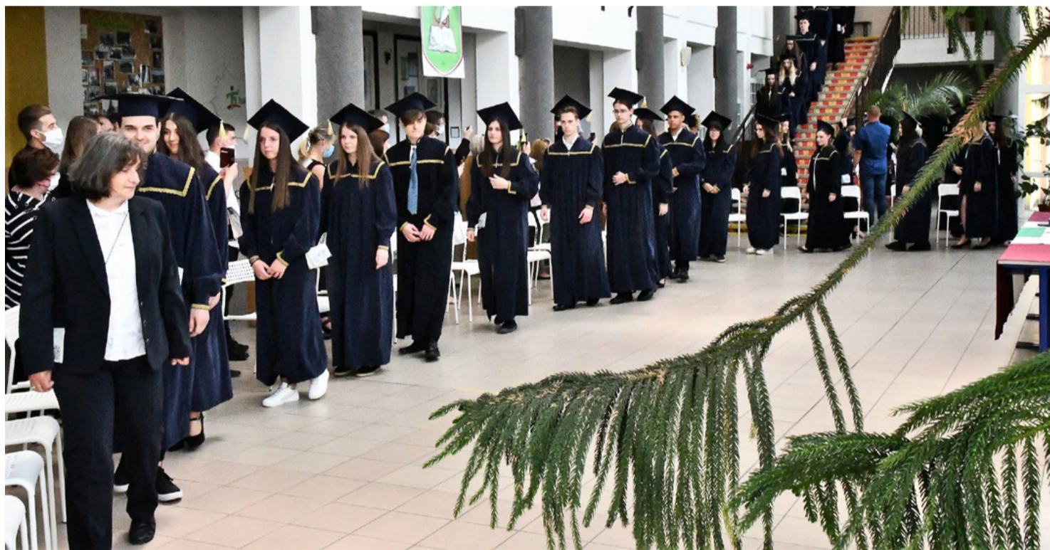
Taláros ballagás. „High school” hangulat