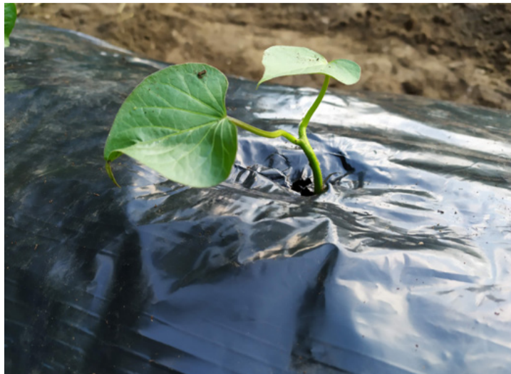
Kikandikál a fólia alól. Diétás zöldség

temény, lepény is készülhet belőle. A batátának két alapvető fajtája van. Az egyiknek világos szürke színű a húsa, a bőre pedig mélylila színű, íze a szelídgesztenyére hasonlít. A másik fajta húsa sötét narancssárga, az íze inkább a sütőtök