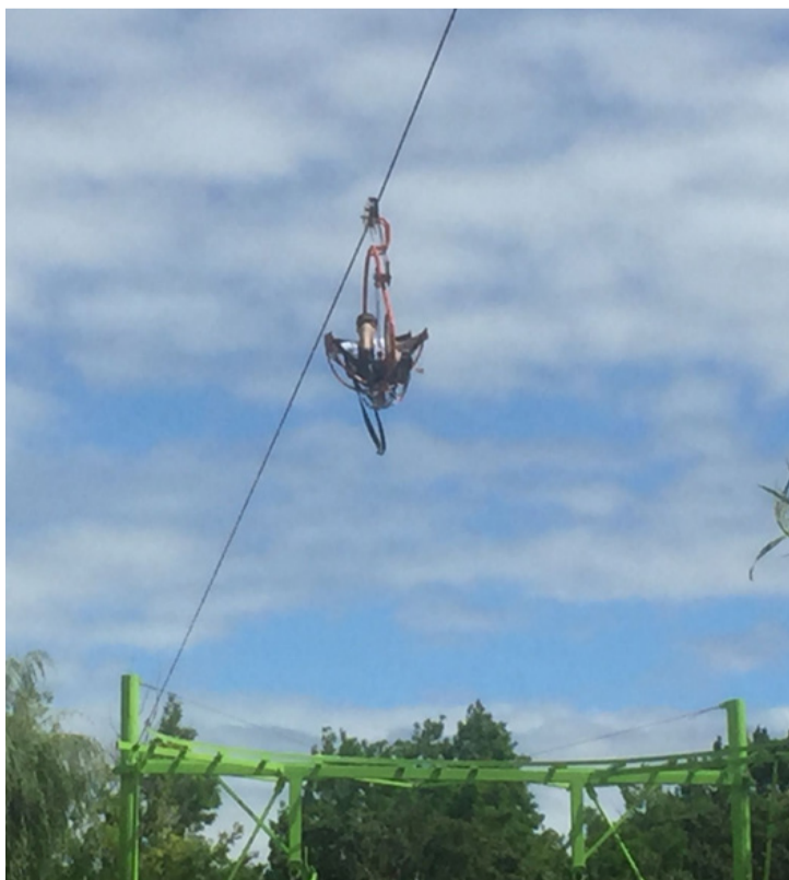
Biciklis a levegőben. Egyedülálló élmény