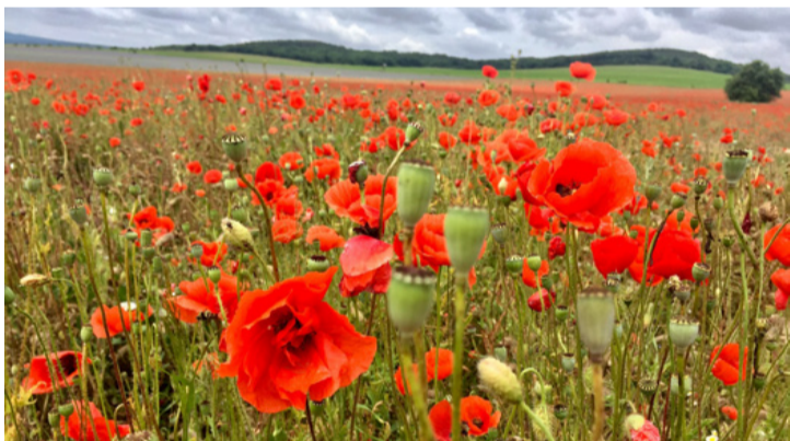
A pipacs csodaszép növény. Könnyelműségre csábít