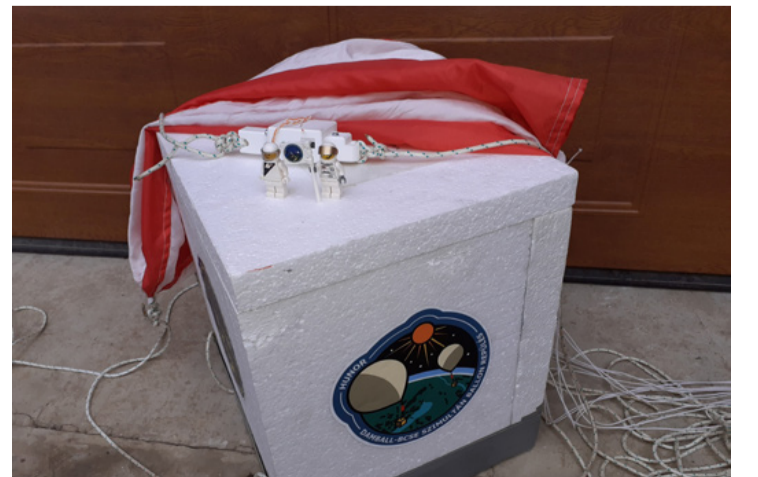
Az egyik újrámű tetején a két „bátor” Lego-utas. Mindig magasabbra