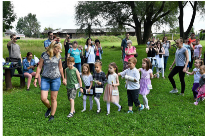
Márti néni vezetésével elindult a „végzős” csapat. Készült sok-sok video