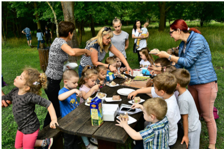
A hatalmas csokitortából bőven jutott mindenkinek. Édes élet

■ A Vizikék Óvoda Somvirág csoportjának „végzősei” az óvoda falain kívül búcsúztak társaiktól és óvónőiktől június 19-én. A vírushelyzet miatt nem tudták megszervezni a ballagást az intézményben, ezért a Nomádia Rendezvenypark bizonyult a megfelelő választásnak.