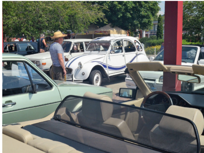
Régi idők autói. Mindig van vevő egy kis nosztalgiára

Hónapokig szerveztek, készülték, terveztek, majd az utolsó pillanatban úgy döntöttek, hogy mégsem rendezik meg a veterán járművek bemutatóját idén a Veterán Járművek Baráti Köre Ajka Egyesület tagjai. A 2018-ban alakult civil szervezet tagjai tavaly július első hétvégéjén mutatták be az érdeklődőknek először autóikat, motorjaikat. Őket is meglepte, hogy milyen sokan voltak kíváncsiak a régi, ma már ritkán látható járművekre. A nagy helyi érdeklődés mellett Ausztriából, Szlovákiából, Szlovéniából, Pécsről valamint a Dunántúl összes megyéjéből érkeztek kiállítók a találkozóra. Idén a járványveszély miatt a nagyobb érdeklődést vonzó eseményeket nem lehet megtartani. Az első bemutatkozásokon jóval meghaladta a látogatók száma az 500 főt, várhatóan most még többen lettek volna. Mivel a résztvevők számát nem tudták korlátozni, ezért úgy döntöttek, csak jövőre találkoznak a közönséggel.