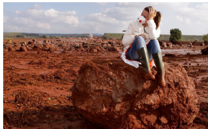
Katasztrófa, ami az országban folyik. Most a Lánchídra nem jut állami támogatás