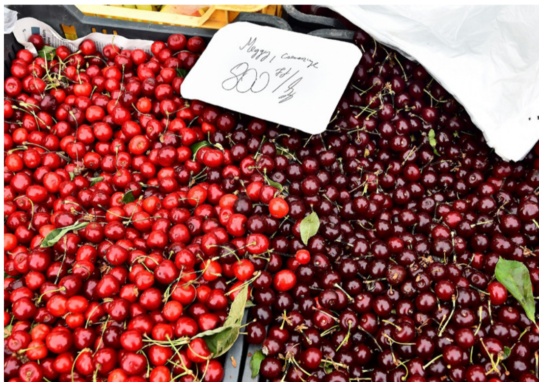
Vásárlók az ajkai piacon. A szép és olcsó kel el leghamarabb

Szombaton reggel kilátogatunk az ajkai piacra. Arra, hogy mennyien vannak a vásárlók, már abból következtethettünk, hogy a vasútállomás előtt tudunk csak leparkolni. A piactéren bőséges kínálatot találtunk