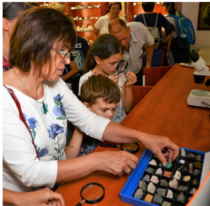
Jó program a bányászati múzeum felkeresése. Kincs, ami van

Kellemes sportos kikapcsolódásra, a természet közelségére, madárécsicsérgésre vá-