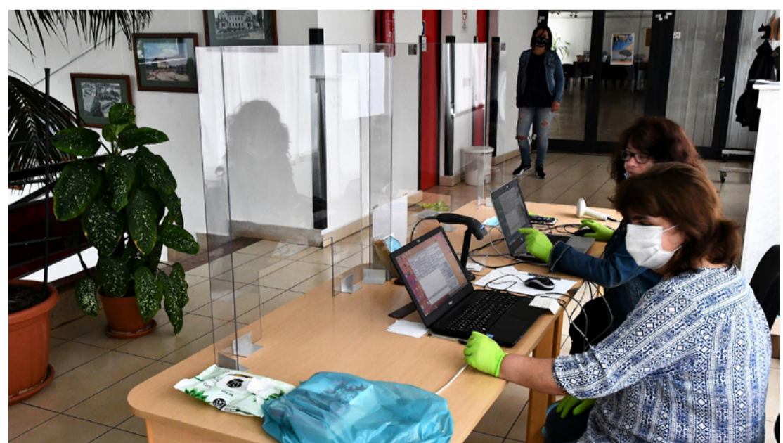
Átvételi pont a könyvtár folyosóján. Karantén vár a visszahozott könyvekre