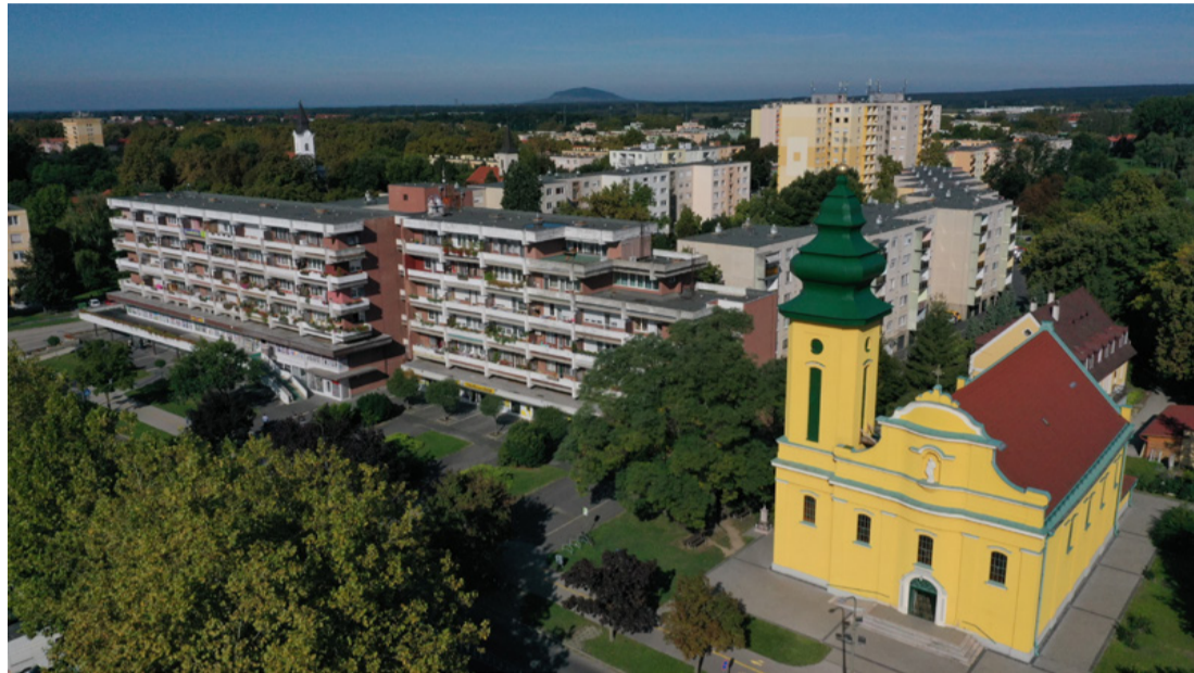
A belvárosi templom Ajkán. Isteni perspektíva