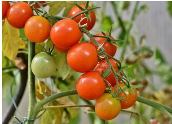
A szakszerű gondoskodás meghálálja magát. Munkánk gyümölcse

A paradicsom leggyakoribb betegségei a korai ragyásodás - ami a paradicsom leveleit, szárát és termését károsítja -, és a szürke levélfoltosság - ami kizárólag a paradicsomleveleket támadja meg. Veszélyt jelent még a Sclerotium rolfsii okozta penész, ami a szár és a talaj találkozásánál jelentkezik, és talán a legbosszantóbb és a paradicsom legveszedelmesebb betegsége a paradicsomvész . Ez egy rendkívül gyorsan terjedő gomba, ami nem csak a leveleket, de az egész növényt a termésrel együtt károsítja. Tünetei: a leveleken zsíros hatású szabálytalan foltok jelentkeznek. Olykor a foltokat fehérpenész veszi körül, a penész kimondottan akkor alakul ki, ha magas a csapadékmennyiség. Idővel a foltok kiszáradnak és elvékonyodnak. A szár elfeketedik ahogy a levelek is. A bogyótermés nagy kiterjedésű, elmosódott szélű, vörösbarna foltok alakulnak ki. A bogyó belseje szürkésbarna. Az érett bogyók könnyen rohadnak, azon másodlagos penészbokrok telepedhetnek meg. Sajnos ez a betegség pár hét alatt végez kedvenc zöldségünkkel. De van segítség!