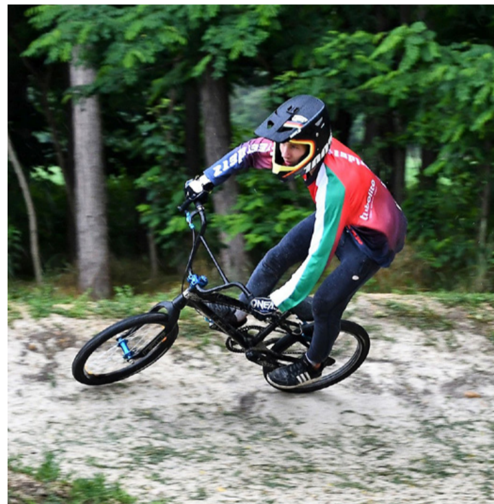
Tizedmásodpercekért folyik a küzdelem. Egész nyáron versenyben lesz