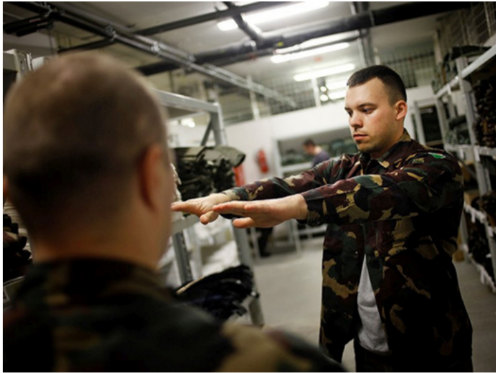
Akár tovább is szolgálhatnak. Hathónapos szerződés vár rájuk

■ Munkakeresők számára kínál új lehetőséget a Magyar Honvédség. Erről Soós Gyula, a Veszprémi Toborzó- és Érdekvédelmi Központ parancsnoka tájékoztatta az Ajka TV-t és lapunkat.