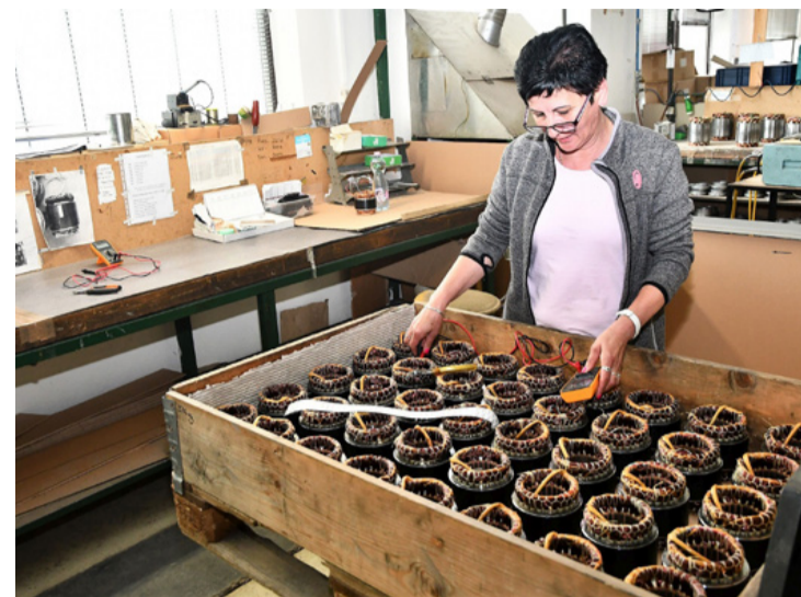
Minden alkatrészt szigorú ellenőrzésnek vetnek alá. Nem viselte meg őket a vírus

A Hajtó-Mű Ipari és Kereskedelmi Kft. azon kevés szerencsés vállalkozások között van, amelyek viszonylag simán vészték át a koronavírus járvány okozta gazdasági anomáliákat (szándékosan nem írtam visszaesést), ráadásul költözés közben kaptak derékba az egész világon végig söprő náthajárvány. Decembertől új üzemeztető is érkezett a céghez, elsősorban a devecserbe való költözés projektvezetése céljából.