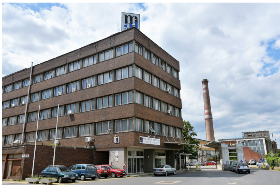
A MAL Zrt. f. a. főépülete. Ma MAL. Holnap?