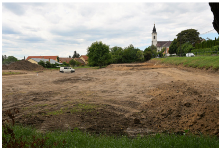
Valami elkezdődött. Miénk lesz a tér