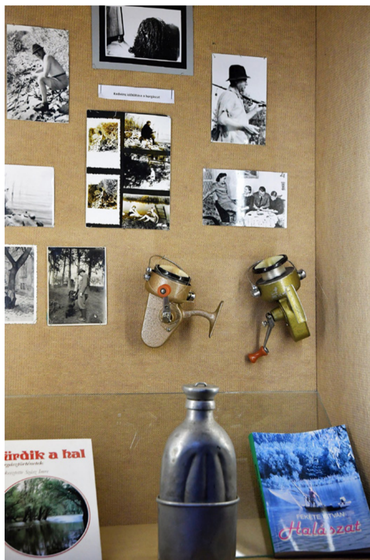
Néhány az író használati tárgyai közül. Ajkán lett az, ami

Az előkészületek során aztán minden könyve előkerült, és szinte „professzorok” lettünk műismeretből, miközben zsűritársaimmal a feladatokat állítottuk össze. Idén húsz éves lett volna ez a versengés is, amelyet sajnós most egy évvel el kellett halasztanunk. Így elmaradt ez az ünnep, amire az ország minden tájáról érkeztek volna a látássérült sorstársak, hogy összemérjék tudásukat a „Barangolások” című novellagyűjtemény kapcsán. Nem maradt hát más nekünk, az író emlékéit ápolóknak ezekben az időkben, mint egy látogatás a Városi Múzeumban, ahol Fekete István személyes tárgyai között bolyonghatunk, megcsodálhatjuk egészen egyedi kézírását, a pipáját, a pulóverét, az íróasztalát, a tollát, mellyel azokat a varázslatos regényeket, verseit, forgatókönyveit írta. A budapesti Tárogató utcai lakásából a legtöbb relikvia az ajkai múzeumba került, számtalan