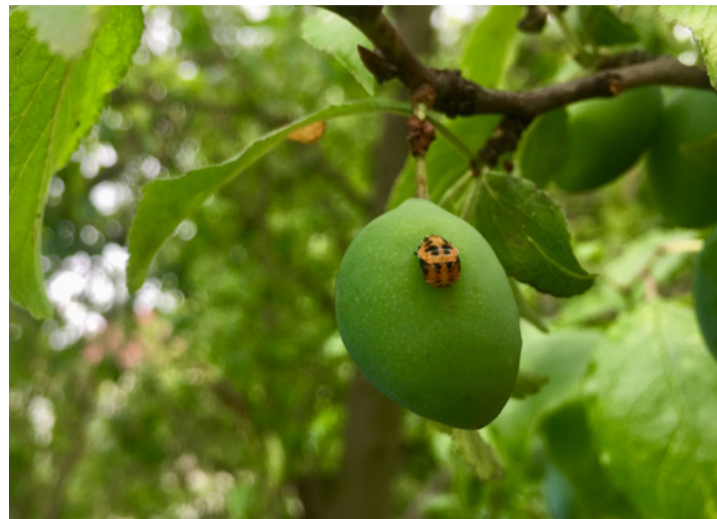
Ellensége a szilvának. Tönkreteszi a bort is

A katicabogarak szívesen látott vendégek a kertben, hiszen a legtöbb fajuk előszeretettel fogyasztja a levéltetveket, pajzstetveket, takácsatkákat, tripszeket, üvegházi molytetveket, ahogy a levédarázs- és lepkelárvákat is. Egy bogár akár 100 levéltetvet is elfogyaszt naponta, ami azt jelenti, hogy a katicabogár lárvája fejlődése során 3000 kártevőt képes elpusztítani. A katicák tehát hasznos, kártevőpusztítók. De nem mindegy melyik!