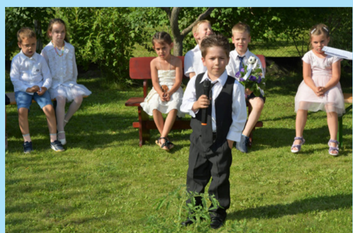
A kerti ünnepséget műsor is színesítette. Virágok közt, együtt