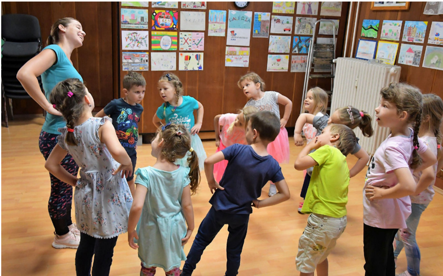
A néptánc közös élmény lehet. Felkeltették az érdeklődést