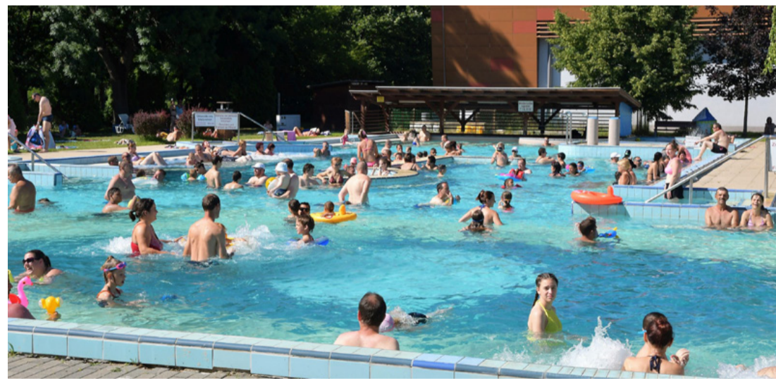
Máris tele a medence. Alig vártunk