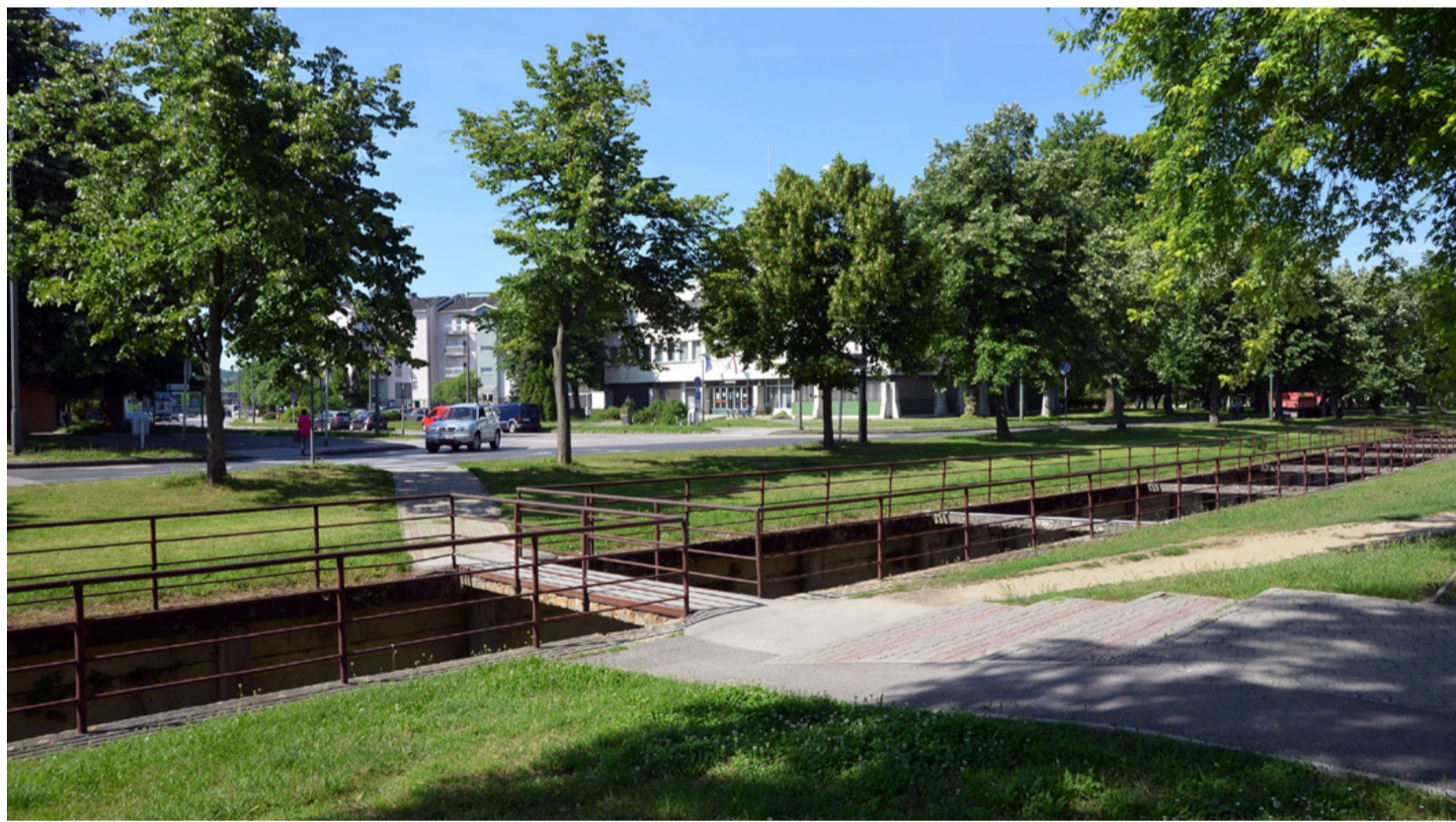
Kiemelt fejlesztési terület lett a Torna-patak és környezete. Minden megváltozik