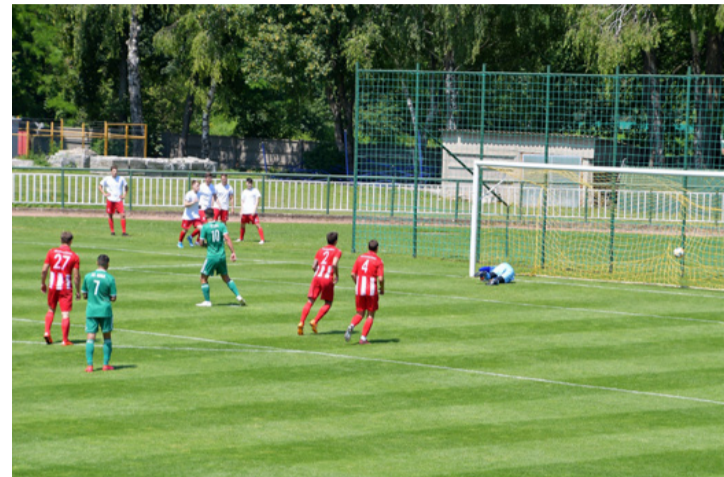
Az egyik gól a sokból. Hatot vágtak