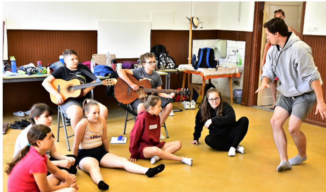
A drámatábor segít feszabadítani az igazi érzelmeket. Az élet nem játék

A nyári szünet nemcsak a felhőtlen kikapcsolódásnak, szórakozásnak kedvez, hanem olyan tevékenységeknek is, ahol a gyerekek játszva sajátíthatnak el olyan készségeket, jártasságokat, melyek nagyban megkönnyítik majd boldogulásukat az életben. A „Játszani is engedd” mottó kapcsán megvalósuló drámapedagógiai tevékenységre pedig különösen igaz, hogy gyakorlatokkal és játékokkal segíti a valóság átélését, az emlékek megőrzését, a figyelem fejlesztését, az alkotás szabadságával való megismerkedést, s ezen keresztül a csoport és az egyén fejlődését. Önmagunk felfedezésében sokat segíthet a drámatábor, ahol különböző szerepeket ölthetünk magunkra egy olyan biztonságos környezetben, ahol el tudunk vonatkoztatni a hétköznapi élet elvárásaitól, vagy átforgathatjuk azokat, és új szabályok mentén gondolhatjuk végig cselekedeteinket, érzelmi reakcióinkat. Miközben az „Életünk dolgai” című táborzáró előadásra készültek a gyerekek, számtalan