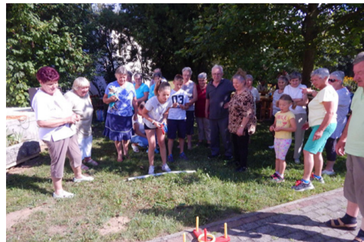
Együtt játszott idős és fiatal. Előttem az utódom