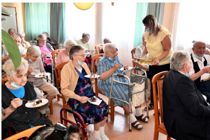
Jólesik a gondoskodás és szeretet. A hosszú élet titka