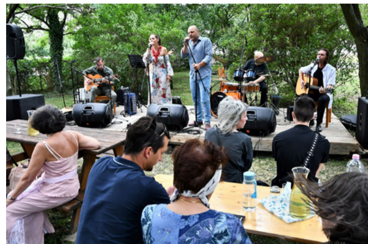
Korzár koncert a szülői ház kertjében. Átvinni az értékeket is a túlsó partra

Az ünnepség második felében a felvidékről érkező Korzár versenklő együttes lépett színpadra, Nagy László: Rege a tűzről és jácintról című ze-