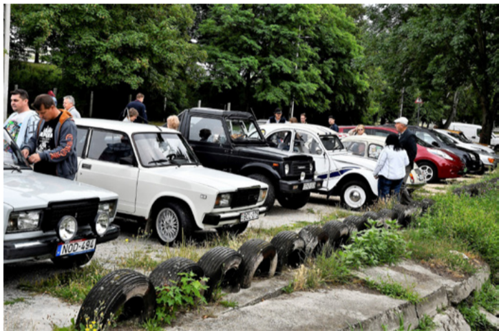
Veterán autók kiállítása. Öreg autó nem vén autó

perces néma főhajtással emlékeztek rá. Hazatérés után Ajkán a Városháza előtti parkolóban megálltak, hogy az arra járók láthassák őket, majd visszatértek a Civil Házba egy baráti beszélgetésre.