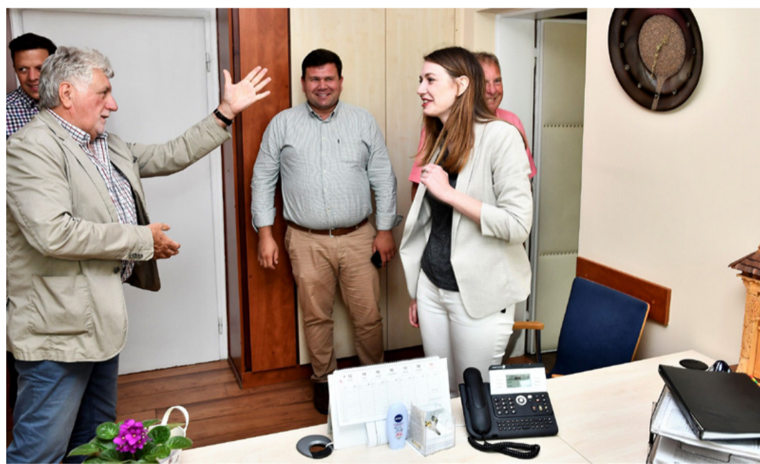
Érkezés az ajkai polgármesteri hivatalba. Helyben kell példát mutatni

Elmondta még, hogy a város az elmúlt években folyamatosan pályázott az Európa díj különböző fokozataira, amelynek harmadik fordulóján vannak túl. Pákai Péter, az önkormányzat gazdasági bizottságának az elnöke hozzátette, hogy amíg szocialista kormányzás volt, nem létezett kivételezés, Pápa ugyanannyit kapott, mint Ajka. Az MSZP amit hatalmon volt, mindenkinek megadta a fejlesztési lehetőséget politikai hovatartozástól függetlenül.