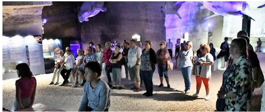
Kóruskirándulás a fertőrákosi kőfejtőben. A Kőszívűember fiai nyomában jártak

Az elmaradt Szegedi Szabadtéri előadás helyett az Agria Nyári Játékok keretében az Egri csillagok című