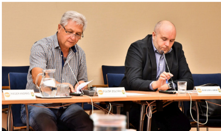
Megfontolt gombnyomogatás. Tartózkodtak a panelprogram támogatásától

A feladatokat részekre bontották. Ezek az iskolaépület tantermi részei, a konyha és a csatlakozó nyaktagok energetikai felújítása, valamint a tornatermi részben akadálymentes vizesblokk kialakítása. A másik nagy projekt-rész a tornaterem energetikai felújítását, a villámvédelem kiépítését, a tornaterem fűtésén napelemrendszer kivite-