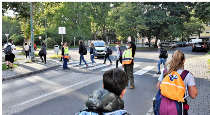
Elkél a biztosítás. Megálljt parancsolnak a baleseteknek