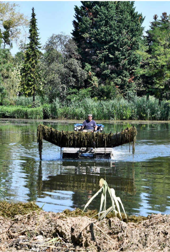
Munkában a hínárvágó. Takarítás, sok meglepetéssel

Augusztus 7-én megérkezett a hínárvágógép a Csónakázó-tóra, hogy megkezdje hosszú hetekig tartó munkáját az elszaporodott hínár ellen. Az utóbbi időszak napos időjárásának hatására a víz felületén úszó rengeteg növény erős szagot bocsátott ki a Városliget területére, mely zavarta az itt pihenni, ki kapcsolódni vágyókat, erős szél esetén pedig a város többi részén is érezhető volt az úgynevezett „mocsárszag”. A munkálatok alatt érdekes tárgyak is előkerültek a tó medréből.