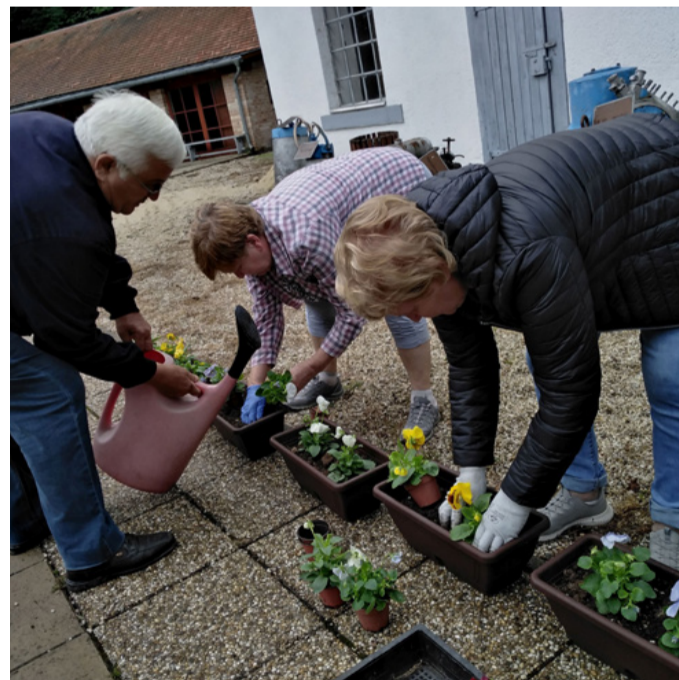
A Bányász Kulturális Egyesület tagjai ültetik a virágokat a bányásznapra. A szépség belülről fakad