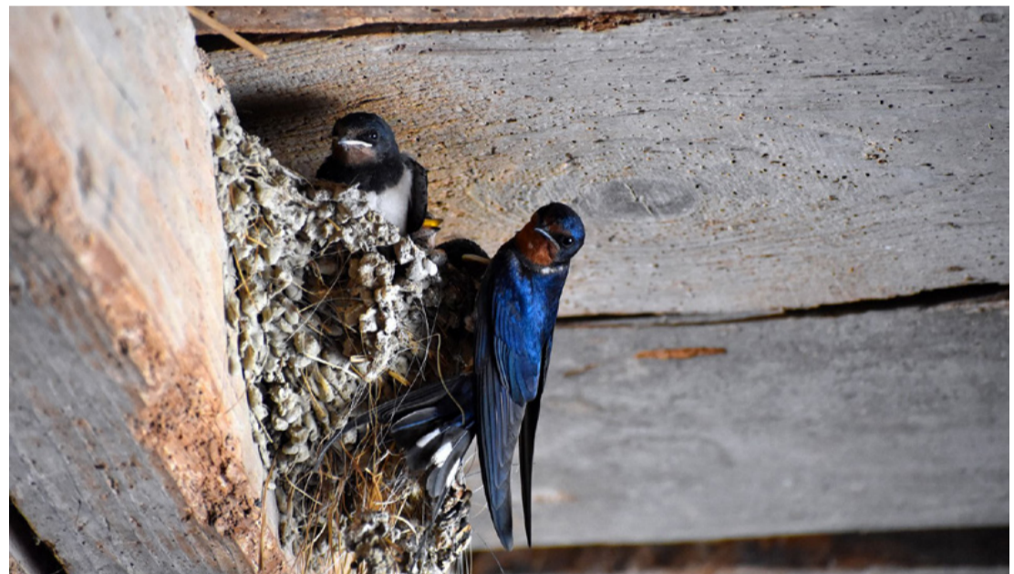
Fecskefészkek közelről. Tilos bántani őket