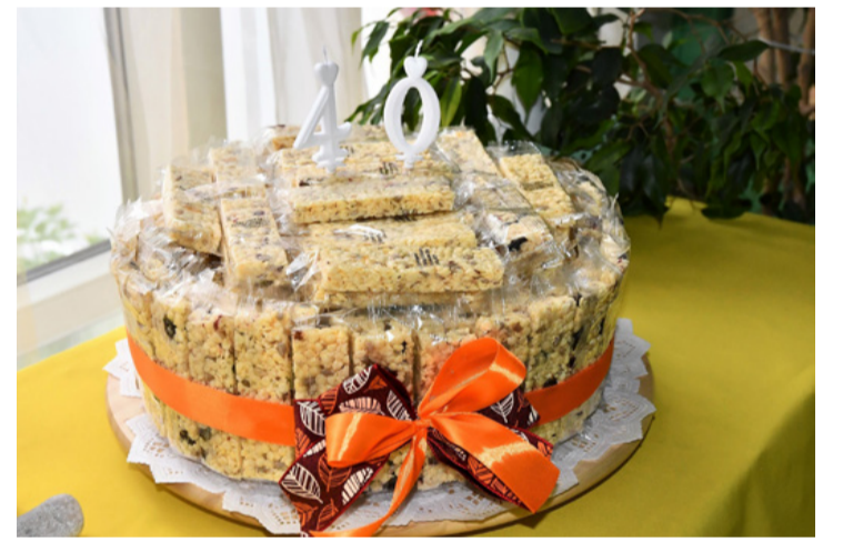
A szülinapi müzlitorta. Mindenkinek jutott egy szelet