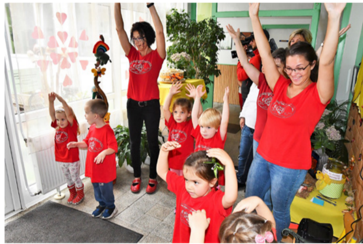
Boldog óvoda, boldog gyerekek. A negyven éves múlt kötelez

Negyven éve, 1980. szeptember elsején nyitotta meg kapuit a Pataktartó Óvoda. A mostani nevét az 1990-es években az épület mellett folyó Torna patakról kapta. Ma az Ajka Városi Óvoda tagintézményeként működik.