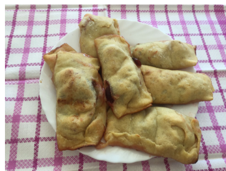
Nincs jobb, mint egy jó kis Tschweschpnfleckn. Még kiejteni is élvezet

Számos egyéb felhasználási módja is van e sokoldalú gyümölcsnek. Fogyaszthatjuk főzve, gyümölcslevesekben vagy bizonyos húsételekhez, például vadhúsokhoz. Mártásként vagy akár töltelékként is pikáns ízt ad az ételeknek. Készíthetünk belőle gyümölcssalátát is, de édes-ségeiben is megállja a helyét. Az aszalt szilva kitűnő rágsálni való (és magas antioxidáns tartalmú) csemege a téli hónapokban. Nem utolsósorban fontos energia-, vitamin-, ásványi anyag- és élelmirost-forrás. A szilvát nemcsak hagyományosan édes befőttként fogyaszthatjuk, hanem ecetes enlakra, savanyúságként is megállja a helyét. Erre legalkalmasabb a besztercei szilva. A magyar konyha kedvelt édessége a szilvas gombóc és a szilvalekvárral is tölthető derelye, vagyis a barátfüle. Magyarpolányban és Rendeken szilvaérés idején szinte kihagyhatatlan ételnek számít a szilvas flekni, vagy ahogyan ott mondják Tschweschpnfleckn. Ezt a