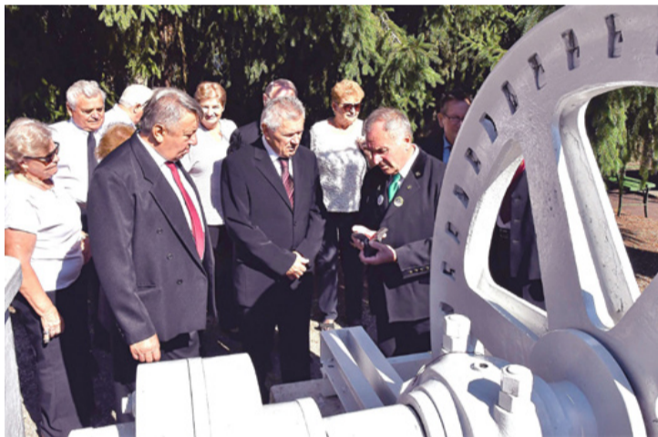
A Karlik tárcsás kötélzállító előtt. Visszaköszön a múlt

A Hild-parkban a Bányászok emlékmű megkoszorúzásával vette kezdetét a 70. bányásznapi program-sorozat, amely most a járványveszély miatt jóval szerényebb volt, mint amilyent az elmúlt 69 évben megszokhattak a résztvevők. Szeptember 5-én csupán az Ajka Városi Bányász Fúvószenekar zenés ébresztőjét valamint öt koszorúzási ünnepséget tartottak meg a korábbi évek gazdag programjai közül.