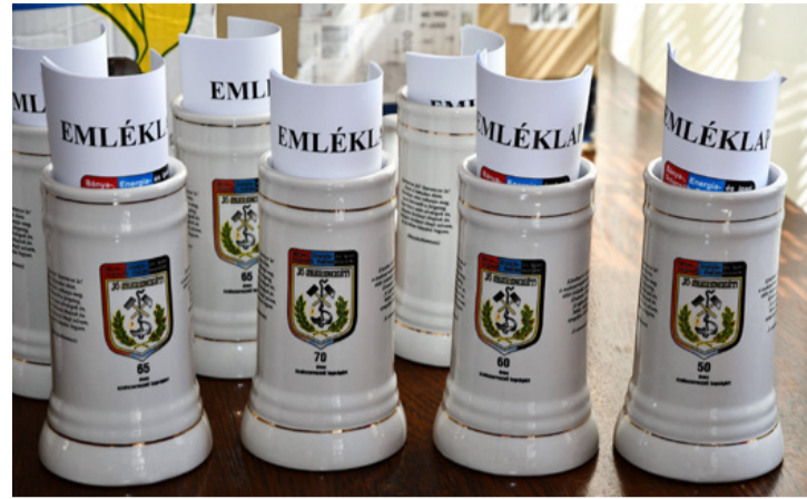
Ünnepség ugyan nem lesz, de az elismerést megkapják az érintettek