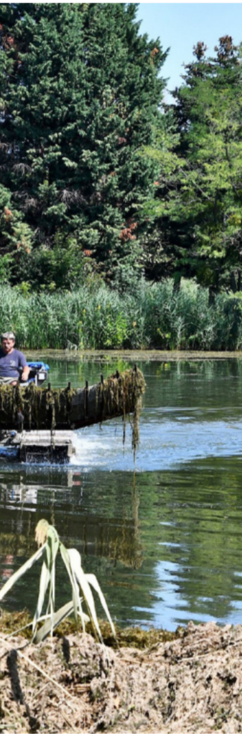
Munkában a hínárvágó. Takarítás, sok meglepetéssel

a lebegő részek hamar oxidálódtak és jellegzetes szagot bocsátottak ki a levegőbe. A tó mélysége a másfél méter és harminc centiméter között mozog. A sziget környékén a legsekélyebb, ahol az iszap sűrű és vastag, így ott a legnehezebb megszabadulni a hínártól - avatott be bennünket a gép kezelője. Holott ez a legpraktikusabb hínárvágógép, kételtű tulajdonságai ideálissá teszik a vízben és a vízparton végzendő munkálatokhoz. Minimális talajnyomással elenyészőre lehet használatával csökkenteni a