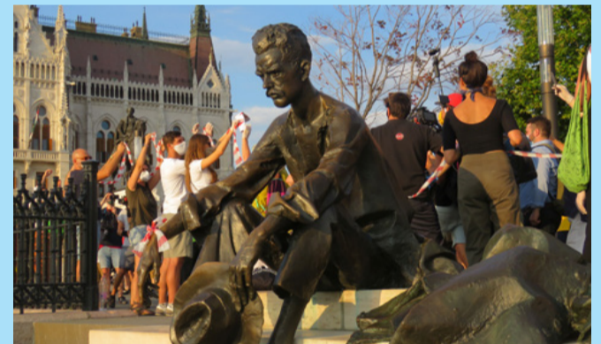
Miközben József Attila szobra szigorúan szemléli a Duna habjait, mögötte kézzel kézzel jár és a Parlamenthez közelít a Színház és Filmművészeti Egyetem chartája. „Enyém a múlt és övék a jelen”

Gigamegmozdulást szerveztek elmúlt vasárnap Budapesten a Színház és Filmművészeti Egyetem (SZE) autonómiájának elvétele ellen tüntetők. A tüntetés sokkal több szimpatizánst vonzott, mint amire a szervezők számítottak. Eredetileg azt tervezték, hogy az egyetem chartáját, több egyetemet is érintve, kézzel adva juttatják el az egyetem Szentkirályi utcai épületétől a Parlamentig, azonban az ehhez szükséges ötezer résztvevőnél annyival többen jöttek el a demonstrációra, hogy sok helyen nem kettes, hanem hármas láncsor alakult ki, nem beszélve az egyes csomópontokon összegyűlt tömegről. Az élőláncban több helyen spontán performanszok dobták fel a hangulatot, zenekarok, sőt artisták is szórakoztatták az utca közönségét.