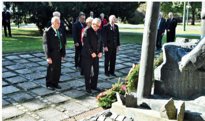
Koszorúzás a Hild-parkban. Főhajtás az elődöknek