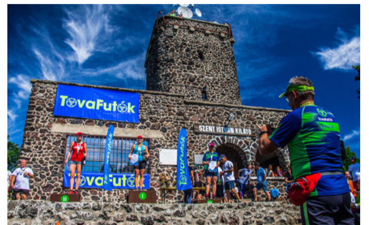
Az eredményhirdetés boldog pillanatai. Száz emelet magasságban