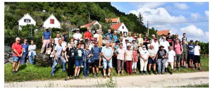
Megemlékezők a Somlón. Megyen a hegyen a turista...