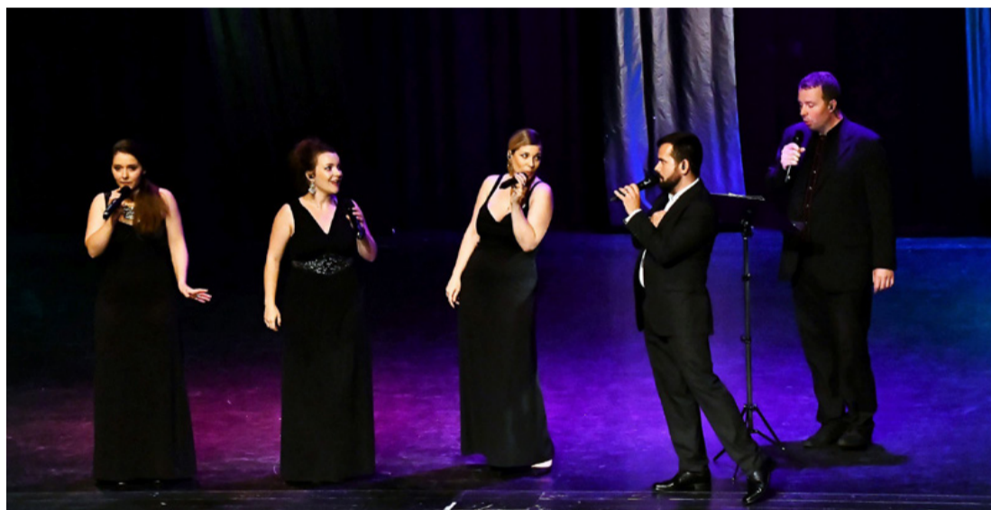
Öten a színpadon. Dalikkal megidéztek az egész világot