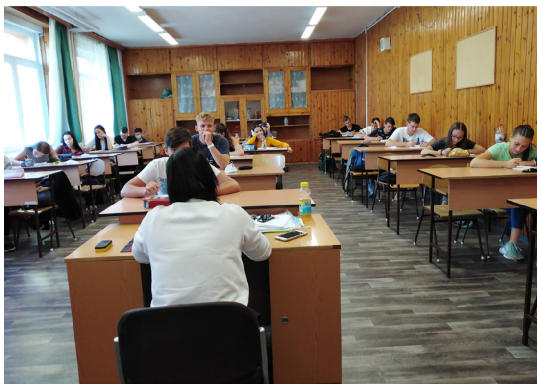
Tanóra a sportgimnáziumi osztályban. Egy pad, egy diák