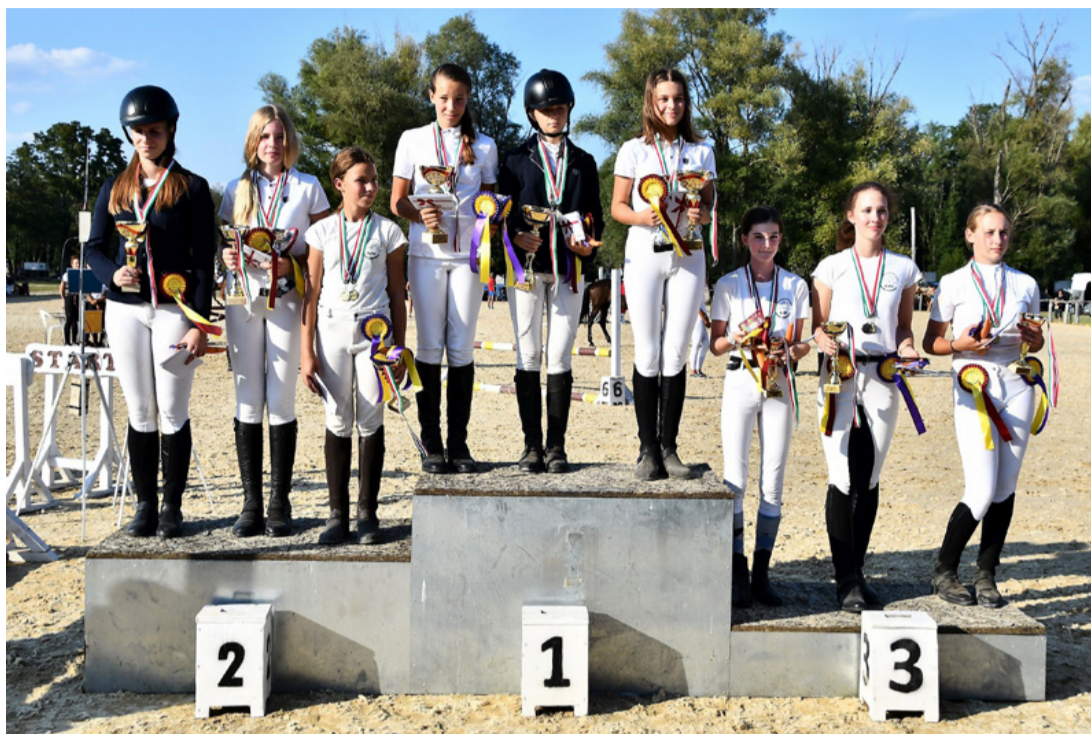
Mindenki nyert valamit. Újra lovas nemzet leszünk?