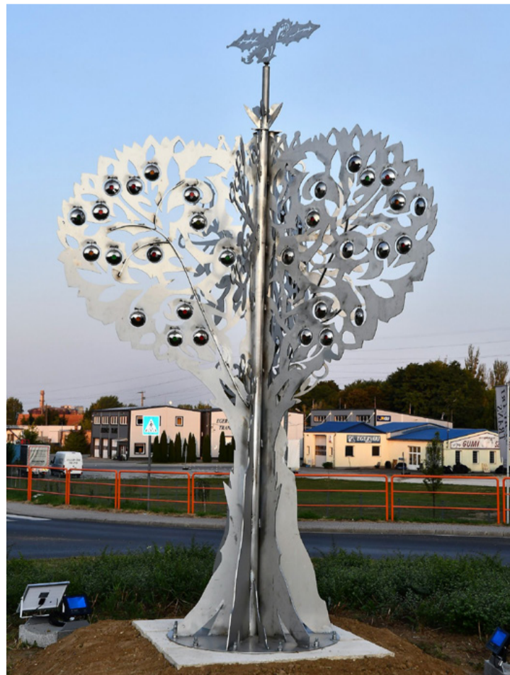
Az életfa fája szoborba álmódva. Érdemes közelebbről is megnézni