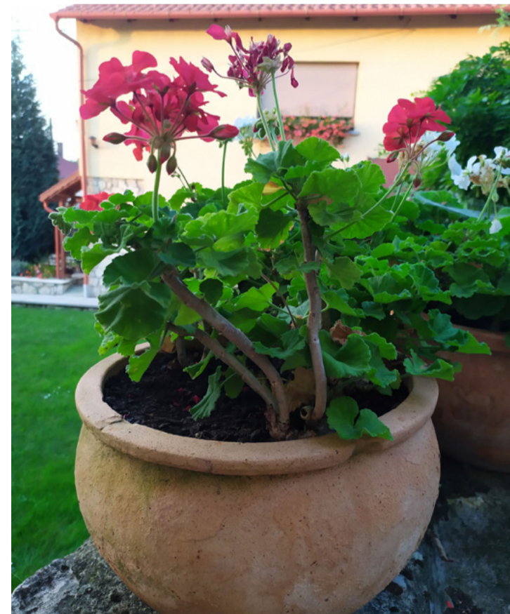
A muskátli kedvelt kerti és balkonnövény. Ősszel szaporítsuk