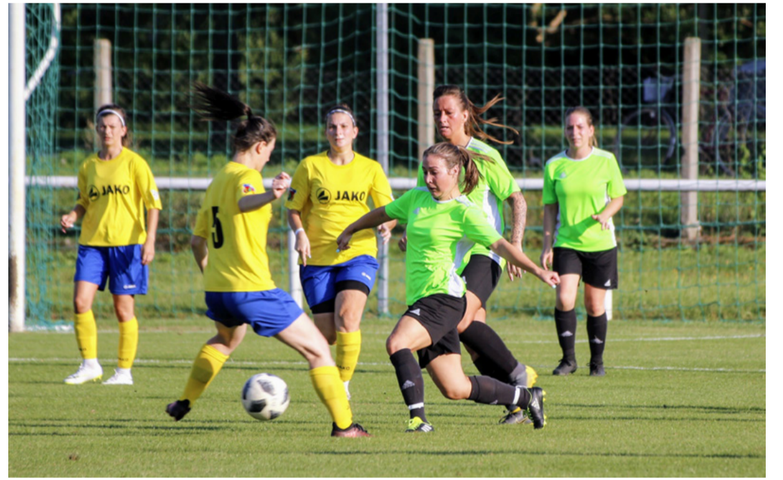
Lendületes meccs volt. A végén csattant az ostor