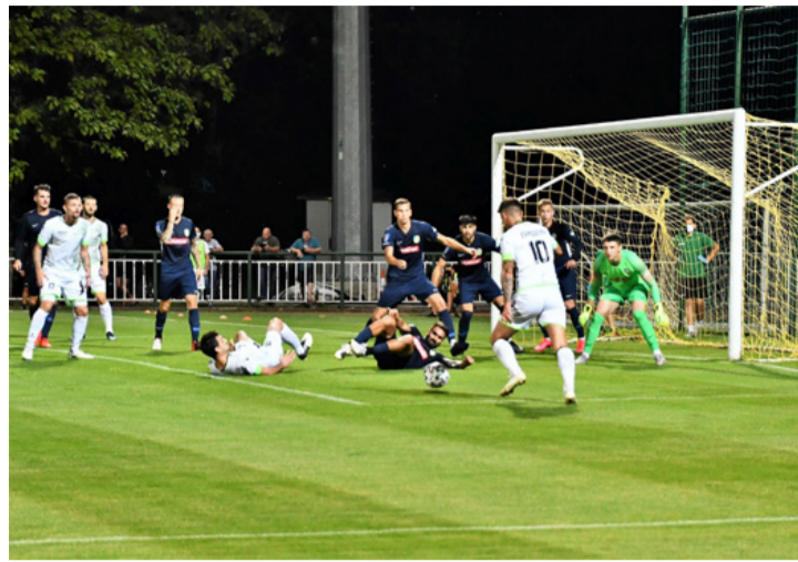
Sakk-matt siófoki védelem. Ez sem lett gól

tott a gólvonalon túlra, 1-1. A hajrában nyomtak a zöld-fehérek, azonban nem sikerült veszélyes helyzetet kialakítani már. FC Ajka- BFC Siófok 1-1.