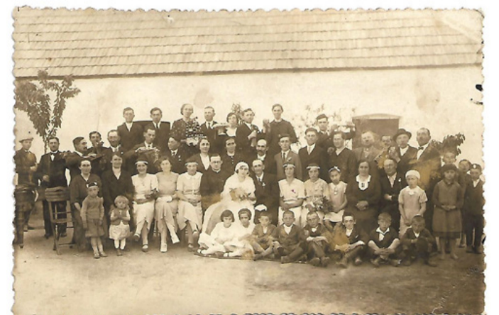
A szervező Tósokberéndért Egyesület

Az új időpontról a későbbiekben fogunk értesítést adni.