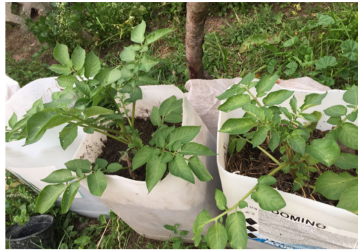
A krumppli jutásában vagy műanyag kannában is jól érzi magát. Eláll digál az erkélyen is

Újkrumpli ingyen? Bizony lehetséges. Olvastam, hogy a háborúban amikor nagy volt az éhínség akkor a gazdák nem egy egész vetőkrumplit raktak a földbe, hanem csak egy kis darab héjat, és abból is lett termés. Mivel szeretek kísérletezni ezért kipróbáltam én is ezt a módszert. Volt egy pár boltban vásárolt burgonyám, ami a pincében már szépen csírázásnak indult. Ezeket kicsit vastagabban meghámozva, a héjat először egy kis virágos ládába tettem, majd vártam a csodát. Nagy várakozással figyeltem, ahogy a kis csírákból zöld növények lettek és szép lassan elkezdtek nőni. Ekkor fogtam pár lenzsákokat és néhány levágott műanyag kannát és átültettem őket úgy, hogy maradjon hely a feltöltéshez.