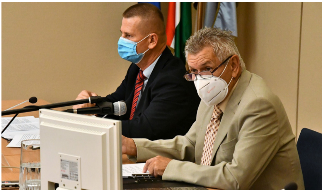
A polgármester rámutatott arra is, hogy csökkentek az adóbevételek, az egyéb elvonásokról nem is szólva. Milliárdos a hiány