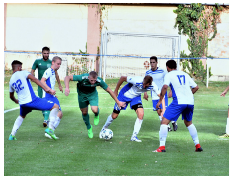
Vendégek Kristály-gyűrűben. Torkukon akadt a Lipóti-kenyér