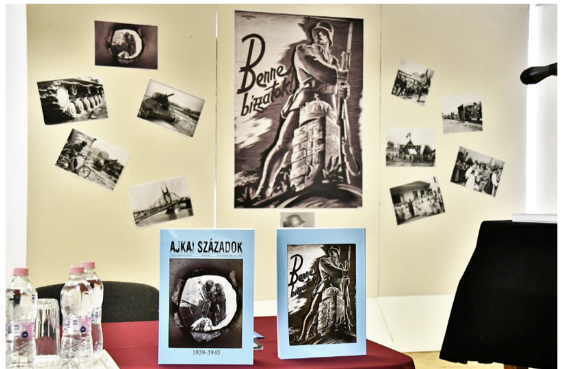
Tabla a bemutató helyszínén. A kiadvány az utolsó lélektani pillanatban készült el