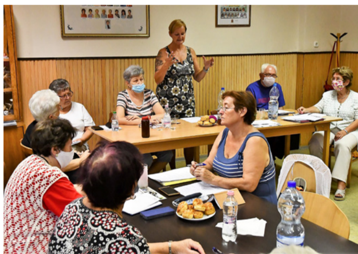
Üléseznek a szépkorúak. Az elnök be- és elszámol

Az országos szövetségben szeptember 14-én tisztújító közgyűlést tartottak, ahol ismét