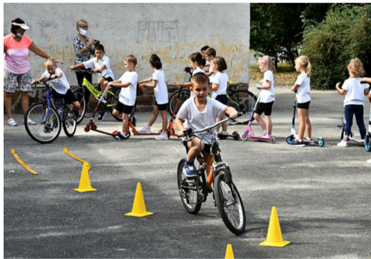
Gyakorlás kicsiben. Élet és halál kérdése a tudás