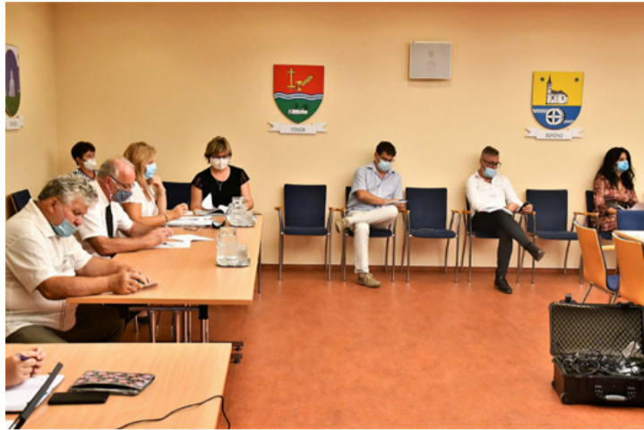
A testületi üléseket a hivatal szakértői is nyomon követik. Vizsgálják az előterjesztők

A képviselő testület egyhangú szavazással fogadta el azt a javaslatot, miszerint csatlakozik ahhoz a pályázathoz, amit az Európai Unió 2020 kutatási és innovációs programja (EUCF) biztosít az unió helyi hatóságai és csoportjaik számára. Az így elnyerhető 60 000 euró lehetővé teszi, hogy az önkormányzatok beruházási koncepciókat dolgozzanak ki az éghajlati és energiaügyi cselekvési tervükben