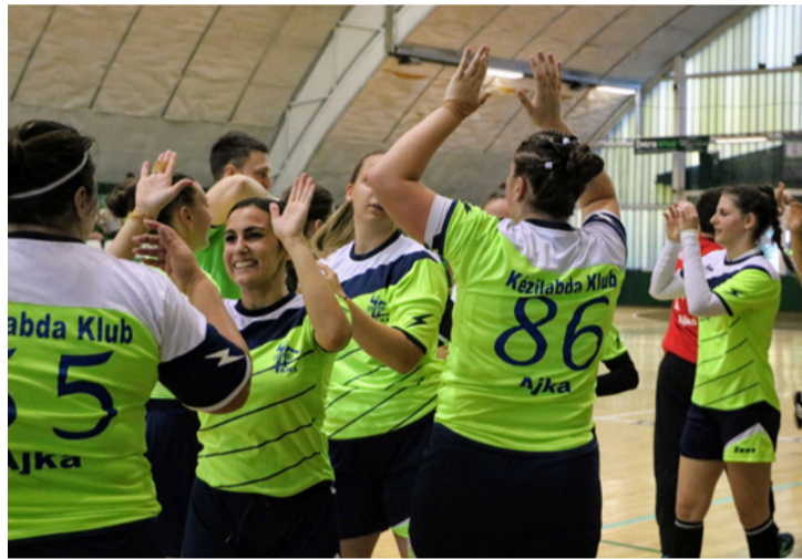
Volt minék örülni. Idegenben is jobbak