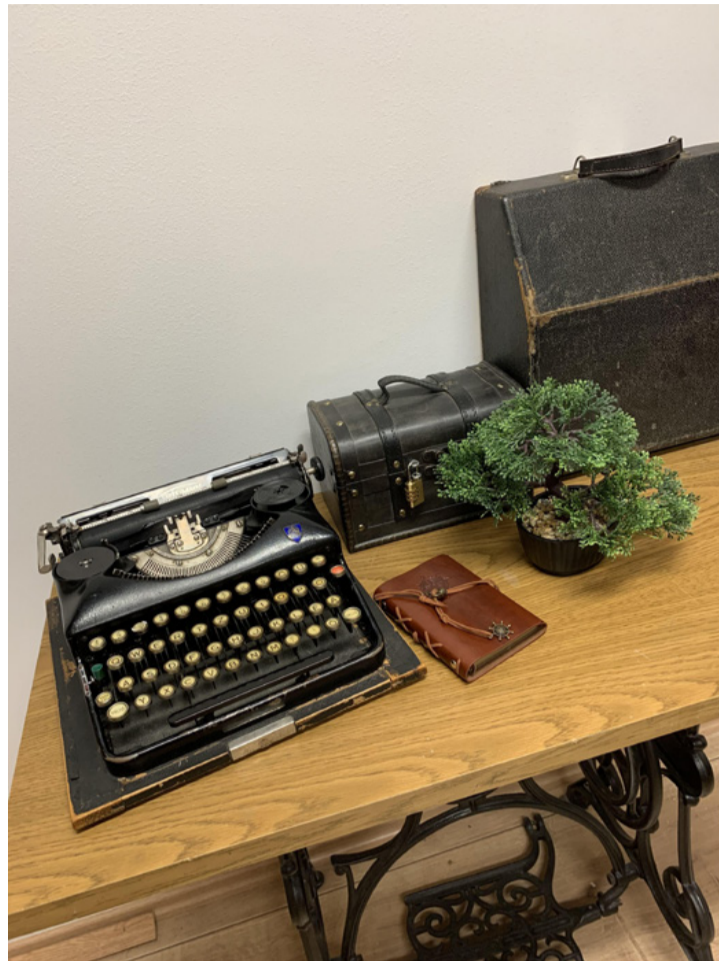
Vajon hol rejlik a talány nyitja, ami a szoba ajtaját is nyitja?

A szoba felfedezését bátran ajánljuk mindenkinek, aki szeretné igazi élménnyel meglepni családját, vagy barátait, hiszen a bent töltött egy óra garantáltan csapatomunkát és együtt gondolkodást igényel, de vidámságból és izgalomból is kijut a vállalkozó szellemű kalandoroknak. Félelmetes elemmel nem kell számolni, így akár családoknak, idősebbeknek is ideális választás lehet időöltésül. Optimálisan 4-5 ember tud egyszerre jól együttműködni bent, viszont az eddigi visszajelzések alapján nem ez a legkönnyebb szoba, ezért aki először készül szabadulósobába, annak ér-