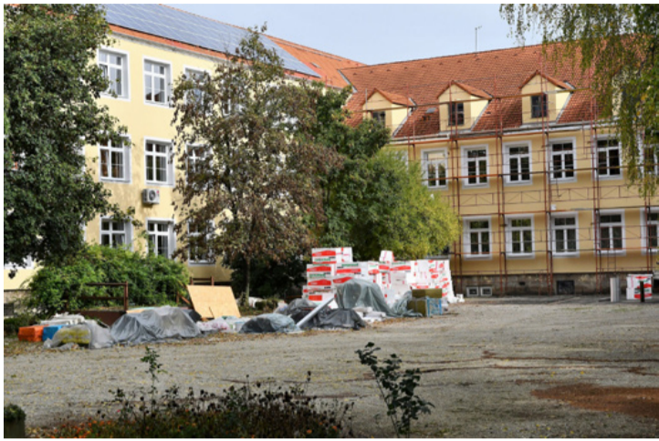
Megújul az épület hőszigetelése is. Melegük lehet az órán

A vírusveszély miatt elmarad az idén a Sulibörze. Lapunk szeretne segítséget nyújtani a pályaválasztás előtt álló nyolcadik osztályos diákoknak, ezért minden ajkai középfokú oktatási intézményt bemutatunk. Sorozatunkat a Bródy Imre Gimnázium bemutatásával folytatjuk.