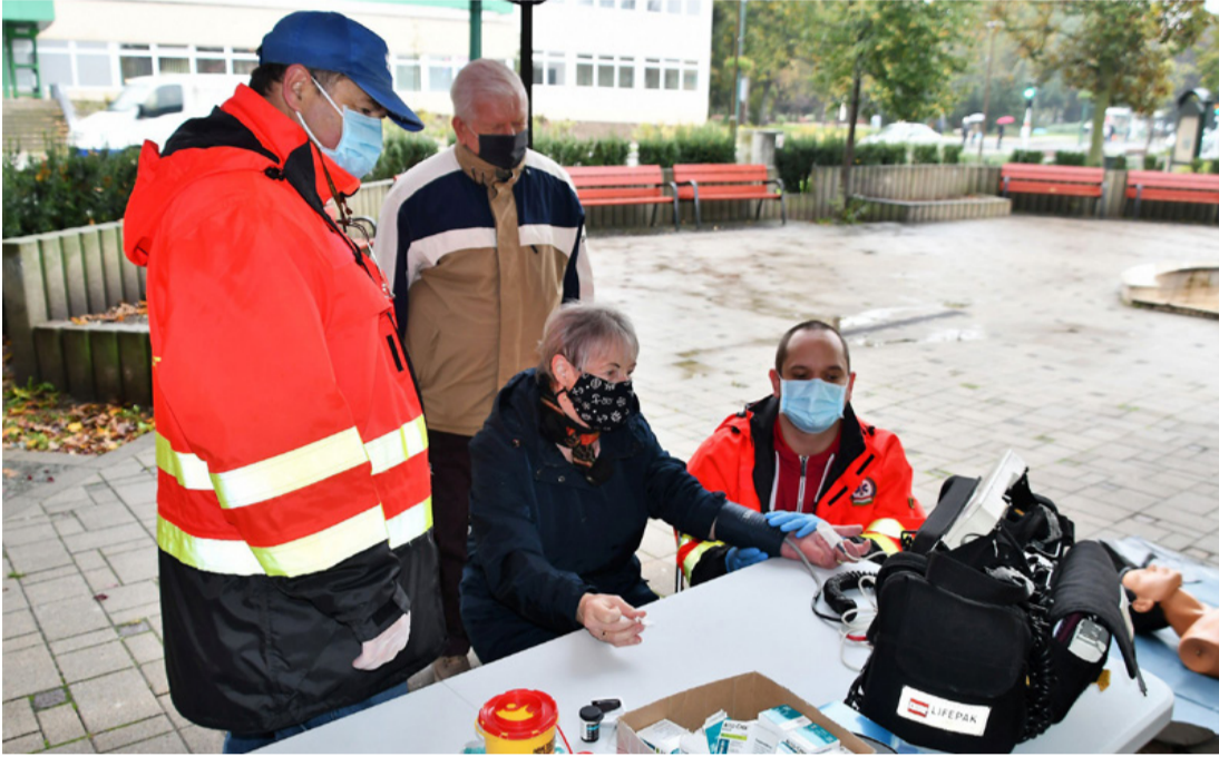
Kitelepülés az újraélesztés világnapján. Középpontban az egészség