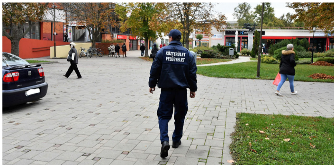
Ne ijedjünk meg, ha szemtől szembe kerülünk velük. Segíteni akarnak