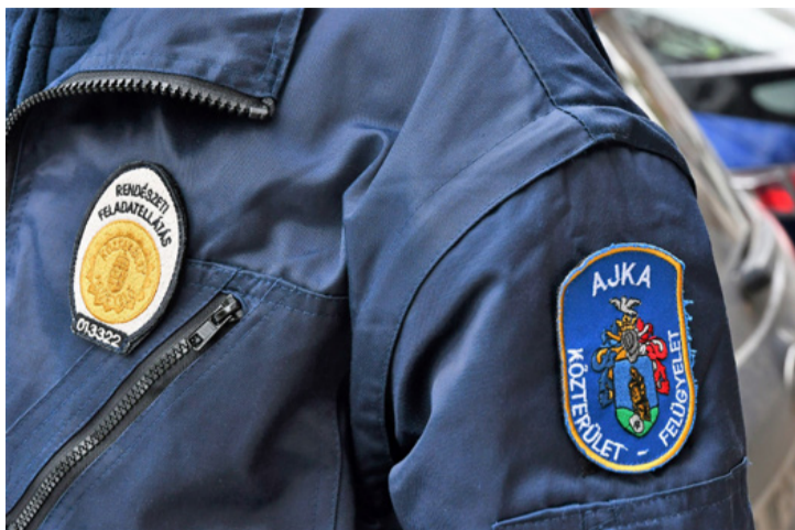
A közterület felügyelők ismertető jelei. Először csak figyelemzetnek