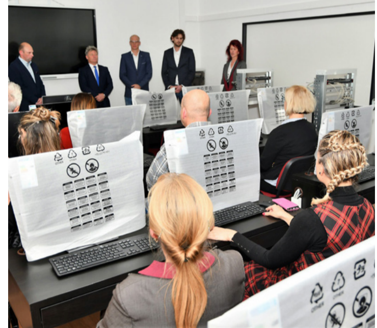
Leleplezés előtt. A munkaalapú társadalomban is fontos az informatika