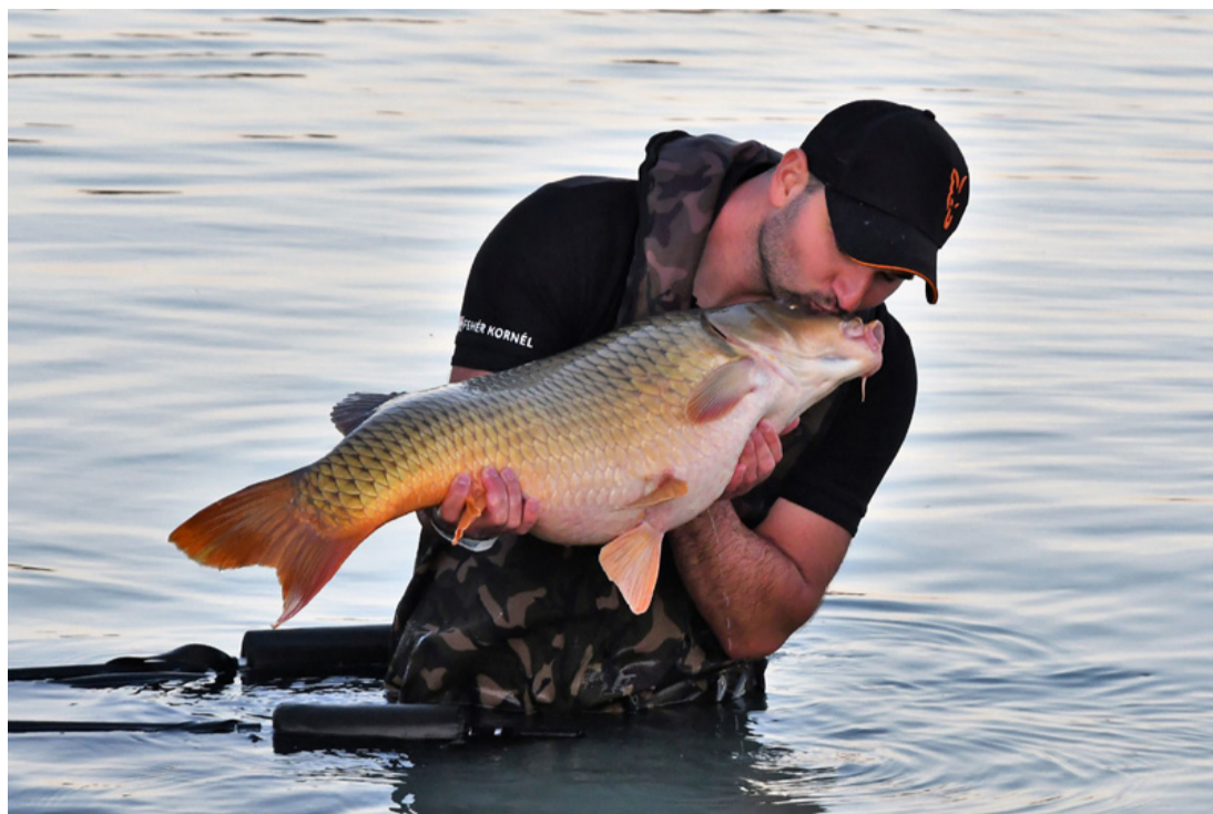
Ugye, te is szeretsz?