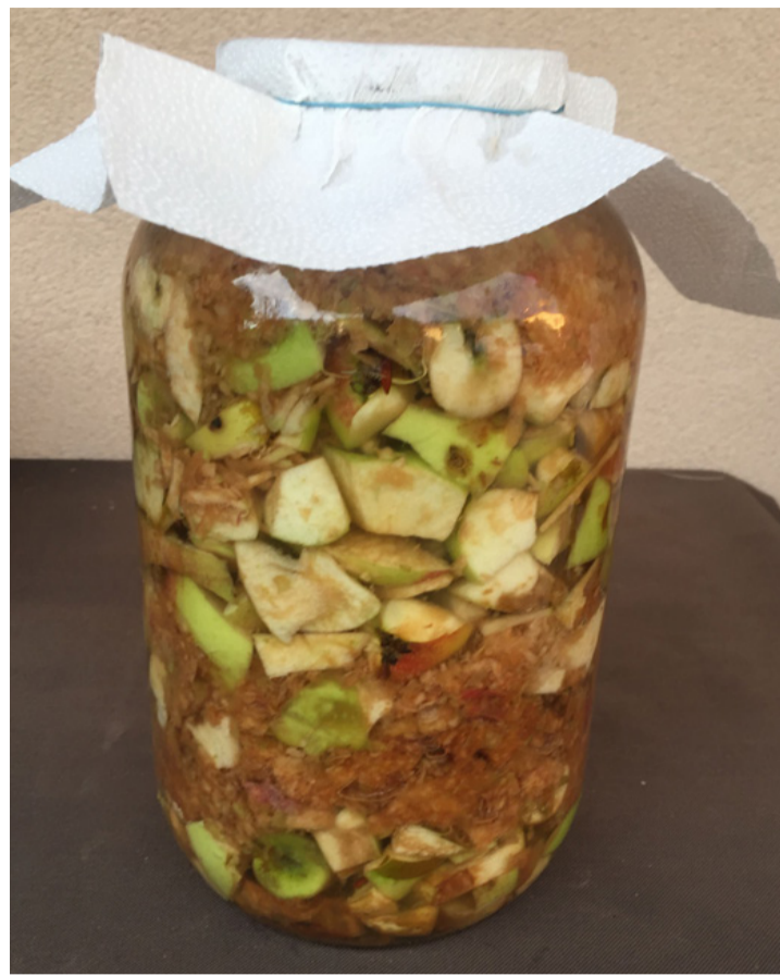
Almaecet erjedés közben. Természetesen jobb, mint a boltban kapható, mert a „miénk”

A nyersfogyasztás mellett még számos módon rakhatjuk el a nyár ízét. Reszelve vagy párolva mélyhűtőbe, lekvárnak kifőzve, kompótnak, ivólének elkészítve. Általában a legnagyobb gondot az szokta okozni, hogy mit csináljunk a sok hullott almából. Idén talán a hirtelen jött viharos időjárásnak köszönhetően a mi kertünkben is sok alma kötött ki a földön. Ekkor jött az ötlet, hogy almaecetet készítünk belőlük. Érdekes, hogy bár a nevében benne van, hogy ecet, és ahogyan a citrom is, savas kémhatású, mégis fogyasztása lúgosítja a szervezetet, mert az almaecetben lévő kémiai elemek segítik a lúgok termelődését. Az almaecet a természet csodaszere, ami nem hiányozhat a házi gyógyszereink közül, és nem szükséges hozzá